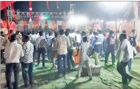
विवाह समारोह में हंगामे के दौरान बड़ी संख्या में मेहमान।

शुक्रवार को रामनाथ की डेयरी, छोटी बमनपुर, जीजीआईसी में सुबह नौ से दोपहर तीन बजे तक एक फेस न आने से छह घंटे