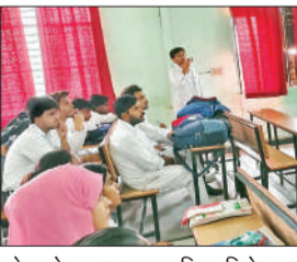
ओरल हेल्थ जागरूकता विषय विशेष व्याख्यान में शामिल छात्र-छात्राएं।

गिरे हुए दांतों का कृत्रिम पुनर्निर्माण बरेली, अमृत विचार : दांत खोना केवल सुन्दरता की समस्या नहीं, बल्कि मुंह की पूरी सेहत पर गहरा असर डालता है। इंस्टीट्यूट ऑफ डेन्टल साइंसिस के विशेषज्ञों के अनुसार दांत खोने के बाद सबसे पहले विपरीत दांत अपनी जगह से नीचे या ऊपर की ओर सुझा-एरेशन कर जाते हैं। मतलब, वे असामान्य रूप से लंबे हो जाते हैं और टीथर से चबाने में बाधा डालते हैं। खाली जगह में बगल के दांत धीरे-धीरे सरक जाते हैं। इससे दांतों के बीच का संपर्क बिगड़ जाता है। दांतों के बीच गप होने से भोजन के कण फंस जाते हैं, जो कैविटी का कारण बनते हैं। खोये हुए दांतों को बदलने से यह सब रोका जा सकता है। ब्रिज, इम्प्लॉंट या बत्तीसी से खाली जगह भरने पर बाकी प्राकृतिक दांत स्वस्थ रहते हैं। डॉक्टरों का कहना है कि जल्दी रिहैबिलिटेशन से 80 प्रतिशत तक अन्य दांतों की सेहत बची रहती है।