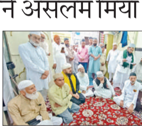
फतेहख्वानी में जुटे अकीदतमंद।