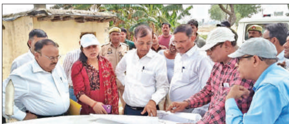
भमौरा क्षेत्र में इंडस्ट्रियल कॉरिडोर के लिए चिह्नित की गयी भूमि का स्थलीय निरीक्षण कर नक्शा देखते यूपीडा के अधिकारी।