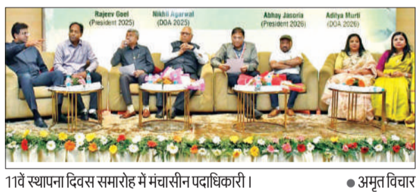
11वें स्थापना दिवस समारोह में मंचासीन पदाधिकारी।