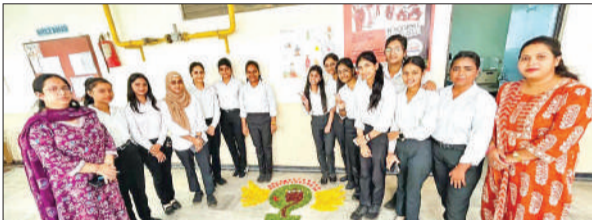
रंगोली कार्यक्रम में उपस्थित छात्रा और शिक्षिकाएं।