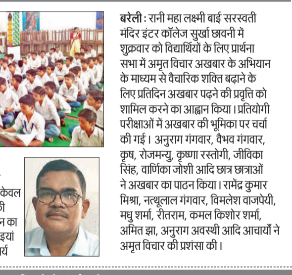
अगर आप भी जुड़ना चाहते हैं इस मुहिम से तो संपर्क करें - editorschoice@amritvichar.com