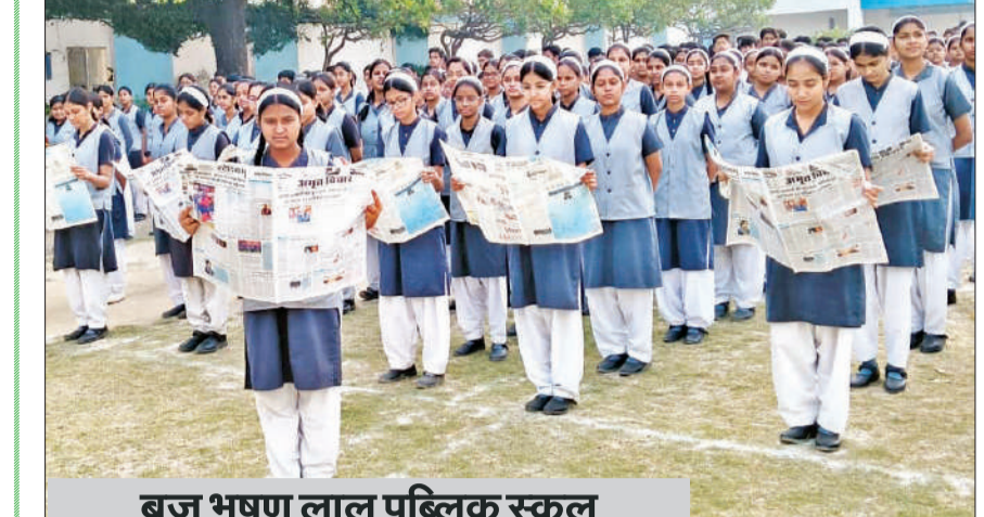
बृज भूषण लाल पब्लिक स्कूल