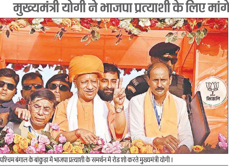
पश्चिम बंगाल के बांकुड़ा में भाजपा प्रत्याशी के समर्थन में रोड शो करते मुख्यमंत्री योगी।