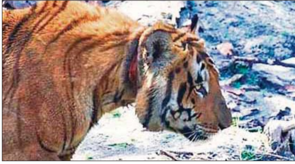
घायल बाघ की तस्वीर, जिसे सोशल मीडिया पर वायरल किया।

जानकारी के अनुसार बीती 14 अप्रैल को बराही रेंज के निर्धारित सफारी रूट पर कुछ सैलानी भ्रमण कर रहे थे। इसी दौरान उन्हें झाड़ियों के पास एक बाघ दिखाई दिया, जिसकी गर्दन पर गहरे जखम दिखाई दे रहा था, जोकि फंदे से घायल होने जैसा लग रहा था। सैलानियों ने