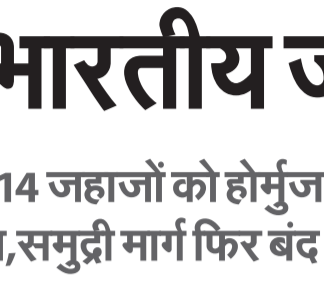
नई दिल्ली/काहिरा, एजेंसी

तेल और गैस की खोज को डेटा आधारित करने की दिशा में बढ़ा भारत: पुरी - 10