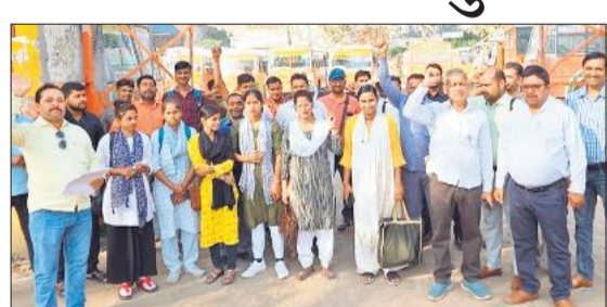
गोला में रोडवेज डिपो पर प्रदर्शन करते कर्मचारी।