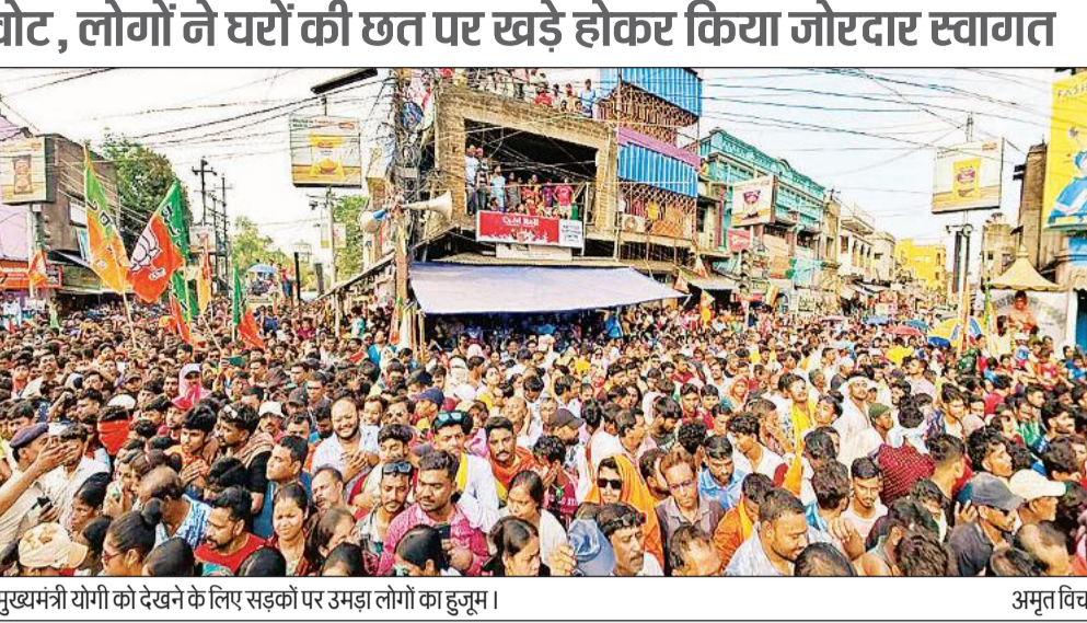
मुख्यमंत्री योगी को देखने के लिए सड़कों पर उमड़ा लोगों का हुजूम।