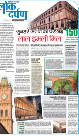
सुनहरे अतीत की परछाईं लाल इमली मिल