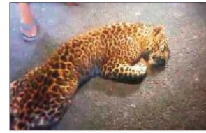
सड़क पर पड़ा तेंदुआ का शव।

घटना ट्रांस शारदा क्षेत्र में नेहरू नगर से भुरजनिया जाने वाले मार्ग पर शुक्रवार रात हुई। मार्ग से गुजर रहे कुछ ग्रामीणों ने सड़क पर एक मादा तेंदुआ का शव पड़ा देखा। तेंदुआ का