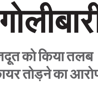
नई दिल्ली, एजेंसी

इराक से 20 लाख बैरल तेल लेकर निकला था जहाज