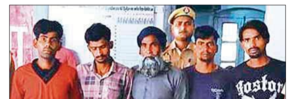
गैस सिलेंडर लेने के दौरान हुई मारपीट में पकड़े गए आरोपी।