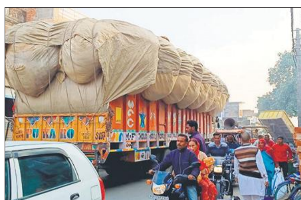
निधासन में ओवरलॉड भूसी भरे ट्रक से लगा जाम।

गन्ना सीजन खत्म होने के बावजूद भी जाम की समस्या जस की तस बनी हुई है। मुख्य चौराहे से लेकर कस्बे के अधिकांश मार्गों पर दिनभर वाहनों की भीड़