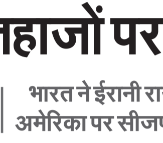
नई दिल्ली

एआईसे घबराएं नहीं सतर्कता के साथ इस्तेमाल करें: सीजेआई -11