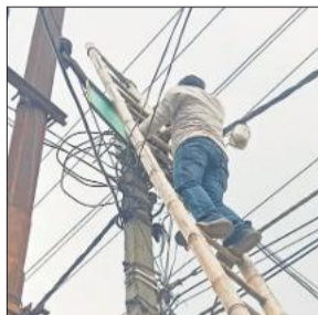
तालों को गुच्छे में फाल्ट तलाशता विद्युत्कर्मि।

अमृत विचार : बढ़ती गर्मी के साथ बिजली व्यवस्था पर दबाव बढ़ गया है। एसी, कूलर और फ्रिज के अधिक इस्तेमाल से ट्रांसफार्मर ओवरलोड होकर फुंकरने लगे हैं। सुबह, दोपहर और शाम को कटौती भी बढ़ गई है। बीते 17 दिनों में जिले में 24 ट्रांसफार्मर जल चुके हैं, जिनमें शहर के पांच और ग्रामीण क्षेत्र के 19 ट्रांसफार्मर शामिल हैं।