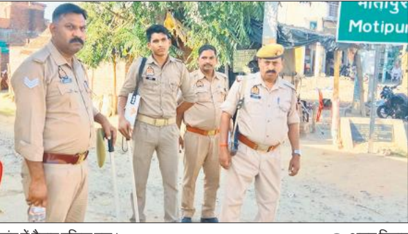
गांव में तेनात पुलिस बल।

अमृत विचार IMPACT ● निर्दोष ट्रक चालक को राहत बाकी नामों की तस्दीक जारी