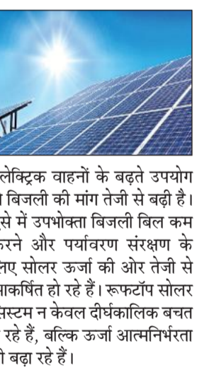
इलेक्ट्रिक वाहनों के बढ़ते उपयोग से बिजली की मांग तेजी से बढ़ी है। ऐसे में उपभोक्ता बिजली बिल कम करने और पर्यावरण संरक्षण के लिए सोलर ऊर्जा की ओर तेजी से आकर्षित हो रहे हैं। रूफटॉप सोलर सिस्टम ने केवल दीर्घकालिक बचत दे रहे हैं, बल्कि ऊर्जा आत्मनिर्भरता भी बढ़ा रहे हैं।

● पीएम सूर्य घर योजना ● सूरत को पछाड़कर बनाया राष्ट्रीय रिकॉर्ड ● रूफटॉप संयंत्रों की कुल संख्या 87 हजार के पार चुके हैं, जो किसी भी जिले में सबसे अधिक हैं। वहीं 15 अप्रैल तक चालू वित्तीय वर्ष में 3,133 नए संयंत्र लगाए गए हैं, जिससे लखनऊ ने सोलर अपनाने में नया राष्ट्रीय रिकॉर्ड बनाया है। जो कि अभी तक सूरत के नाम था। विशेषज्ञों के मुताबिक, शहरी क्षेत्रों में इंडकशन कुकटॉप और