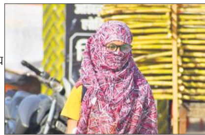
शहर में भीषण तपिश के कारण कुछ इंस तरह निकली युवतियां।

लखीमपुर खीरी। जिले में शनिवार को गर्मी ने अपना असर तेज कर दिया। दिनभर तेज धूप और गर्म हवाओं के चलते अधिकतम तापमान 40 डिग्री सेंटीग्रेड तक पहुंच गया, जिससे शनिवार को भी लोगों का गर्मी से बुरा हाल रहा। सुबह से ही तेज धूप के साथ मौसम साफ रहा और दोपहर होते-होते तेज गर्म हवाओं के साथ गर्मी का असर और बढ़ गया। दिन के समय करीब 15 किलोमीटर प्रति घंटे की रफ्तार से गर्म हवाएं चलीं, जिससे हालात और ज्यादा असहज हो गए। सड़कों और बाजारों में दोपहर के समय सन्नाटा देखने को मिला, जबकि लोग जरूरी कार्यों तक ही सीमित रहे। तेज धूप और लू जैसी परिस्थितियों के चलते बाहर निकलना मुश्किल हो गया। खुले स्थानों पर काम करने वाले मजदूर, रिक्षा चालक और राहगीर सबसे ज्यादा प्रभावित रहे। लगातार चल रही गर्म हवाओं के कारण लोगों को राहत नहीं मिल सकी। वहीं बिजली और पानी की बढ़ती मांग ने भी लोगों की परेशानी बढ़ा दी। डॉक्टरों का कहना है कि के इतने गर्म गर्मी में लू लगने का खतरा बढ़ जाता है। लोगों को दोपहर के समय घर से बाहर निकलने से बचने, सिर ढककर चलने और पर्याप्त पानी पीने की सलाह दी गई है।