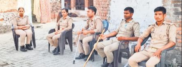
गांव रूपनपुरवा में तैनात पुलिस।