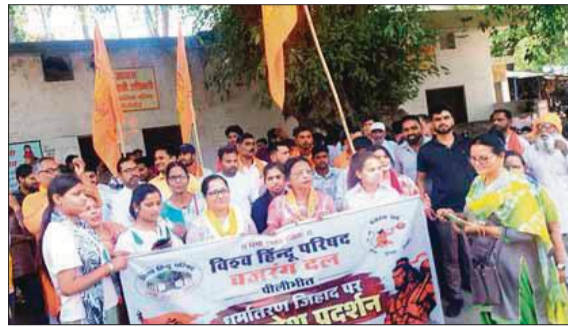
नकदादना चौराहा पर प्रदर्शन करते विहिप बजरंगदल कार्यकर्ता। ● अमृत विचार

धर्मांतरण, जिहाद समेत कई बिंदुओं पर विश्व हिंदू परिषद-बजरंगदल ने किया प्रदर्शन