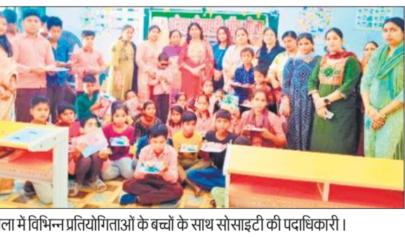
गोला में विभिन्न प्रतियोगिताओं के बच्चों के साथ सोसाइटी की पदाधिकारी।