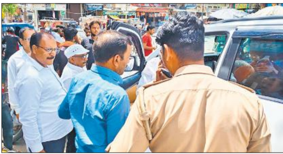
मैंगलगंज में पूर्व सांसद का घेराव करते व्यापारी व ग्रामीण।