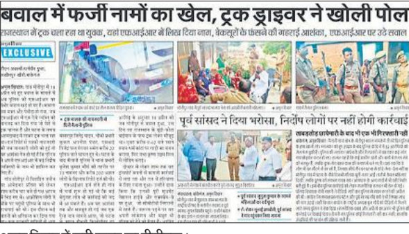
अमृत विचार में छपी खबर का पीडीएफ।

संवाददाता, लखीमपुर खीरी/ बांकेगंज अमृत विचार: मोतीपुर गांव में 14 अप्रैल को हुए बवाल के बाद दर्ज की गई एफआईआर अब पुलिस के लिए ही मुसीबत बनती जा रही है। राजस्थान में ट्रक चला रहे एक ड्राइवर का नाम एफआईआर में आने का अमृत विचार में खुलासा होने के बाद पुलिस बैकफुट पर आ गई है और अब सफाई देने में जुटी है। हालांकि पुलिस का कहना है कि उसका नाम तस्दीक कर एफआईआर से हटाने की कार्रवाई की जा रही है। खससबात यह है कि पुलिस की तरफ से बवालियों के खिलाफ दर्ज की गई एफआईआर में नामों और पत्तों को लेकर बड़ी गड़बड़ी सामने आई है, जिससे पुलिस की एफआईआर की निष्पक्षता पर सवाल उठने लगे हैं। घटना के बाद पुलिस ने 73