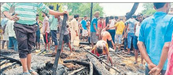
आग बुझाने के बाद जला सामान देखते ग्रामीण।