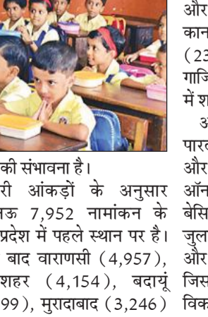
बढ़ने की संभावना है। जारी आंकड़ों के अनुसार लखनऊ 7,952 नामांकन के साथ प्रदेश में पहले स्थान पर है। इसके बाद वाराणसी (4,957), बुलंदशहर (4,154), बदायूं (3,599), मुरादाबाद (3,246)

राज्य ब्यूरो, लखनऊ अमृत विचार: प्रदेश में शिक्षा का अधिकार (आरटीई) अधिनियम के तहत गरीब और वंचित परिवारों के बच्चों को गुणवत्तापूर्ण शिक्षा दिलाने की दिशा में बड़ा बदलाव देखने को मिल रहा है। योगी आदित्यनाथ सरकार की पहल से वर्ष 2026-27 के लिए अब तक 1,03,439 बच्चों का निजी स्कूलों में नामांकन सुनिश्चित किया जा चुका है। अभी नामांकन प्रक्रिया जारी है, ऐसे में आने वाले समय में यह संख्या और