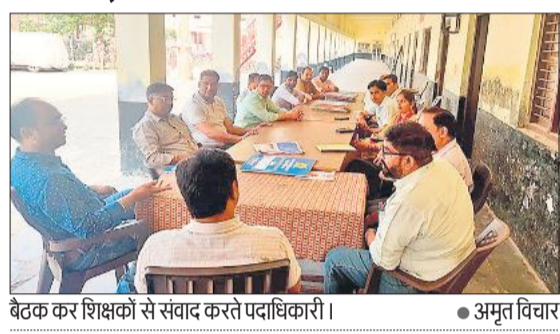
बैठक कर शिक्षकों से संवाद करते पदाधिकारी।