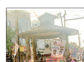
शहीद भगत सिंह की प्रतिमा के लगे पोस्टर।

अमृत विचार। शहर के मुख्य चौराहे पर स्थित भगतसिंह की प्रतिमा प्रशासनिक अनदेखी और व्यावसायिक होड़ का शिकार हो गई है। आलम यह है कि चारों तरफ लगे बड़े-बड़े होर्डिंग्स और बैनरों के बीच शहीद की प्रतिमा पूरी तरह से दब चुकी है। चौराहे के सौंदर्यकरण और शहीदों के सम्मान के लंबे-चौड़े दावों के बीच जमीनी हकीकत कुछ और ही बर्था कर रही है। प्रतिमा के ठीक सामने और आल-बाल निजी कंपनियों और राजनीतिक दलों के प्रचार वाले होर्डिंग्स इस कदर लगाए गए हैं कि दूर से देखने पर यह पहचानना भी मुश्किल है कि यहां