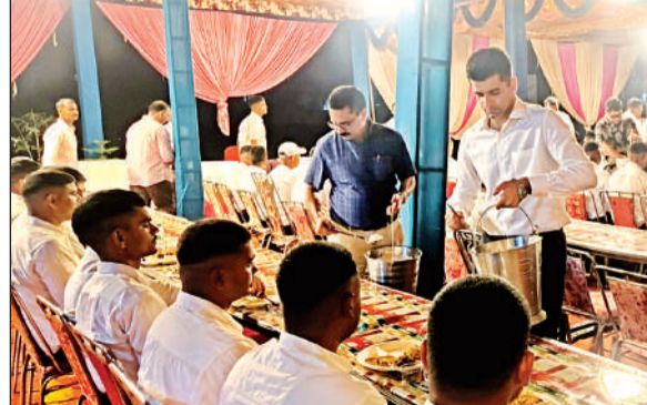
बड़ाखाना कार्यक्रम में रिक्रूट आरक्षियों को भोजन परोसते अधिकारी।