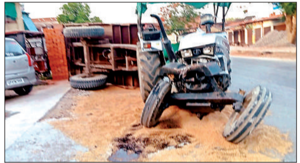
डंपर की टक्कर से क्षतिग्रस्त ट्रैक्टर ट्राली और सड़क पर फैला गेहूं। अमृत विचार