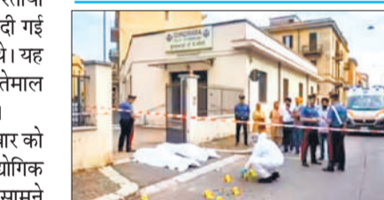
घटनास्थल पर जांच करती कोवो शहर की पुलिस।

घटनास्थल से लगभग 10 कारतूस बरामद किए गए हैं और अधिकारी सुनिश्चित हत्या की संभावना को ध्यान में रखकर जांच कर रहे हैं। एक प्रत्यक्षदर्शी ने बताया कि गोली चलाने वाला भी एक भारतीय था जो अक्सर गुरुद्वारे में आता-जाता था।