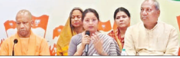
प्रेस कॉन्फ्रेंस में केंद्रीय मंत्री अन्नपूर्णा देवी, मुख्यमंत्री योगी व अन्य।