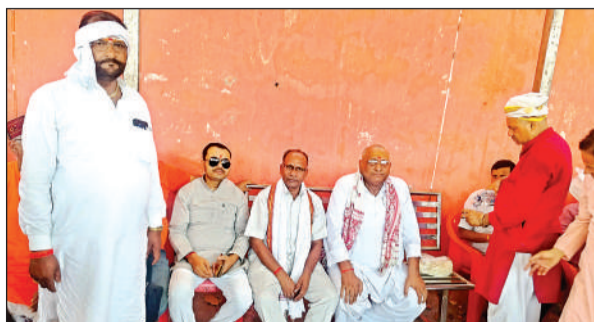
आश्रम परिसर में धरने पर बैठे पूर्व सांसद, पूर्व भाजपा जिलाध्यक्ष व अन्य।

माना जा रहा है कि इसी से बौध्दालाकर महंत ने पूर्व सांसद और उनके परिवार के बुजुर्गों के प्रति ऐसी बातें कह दीं, जिसे सभ्य समाज में कतई बर्दाश्त नहीं किया