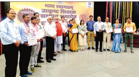
शिक्षक का किया गया सम्मान।

कारण बनता है। उन्होंने बताया कि टीबी के प्रमुख लक्षण दो सप्ताह से अधिक खांसी, वजन कम होना, बुखार, सीने में दर्द, शरीर में गांठ, रात में पसीना आना, थकान और बलगम में खून आना दिखने पर तुरंत जांच करानी चाहिए। स्वास्थ्य विभाग ने स्पष्ट किया कि जनपद के सभी सरकारी अस्पतालों में टीबी की जांच व उपचार पूरी तरह नि:शुल्क उपलब्ध है। मरीजों को दवाइयों के साथ-साथ पोषण सहायता भी प्रदान की जा रही है। अभियान के अंतर्गत ग्रामीण व शहरी क्षेत्रों में घर-घर संपर्क, सामुदायिक जागरूकता कार्यक्रम, और सार्वजनिक स्थलों पर स्क्रीनिंग कैंप आयोजित किए जा रहे हैं। आशा एवं आंगनबाड़ी कार्यकर्ता भी इसमें सक्रिय भूमिका निभा रही हैं। स्वास्थ्य विभाग ने आमजन से अपील की है कि टीबी के लक्षण दिखने पर देरी न करें और नजदीकी स्वास्थ्य केंद्र पर जाकर जांच अवश्य कराएं।