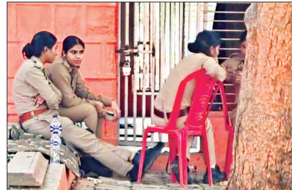
महंत के कमरे में बंद ताला, मौजूद महिला आरक्षी।

जो रिपोर्ट दर्ज की गई है, उसमें महंत का नाम नहीं है। रिपोर्ट लालापूर में स्थित वाल्मीकि आश्रम के कथित साधु नाम पता अज्ञात करके लिखी गई है। इस संबंध में पूर्व सांसद भैरों प्रसाद मिश्रा का कहना था कि उन्होंने जो तहरीर दी थी, उसमें बाबा का नाम था।