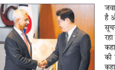
जयशंकर ने किया ली जे का स्वागत।

उत्तर कोरिया ने रविवार को समुद्र की ओर कम दूरी की कई बैलिस्टिक मिसाइलें दागीं। ये प्रक्षेपण दक्षिण कोरिया के राष्ट्रपति ली जे म्युंग के भारत और वियतनाम की यात्रा के लिए रवाना होने से कुछ घंटे पहले किए गए। उत्तर कोरिया के मिसाइल परीक्षणों पर जापान और दक्षिण कोरिया ने कड़ी आपत्ति जताई है। दक्षिण कोरिया ने राष्ट्रीय सुरक्षा परिषद की बैठक में भी इन परीक्षणों पर चिंता जताई है। दक्षिण कोरिया के ज्वाइंट चीफ्स ऑफ स्टाफ (जेसीएस) के मुताबिक उत्तर