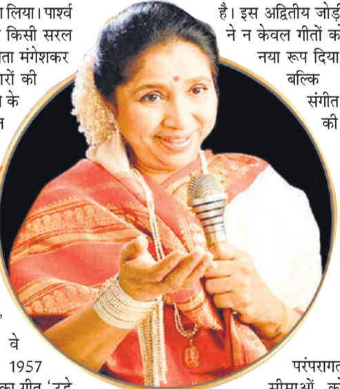
परंपरागत सीमाओं को भी तोड़ डाला। 'पिया तू अब तो आजा' और 'दम मारो दम' जैसे गीतों ने आशा जी को 'कैबरे क्वीन' के रूप में स्थापित कर दिया। उनकी आवाज में जो मादकता, ऊर्जा और आधुनिकता थी, उसने भारतीय संगीत में पश्चिमी प्रभाव को एक नया आयाम दिया। हालांकि 'दम मारो दम' को लेकर उस समय काफ़ी विवाद हुआ। इसे 'अश्लील' कहकर आलोचना झेलनी पड़ी, यहां तक कि ऑल इंडिया रेडियो ने इस पर प्रतिबंध लगा दिया और दूरदर्शन ने फिल्म से इसे हटा दिया। फिर भी, आशा जी की आवाज ने इस गीत को अमर बना दिया। दिलचस्प यह है कि जहां एक ओर वे कैबरे और पॉप की पहचान बन रही थी, वहीं 'इजाजत' के 'मेरा कुछ सामान' में उन्होंने गहन भावनाओं की ऐसी अभिव्यक्ति दी, जो उनकी असाधारण बहुमुखी प्रतिभा को सिद्ध करती है।

1970 का दशक हिंदी सिनेमा में संगीतात्मक प्रयोगों का स्वर्णिम काल था और इसी दौर में आशा भोंसले को मिला उनका सबसे सशक्त रचनात्मक साथी 'आर.डी. बर्मन', जिन्हें प्यार से 'पंचम' कहा जाता है। इस अद्वितीय जोड़ी ने न केवल गीतों को नया रूप दिया, बल्कि संगीत की