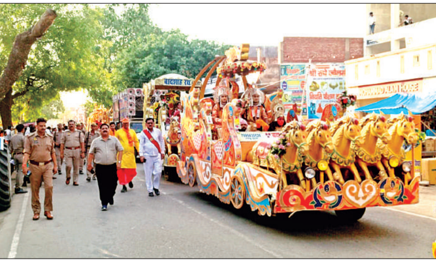
मौदहा कस्बे में रविवार को भगवान परशुराम जयंती पर शोभायात्रा निकालते लोग।