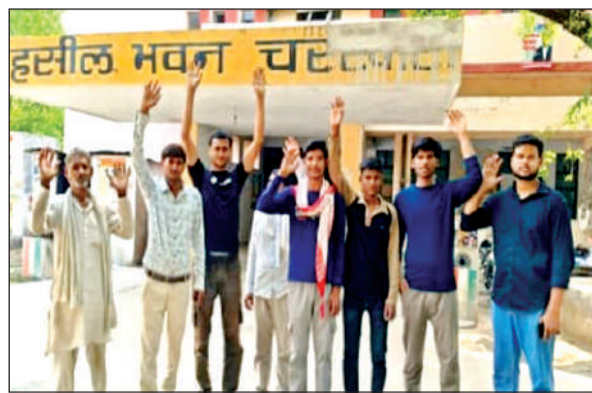
चरखारी तहसील में प्रदर्शन करते बिजली उपभोक्ता।