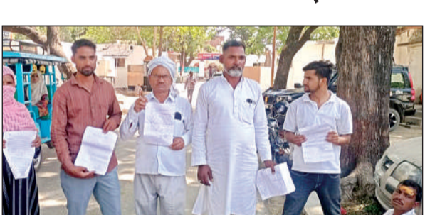
गुरसहायगंज कोतवाली के बाहर खड़े ठगे गए लोग