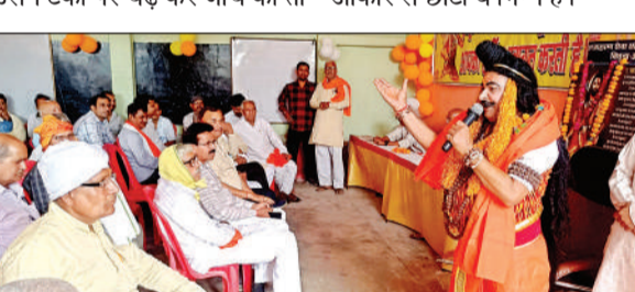
बिधुना में कार्यक्रम को संबोधित करते परशुराम के चरित्र कलाकार।