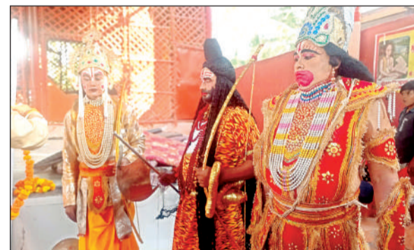
शोभायात्रा में शामिल भगवान के स्वरूपों की झांकी।