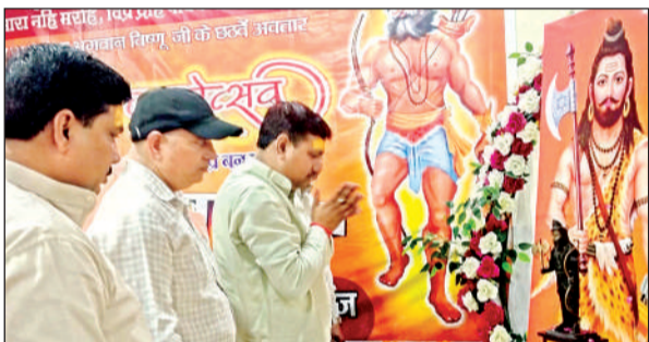
गुरसहायगंज में भगवान परशुराम के चित्र पर फूलमाला चढ़ाते लोग।