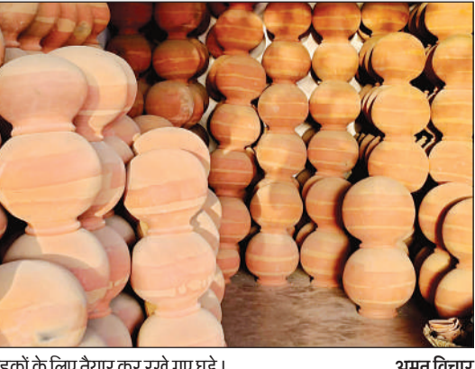
ग्राहकों के लिए तैयार कर रखे गए घड़े।

अमृत विचार। भीषण गर्मी की शुरुआत के साथ ही जहां कभी गांवों और कस्बों के बाजार मिट्टी के मटकों से सजा करते थे, वहीं आज बाजार सूने नजर हैं। कभी हर चौराहे पर कुम्हार अपने मटके, सुराही और घड़े लेकर बैठते थे और लोग ठंडे पानी के लिए इन्हें खरीदने उमड़ पड़ते थे, लेकिन अब आधुनिक उपकरणों की चमक में इनकी पहचान और महत्व खत्म होता जा रहा है।