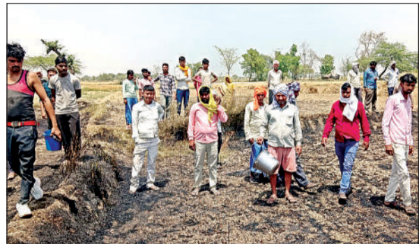
मौके पर मौजूद लोगों की भीड़।