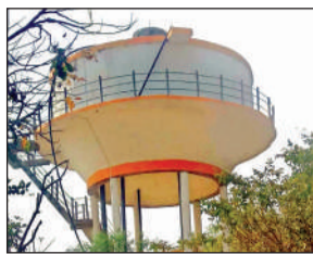
गांव में बनी पानी की टंकी।

है। हर घर जल योजना के तहत पाइप लाइन तो बिछाई गई, लेकिन कई स्थानों पर पाइपों में टोटियां तक नहीं लगाई गई हैं। वहीं सड़कों की खुदाई के बाद उन्हें सही तरीके से दुरुस्त भी नहीं किया गया, जिससे ग्रामीणों को जहां एक तरफ पानी की समस्या से जूझना पड़ रहा