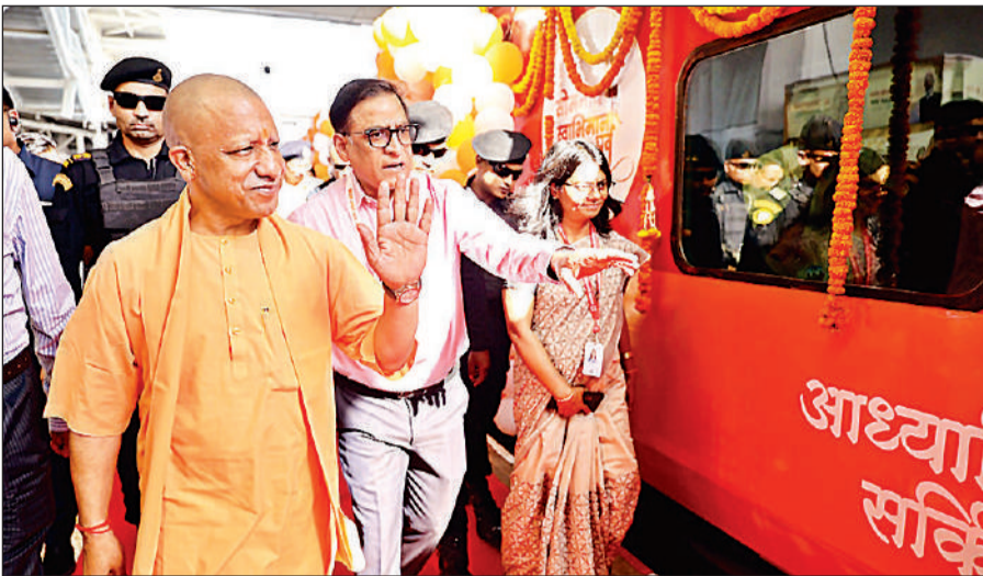
लखनऊ के गोमतीनगर रेलवे स्टेशन से सोमनाथ स्वाभिमान यात्रा के तहत यात्रियों को विशेष ट्रेन से रवाना करते मुख्यमंत्री योगी।

सीएम योगी ने कहा कि प्रधानमंत्री नरेंद्र मोदी के नेतृत्व में सांस्कृतिक पुनर्जागरण नई ऊंचाइयों पर पहुंच रहा है। अयोध्या में राम मंदिर, काशी विश्वनाथ धाम कॉरिडोर सहित तीर्थों के विकास का उल्लेख