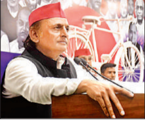
सपा प्रमुख अखिलेश यादव

पार्टी मुख्यालय में सपा प्रमुख कार्यकर्ताओं और पार्टी पदाधिकारियों