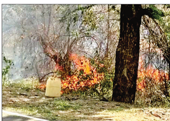
चरखारी-श्रीनगर मुख्य मार्ग के किनारे खेतों पर लगी आग।