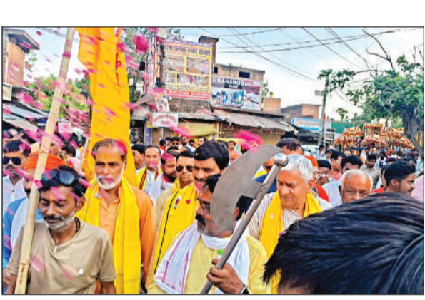
भगवान परशुराम जन्मोत्सव में शोभायात्रा निकालते श्रद्धालु।

अमृत विचार। नगर में भगवान परशुराम जन्मोत्सव हर्षोल्लास से मनाया गया। कार्यक्रम के तहत विप्र समुदाय से सच्चांग पर चलने की अपील कर भगवान परशुराम की शोभायात्रा भी निकाली गई। भगवान परशुराम को विष्णु का अवतार माना जाता है ऐसा पुराणों में भी वर्णित है। हालांकि उनके जन्म को कितने वर्ष हुए हैं इसका कोई स्पष्ट प्रमाण मौजूद नहीं है पर माना जाता है कि उनका जन्म अक्षय तृतीया को हुआ था इसी के चलते विप्र समुदाय उनका जन्मदिन आस्था और उल्लास के साथ मनाता है और इसी परम्परा के चलते रविवार को अक्षय तृतीया पर ठक्कर वापा इण्टर कालेज परिसर में विधि विधान से पूजन अर्चन किया गया। इस दौरान