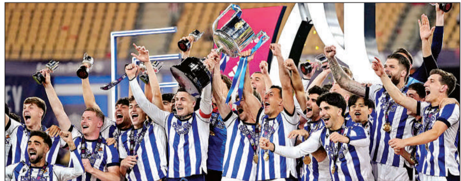
खिताब के साथ जश्न मनाते रियल सोसिडाड के खिलाड़ी।

रियल सोसिडाड ने पेनल्टी शूटआउट में एटलेटिको मैड्रिड को हराकर कोपा डेल रे फुटबॉल टूर्नामेंट का खिताब जीता। फाइनल मैच अतिरिक्त समय के बाद 2-2 से बराबरी पर था जिसके बाद पेनल्टी शूटआउट का सहारा लिया। सोसिडाड के गोलकीपर उनाई मैरेरो ने अलेक्जेंडर सोरलॉथ और जूलियन अल्वारेज के शॉट को बचाया। इसके बाद पाब्लो मारिन ने अंतिम किंक को गोल में बदला जिससे सोसिडाड ने शूटआउट में 4-3 से जीत हासिल की। अमेरिका के पेलेग्रिनो माटाराजो के सोसिडाड का कोच बनने के बाद स्पेन के क्लब की यह पहली जीत है। माटाराजो ने कहा यह अविश्वसनीय सफर रहा है।