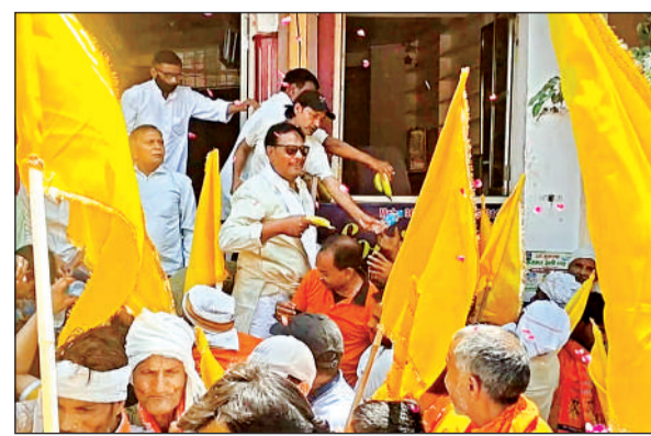
शोभायात्रा का स्वागत करते मुस्लिम समाज के लोग।