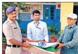
तिरगे में लपेटा गया राष्ट्रीय पक्षी मोर।