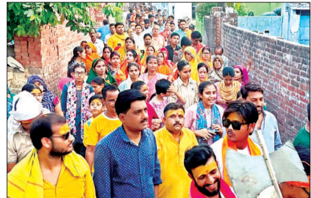
भगवान परशुराम की शोभायात्रा में मौजूद लोग।