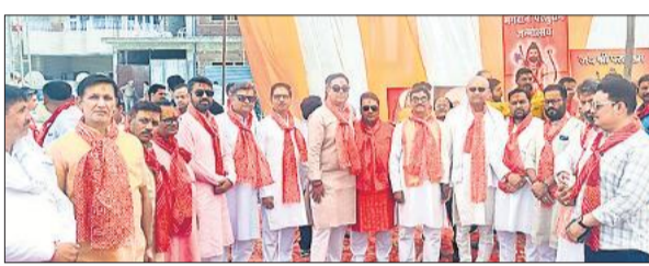
रामलीला मैदान में मौजूद आयोजक समिति के पदाधिकारी।

कार्यक्रम की शुरुआत रामलीला मैदान में भगवान परशुराम की प्रतिमा पर श्रद्धा-सुमन अर्पित करते हुए की गई। बाइक रैली रामलीला मैदान से प्रारंभ होकर सिविल लाइन्स होते हुए गांधी समाधि होते हुए शाहबाद गेट होते हुए पुपने आवास विकास पहुंचकर संपन्न हुई। रैली में बड़ी संख्या में ब्राह्मण समाज के लोगों ने बड़-चढ़कर भाग लिया।