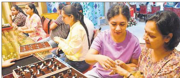
अक्षय तृतीया पर ज्वेलरी शॉप पर जेवर की खरीदारी करती महिलाएं।

भारी गहनों की बजाय हल्के, स्टायलिश और आकर्षक डिजाइन वाले आभूषणों को प्राथमिकता दी। बाजार में महिलाओं और