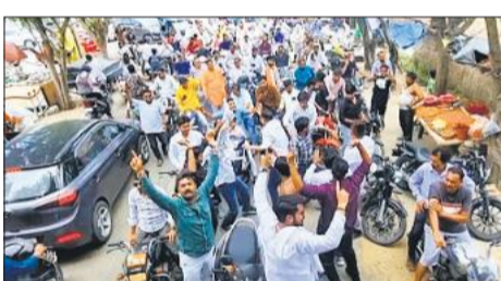
भगवान परशुराम जयंती पर निकली शोभायात्रा में शामिल लोग।

मुरादाबाद, अमृत विचार : भगवान परशुराम जयंती के अवसर पर रविवार को शहर में भव्य शोभायात्रा निकाली गई। परशुराम संघ समिति के तत्वावधान में निकाली गई यात्रा में सैकड़ों युवा एवं श्रद्धालुओं ने भाग लिया। शोभायात्रा का आरंभ कांठ रोड स्थित किला से किया गया। यात्रा विभिन्न मार्गों से होती हुई