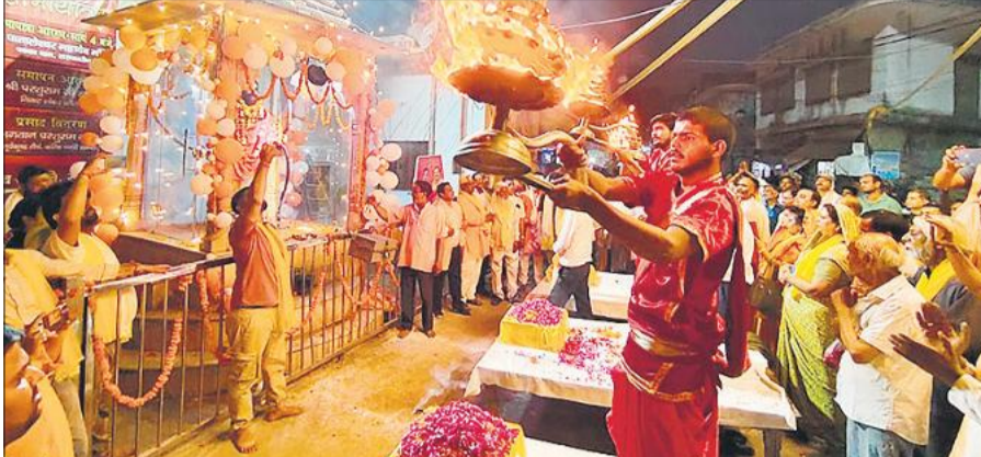
शंकर कॉलेज चौराहा पर भगवान परशुराम की आरती करते पुरोहित व आरती में शामिल श्रद्धालु। ● अमृत विचार

मंत्रमुग्ध कर दिया और खूब तालियां बटोरें। शोभायात्रा चौधरी सराय, मनोकामना मंदिर, कल्किक विष्णु मंदिर, रामलाला मैदान सहित विभिन्न