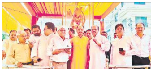
परशुराम प्रकोटोत्सव पर हवन-पूजन, धर्म स्थापना का संदेश