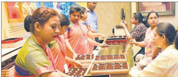
अक्षय तृतीया पर ज्वेलरी शॉप पर जेवर देखती महिलाएं।

अमृत विचार : अक्षय तृतीया के अवसर पर रविवार को शहर का सराफा बाजार पूरे दिन गुलजार रहा। सुबह से ही बाजारों में ग्राहकों की चहल-पहल देखने को मिली और देर शाम तक खरीदारी का दौर जारी रहा। सहालग के साथ पड़े इस शुभ संयोग ने बाजार में अतिरिक्त रौनक भर दी, जिससे कारोबारियों के चेहरे खिले नजर आए। सोने-चांदी की कीमतें रिकॉर्ड स्तर के करीब होने के बावजूद ग्राहकों के उत्साह में कोई कमी नहीं दिखी। सोना करीब 1.57 लाख रुपये प्रति 10 ग्राम और चांदी 2.56 लाख रुपये प्रति किलोग्राम के आसपास बनी रही। महंगे भाव के चलते ग्राहकों ने