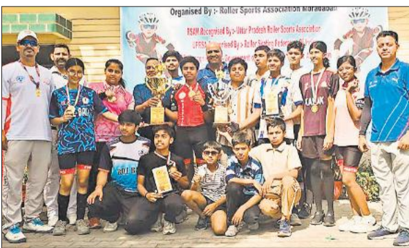
जिला स्तरीय ओपन रोलर स्केटिंग प्रतियोगिता के विजेता खिलाड़ी।