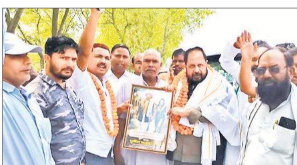
पिछड़ा वर्ग के राष्ट्रीय अध्यक्ष का स्वागत करते कांग्रेसी।