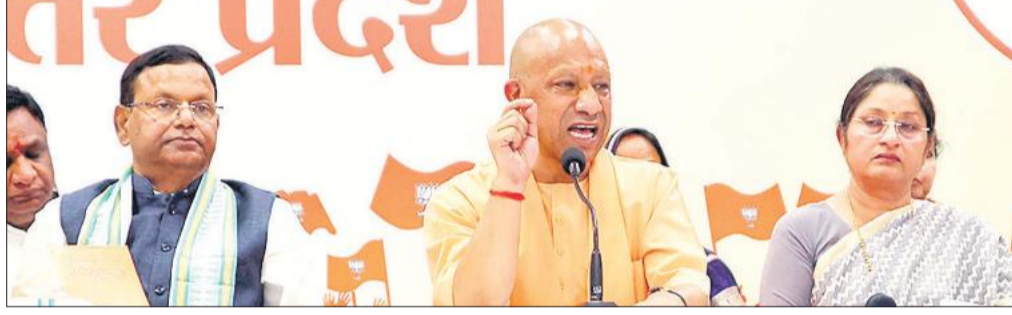
लखनऊ : भाजपा के राज्य मुख्यालय में आयोजित प्रेस कॉन्फ्रेंस में पत्रकारों से वार्ता करते मुख्यमंत्री योगी।

भाजपा के राज्य मुख्यालय में रविवार को पत्रकार से बातचीत में मुख्यमंत्री ने कहा कि प्रधानमंत्री नरेंद्र मोदी के नेतृत्व में सरकार ने महिलाओं के सम्मान, सुरक्षा और स्वावलंबन के लिए लगातार महत्वपूर्ण कदम उठाए हैं। लेकिन कांग्रेस, समाजवादी पार्टी, टीएमसी और डीएमके जैसे दलों ने हर बार इन प्रयासों का विरोध किया। उन्होंने आरोप लगाया कि विपक्ष ने संसद में गैर-जिम्मेदाराना आचरण करते हुए महिलाओं को उनका अधिकार मिलने से रोकने का