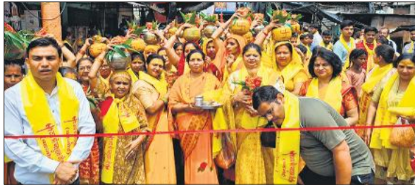
शोभायात्रा में सिर पर कलश यात्रा रखकर चलती महिलाएं।