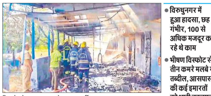
विस्फोट के बाद आग बुझाते दमकलकर्मी।

विस्फोट का प्रभाव इतना भीषण था कि तीन कमरे मलबे में तब्दील हो गए और आसपास की कई इमारतों को भारी नुकसान पहुंचा। एक पुलिस अधिकारी ने बताया, हमने अब तक 21 शव बरामद किए हैं, जिनमें से कई बुरी तरह जल