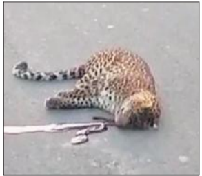
ददियाल में सड़क पर मृत पड़ा तेंदुआ।

अमृत विचार : मुरादाबाद बाजपुर मार्ग पर कोसी पुल के समीप एक अज्ञात वाहन की टक्कर से नर तेंदुए की मौत हो गई। तेंदुए का सड़क पर तड़पता देख मार्ग से निकल रहे राहगीरों ने वन विभाग को सूचना दी।