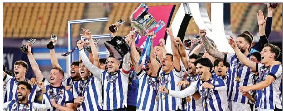
खिताब के साथ जश्न मनाते रियल सोसिडाड के खिलाड़ी।

रियल सोसिडाड ने पेनल्टी शूटआउट में एटलेटिको मैड्रिड को हराकर कोपा डेल रे फुटबॉल टूर्नामेंट का खिताब जीता। फाइनल मैच अतिरिक्त समय के बाद 2-2 से बराबरी पर था जिसके बाद पेनल्टी शूटआउट का सहारा लिया। सोसिडाड के गोलकीपर उनाई मैरेरो ने अलेक्जेंडर सोरलॉथ और जूलियन अल्वारेज के शॉट को बचाया। इसके बाद पाब्लो मारिन ने अंतिम किंक को गोल में बदला जिससे सोसिडाड ने शूटआउट में 4-3 से जीत हासिल की। अमेरिका के पेलेग्रिनो माटाराजो के सोसिडाड का कोच बनने के बाद स्पेन के क्लब की यह पहली जीत है। माटाराजो ने कहा यह अविश्वसनीय सफर रहा है।