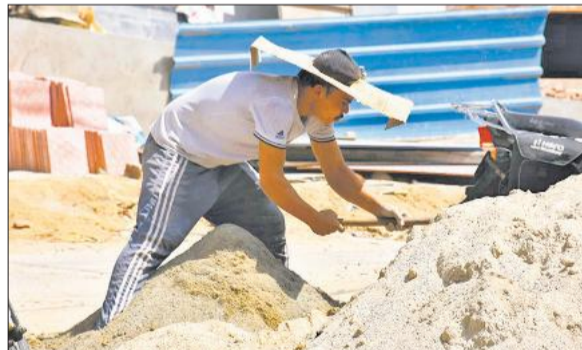
बुद्धि विहार में धूप से बचने के लिए सिर पर गता लगाकर काम करता मजदूर।