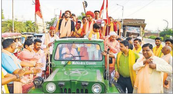
संभल में भगवान परशुराम की शोभायात्रा में जीप पर सवार अतिथि। ● अमृत विचार

शंकर कॉलेज में भगवान परशुराम की आरती में जुटे बड़ी संख्या में श्रद्धालु, झांकियों ने मोहा मन