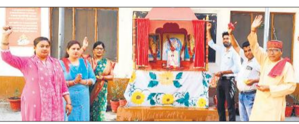
भगवान परशुराम के चित्र पर पुष्प अर्पित करने के बाद जयकारा लगाते भक्त।

सभी ने समाज की एकता, संगठन एवं उत्थान के लिए कार्य करने का संकल्प लिया। अनेको जगह पर अन्य सामाजिक संस्थाओं ने यात्रा का स्वागत पुष्प वर्षा एवं पटाखों के साथ किया। आयोजक समिति के सदस्यों ने कार्यक्रम को सफल बनाने में सहयोग