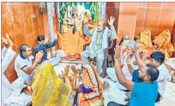
अक्षय तृतीय पर मिस्टन गंज स्थित शक्ति दरबार में हवन यज्ञ करते भक्त।