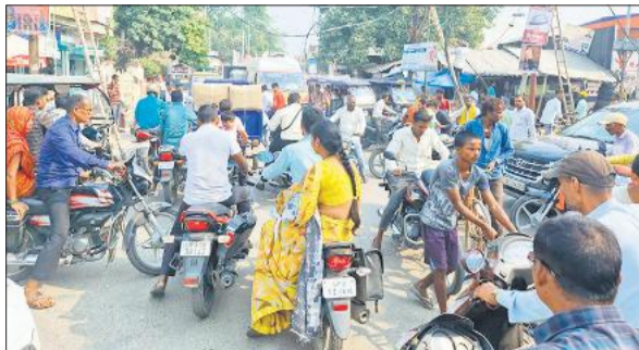
नौरंगाबाद चौराहे पर जाम में फंसी एंबुलेंस।

ग्रामीणों का कहना है कि बीते कई महीनों से इलाके में तेंदुओं और बाघों की आवाजही बढ़ी है। कई बार खेतों और गांव के किनारे उनके पगचिह्न भी देखे गए हैं, लेकिन इसके बावजूद वन विभाग की ओर से ठोस कार्रवाई नहीं की गई। खेतों में काम के दौरान अक्सर बच्चे साथ रहते हैं, जिससे उन पर खतरा ज्यादा मंडरा रहा है। महिलाएं भी सुबह-शाम खेतों में जाने से डरने लगी हैं। ग्रामीणों का कहना है कि पहले भी पशुओं पर हमले हुए चुके हैं, लेकिन अब इंसानों पर हमले से दहशत और गहरी हो गई है।