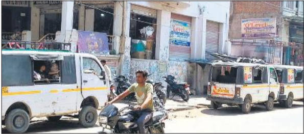
गोला के शिवम चौराहे के सिनेमा रोड पर खड़ी मैजिकें।