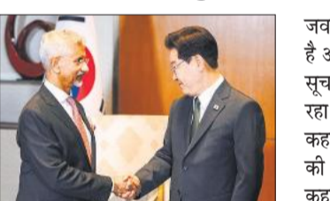
जयशंकर ने किया ली जे का स्वागत।

उत्तर कोरिया ने रविवार को समुद्र की ओर कम दूरी की कई बैलिस्टिक मिसाइलें दागीं। ये प्रक्षेपण दक्षिण कोरिया के राष्ट्रपति ली जे म्युंग के भारत और वियतनाम की यात्रा के लिए रवाना होने से कुछ घंटे पहले किए गए। उत्तर कोरिया के मिसाइल परीक्षणों पर जापान और दक्षिण कोरिया ने कड़ी आपत्ति जताई है। दक्षिण कोरिया ने राष्ट्रीय सुरक्षा परिषद की बैठक में भी इन परीक्षणों पर चिंता जताई है।