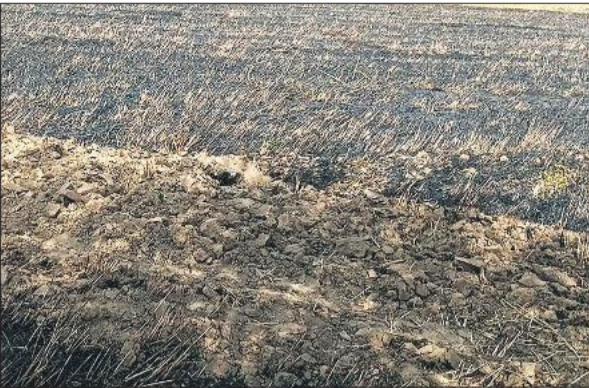
कांपटांडा में आग से गेहूँ की जली फसल।

अमृत विचार: मोतीपुर गांव में 14 अप्रैल 2026 को डॉ. भीमराव अंबेडकर जयंती के मौके पर हुए विवाद के बाद अब सोशल मीडिया पर फैलाई गई अफवाहों पर पुलिस ने सख्त रुख अपनाया है। कुछ लोगों ने बिना अनुमति और सूचना के गैर-परंपरागत तरीके से बाबा साहब की प्रतिमा स्थापित करने का प्रयास किया था। इसी दौरान कुछ लोगों ने इसका विरोध किया, जिससे आपसी विवाद की स्थिति बन गई। विवाद के दौरान कुछ लोगों ने अपने ही वर्ग की एक महिला के साथ मारपीट की, जिसे मौके पर पहुंची पुलिस ने बचाया।