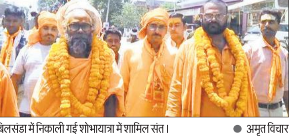
बिलसंडा में निकाली गई शोभायात्रा में शामिल संत।

अमृत विचार : परशुराम जन्मोत्सव रविवार को धूमधाम से मनाया गया। भव्य शोभायात्रा का आयोजन किया गया। अखिल भारतवर्षीय ब्राह्मण महासभा समेत कई संगठनों ने कार्यक्रम किए। शोभायात्रा की शुरुआत श्रीनिवास कुंज आश्रम से हुई। डीजे की धुन पर गूंज रहे भजनों पर भक्त झूमते रहे। राम दरबार, भगवान परशुराम, भोलेनाथ की मनमोहक झांकियां आकर्षण का केंद्र रहीं। कई जगह पुष्पवर्षा कर स्वागत किया गया। अखिल भारतवर्षीय ब्राह्मण महासभा के नगर अध्यक्ष