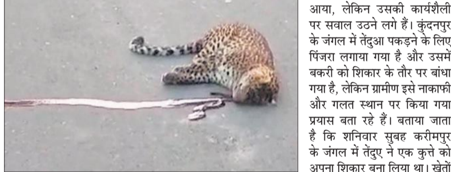
दढ़ियाल में सड़क पर मृत पड़ा तेंदुआ।