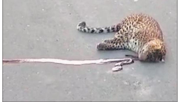
दढ़ियाल में सड़क पर मृत पड़ा तेंदुआ।

दढ़ियाल चौकी के अंतर्गत कोसी नदी पर बने पुल के पास रविवार सुबह करीब 7 बजे तेंदुए का शव देखा गया। स्थानीय लोगों ने तुरंत वन विभाग को इसकी सूचना दी। सूचना मिलते ही वन विभाग की टीम मौके पर पहुंची और आवश्यक कार्रवाई की। स्थानीय लोगों में यह भी चर्चा है कि मृत तेंदुए के साथ एक मादा तेंदुआ भी थी, जो हादसे के बाद जंगल की ओर भाग गई। इस घटना से क्षेत्र में दहशत का माहौल है, खासकर उन किसानों और राहगीरों में जो खेतों की ओर जाते हैं। क्षेत्र के