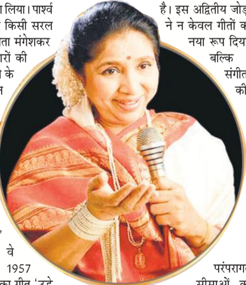
परंपरागत सीमाओं को भी तोड़ डाला। 'पिया तू अब तो आजा' और 'दम मारो दम' जैसे गीतों ने आशा जी को 'कैबरे क्वीन' के रूप में स्थापित कर दिया। उनकी आवाज में जो मादकता, ऊर्जा और आधुनिकता थी, उसने भारतीय संगीत में पश्चिमी प्रभाव को एक नया आयाम दिया। हालांकि 'दम मारो दम' को लेकर उस समय काफ़ी विवाद हुआ। इसे 'अश्लील' कहकर आलोचना झेलनी पड़ी, यहां तक कि ऑल इंडिया रेडियो ने इस पर प्रतिबंध लगा दिया और दूरदर्शन ने फिल्म से इसे हटा दिया। फिर भी, आशा जी की आवाज ने इस गीत को अमर बना दिया। दिलचस्प यह है कि जहां एक ओर वे कैबरे और पॉप की पहचान बन रही थी, वहीं 'इजाजत' के 'मेरा कुछ सामान' में उन्होंने गहन भावनाओं की ऐसी अभिव्यक्ति दी, जो उनकी असाधारण बहुमुखी प्रतिभा को सिद्ध करती है।

1970 का दशक हिंदी सिनेमा में संगीतात्मक प्रयोगों का स्वर्णिम काल था और इसी दौर में आशा भोंसले को मिला उनका सबसे सशक्त रचनात्मक साथी 'आर.डी. बर्मन', जिन्हें प्यार से 'पंचम' कहा जाता है। इस अद्वितीय जोड़ी ने न केवल गीतों को नया रूप दिया, बल्कि संगीत की