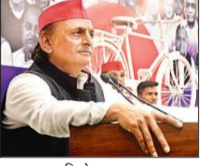
सपा प्रमुख अखिलेश यादव

अमृत विचार : सपा प्रमुख अखिलेश यादव ने कहा है कि लोकसभा में महिला आरक्षण संशोधन विधेयक में हार के बाद भाजपा में बौखलाहट और हताशा है। चुटकी लेते हुए उन्होंने कहा कि जब बीती रात 8 बजे प्रधानमंत्री के संबोधन की खबर आई, तो सबको लगा कि शायद किसी महिला को प्रधानमंत्री बनाने का ऐतिहासिक ऐलान होगा, लेकिन हाथ सिर्फ मायूसी हाथ लगी। पार्टी मुख्यालय में सपा प्रमुख कार्यकर्ताओं और पार्टी पदाधिकारियों