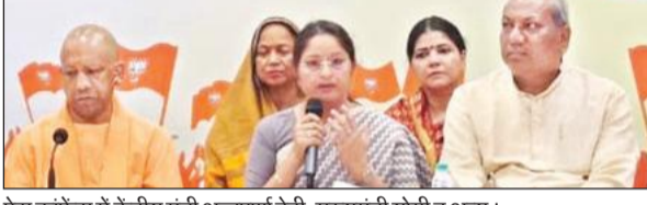
प्रेस कॉन्फ्रेंस में केंद्रीय मंत्री अन्नपूर्णा देवी, मुख्यमंत्री योगी व अन्य।