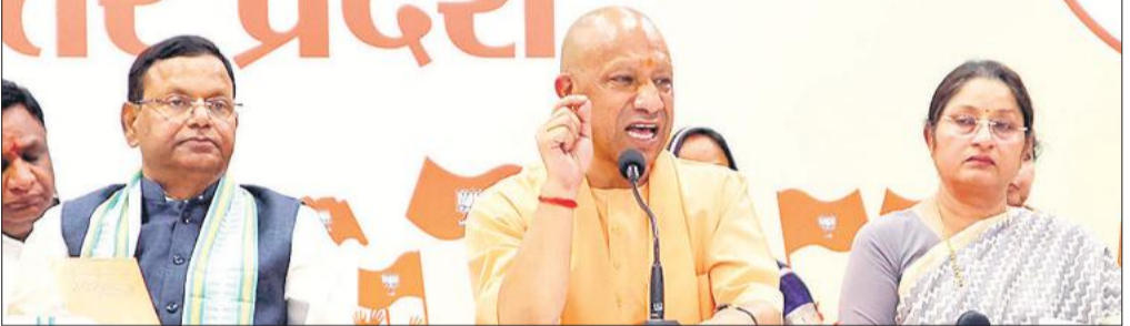
लखनऊ : भाजपा के राज्य मुख्यालय में आयोजित प्रेस कॉन्फ्रेंस में पत्रकारों से वार्ता करते मुख्यमंत्री योगी।

अमृत विचार : संसद में नारी शक्ति वंदन संशोधन विधेयक को पारित नहीं होने देने पर मुख्यमंत्री योगी आदित्यनाथ ने रविवार को विपक्ष पर तीखा हमला बोला है। उन्होंने विपक्ष के आचरण की तुलना महाभारत के द्रौपदी चीरहरण प्रसंग से करते हुए इसे नारी सम्मान के खिलाफ अक्षम्य पाप बताया। उन्होंने कहा कि इंडी गठबंधन का यह व्यवहार देश की नारी शक्ति कभी माफ नहीं करेगी। भाजपा के राज्य मुख्यालय में रविवार को पत्रकार से बातचीत में मुख्यमंत्री ने कहा कि प्रधानमंत्री नरेंद्र मोदी के नेतृत्व में सरकार ने महिलाओं के सम्मान, सुरक्षा और स्वावलंबन के लिए लगातार महत्वपूर्ण कदम उठाए हैं। लेकिन कांग्रेस, समाजवादी पार्टी, टीएमसी और डीएमके जैसे दलों ने हर बार इन प्रयासों का विरोध किया। उन्होंने आरोप लगाया कि विपक्ष ने संसद में गैर-जिम्मेदाराना आचरण करते हुए महिलाओं को उनका अधिकार मिलने से रोकने का