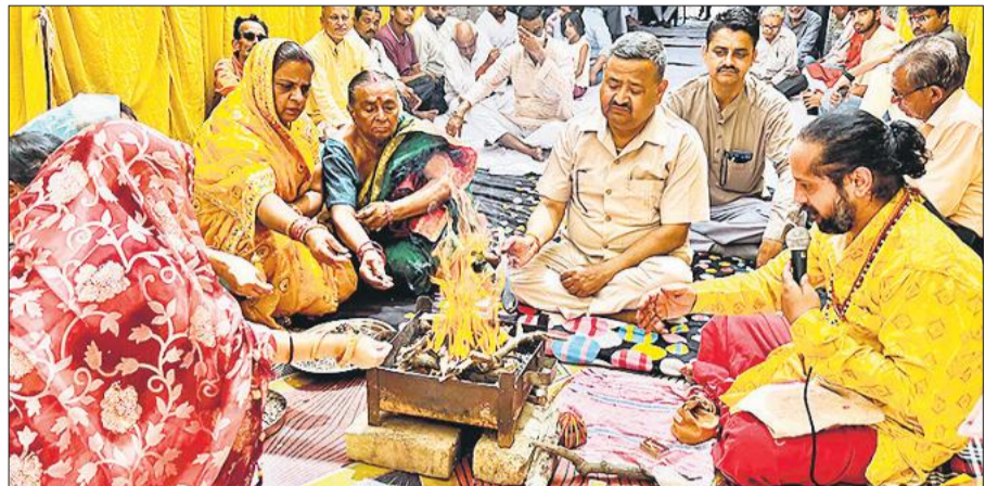
मोहल्ला मोहल्लामिखां में परशुराम जयंती पर हुए हवन में श्रद्धालु।

प्राचीन गौरीशंकर मंदिर समेत कई जगह हुए पूजन और हवन, उत्कृष्ट कार्य करने वाले समाज के लोगों को किया गया सम्मानित