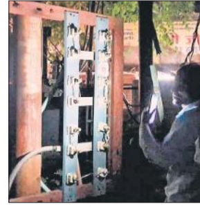
रामस्वरूप पार्क के पास ट्रांसफार्मर में आई खराबी ठीक करते कर्मचारी।

अमृत विचार : एक तरफ स्मार्ट मीटर लगाने के बाद उपभोक्ताओं की बड़ी समस्या कम नहीं हो सकी है। आए दिन कभी बिजली का बढ़ा बिल ठीक कराने तो कभी बिल जमा न होने पर बिजली गुल होने की शिकायतें लेकर उपभोक्ता पावर कॉर्पोरेशन के अधिकारियों के दफ्तर के चक्कर लगा रहे हैं। वहीं, मीटर तो स्मार्ट कर दिए गए, लेकिन सप्लाई के लिए इंस्टेमाल संसाधन हल्का सा लोड बढ़ते ही हाफ रहे हैं। इसका खामियाजा बिजली संकट गहराने पर उपभोक्ताओं को भुगतान पड़ रहा है। शहर की बिजली व्यवस्था लंबे समय से चरमराई है। बीते सालों में व्यवस्था को बेहतर बनाने के दावों के साथ बंच केबिल डलवाई गईं। मगर उसमें तमाम अनियमितताएं उजागर हुईं। कई गलियों में बीच-बीच में पुराने जर्जर तारों के मकड़जाल छोड़ दिए गए और मुसीबत बरकरार रही। शहर