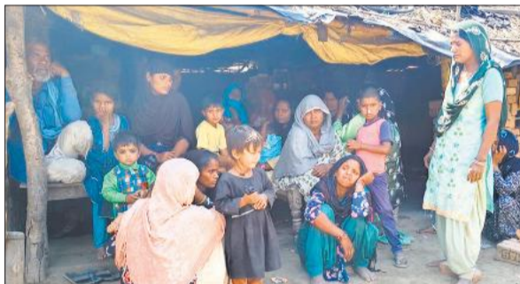
घर पर रोते-बिलखते परिजन।