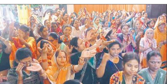
भजनों पर थिरकते श्रद्धालु।

अमृत विचार : शेरों वाली मठिया के समीप श्रीब्रह्मदेव मंदिर प्रांगण में चल रही श्रीमद भागवत कथा के पांचवें दिन श्री गिरिराज जी महाराज की कथा का वर्णन किया गया। प्रभु श्रीकृष्ण की बाल लीलाओं को भी सुनाया गया। भजनों पर भक्त जमकर थिरके।