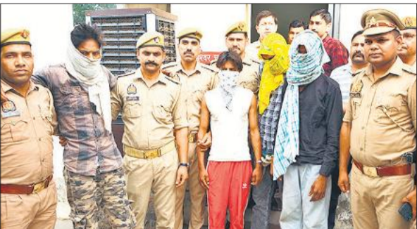
पुलिस की गिरफ्त में आए चारों आरोपी।