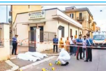
घटनास्थल पर जांच करती कोवो शहर की पुलिस।

घटनास्थल से लगभग 10 कारतूस बरामद किए गए हैं और अधिकारी सुनियोजित हत्या की संभावना को ध्यान में रखकर जांच कर रहे हैं। एक प्रत्यक्षदर्शी ने बताया कि गोली चलाने वाला भी एक भारतीय था जो अक्सर गुरुद्वारे में आता-जाता था।