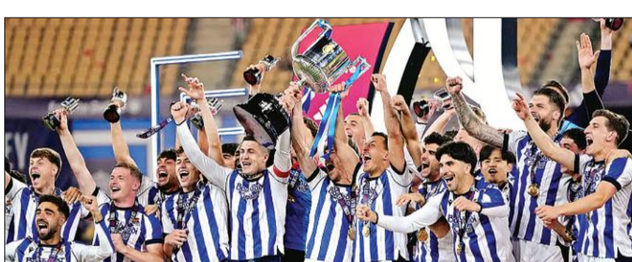
खिताब के साथ जश्न मनाते रियल सोसिडाड के खिलाड़ी।

रियल सोसिडाड ने पेनल्टी शूटआउट में एटलेटिको मैड्रिड को हराकर कोपा डेल रे फुटबॉल टूर्नामेंट का खिताब जीता। फाइनल मैच अतिरिक्त समय के बाद 2-2 से बराबरी पर था जिसके बाद पेनल्टी शूटआउट का सहारा लिया। सोसिडाड के गोलकीपर उनाई मैरेरो ने अलेक्जेंडर सोरलॉथ और जूलियन अल्वारेज के शॉट को बचाया। इसके बाद पाब्लो मारिन ने अंतिम किंक को गोल में बदला जिससे सोसिडाड ने शूटआउट में 4-3 से जीत हासिल की। अमेरिका के पेलेग्रिनो माटाराजो के सोसिडाड का कोच बनने के बाद स्पेन के क्लब की यह पहली जीत है। माटाराजो ने कहा यह अविश्वसनीय सफर रहा है।