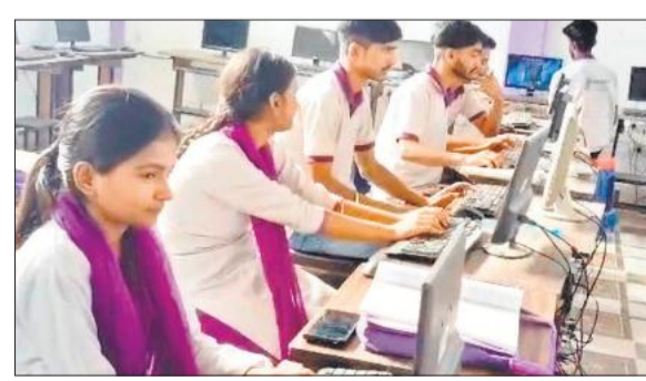
गोला में तकनीकी ज्ञान प्राप्त करते प्रशिक्षणार्थी।

केंद्र के समन्वयक ने बताया कि प्रशिक्षण का उद्देश्य ग्रामीण निर्धन युवाओं को कौशल प्रदान कर उन्हें न्यूनतम मजदूरी से ऊपर के मासिक वेतन वाले रोजगार की ओर अग्रसर करना है। 210 युवा विभिन्न ग्राम पंचायतों से चयनित प्रशिक्षण के क्षेत्र सोलर पैनल इंस्टॉलर, सोलर सिस्टम सर्विस के साथ ही कंप्यूटर ट्रेनिंग, पर्सनैलिटी डेवलपमेंट, इंग्लिश स्पीकिंग की भी ट्रेनिंग दी जा रही है। योजना के तहत छात्रों को निःशुल्क वर्दी, पाठ्य सामग्री और प्रशिक्षण के