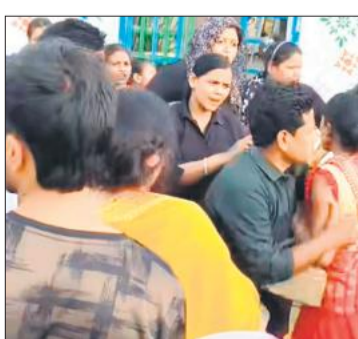
गोला के चैती मेला में झूले के बाउंसर के साथ मारपीट के वायरल वीडियो के स्क्रीनशॉट।

नगर में चल रहे हैं ऐतिहासिक चैती मेला के शनिवार की देर रात मेले में झूलों की सुरक्षा व्यवस्था में तैनात बाउंसरों से किसी बात को लेकर मेला देखने गए कुछ लोगों से कहासुनी होने लगी, जिसमें बात बढ़ने पर बाउंसरों और युवकों में जमकर मारपीट हुई। मेले में अफरा तफरी मच गई। आसपास के दुकानदारों का कहना है कि युवक नशे की हालत में थे। सूचना पर पहुंची पुलिस ने बल प्रयोग करते हुए सभी झूले बंद करवा दिए। इस दौरान आरोप है