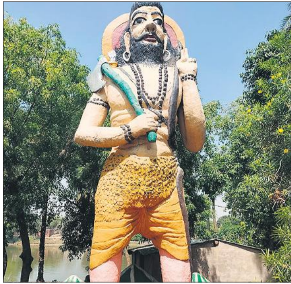
देवकली तीर्थ स्थित भगवान परशुराम में भव्य प्रतिमा।