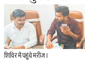
शिविर में पहुंचे मरीज।