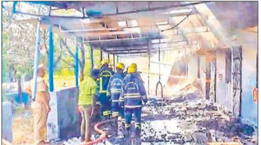
विस्फोट के बाद आग बुझाते दमकलकर्मी।

तमिलनाडु के विरुधुनगर के निकट स्थित एक पटाखा फैक्टरी में हुए विस्फोट में 23 से अधिक श्रमिकों की मौत हो गई और छह अन्य गंभीर रूप से घायल हुए हैं। यह विस्फोट वाचकारपती पुलिस थाना क्षेत्र के अंतर्गत कट्टनरपती में मुधुमानिकम के स्वामित्व वाली 'वनजा' पटाखा फैक्टरी में हुआ। पुलिस और अग्निशमन अधिकारियों के अनुसार, घायल हुए 8 लोगों की हालत नाजुक है और उनका विरुधुनगर सरकारी मेडिकल कॉलेज एवं अस्पताल में इलाज जारी है। प्रारंभिक जांच से पता चला है कि इस पटाखा निर्माण इकाई को नागपुर स्थित पेद्रोलियम और विस्फोटक सुरक्षा संगठन (पीईएसओ) से लाइसेंस मिला हुआ है। परिसर में 100 से अधिक श्रमिक काम कर रहे थे। ऐसा माना जा रहा है कि विस्फोट बरामदे वाले क्षेत्र में हुआ, जहां श्रमिक कच्चे माल से पटाखों को अंतिम रूप दे रहे थे। विस्फोट का प्रभाव इतना भीषण था कि तीन कमरे मलबे में तब्दील हो गए और आसपास की कई इमारतों को भारी नुकसान पहुंचा। एक पुलिस अधिकारी ने बताया, हमने अब तक 23 शव बरामद किए हैं, जिनमें से कई बुरी तरह