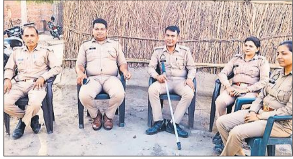
गांव में तैनात पुलिस बल।