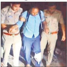
जहानाबाद पुलिस की गिरफ्त में पकड़ा गया इनामी लुटेरा। ● अमृत विचार

बता दें कि जहानाबाद थाना क्षेत्र में नौ माचों को सेवानिवृत्त शिक्षक के साथ लिफ्ट देने के बहाने कार में बैठाकर लूट की वारदात को अंजाम दिया गया था। 23 हजार