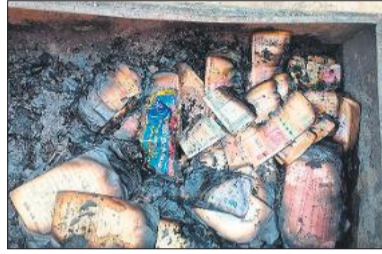
आग से जले नोट।