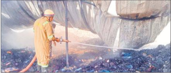
गांव गोपीवाला में कपड़े के गोदाम में लगी आग बुझाने दमकल कर्मचारी।