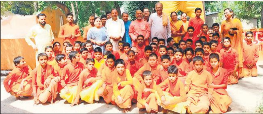
भगवान परशुराम की प्रतिमा के समक्ष पूजन अर्चन के दौरान वटुक और आचार्य।

कार्यक्रम के अंत में भंडारे का आयोजन किया गया, जिसमें श्रद्धालुओं ने प्रसाद ग्रहण कर भगवान परशुराम जी महाराज से देश की समृद्धि और सुख-शांति के लिए आशीर्वाद मांगा।