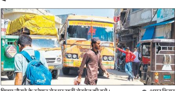
शिवम चौराहे के स्टेशन रोड पर खड़ी रोडवेज की बसें।

नगर के शिवम चौराहे स्टेशन रोड पर आए दिन रोडवेज बसें और सिनेमा रोड शिवम कांप्लेक्स के निकट मैजिक वाहन अक्सर सवारियों बैठाने के लिए रुक जाते हैं, जिससे यातायात बाधित होता है और जाम भी लग जाता है। बस चालक और मैजिक चालक दोनों ही सवारियों के लालच में वाहन सड़क व चौराहे पर ही रुक देते हैं, जिससे यातायात बाधित हो जाता है। दोनों तरफ से वाहन खड़े होते ही पीछे वाहनों की कतार लग जाती है। रोज लग रही जाम के कारण राहगीरों, स्कूली बच्चों, और कामकाजी लोगों को काफी देर तक इंतजार करना पड़ता है और वह