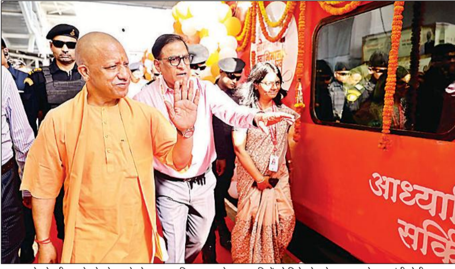
लखनऊ के गोमतीनगर रेलवे स्टेशन से सोमनाथ स्वाभिमान यात्रा के तहत यात्रियों को विशेष ट्रेन से रवाना करते मुख्यमंत्री योगी।

सीएम योगी ने कहा कि प्रधानमंत्री नरेंद्र मोदी के नेतृत्व में सांस्कृतिक पुनर्जागरण नई ऊंचाइयों पर पहुंच रहा है। अयोध्या में राम मंदिर, काशी विश्वनाथ धाम कॉरिडोर सहित तीर्थों के विकास का उल्लेख