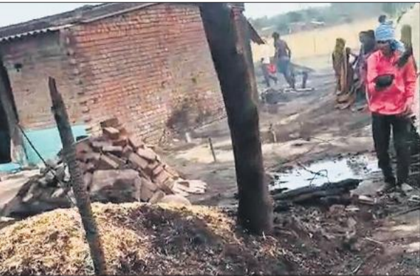
कांपटांडा गांव में जला घर।