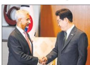
जयशंकर ने किया ली जे का स्वागत।

सियोल, एजेंसी उत्तर कोरिया ने रविवार को समुद्र की ओर कम दूरी की कई बैलिस्टिक मिसाइलें दागीं। ये प्रक्षेपण दक्षिण कोरिया के राष्ट्रपति ली जे म्युंग के भारत और वियतनाम की यात्रा के लिए रवाना होने से कुछ घंटे पहले किए गए। उत्तर कोरिया के मिसाइल परीक्षणों पर जापान और दक्षिण कोरिया ने कड़ी आपत्ति जताई है। दक्षिण कोरिया ने राष्ट्रीय सुरक्षा परिषद की बैठक में भी इन परीक्षणों पर चिंता जताई है। दक्षिण कोरिया के ज्वाइंट चीफ्स ऑफ स्टॉफ (जेसीएस) के मुताबिक उत्तर