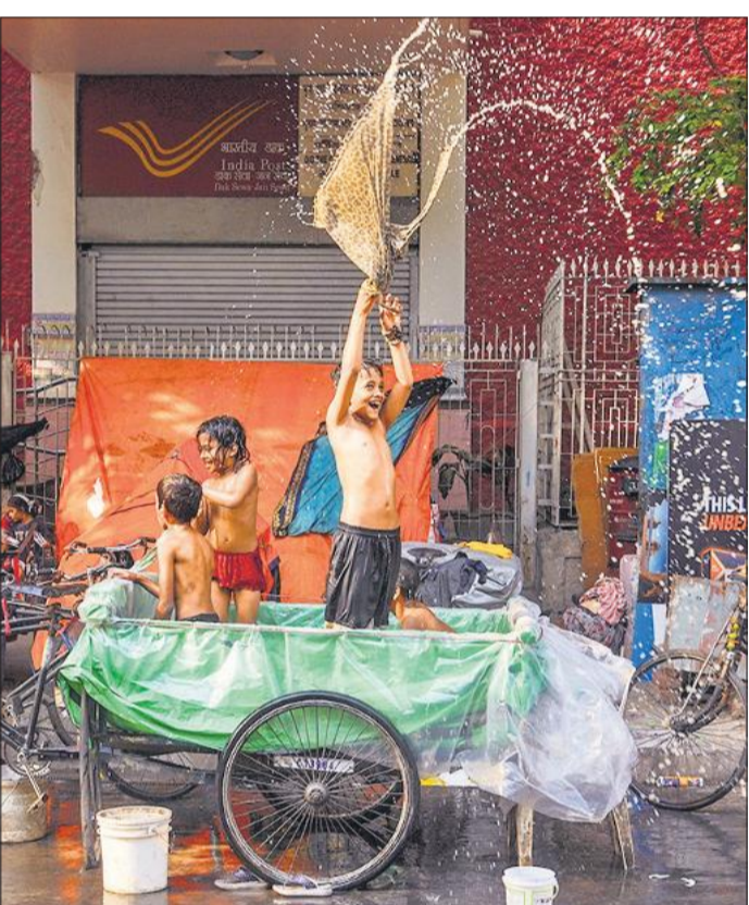
देश भर में भीषण गर्मी कई हिस्सों में तापमान 45 डिग्री सेल्सियस

मध्य अप्रैल में ही देश के कई हिस्सों में लोग भीषण गर्मी का सामना कर रहे हैं। छत्तीसगढ़ के राजनांदगांव 44 डिग्री सेल्सियस तापमान दर्ज किया गया है। राज्य के कई इलाकों लू का अलर्ट जारी किया गया है। झारखंड में भी 44 डिग्री सेल्सियस तापमान पहुंचने की संभावना के चलते येलो अलर्ट जारी किया गया है। राजस्थान में भी प्रचंड गर्मी पड़ रही है। कोटा में तापमान 42 डिग्री सेल्सियस पर कर गया है। इसके अलावा देश के कई हिस्सों में पेयजल की कमी से भी लोगों को जूझना पड़ रहा है। दिल्ली और मध्यप्रदेश में रविवार को पेयजल संकट के चलते विरोध प्रदर्शन किया।