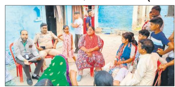
बालिका के घर पर पहुंची पुलिस और चाइल्ड हेल्पलाइन की सुपरवाइजर ।