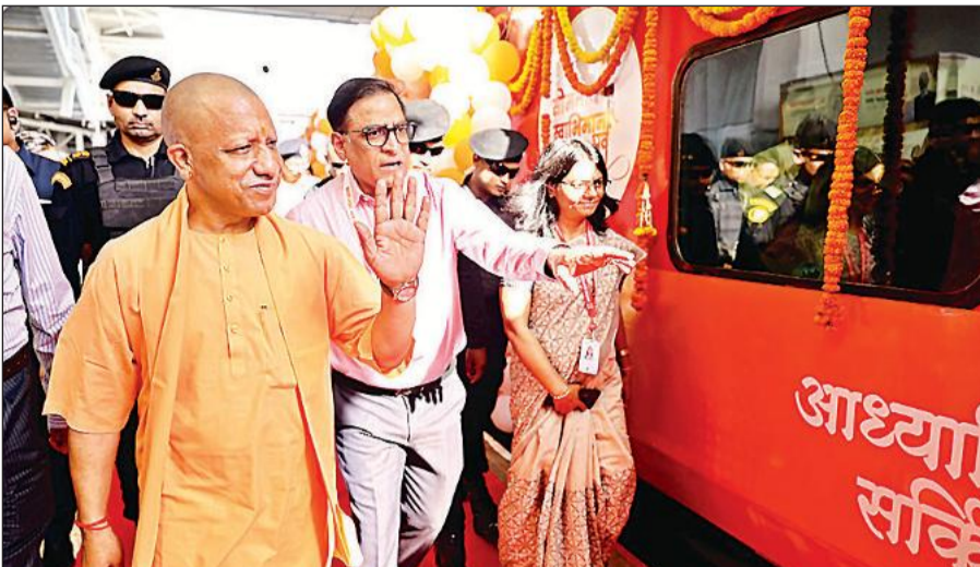
लखनऊ के गोमतीनगर रेलवे स्टेशन से सोमनाथ स्वाभिमान यात्रा के तहत यात्रियों को विशेष ट्रेन से रवाना करते मुख्यमंत्री योगी।

सीएम योगी ने कहा कि प्रधानमंत्री नरेंद्र मोदी के नेतृत्व में सांस्कृतिक पुनर्जागरण नई ऊंचाइयों पर पहुंच रहा है। अयोध्या में राम मंदिर, काशी विश्वनाथ धाम कॉरिडोर सहित तीर्थों के विकास का उल्लेख