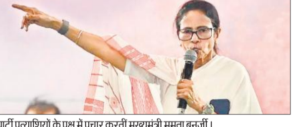
पार्टी प्रत्याशियों के पक्ष में प्रचार करती मुख्यमंत्री ममता बनर्जी।

पश्चिम बंगाल में सत्तारूढ़ तृणमूल कांग्रेस को प्रमुख बनर्जी ने हुगली जिले के तारकेश्वर में एक चुनावी जनसभा को संबोधित करते हुए आरोप लगाया कि प्रधानमंत्री मोदी ने महिला आरक्षण विधेयक के संबंध में राष्ट्र को संबोधित करते हुए भारतीय जनता पार्टी (भाजपा) के लिए अवैध तरीके से प्रचार किया। मुख्यमंत्री ने प्रधानमंत्री पर आदर्श चुनाव आचार संहिता का उल्लंघन करने का आरोप