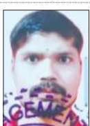
मृतक रिकू ।