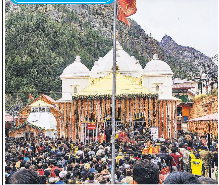
उत्तरकाशी में वार्षिक चार धाम यात्रा के लिए गंगोत्री मंदिर के कपाट खोले जाने के दौरान आयोजित समारोह में मौजूद श्रद्धालु।