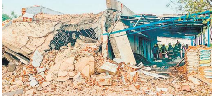
धमाके के बाद गिरा लैंटर और राहत कार्य में जुटे बचावकर्मी।