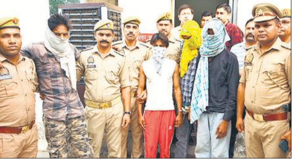
पुलिस की गिरफ्त में आए चारों आरोपी।