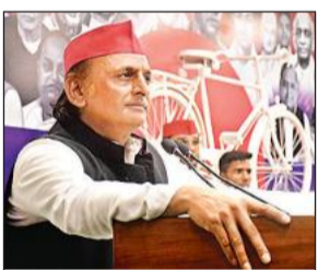
सपा प्रमुख अखिलेश यादव

अमृत विचार : सपा प्रमुख अखिलेश यादव ने कहा है कि लोकसभा में महिला आरक्षण संशोधन विधेयक में हार के बाद भाजपा में बौखलाहट और हताशा है। चुटकी लेते हुए उन्होंने कहा कि जब बीती रात 8 बजे प्रधानमंत्री के संबोधन की खबर आई, तो सबको लगा कि शायद किसी महिला को प्रधानमंत्री बनाने का ऐतिहासिक ऐलान होगा, लेकिन हाथ सिर्फ मायूसी हाथ लगी। पार्टी मुख्यालय में सपा प्रमुख कार्यकर्ताओं और पार्टी पदाधिकारियों