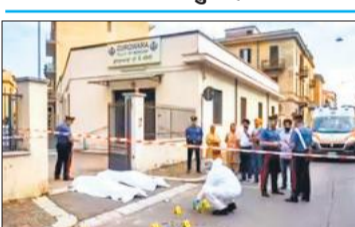
घटनास्थल पर जांच करती कोवो शहर की पुलिस।

घटनास्थल से लगभग 10 कारतूस बरामद किए गए हैं और अधिकारी सुनियोजित हत्या की संभावना को ध्यान में रखकर जांच कर रहे हैं। एक प्रत्यक्षदर्शी ने बताया कि गोली चलाने वाला भी एक भारतीय था जो अक्सर गुरुद्वारे में आता-जाता था।