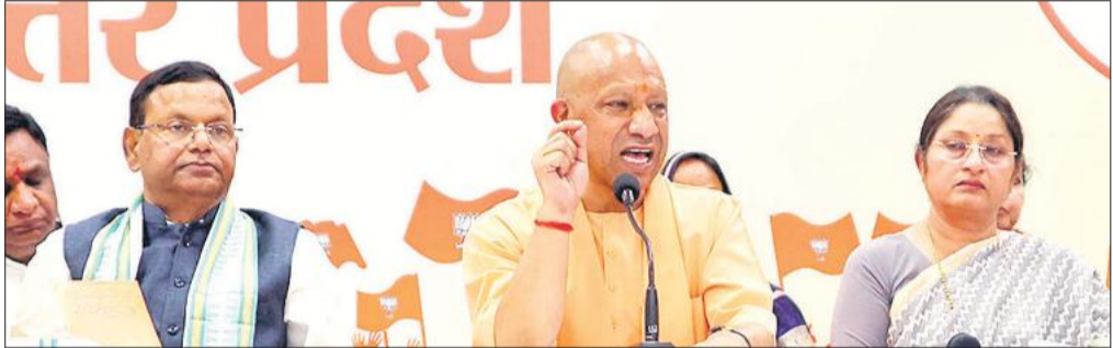
लखनऊ: भाजपा के राज्य मुख्यालय में आयोजित प्रेस कॉन्फ्रेंस में पत्रकारों से वार्ता करते मुख्यमंत्री योगी।

अमृत विचार : संसद में नारी शक्ति वंदन संशोधन विधेयक को पारित नहीं होने देने पर मुख्यमंत्री योगी आदित्यनाथ ने रविवार को विपक्ष पर तीखा हमला बोला है। उन्होंने विपक्ष के आचरण की तुलना महाभारत के द्रौपदी चीरहरण प्रसंग से करते हुए इसे नारी सम्मान के खिलाफ अक्षम्य पाप बताया। उन्होंने कहा कि इंडी गठबंधन का यह व्यवहार देश की नारी शक्ति कभी माफ नहीं करेगी। भाजपा के राज्य मुख्यालय में रविवार को पत्रकार से बातचीत में मुख्यमंत्री ने कहा कि प्रधानमंत्री नरेंद्र मोदी के नेतृत्व में सरकार ने महिलाओं के सम्मान, सुरक्षा और स्वावलंबन के लिए लगातार महत्वपूर्ण कदम उठाए हैं। लेकिन कांग्रेस, समाजवादी पार्टी, टीएमसी और डीएमके जैसे दलों ने हर बार इन प्रयासों का विरोध किया। उन्होंने आरोप लगाया कि विपक्ष ने संसद में गैर-जिम्मेदाराना आचरण करते हुए महिलाओं को उनका अधिकार मिलने से रोकने का