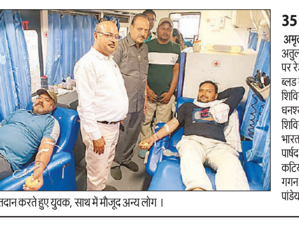
रक्तदान करते हुए युवक, साथ में मौजूद अन्य लोग।