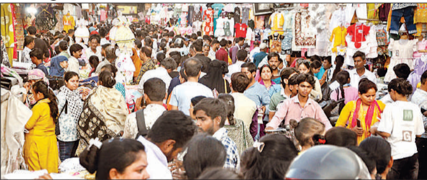
अक्षय तृतीया पर खरीदारी के लिए बाजार में उमड़ी भीड़।

प्रति 10 ग्राम रहा। अक्षय तृतीया पर लोगों ने सोने की 18 और 22 कैरेट की लाइट ज्वेलरी ज्यादा