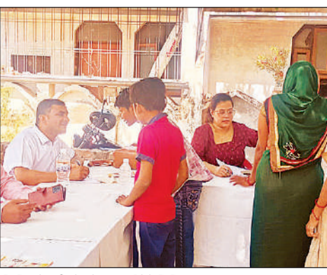
शिविर में मरीजों को परामर्श देते चिकित्सक।