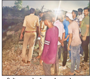
नदी में तलाश के दौरान मौजूद लोग।