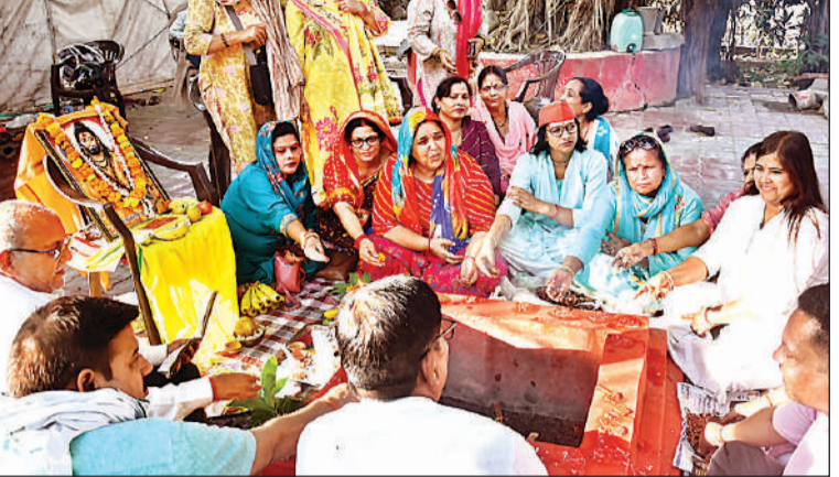
अमृत विचार, लखनऊ : अक्षय तृतीया के अवसर पर लेटे हुए हनुमान मंदिर समिति की ओर से कपीश्वर वैदिक गुरुकुल के नवप्रवेशित बाल ब्रह्मचारी 51 बटुकों का उपनयन संस्कार कराया गया।