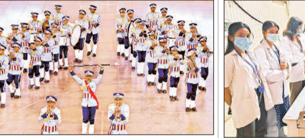
बैंड प्रस्तुति देते सीएमएस छात्र