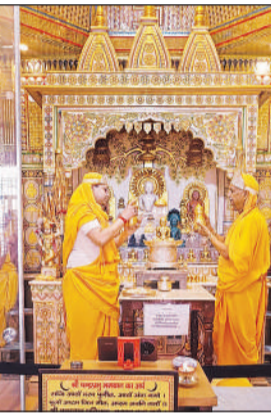
जैन मंदिर में पूजा करते श्रद्धालु।