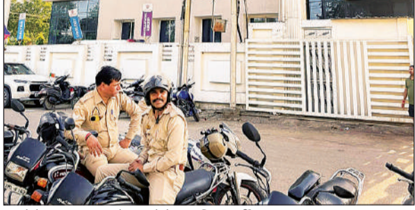
हंगामे के बाद अस्पताल के सामने तैनात पुलिस कर्मी।

अब तक करीब सात लाख रुपये जमा कराए जा चुके थे। परिजनों के मुताबिक ऑपरेशन के बाद 24 घंटे में होश आने का दावा किया गया था, लेकिन महिला को होश नहीं आया और इलाज की स्थिति की सही जानकारी भी नहीं दी गई। महिला की रविवार को मौत हो गई। अस्पताल प्रबंधन द्वारा और रुपये जमा करने की बात कही गई। इस पर विवाद बढ़ गया। परिजनों का आरोप है कि विरोध करने पर अस्पताल कर्मियों ने उनके साथ मारपीट की। परिजनों ने पोस्टमार्टम कराने से इनकार कर दिया है।