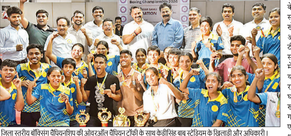
जिला स्तरीय बॉक्सिंग चैंपियनशिप की ओवरऑल चैंपियनशिप में हॉसिल किए 64 अंक