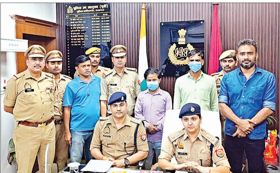
पुलिस की गिरफ्त में हत्या करने का आरोपी पिता व उसका दोस्त।

वारदात के बाद पहचान छिपाने के लिए आरोपी ने बेटी के चेहरे पर एसिड डालकर जलाने की कोशिश की। इसके बाद दोनों आरोपी मौके से फरार हो गए। घटना के बाद पिता