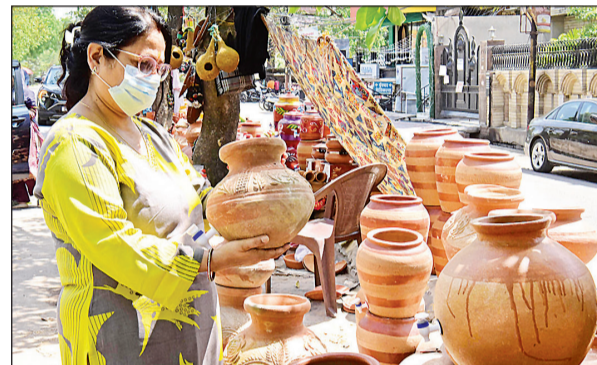
पानी ठंडा करने के लिए बाजार में घड़ा खरीदती महिला।