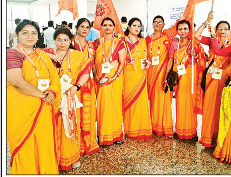
सोमनाथ दर्शन के लिए जा रही महिलाओं का दल।