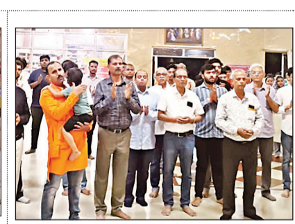
चन्दन यात्रा महामहोत्सव में शामिल श्रद्धालु।