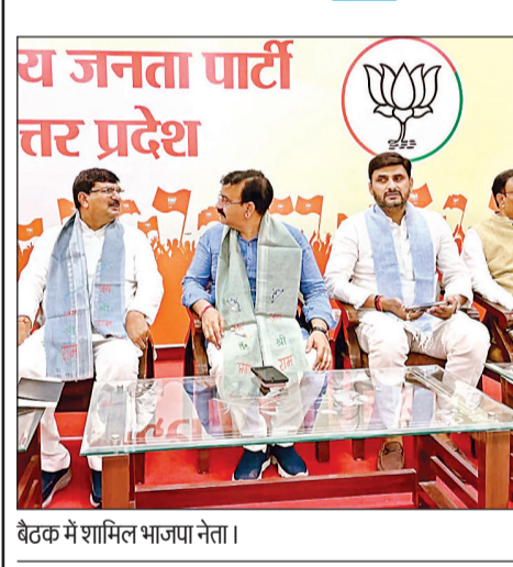
बैठक में शामिल भाजपा नेता।