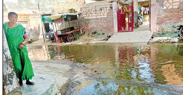
सड़क पर जलभराव होने से चबूतरे से निकलती महिला।