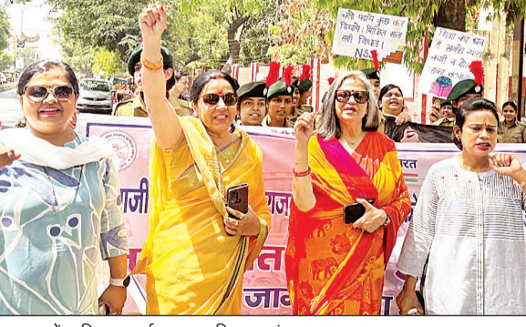
पदयात्रा में शामिल प्राचार्या व अन्य सहित छात्राएं।