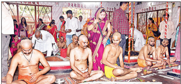
यज्ञोपवीत संस्कार की रस्में पूरी करते बटुक।