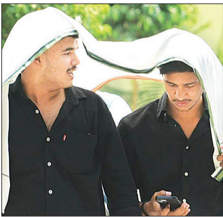
अंगोछे से खुद को घुसे से बचाने का प्रयास करते युवक।