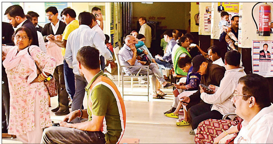
रजिस्ट्री ऑफिस में सर्वर डाउन होने के कारण इंतजार करते रजिस्ट्री कराने आए लोग।

से 193043 रुपये राजस्व प्राप्त हुआ था। उपनिबंधक कार्यालय के आंकड़ों के अनुसार मार्च 2026 में मोहनलालगंज में 2552 और पूरे वर्ष 35401 बैनामा कराए गए। दूसरे स्थान पर बीकेटी रहा। यहां भी खरीदारों ने निवेश करके