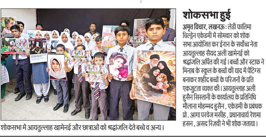
शोकसभा में आयतुल्लाह खामेनई और छात्राओं को श्रद्धांजलि देते बच्चे व अन्य।