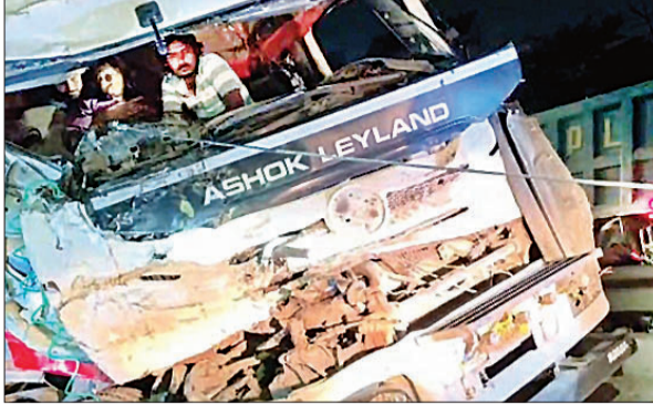
हादसे के बाद लोडर के केबिन में फंसा चालक।

हो गए। हादसे से वहां से गुजर रहे राहगीरों ने अपने वाहन रोके। देखा तो चालक अंदर फंसा है। राहगीरों ने 2:15 बजे डॉयल-112 पर सूचना दी। इंस्पेक्टर ने