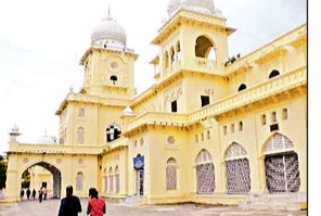
विश्वविद्यालय ने एलयूआरएन शुल्क खत्म करने की घोषणा

अमृत विचार: लखनऊ विश्वविद्यालय में प्रवेश से लेकर विभिन्न पाठ्यक्रमों की बढ़ाई गई फीस से छात्रों में गुस्सा है। कुछ पाठ्यक्रमों में 3 हजार से 15 हजार रुपये तक की वृद्धि की गई है। हालांकि विश्वविद्यालय ने सेमेस्टर फीस बढ़ाने के साथ सेल्फ फाइनेंस कोर्सेस की सीटें भी बढ़ा दी हैं, लेकिन छात्रों का आरोप है कि फीस बढ़ोतरी कर सीट बढ़ाना विश्वविद्यालय की आय बढ़ाने का प्रयास है। वहीं, सरकार के निर्देश पर परीक्षा शुल्क कम होने से विश्वविद्यालय की आय पर असर पड़ा है। संबद्ध महाविद्यालयों में करीब 4.50 लाख से अधिक विद्यार्थी पढ़ रहे हैं। शासन की ओर से वेतन मद में महज 34 करोड़ रुपये का अनुदान मिलता है, जबकि वेतन व्यय अब 250 करोड़ रुपये तक पहुंच चुका है। लखनऊ विश्वविद्यालय प्रशासन