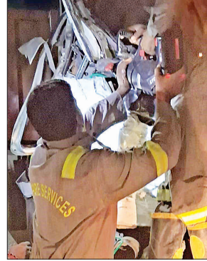
लोडर का केबिन काटते कर्मी।

ही देर में फायर स्टेशन गोमतीनगर से दमकल कर्मी मौके पर पहुंचे। पुलिस व दमकल की संयुक्त टीम ने मिलकर रेस्क्यू ऑपरेशन शुरू किया। टीम ने कटर से लोडर का