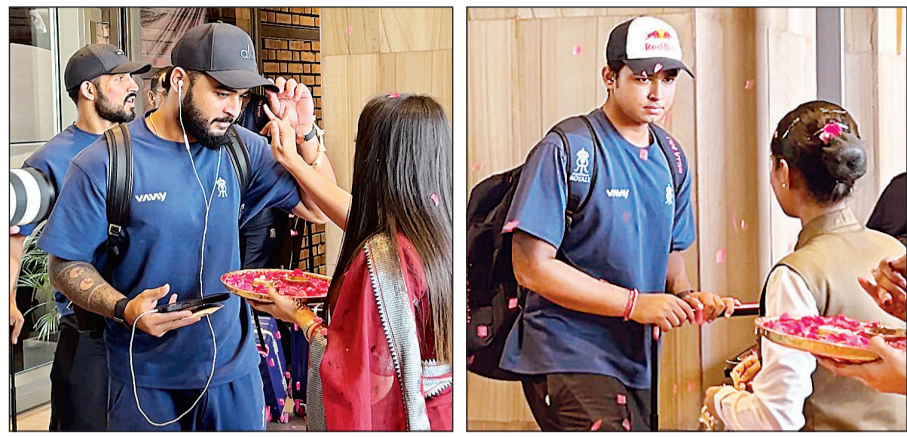
होटल पहुंचने पर खिलाड़ियों का टीका लगाकर स्वागत करती होटल की कर्मी।