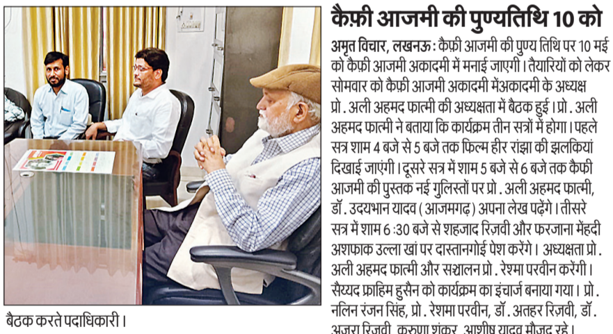
बैठक करते पदाधिकारी।