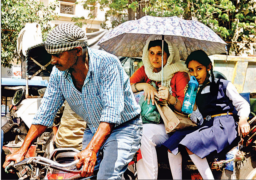
स्कूल से लौटते समय छात्रों की छांव में होने के बावजूद पानी पीती गर्मी से बेहाल छात्रा।

सोमवार को अधिकतम तापमान 41.6 और न्यूनतम तापमान 24 डिग्री सेल्सियस रहा। 20-30 किलोमीटर की रफ्तार से दिन में धूल भरी हवा चली। दोपहर में सड़कों पर आवाजाही कम रही। राहगीरों ने पेड़ों की छांव का सहारा लिया और शीतल जल से गला तर करते रहे। मौसम विभाग ने दिन में लू चलने और रात के तापमान में बढ़ोतरी की संभावना जताई है।