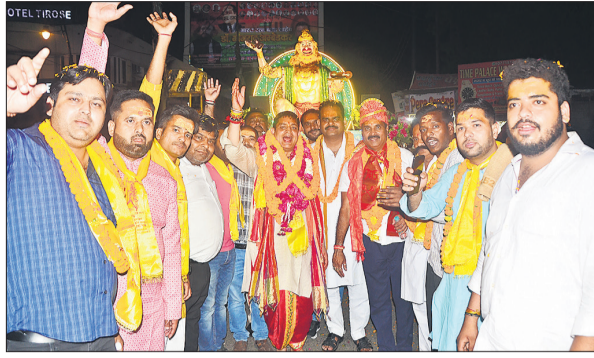
शोभायात्रा में उत्साह व्यक्त करते आयोजक व श्रद्धालु।

अमृत विचार : परशुराम जन्मोत्सव सोमवार को भी मनाया गया। परशुराम युवा मंच की ओर से भगवान परशुराम की भव्य शोभा यात्रा निकाली गई। शोभायात्रा तुलसी स्थल अलखनाथ मंदिर से शुरू होकर किला चौकी, साहूकारा, थाना किला, बड़ा बाजार, घंटाघर चौराहा, कोतवाली, नावेल्टी चौराहा होते हुए सिविल लाइंस स्थित हनुमान मंदिर पहुंची। यहां आरती के बाद शोभायात्रा का समापन हुआ। शोभायात्रा में एटा से आई गणेश, शिव-पार्वती परिवार, लक्ष्मी नारायण, हनुमान, श्रीराम परिवार, काली अखाड़ा, भगवान परशुराम और राधा-कृष्णा, महाकाल एवं जगन्नाथ जी की झांकियां विशेष आकर्षण का केंद्र रही। मथुरा से बैंड और चंदौसी का महाकाल बैंड भी शोभायात्रा में शामिल रही। यात्रा में बड़ी संख्या में श्रद्धालु शामिल हुए। यात्रा के दौरान जगह-जगह पुष्प वर्षा कर