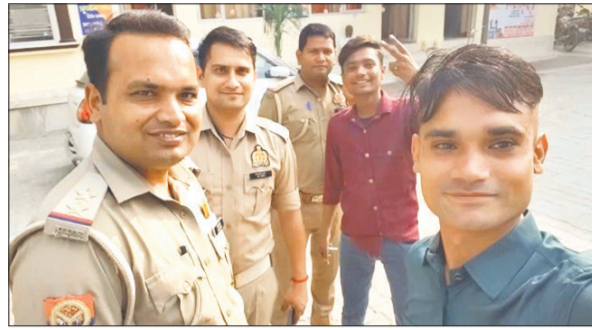
पुलिसकर्मियों के साथ आरोपी का वायरल फोटो।