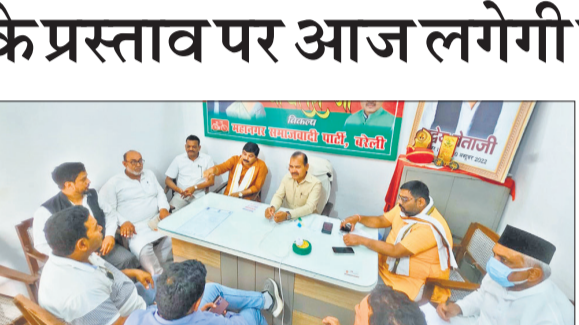
बैठक करते समाजवादी पार्टी के सभासद।

बीते दिनों हुई कार्यकारिणी की बैठक में समिति ने शहर की बुनियादी सुविधाओं, सफाई व्यवस्था और सड़क निर्माण जैसे महत्वपूर्ण मुद्दों को प्राथमिकता देते हुए 1072 करोड़ के बजट को