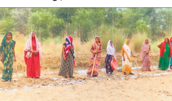
एक गांव में कार्य करती महिलाएं। (फाइल फोटो)।

अमृत विचार: केंद्र सरकार ने मनरेगा का नाम बदलकर 'वीबी जी रामजी' कर दिया, लेकिन यह बदलाव मजदूरों के चूल्हे जलाने में नाकाम साबित हो रहा है। शासन की ओर से इस नई योजना को लेकर अब तक कोई स्पष्ट गाइडलाइन जारी नहीं की है। इससे कार्ययोजनाएं ठप पड़ी हैं। खंडूजा, नाली, आंगनवाड़ी केंद्र और खेल मैदान जैसे 266 प्रकार के कार्यों पर पूरी तरह से ब्रेक लगा हुआ है। बीते दिनों मनरेगा में नाम के बदलाव के साथ ही दावा किया गया था कि योजना में कार्य दिवसों की संख्या 100 से बढ़ाकर 125 कर दी है, प्रशासनिक मदद को भी छह से बढ़ाकर नौ प्रतिशत किया है, लेकिन धरातल पर यह दावे पूरी तरह खोखले नजर आ रहे हैं। जनपद में करीब दो लाख सक्रिय मनरेगा मजदूर काम की आस में