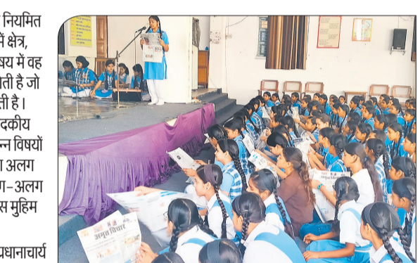
अगर आप भी जुड़ना चाहते हैं इस मुहिम से तो संपर्क करें - editorschoice@amritvichar.com

अखबार के नियमित पाठन से हमें क्षेत्र, देश, विदेश के विषय में वह जानकारी प्राप्त होती है जो सहायक सिद्ध होती है। अखबार के समाप्तिको पढ़ने से हमें विभिन्न विषयों की जानकारी मिल जाती है। जबकि अलग अलग विषय की जानकारी लेने के लिए हमें अलग-अलग पुस्तक लेनी पड़ती है। अमृत विचार की इस मुहिम बच्चों के भविष्य के लिए बेहतर होगी।