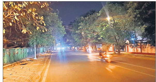
सर्किट हाउस रोड के सौंदर्यीकरण पर करोड़ों रुपये खर्च होंगे।

अमृत विचार: कंकरीट का जंगल बनते अपने शहर में कैंट से लगा एक हिस्सा अभी भी अपनी मोहक हरियाली से सुकून देता नजर आता है। उसी सुखद एहसास को और भी ज्यादा अविस्मरणीय बनाने की दिशा में नगर निगम जरूरी कदम आगे बढ़ा रहा है। ग्रीन वे नाम से पहचानी जाने वाली सर्किट हाउस रोड के सौंदर्यीकरण के लिए पांच करोड़ खर्च करने की तैयारी है। सवा किलोमीटर लंबे इस मार्ग पर दीवारों को कुछ इस तरह सजाया-संवारा जाएगा कि गुजरने वाले मेहमान स्मार्ट सिटी की विशिष्टता, समृद्ध संस्कृति और इतिहास से रूबरू हो सकें। परियोजना पर लगभग पांच करोड़