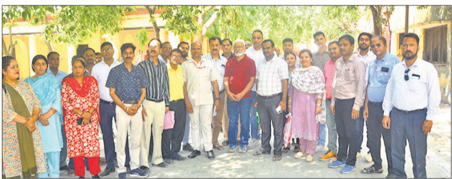
मौलाना आजाद इंटर कालेज में अत्यवस्थाओं को लेकर रोष जाहिर करते कर्मचारी।

बताया गया है कि मौलाना आजाद केंद्र की स्थिति यह थी कि सुबह नौ बजे जब कर्मचारी पहुंचते, तो कमरों में झाड़ू तक नहीं लगी थी। विरोध पर सफाई शुरू हुई, तो उड़ते धूल के गुबार ने कर्मचारियों को परेशान करके रख दिया। कक्षाओं में बेंचों पर जमी गंदगी और बदरूतजामी के बीच कर्मचारियों को घंटों बैठने पर मजबूर होना पड़ा। प्रशिक्षण सुबह 9:30 बजे शुरू होना था, लेकिन 11 बजे तक कोई भी कार्य शुरू नहीं हो सका। साढ़े ग्यारह बजे जब जैसे-तैसे सत्र शुरू हुआ, तो तकनीकी खामियों ने रास्ता रोक लिया और