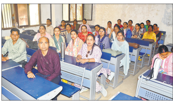
मौलाना आजाद इंटर कालेज में प्रशिक्षण कार्यशाला शुरू होने का इंतजार करते कर्मचारी।

कोई समाधान नहीं निकला। दोपहर एक बजे के लंच के बजाय खाने के पैकेट ढाई बजे के बाद पहुंचे, जिससे अधिकारियों को प्रणाली भूख से बेहाल हो गए। भोजन और पानी की बुनियादी सुविधाओं के अभाव में कर्मचारियों का धैर्य जवाब दे गया। प्रशिक्षण के नाम पर हुई इस खानापूरी का नतीजा यह रहा कि कर्मचारी दोपहर