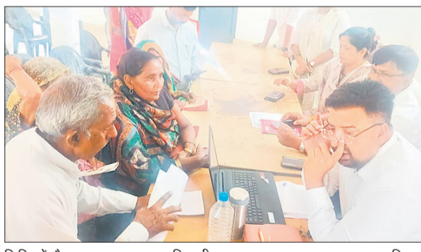
शिविर में मौजूद समाज कल्याण अधिकारी व अन्य।

समाज कल्याण विभाग के तत्वाधान में आयोजित शिविरों में लाभार्थियों की सबसे बड़ी समस्या एनपीसीआई मैपिंग और आधार प्रमाणीकरण को लेकर सामने आई।