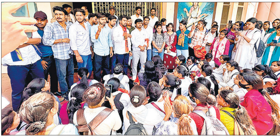
एमजेपी रुहेलखंड विश्वविद्यालय में धरना-प्रदर्शन करते अभावित के कार्यकर्ता व छात्र-छात्राएं।