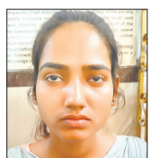
फेल होने पर रोती छात्रा।