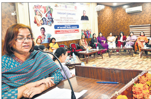
कार्यक्रम को सम्बोधित करती शिक्षाविद।