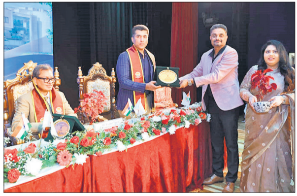
प्रतिभागी को सम्मानित करते अतिथि।