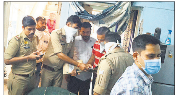
मौके पर जांच करती पुलिस।