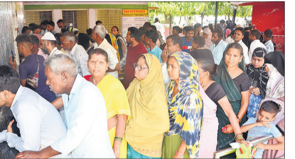
जिला अस्पताल में पचा बनवाने को जुटे मरीज।

सोमवार को जिला अस्पताल की ओपीडी में 2060 मरीजों का पंजीकरण हुआ जिसमें बुखार, उलटी-दस्त, सीने में जकड़न और त्वचा के मरीजों की संख्या अधिक रही। पचा काउंटर से लेकर दवा लेने और डाक्टर को दिखाने के लिए मरीजों को घंटों इंतजार करना