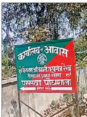
क्षेत्रीय वन अधिकारी का कार्यालय।

अमृत विचार : क्षेत्र में वन विभाग की कार्यप्रणाली एक बार फिर सवाल के घेरे में है। कथित तौर पर बड़े पैमाने पर हुए पौधरोपण में गड़बड़ी का मामला सामने आया है, जहां कागजों में लाखों पौधे लगाए जाने का दावा किया गया, लेकिन जमीनी हकीकत इससे बिल्कुल उलट नजर आई। जानकारी के अनुसार, बीते वर्षों में आदमपुर से अमदही मार्ग, बेलसर से उमरी बेगमगंज, महाराजगंज चौराहा से रामपुर खरहटा, सिगाहचंदा से लच्छीपुर और तरबगंज बाईपास से घांचा मोड़ तक करीब एक लाख अट्टाइस हजार पौधे लगाए जाने का दावा किया गया था। हालांकि, जब इन स्थानों पर पड़ताल की गई तो न तो कहीं पौधे नजर आए और न ही रोपण के कोई स्पष्ट संकेत मिले।