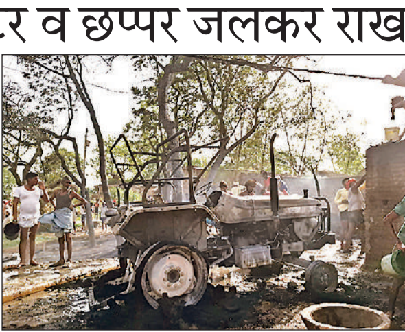
आग लगने से जला ट्रेक्टर व मकान।

के लिए राप्ती नदी में गई थी। नहाते समय दोनों गहरे पानी में चली गईं और डूबने लगीं। दोनों किशोरियों को डूबता देख आस पास मौजूद लोग बचाने के लिए दौड़े लेकिन तब तक दोनों पानी में डूबकर लापता हो गईं। सूचना परिजनों को दी गई। देखते ही देखते घटनास्थल पर ग्रामीणों की भीड़ एकत्र हो गई। लोगों ने पुलिस को सूचित किया। साथ ही गांव के ही गोताखोर किशोरियों की तलाश करने लगे। घंटों तलाश के बाद दोनों किशोरियों का शव बरामद कर लिया गया। मौके पर पहुंची पुलिस ने दोनों शवों को कब्जे में ले लिया। बताया जाता है कि दोनों परिवार के लोग कई सालों से राप्ती नदी के दूसरी तटफ खेत में घर बनाकर रहते थे। घर के पास ही राप्ती नदी बह रही है। दोपहर में दोनों परिजनों को बिना बताए घर से नहाने के लिए राप्ती नदी पहुंच गई और नहाते समय यह हादसा हो गया।