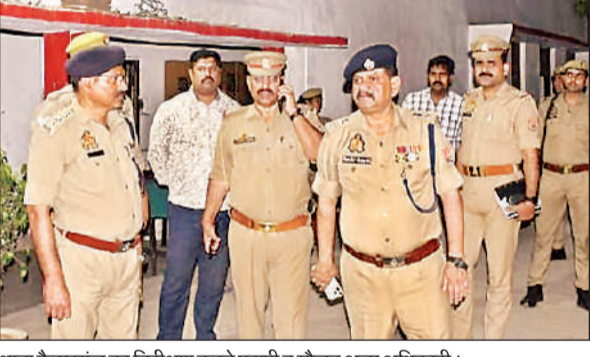
थाना केसरगंज का निरीक्षण करते एसपी व मौजूद अन्य अधिकारी।