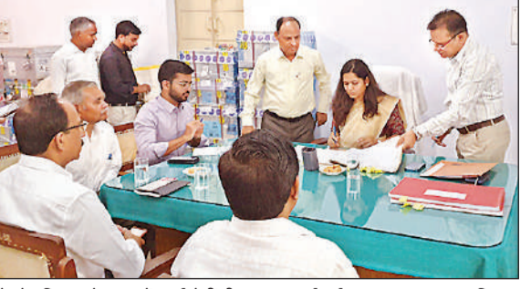
कलेक्ट्रेट स्थित कोषागार में चार्ज लेती डीएम अन्नपूर्णा गर्ग।

अमृत विचार। नवागत डीएम अन्नपूर्णा गर्ग ने मंगलवार को कमान संभाल ली है। उन्होंने जिले में 38वें डीएम के रूप में कार्यभार ग्रहण किया है। नवागत डीएम 2016 बैच की आईएएस अधिकारी हैं। इससे पहले वे विशेष सचिव, नियुक्ति एवं कार्मिक विभाग, उत्तर प्रदेश शासन के पद पर तैनात थीं। कार्यभार ग्रहण करने के बाद उन्हें गाई ऑफ आनर दिया गया। पद संभालने के बाद नवागंतुक डीएम ने कहा कि शासन की प्राथमिकताओं को सर्वोच्च प्राथमिकता देते हुए जिले में सुशासन एवं पारदर्शिता के साथ कार्य किया जाएगा। उन्होंने अधिकारियों को भी निर्देशित किया