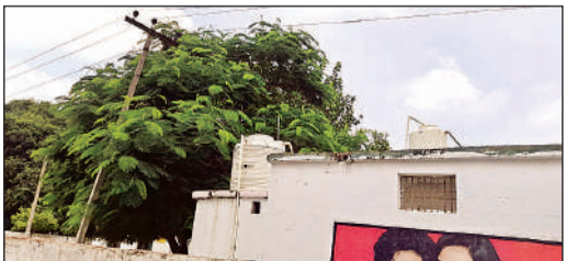
विद्यालय के ऊपर से गुजर रहा हाईटेशन बिजली का तार।

अमृत विचार। बरसात और आंधी-तूफान के बीच जलालपुर क्षेत्र के परिषदीय विद्यालयों में पढ़ने वाले नौनिहालों की सुरक्षा भगवान भरसे है। विद्यालय परिसरों के ऊपर और आसपास से गुजर रहे हाईटेशन बिजली के तार और ट्रांसफार्मर कभी भी बड़े हादसे का कारण बन सकते हैं। क्षेत्र के 29 से अधिक विद्यालय इस गंभीर खतरों की जद में हैं, जहां कतरे तीन हजार से ज्यादा बच्चे पढ़ाई करते हैं। स्थिति यह है कि कहीं