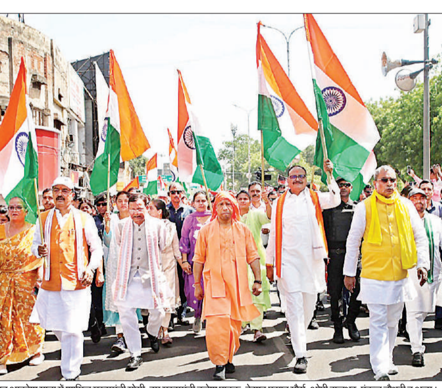
जन आक्रोश यात्रा में शामिल मुख्यमंत्री योगी, उप मुख्यमंत्री ब्रजेश पाठक, केशव प्रसाद मौर्य, औपी राजभर, पंकज चौधरी व अन्य।

कई जिलों से आई महिलाएं इस पदयात्रा में केवल राजधानी ही नहीं, बल्कि प्रदेश के विभिन्न जिलों से आई महिलाओं की भागीदारी देखने को मिली। हरदोई, बाराबंकी, उन्नाव और अयोध्या सहित कई जिलों से महिलाएं सुबह-सुबह लखनऊ पहुंचीं। छात्राएं, गृहिणियां और कामकाजी महिलाएं—हर वर्ग की भागीदारी ने इस आंदोलन को व्यापक स्वरूप दिया।