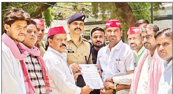
सीओ सिटी को ज्ञापन सौंपते समाजवादी पार्टी के कार्यकर्ता।