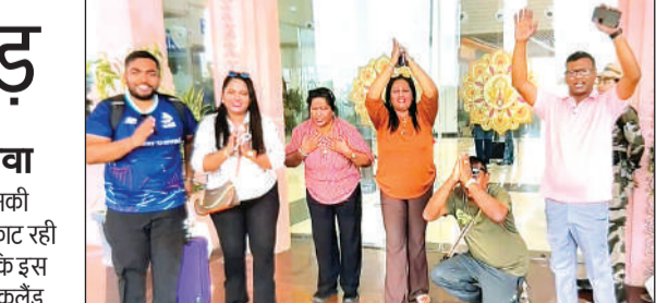
अंतर्राष्ट्रीय महर्षि वाल्मीकि एयरपोर्ट पहुंचने पर जयश्रीराम उद्घोष करते फिजी के पर्यटक।