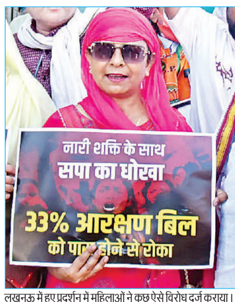
लखनऊ में हुए प्रदर्शन में महिलाओं ने कुछ ऐसे विरोध दर्ज कराया।

यूपी विधानसभा का दूसरा सत्र 30 से अमृत विचार, लखनऊ: उत्तर प्रदेश की 18वीं विधानसभा का वर्ष 2026 का द्वितीय सत्र 30 अप्रैल से शुरू होगा। विशेष सत्र का मुख्य उद्देश्य नारी शक्ति वंदन अधिनियम का संसद से पारित न होने के खिलाफ चर्चा कराना है। विधानसभा सचिवालय द्वारा जारी आदेश के अनुसार राज्यपाल आनंदीबेन पटेल ने इस सत्र को आहूत करने की मंजूरी दे दी है। विधानसभा सचिवालय प्रशासन के मुताबिक, गुरुवार 30 अप्रैल 2026 को प्रातः 11 बजे से विधानसभा मंडप, विधान भवन, लखनऊ में सत्र की कार्यवाही प्रारंभ होगी। यह सत्र वर्ष 2026 का दूसरा सत्र होगा, जिसमें सरकार विभिन्न विधायी और नीतिगत कार्यों को आगे बढ़ा सकती है। विधानसभा सचिवालय के अनुसार, सत्र बुलाने का यह निर्णय संवैधानिक प्रक्रिया के तहत लिया गया है। आमतौर पर ऐसे सत्रों में सरकार द्वारा विधेयक पेश किए जाते हैं, महत्वपूर्ण नीतिगत मुद्दों पर चर्चा होती है और विपक्ष को भी अपने मुद्दे उठाने का अवसर मिलता है।