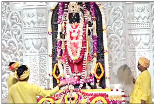
गुलाब की पंखुड़ियों से रामलला की आरती उतारते पुजारी।

अमृत विचार: चिलचिलाती धूप व गर्मी के प्रकोप का असर मंदिरों में भी पड़ रहा है। गर्भगृह में विराजमान भगवान को गर्मी से बचाने के लिए एसी, कूलर लगाए गए हैं। श्री रामलला को गर्मी से बचाने के लिए गुलाब की पत्तियों से भगवान के शरीर को ढक कर रखने के साथ दोपहर में आरती की जा रही है। राम मंदिर के एक पुजारी ने मंगलवार को बताया कि राम जन्मभूमि परिसर में विराजमान श्री रामलला बालक रूप में पूजा की जाती है। जिस प्रकार से मां अपने बच्चे की सेवा करती है उसे तरह पुजारी आने भगवान की सेवा करते हैं। इसलिए उनको मौसम के अनुसार