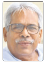
पुस्तक खान लेखक, नई दिल्ली