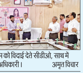
निवर्तमान डीएम को विदाई देते सीडीओ, साथ में डीएम व अन्य अधिकारी।