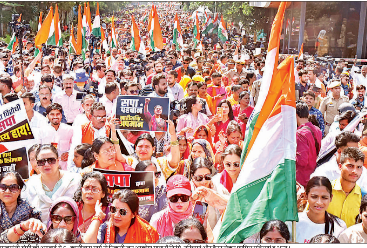
मुख्यमंत्री योगी की अगुवाई में 5-कालिदास मार्ग से निकली जन आक्रोश यात्रा में तिरंगे, तख्तियां और बैनर लेकर शामिल महिलाएं व अन्य।

पूरे मार्ग पर दिखा अनुशासन और उत्साह का अद्वितीय संगम राजधानी लखनऊ के लिए यह एक अभूतपूर्व दृश्य था, पूरी सरकार ही सड़क पर थी। हजारों महिलाओं संग मुख्यमंत्री योगी आदित्यनाथ सबसे आगे थे। उनके साथ केंद्रीय राज्य मंत्री व भाजपा प्रदेश अध्यक्ष पंकज चौधरी, उपमुख्यमंत्री केशव प्रसाद मौर्य व ब्रजेश पाठक, सहयोगी दलों के नेता, मंत्रिमंडल के सदस्यों और भाजपा की विभिन्न इकाइयों के पदाधिकारी अग्रिम पंक्ति में चल रहे थे। रैली के दौरान पूरे मार्ग पर अनुशासन और उत्साह का अद्वितीय संगम देखने को मिला। युवा, वृद्ध, छात्राएं और कामकाजी महिलाएं, हर वर्ग की सक्रिय भागीदारी रही। जमाह-जमाह आम जनता ने भी तालियों और नारों के साथ इस पदयात्रा का समर्थन-स्वागत और फूल भी बरसाए।