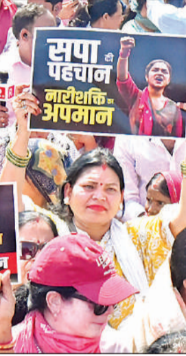
सपा के विरोध में बैनर लहराती महिला।

सूरज से अधिक धधकता दिखा महिलाओं का आक्रोश सुबह करीब 10 बजे मुख्यमंत्री आवास से प्रारंभ हुई इस पदयात्रा के समय भी गुमने वाली तेज धूप थी, लेकिन महिलाओं का आक्रोश उससे कहीं अधिक धधक रहा था। सुबह 7 बजे से ही मुख्यमंत्री आवास पर महिलाओं का जुटना शुरू हो गया था। हाथों में विपक्ष को कुत्सित राजनीति की निंदा करते हुए रस्तेगार लिखी हुई तख्तियां और 'बहन-बेटियों का अपमान-नहीं सहेंगा हिंदुस्तान, महिला अधिकारों पर वार-सपा-कांग्रेस जिम्मेदार, कांग्रेस का हाथ-नारी शक्ति के खिलाफ, नारी के सम्मान में-एनडीए मैदान में' जैसे गुंजते नारों के साथ यह रैली विपक्ष को बेनकाब करती हुई आगे बढ़ी। हर कदम पर महिलाओं का हुजूम साफ संदेश दे रहा था कि आधी आबादी के सम्मान और अधिकारों पर कोई समझौता नहीं, कोई चुपौती नहीं, कोई माफी नहीं। महिलाओं ने सपा और कांग्रेस के विरुद्ध नारेबाजी की और विपक्ष की महिला-विरोधी मानसिकता को खुलकर चुनौती दी।