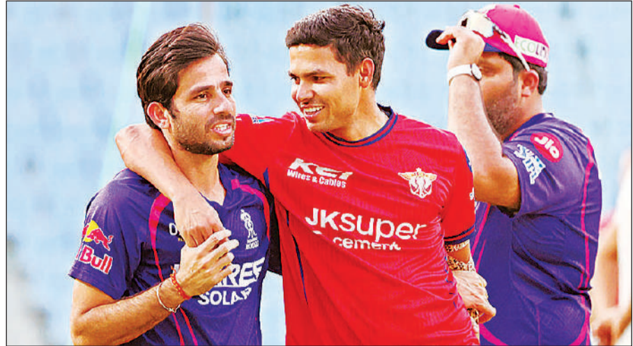
अग्र्यास के दौरान एक दुसरे से मिलते एलएसजी व राजस्थान रॉयल्स के खिलाड़ी।