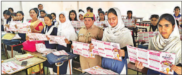
छात्राओं को फंफलेट वितरित कर जागरूक करती महिला पुलिसकर्मी।