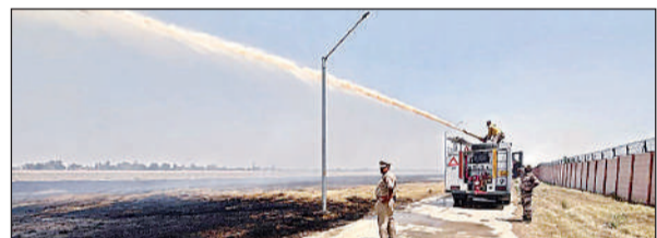
एयर साइड में लगी आग बुझाता फायर टेंडर।