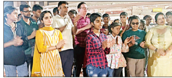
रामलला के दर्शन करने पहुंचे दृष्टि बाधित बच्चे।

अमृत विचार : भव्य राम मंदिर में बालक रामलला के दर्शन करने मंगलवार को हरियाणा से 30 दृष्टि बाधित बच्चे पहुंचे। बच्चे श्रीराम की प्रतिमा के समक्ष हाथ जोड़े, चेहरे पर अट्टट विश्वास एवं भ्रद्धा के भाव लिए नेत्र बंद किए खड़े हुए तो वहां मौजूद अन्य भक्त अपलक उन्हें ही निहारते रहे। रामलला के दर्शन के बाद इन बच्चों का उत्साह उल्लास वन कर जय श्री राम के जयकारों से फूट पड़ा। एक स्वर में बच्चों के बोल गूंज उठे - बोले ऐसा आभास हो रहा है जैसे हम स्वर्ग में आ गए हों। बच्चों ने कहा कि भगवान ने हम सभी को