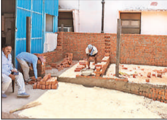
ऑक्सीजन प्लांट के बगल चल रहा निर्माण कार्य।

अयोध्या, अमृत विचार : जिला अस्पताल में ऑक्सीजन सिलेंडर रिफिलिंग कराने के लिए ऑक्सीजन प्लांट के बगल में भवन निर्माण शुरू कराया गया है। अगर सब कुछ ठीक रहा तो अगले दो महीने में यहां सिलेंडर रिफिलिंग का कार्य शुरू हो जाएगा और अस्पताल को दोहरी चपत भी नहीं लगेगी। अमृत विचार ने इस संकाशन 21 जनवरी 2025 को खबर का प्रकाशन किया था।