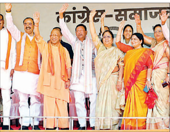
लखनऊ में आयोजित 'जन आक्रोश महिला पद यात्रा' में सम्मिलित मुख्यमंत्री योगी।

हजारों महिलाओं का हुजूम कांग्रेस-सपा समेत विपक्षी दलों के खिलाफ बैनर-पोस्टर और तख्तियों के साथ आक्रोशित नजर आया। मुख्यमंत्री योगी ने विपक्ष पर महिला विरोधी राजनीति करने का आरोप लगाते हुए कहा कि आधी आबादी अब सबक सिखाएंगी। मुख्यमंत्री आवास से प्रारंभ होकर सिविल हॉस्पिटल होते हुए विधान भवन तक पहुंची इस रैली को संबोधित करते हुए मुख्यमंत्री