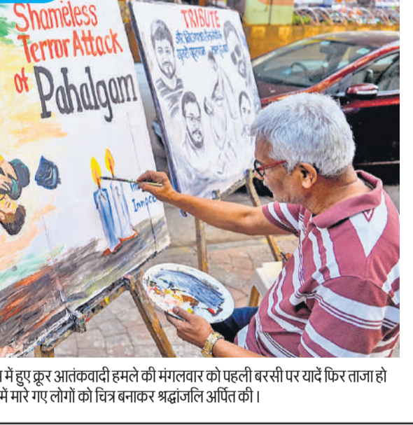
जम्मू-कश्मीर के पर्यटन स्थल पहलगाम में हुए कूर आतंकवादी हमले की मंगलवार को पहली बरस पर यादें फिर ताजा हो गईं। मुंबई में एक कलाकार ने इस हमले में मारे गए लोगों को चित्र बनाकर श्रद्धांजलि अर्पित की।