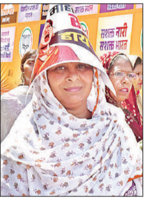
धूप से बचने को सिर पर फंकेट पहने महिला।