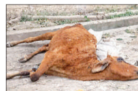
गौशाला के सामने बीमार पड़ी गाय।

परसपुर, गोंडा, अमृत विचार : नगर पंचायत कार्यालय के बगल स्थित गौशाला के सामने एक गंभीर तस्वीर सामने आई है। चिलचिलाती धूप में एक गाय दो दिन से तड़प रही है, लेकिन जिम्मेदारों ने कोई सुध नहीं ली। सड़क किनारे पड़ी यह गाय जिंदगी और मौत के बीच जूझती रही, जबकि आसपास मौजूद लोग तमाशबीन बने रहे।