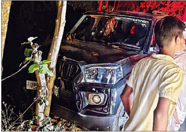
घटना के बाद पेट से टकराई कार।