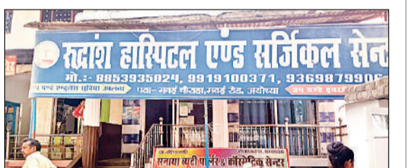
मवई चौराहा स्थित रुद्रांश हॉस्पिटल।