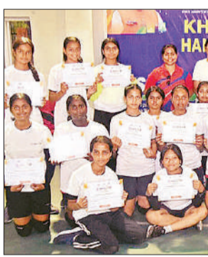
हैंडबॉल में विजेता केडी सिंह स्टेडियम की टीम।