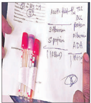
पंच पर लिखा निजी लैब का नाम

आयुष्मान योजना के लाभार्थी हैं। सोमवार सुबह उन्हें इलाज के लिए