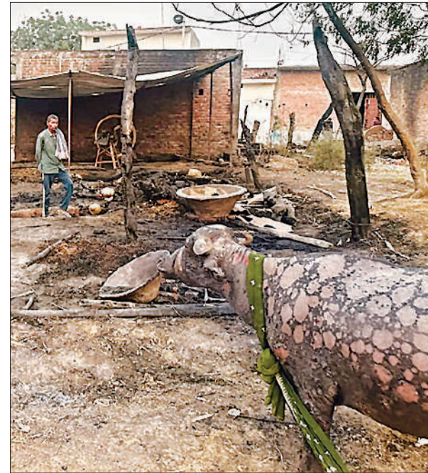
दुबग्गा के मलहा गांव में आग लगने से झुलसी भैंस।

समय से नहीं पहुंची गाड़ियां: ग्रामीणों का आरोप है कि आग लगते ही ग्रामीणों ने पुलिस और अग्निशमन विभाग को सूचना दी। इसके बाद भी अग्निशमन विभाग