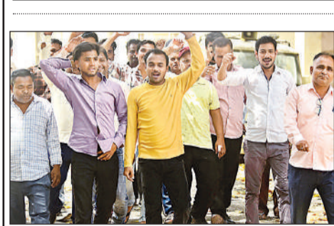
लविवि में विरोध प्रदर्शन करते आउटसोर्स कर्मचारियों।