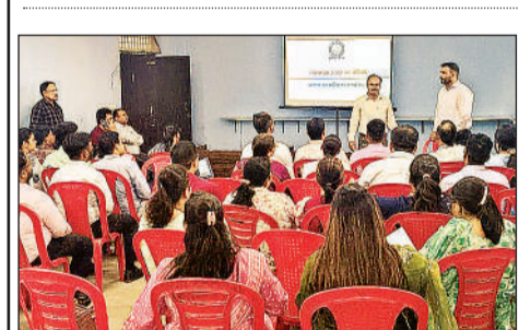
जनगणना प्रशिक्षण कार्यक्रम में उपस्थित सुपरवाइजर और प्रमाणक।