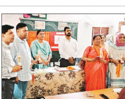
सम्मानित किए गए शिक्षक।