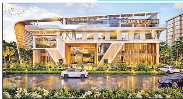
गोमती नगर विस्तार कम्प्यूनिटी सेंटर का मॉडल।

लिए मल्टीपुर्पज हॉल व लॉन के साथ ही किचन, डाइनिंग एरिया, आठ कमरे व दो सुइट होंगे। इसके अलावा इन्डोर गेम्स, जिम, योगा सेंटर, कैफेटेरिया व स्वीमिंग पूल की भी सुविधा रहेगी। बिल्डिंग के रूफ टॉप पर सोलर पैनल लगाए जाएंगे। इससे विद्युत व्यय भार नियंत्रित रहेगा। बिल्डिंग की डिजाइन काफी आकर्षक होगी।