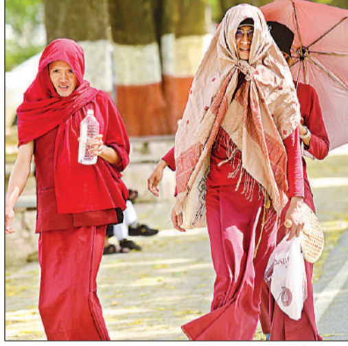
लविवि में खुद को धूप से बचाने के लिए दुपट्टे से सिर ढककर जाती छात्राएं।