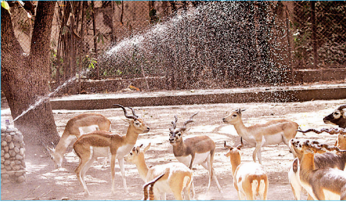
नाबब वाजिद अली शाह प्राणि उद्यान में गर्मी से राहत पानी के लिए रिस्कलर से निकलते पानी के नीचे खड़े हिरन।

मौसम विभाग ने सुझाव दिया है कि लू से बचाव के लिए बच्चों, बुजुर्ग और बीमार व्यक्तियों को एहतियात बरतने की जरूरत है। धूप में अधिक देर तक काम करने से लू लगने की संभावना है। सुबह 11 से दोपहर 3 बजे के बीच धूप से पेट में ऐंठन और घमीरियां हो सकती हैं। मौसम विभाग ने बचाव के लिए सुझाव दिया है कि दोपहर के समय धूप में निकलने से बचें। ढीले, हल्के और सूती वस्त्र पहनें। धूप में निकलते समय सिर पर गमछा, टोपी या छाते