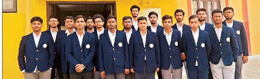
जेईई में सफलता हासिल करने वाले महामना शिक्षण संस्थान के छात्र।

अमृत विचार: खेतों में काम करने वाले संसाधनों विहीन ग्रामीण छात्रों को अजुनगंज स्थित महामना शिक्षण संस्थान मार्गदर्शन मिला तो ऊंची छलांग लगा दी। इस शिक्षण संस्थान के 15 छात्रों को पहले ही प्रयास में आईआईटी जेईई में सफलता मिली।