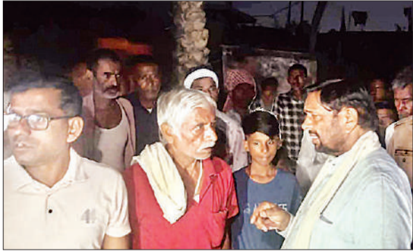
पीड़ितों से मिलकर सात्वना देते पूर्व केंद्रीय मंत्री कौशल किशोर।