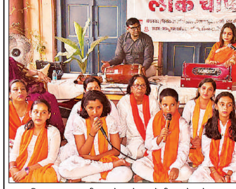
महाकवि सूरदास जयन्ती पर लोक चौपाल में गीत गाते बच्चे।