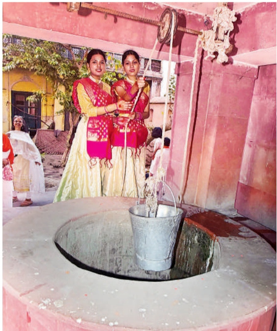
डालीगंज लल्लूमल धर्मशाला में कुओं पानी भरकर निकालती किशोरियां।