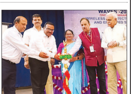
दीप प्रज्वलित करते मुख्य अतिथि व अन्य।