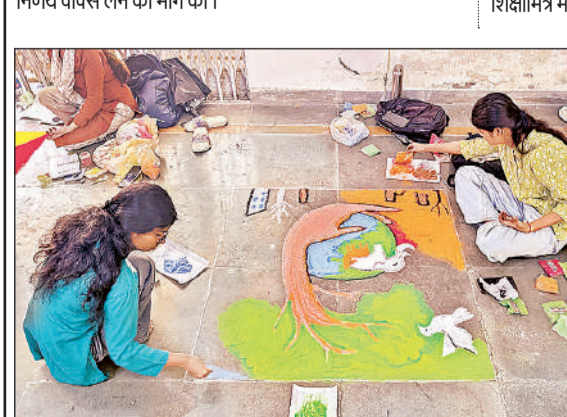
पृथ्वी दिवस पर छात्राएं चित्रों के माध्यम से अपनी भावनाएं व्यक्त करती हुई।