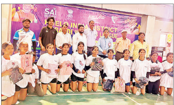
कबड्डी की विजेता जीजीआईसी विकासनगर की टीम।

भारत रत्न अटल बिहारी वाजपेयी कबड्डी प्रतियोगिता में आयोजित कबड्डी प्रतियोगिता में जीजीआईसी विकासनगर ने फाइनल में दयानंद