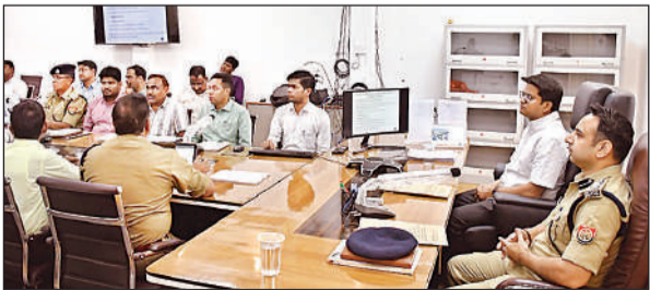
बैठक करते डीएम व एसपी।

जिलाधिकारी ने कहा कि संबंधित अधिकारीगण अपनी सभी तैयारियां परीक्षा से पूर्व मानकों के