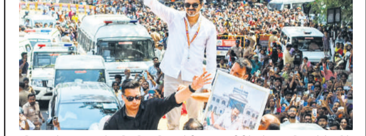
तमिलनाडु में चुनाव प्रचार के अंतिम दिन तमिलनाडु वेट्री कझगम (टीवीके) के प्रमुख विजय ने चेन्नई में रोड शो कर वोट मांगे। विजय की नई पार्टी ने राज्य में मुकाबले को त्रिकोणीय बना दिया है।