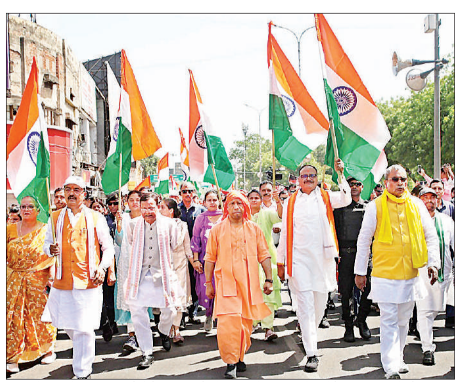
जन आक्रोश यात्रा में शामिल मुख्यमंत्री योगी, उप मुख्यमंत्री ब्रजेश पाठक, केशव प्रसाद मौर्य, औपी राजभर, पंकज चौधरी व अन्य।

में शामिल महिलाओं के समर्थन में नारे लगाए। विधान भवन के सामने समापन पर मुख्यमंत्री ने सभी महिलाओं का आभार जताते हुए कहा कि यह आक्रोश नारी सम्मान के लिए है और इसे नजरअंदाज नहीं किया जा सकता।