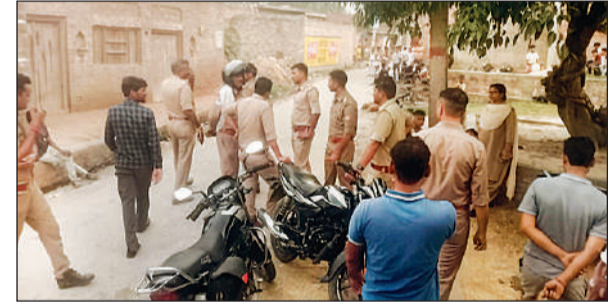
मौके पर जांच-पड़ताल करती पुलिस।

अमृत विचार: पचदेवरा थाने के सहसोगा गांव में दो पक्षों के बीच हुए झगड़े में मंगलवार की देर शाम फायरिंग होने की बात सामने आई है, आरोप है कि हवाई फायर में गोली एक कर में लगी। पुलिस के मुताबिक, मौके से उन्हे कार नहीं मिली। सीसीटीवी में भी कोई सुराग नहीं लगा है। मामले की गहनता से जांच की जा रही है।