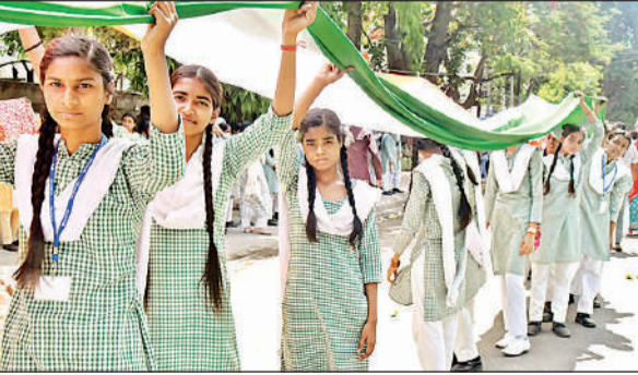
5-कालीदास मार्ग से निकली जन आक्रोश यात्रा में शामिल छात्राएं।

■ नारी शक्ति वंदन अधिनियम को लेकर राजनीतिक टकराव तेज हो गया है। यह विधेयक लोकसभा और राज्य विधानसभाओं में महिलाओं को 33 प्रतिशत आरक्षण देने का प्रावधान करता है। सत्तापक्ष का आरोप है कि विपक्ष ने संसद में इसे पारित होने से रोकने की कोशिश की, जबकि विपक्ष इस पर प्रक्रिया और अन्य मुद्दों को लेकर सवाल उठाता रहा है। यही कारण है कि यह विधेयक अब राजनीतिक बहस के केंद्र में आ गया है। सत्तरुद दल इसे महिला सशक्तिकरण का ऐतिहासिक कदम बता रहा है, जबकि विपक्ष इसे अंधा या राजनीतिक रूप से प्रेरित बता रहा है।