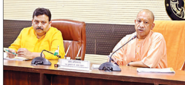
प्रधानमंत्री के संभावित दौरे के दृष्टिगत सिकंदर हाउस में समीक्षा बैठक करते मुख्यमंत्री योगी।