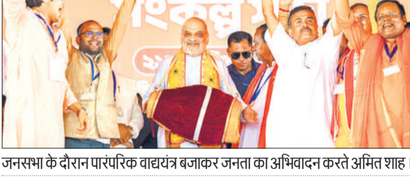
जनसभा के दौरान पारंपरिक वाद्ययंत्र बजाकर जनता का अभिवादन करते अमित शाह।

केंद्रीय गृह मंत्री अमित शाह ने मंगलवार को आरोप लगाया कि पश्चिम बंगाल की मुख्यमंत्री ममता बनर्जी घुसपैठियों को संरक्षण, और वंशवादी राजनीति को बढ़ावा दे रही हैं। राज्य में बाबरी मस्जिद के समान मस्जिद बनाने के प्रयासों का समर्थन कर रही हैं, जिसे भाजपा किसी भी हालत में स्वीकार नहीं करेगी। शाह ने पश्चिम मेदिनीपुर जिले के शालबनी में चुनाव के पहले चरण से पहले एक रैली को संबोधित करते हुए इस चुनावी मुकाबले को सीधे भाजपा और सत्तारूढ़ तृणमूल कांग्रेस के बीच वैचारिक लड़ाई के रूप में पेश करने की कोशिश की। उन्होंने कहा कि इस बार पश्चिम बंगाल