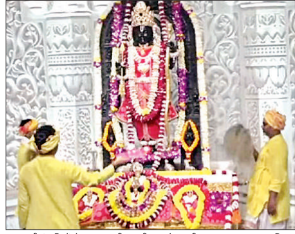
गुलाब की पंखुड़ियों से रामलला की आरती उतारते पुजारी।