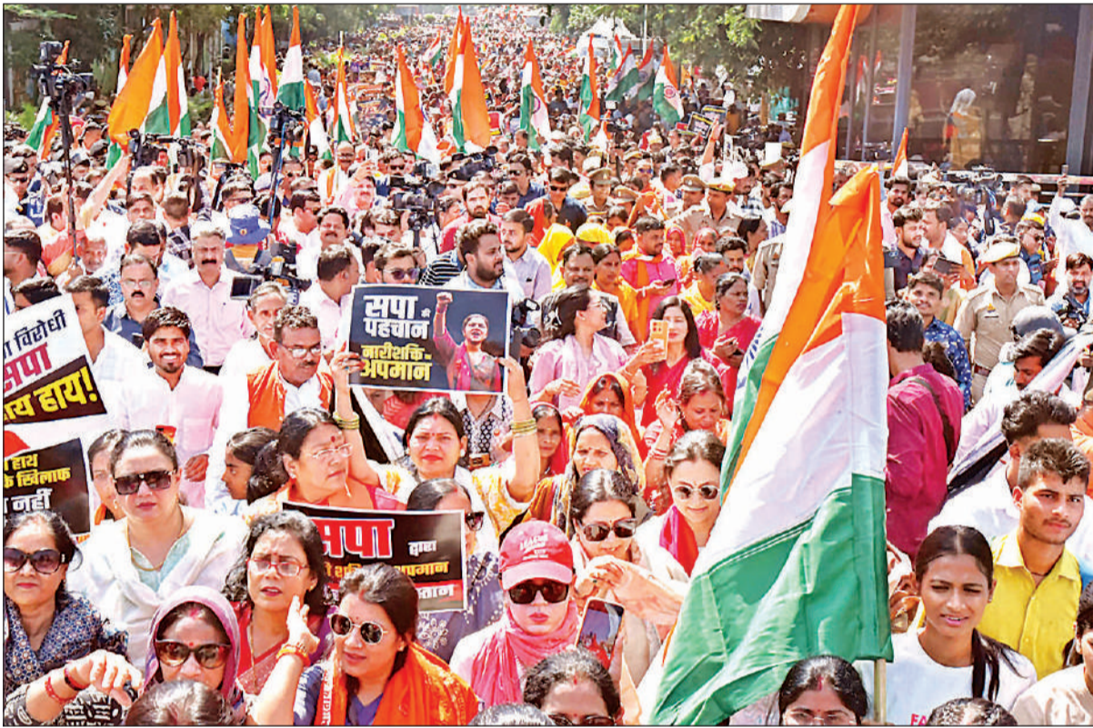
मुख्यमंत्री योगी की अगुवाई में 5-कालीदास मार्ग से निकली जन आक्रोश यात्रा में तिरंगे, तख्तियां और बैनर लेकर शामिल महिलाएं व अन्य।

जैसे-जैसे दिन चढ़ा और धूप तेज होती गई, वैसे-वैसे महिलाओं का जोश और आक्रोश भी बढ़ता गया। हाथों में पोस्टर-बैनर लिए महिलाएं समाजवादी पार्टी और कांग्रेस के खिलाफ नारेबाजी करती नजर आईं। पदयात्रा शुरू होने से पहले ही मुख्यमंत्री आवास के बाहर हजारों महिलाओं का हुजूम जुट चुका था।