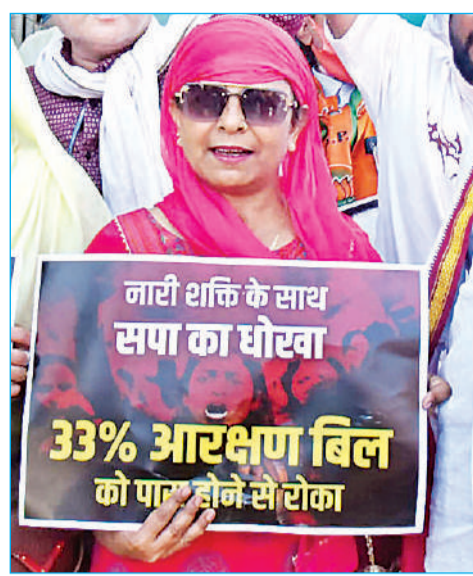
लखनऊ में हुए प्रदर्शन में महिलाओं ने कुछ ऐसे विरोध दर्ज कराया।