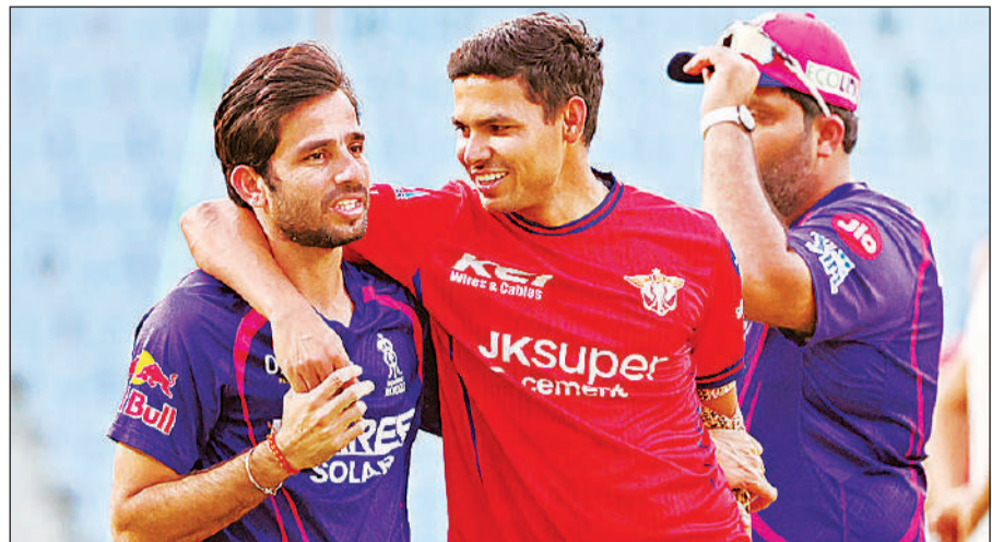
अध्यास के दौरान एक दुसरे से मिलते एलएसजी व राजस्थान रॉयल्स के खिलाड़ी।

एडन मारक्रम टीम के सबसे अच्छे बल्लेबाज नजर आए हैं जिन्होंने छह पारियों में 160 की स्ट्राइक-रेट से 162 रन बनाए हैं। क्या आरआर के ओपनर्स को परेशान करेंगे प्रिंस? आरआर के ओपनर बल्लेबाजों ने