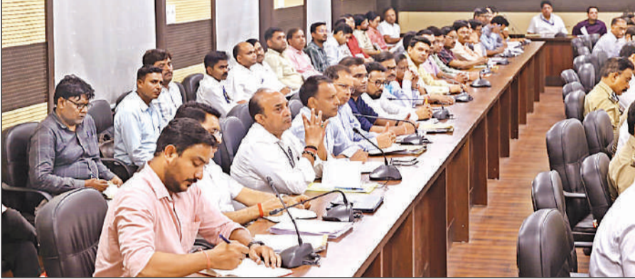
प्रधानमंत्री के संभावित दौरे के दृष्टिगत सिकंदर हाउस में समीक्षा बैठक में मौजूद अधिकारी।

अमृत विचार, लखनऊ: रेलवे ने सत्याग्रह एक्सप्रेस, वैशाली एक्सप्रेस, आग्रपाली एक्सप्रेस तथा सिलचर एक्सप्रेस में अवैध वेंडरों के विरुद्ध जांच की गई। इसमें 1126 अधोमानक पेयजल बोतलें पकड़ी गईं। ये बोतलें एल.पी.ओ. में जमा करा ली गईं। दो अनाधिकृत वेंडरों को रेलवे सुरक्षा बल को सौंपा गया। मंडल प्रशासन ने इसके साथ ही यात्रियों से अपील की गई है कि स्टेशनों से और फुट ओवर ब्रिज पर अनावश्यक भीड़ न लगाएं, निर्धारित स्थानों से ही रेलवे ट्रेक पार करें।