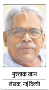
पुस्तक खान लेखक, नई दिल्ली