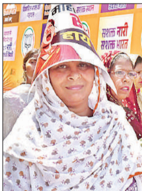
धूप से बचने को सिर पर फंफटेत पहना महिला।

■ राजधानी लखनऊ के लिए यह एक अभूतपूर्व दृश्य था, पूरी सरकार ही सड़क पर थी। हजारों महिलाओं संग मुख्यमंत्री योगी आदित्यनाथ सबसे आगे थे। उनके साथ केंद्रीय राज्य मंत्री व भाजपा प्रदेश अध्यक्ष पंकज चौधरी, उपमुख्यमंत्री केशव प्रसाद मौर्य व ब्रजेश पाठक, सहयोगी दलों के नेता, मंत्रिमंडल के सदस्यों और भाजपा की विभिन्न इकाइयों के पदाधिकारी अग्रिम पंक्ति में चल रहे थे। रैली के दौरान पूरे मार्ग पर अनुशासन और उत्साह का अद्वितीय संगम देखने को मिला। युवा, वृद्ध, छात्राएं और कामकाजी महिलाएं, हर वर्ग की सक्रिय भागीदारी रही। जगह-जगह आम जनता ने भी तालियों और नारों के साथ इस पदयात्रा का समर्थन-स्वागत और फूल भी बरसाए।