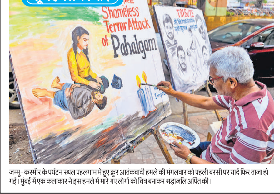
जम्मू-कश्मीर के पर्यटन स्थल पहलगाम में हुए कूर आतंकवादी हमले की मंगलवार को पहली बरसी पर यादें फिर ताजा हो गईं। मुंबई में एक कलाकार ने इस हमले में मारे गए लोगों को चित्र बनाकर श्रद्धांजलि अर्पित की।