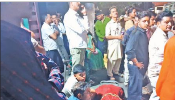
रानीबाग वन चौकी पर महिला का शव रखकर धरना प्रदर्शन करते ज्योली के ग्रामीण।