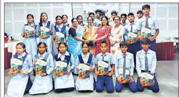
विद्यालय के बच्चों को सम्मानित करते फाउंडेशन के सदस्य।