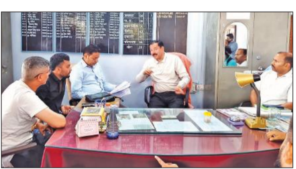
चकरपुर इंटर कॉलेज में जनता की हासिल करते उच्चाधिकारी। ● अमृत विचार

अमृत विचार : चकरपुर स्थित गोविंद बल्लभ पंत इंटर कॉलेज में शिक्षा के मंदिर को कलंकित करने वाला मामला सामने आया है। छात्राओं के साथ छेड़छाड़ करने के आरोपी एक सहायक अध्यापक को लेकर बुधवार को कॉलेज परिसर युद्ध के मैदान में तब्दील हो गया। आक्रोशित महिलाओं, ग्रामीणों और विभिन्न संगठनों ने कॉलेज में जमकर हंगामा किया और आरोपी शिक्षक को जमकर धुनाई कर दी। मामले की गंभीरता को देखते हुए विभाग ने आरोपी शिक्षक को निलंबित कर दिया है, वहीं लापरवाही बरतने पर खंड शिक्षा अधिकारी