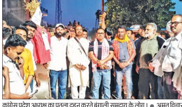
कांग्रेस प्रदेश अध्यक्ष का पुतला दहन करते बंगाली समुदाय के लोग।