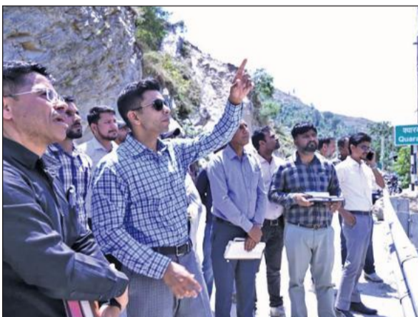
क्वारब स्लाइड जॉन में चल रहे सुधारीकरण कार्यों का निरीक्षण करते जिलाधिकारी।

निरीक्षण के दौरान डीएम ने स्लाइड जॉन में चल रहे कार्यों की प्रगति और शेष कार्यों की जानकारी ली। उन्होंने कहा कि कार्यों को तेजी से पूरा किया जाए तथा मजदूरों और मशीनों ऑपरेटर्स की सुरक्षा मानकों के अनुरूप सुनिश्चित की जाए। उन्होंने कहा कि यह मार्ग अल्मोड़ा,