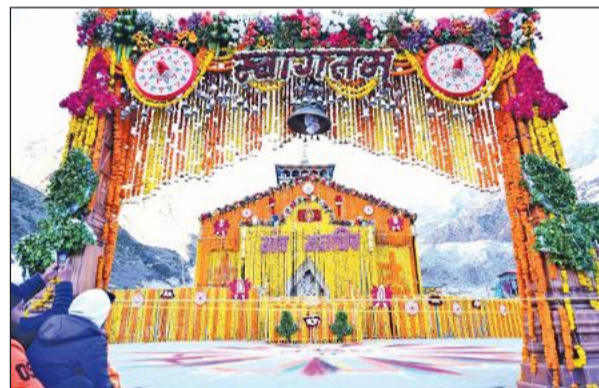
आकर्षक तरीके से सजाया गया श्री केदारनाथ धाम।

है। केदारनाथ धाम, जहां भक्ति, तप और श्रद्धा का संगम होता है, वहीं से प्रधानमंत्री का यह भावपूर्ण संदेश करोड़ों श्रद्धालुओं के हृदय को स्पर्श कर रहा है। मुख्यमंत्री ने कहा कि आध्यात्मिक दृष्टि से देखा जाए तो प्रधानमंत्री का यह संवाद करोड़ों देशवासियों के मार्गदर्शन के साथ ही चारधाम यात्रा को आत्मिक जागरण यात्रा के रूप में भी स्थापित करता है। बाबा केदार के धाम में गूंजता 'हर हर महादेव' का उद्घोष, प्रधानमंत्री की इस श्रद्धाभिव्यक्ति के साथ और अधिक भावपूर्ण हो उठा है, और देशभर के श्रद्धालुओं में भक्ति का उत्साह नई ऊंचाइयों पर पहुंच रहा है।