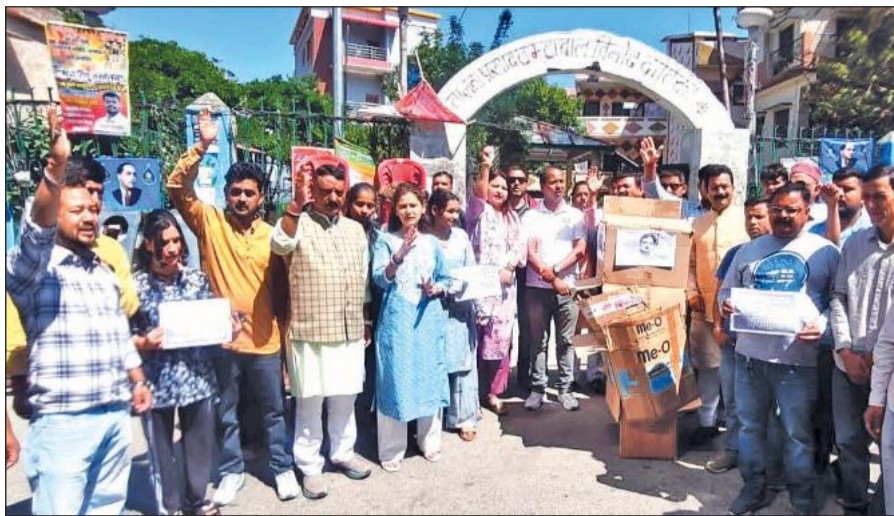
अल्मोड़ा के चौधानपाटा में बुधवार को कांग्रेस का पुतला फूँकते भाजपा कार्यकर्ता।