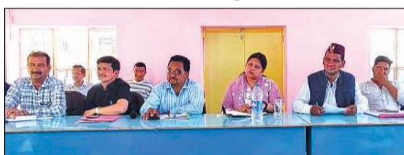
हवालबाग ब्लॉक में आयोजित प्रधान संगठन की बैठक में मौजूद जनप्रतिनिधि व अन्य।

ब्लॉक सभागार में आयोजित बैठक में प्रधानों ने मानदेय और भत्तों में वृद्धि की मांग की। साथ ही राशन कार्ड से संबंधित समस्याओं, मनरेगा एवं अन्य विकास कार्यों के भुगतान में हो रही देरी और विभागीय वेबसाइटों के बार-बार बंद रहने पर असंतोष व्यक्त किया गया। मनरेगा के माध्यम