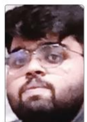
सक्षम सिन्हा छात्र

कैम्पस के बारे में पहले से सुनी बातों-यूनियनबाजी, गुटबंदी और झगड़े-मन में डर पैदा कर रही थीं। क्लास में जाने का साहस ही नहीं जुटा पा रहा था। तभी मैदान में कुछ सीनियर्स ने रोक लिया और वहीं मेरी 'क्लास' लग गई। किसी ने मेरे चश्मे और बालों में तेल देखकर मजाक उड़ाते हुए 'चम्पू' कह दिया। उस क्षण मैं बेहद असहज और छोटा महसूस करने लगा। आत्मसम्मान को ठेस पहुंची और मन भीतर तक आहत हो गया। उस दिन मैं बिना कुछ किए ही घर लौट आया और बिस्तर पर आँधे मुँह लेटकर देर तक रोता रहा। लगा जैसे यह दुनिया मेरे लिए नहीं बनी है। लेकिन अगले ही दिन हालात बदलने लगे। कुछ पुराने दोस्त घर आए, जिन्होंने उसी कॉलेज में दाखिला लिया था। उनसे खुलकर बात करने पर मन हल्का हुआ और भीतर कहीं हिम्मत जागी। उनके साथ कॉलेज जाना शुरू किया तो सब कुछ धीरे-धीरे आसान लगाने लगा। साथ में क्लास करना, लंच शेयर करना और कैम्पस में घूमना-इन छोटी-छोटी बातों ने मेरे अंदर आत्मविश्वास भर दिया। समय के