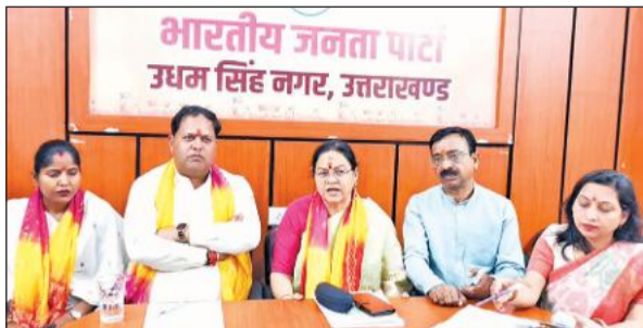
पत्रकारों से वार्ता करती दर्जा राज्य मंत्री शांति मेहरा। ● अमृत विचार

दर्जा राज्य मंत्री शांति मेहरा ने कहा कि जो बिल 1996 में आया था, उसे पारित होने में 27 साल लग गए। 2010 में भी इसे एक ही सदन में पास होने दिया गया। उन्होंने कहा कि 2023 में जब मोदी सरकार यह ऐतिहासिक कानून लेकर आई, तब भी विपक्षी दलों ने इसका विरोध किया। मेहरा ने जोर दिया कि 'बेटी बचाओ-बेटी पढ़ाओ' और 'स्वच्छ भारत अभियान' जैसी योजनाओं ने महिलाओं के आत्मविश्वास और समाज की सोच को बदला है।