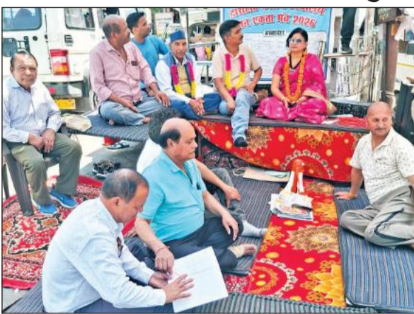
द्वाराहाट में बुधवार को आमरण अनशन पर बैठे आंदोलनकारी।