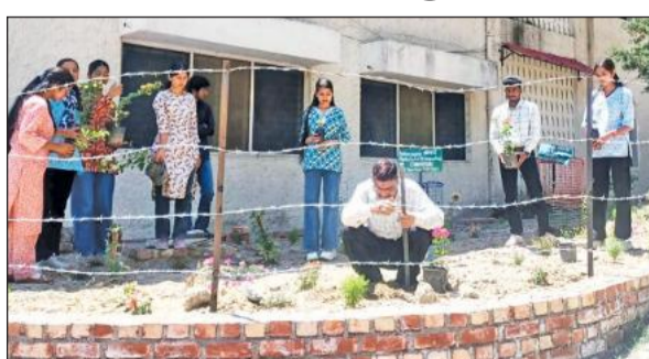
पृथ्वी दिवस पर पौधारोपण करते छात्र।