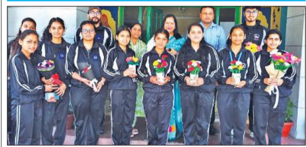
भीमताल स्थित एचजी डिग्री कॉलेज में पृथ्वी दिवस कार्यक्रम में मौजूद छात्रों।