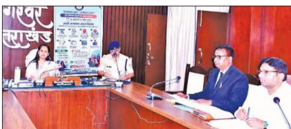
बागेश्वर में अधिकारियों की बैठक लेती डीएम आकांक्षा कोडे।

अमृत विचार: जिलाधिकारी आकांक्षा कोडे ने राजकीय नर्सरी के जीर्णोद्धार और विकास के लिए गंभीरता से कार्ययोजना तैयार करने के निर्देश दिए हैं। आयोजित बैठक में जिलाधिकारी ने जिला उद्यान अधिकारी से नर्सरी में वर्तमान में उगाए जा रहे पौधों, उनकी प्रजातियों, उत्पादन क्षमता तथा विपणन व्यवस्था की विस्तृत जानकारी ली। उन्होंने कहा कि नर्सरी को आदर्श एवं आत्मनिर्भर इकाई के रूप में विकसित करने के लिए टोस और व्यवहारिक कार्ययोजना तैयार की जाए। जिलाधिकारी ने नर्सरी