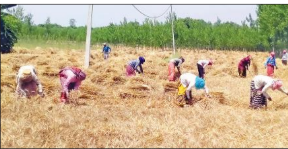
दिनेशपुर में जमीन पर गिरी फसल की कटाई करते किसान।