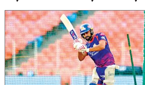
अभ्यास सत्र के दौरान रोहित शर्मा।

रोहित (हैमस्ट्रिंग) और धोनी (पिंडली में खिंचाव) वापसी की राह पर हैं, लेकिन यह देखना बाकी है कि क्या इनमें से कोई भी इस महत्वपूर्ण मुकाबले के लिए वानखेड़े स्टेडियम में मैदान पर उतरेगा। रोहित ने मंगलवार को वैकल्पिक अभ्यास सत्र में भाग नहीं लिया लेकिन वर्तमान टूर्नामेंट में अभी तक एक भी मैच नहीं खेलने वाले धोनी ने जमकर अभ्यास किया। इससे उनकी ईपैक्ट प्लेयर के रूप में वापसी की संभावना बन गई है। इन दोनों दिग्गज खिलाड़ियों की वापसी इसलिए भी महत्वपूर्ण मानी जा रही है कि अब तक पांच-पांच खिलात