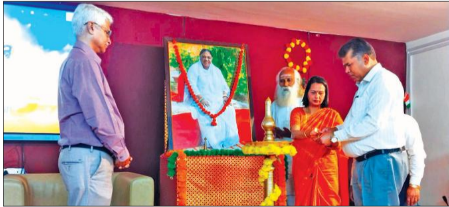
राष्ट्रीय कार्यशाला का दीप प्रज्वलन कर शुभारंभ करते अतिथि, साथ में आयोजक।