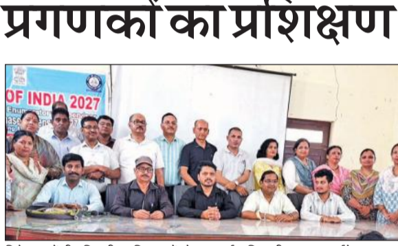
दिनेशपुर में तीन दिवसीय प्रशिक्षण में मौजूद चार्ज अधिकारी, प्रगणक पर्यवेक्षक।