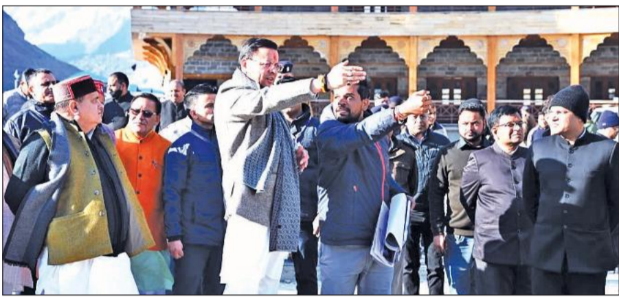
बद्दीनाथ धाम में विकास कार्यों का निरीक्षण करते मुख्यमंत्री पुष्कर सिंह धामी।

मुख्यमंत्री ने निर्देशित किया कि बद्दीनाथ धाम से जुड़े सभी विकास कार्य जिलाधिकारी की प्रत्यक्ष निगरानी में तय समयसीमा के भीतर उच्च गुणवत्ता के साथ पूर्ण किए जाएं। कहा कि यह परियोजना केवल एक निर्माण कार्य नहीं,