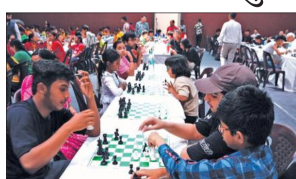
प्रतियोगिता में प्रतिभाग करते खिलाड़ी।