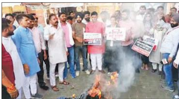
काशीपुर में एम्पी चौक पर कांग्रेस का पुतला फूँकते भाजयुमो कार्यकर्ता।