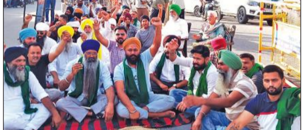
बाजपुर, भरत सिंह चौक पर धरना-प्रदर्शन कर नारेबाजी करते आक्रोशित किसान।