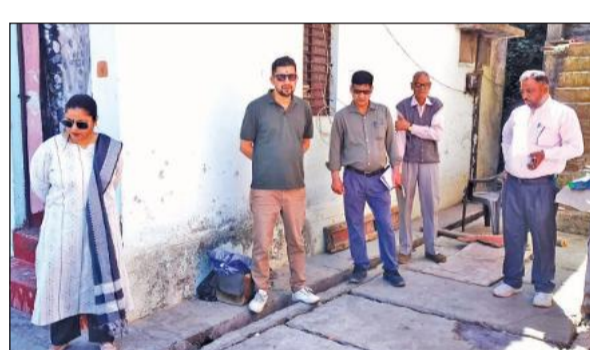
अल्मोड़ा में बुधवार को हीराडुंगरी वार्ड का निरीक्षण करते नगर आयुक्त।