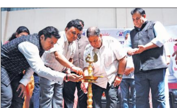
प्रतियोगिता का शुभारंभ करते डीएम व फैसिंग फेडरेशन एशिया के अध्यक्ष।