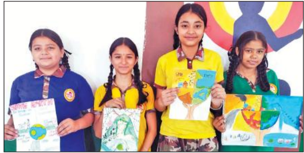
खटीमा के नोजे पब्लिक स्कूल में आयोजित कार्यक्रम में शिरकत करते बच्चे।