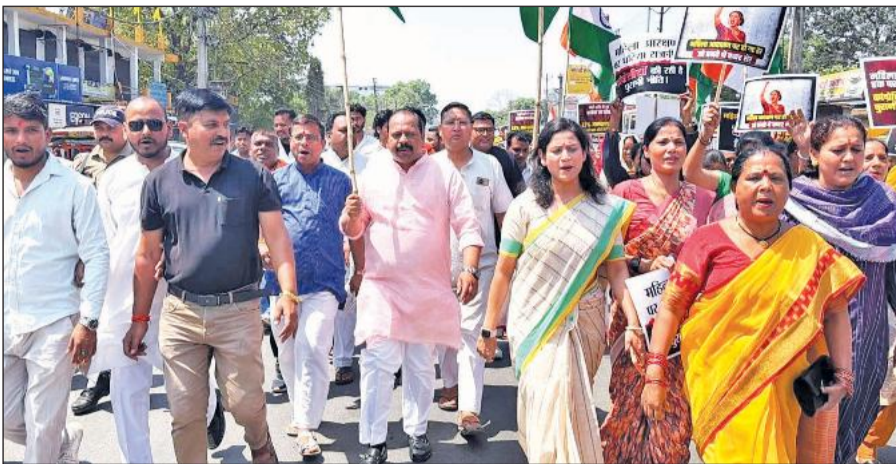
महिला विधेयक पारित न होने को लेकर खटीमा में कांग्रेस के खिलाफ रैली निकालते भाजपा कार्यकर्ता।