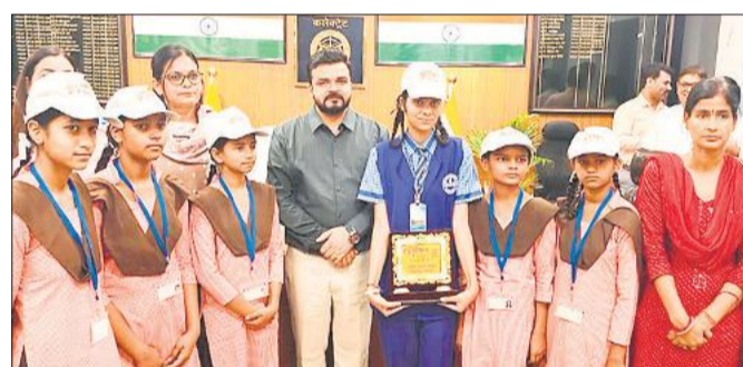
छात्राओं के साथ एक दिन की डीएम श्रीसिंह व मौजूद अधिकारी।