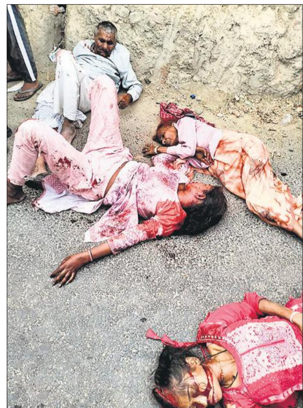
मुरादाबाद हाईवे पर असलेमपुर गांव के निकट सड़क पर पड़े घायल।