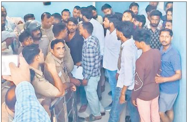
चंदौसी के अस्पताल में हंगामा करती भीड़ और तेनात पुलिस बल।