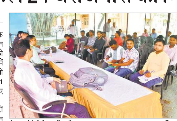
रोजगार मेले में मौजूद प्रतिभागी।

शिक्षित व पंजीकृत बेरोजगारों को सेवायोजन विभाग विभिन्न कंपनियों व फर्मों में रोजगार दिलाकर समर्थ बना रहा है। इसी क्रम में बुधवार को क्षेत्रीय सेवायोजन कार्यालय के परिसर में एक दिवसीय रोजगार मेला लगाया गया। इसमें निजी क्षेत्र के नियोजक दिल्ली रोड स्थित डिजाइनको कम्पनी के द्वारा टेक्निकल और नॉन टेक्निकल पदों के लिए