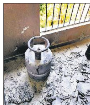
आग लगने से फटा सिलेंडर।

अंतर्गत इंपीरियल ग्रीन्स सोसायटी के मल्टी स्टोरी रजिडेंशियल बिल्डिंग के चौथे मंजिल के प्लेट नंबर 402 में गैस सिलेंडर और वाशिंग मशीन और अन्य उपकरणों में आग लगी थी। इसके चलते धुआं फैल गया था। लगी थी। फायर स्टेशन यूनिट हैलेट रोड ने सोसायटी में लगे फायर उपकरणों से आग बुझाने का प्रयास करते हुए तत्परता दिखाई। इससे कुछ देर की मशकत के बाद आग पर काबू पा लिया गया। उन्होंने बताया कि प्रथम दृष्टया शॉर्ट सर्किट से आग लगने की बात सामने आ