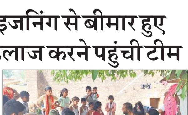
फूड प्वाइजनिंग से बीमार हुए लोगों का इलाज करती स्वास्थ्य विभाग की टीम।

अमृत विचार : कैला देवी थाना क्षेत्र के गांव शाकिन शोभापुर में बरात के दौरान भोजन करने के बाद बड़ी संख्या में लोगों के बीमार पड़ने की सूचना पर बुधवार को स्वास्थ्य विभाग और खाद्य सुरक्षा विभाग की टीम मौके पर पहुंची। सोमवार रात्रि आयोजित शादी समारोह में दूल्हा समेत 150 से अधिक लोग भोजन करने के बाद टीम मौके पर पहुंची। सोमवार रात्रि आयोजित शादी समारोह में दूल्हा समेत 150 से अधिक लोग भोजन करने के बाद टीम मौके पर पहुंची। सोमवार रात्रि आयोजित शादी समारोह में दूल्हा समेत 150 से अधिक लोग भोजन करने के बाद टीम मौके पर पहुंची। सोमवार रात्रि आयोजित शादी समारोह में दूल्हा समेत 150 से अधिक लोग भोजन करने के बाद टीम मौके पर पहुंची।