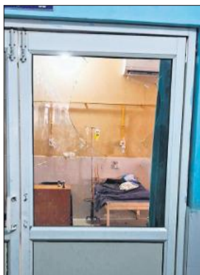
टूटा अस्पताल गेट का शीशा।

के दौरान दम तोड़ दिया। इसके बाद जब गांव खबर पहुंची तो काफी संख्या में लोग अस्पताल आ गए। परिजनों व ग्रामीणों ने लापरवाही का आरोप लगाते हुए अस्पताल में काफी देर तक हंगामा किया। इस दौरान परिजनों ने अस्पताल स्टाफ पर उनके साथ मारपीट करने का आरोप भी लगाया। करीब एक घंटे तक हंगामा होता रहा। सूचना मिलने पर क्षेत्राधिकारी