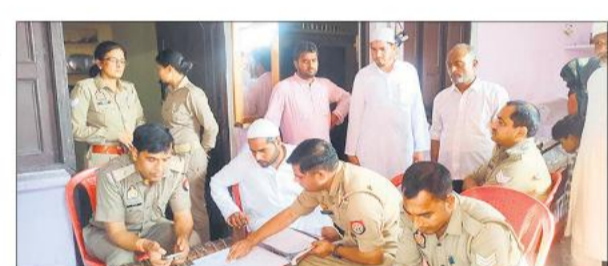
परिजनों से पूछताछ करती टांडा पुलिस।