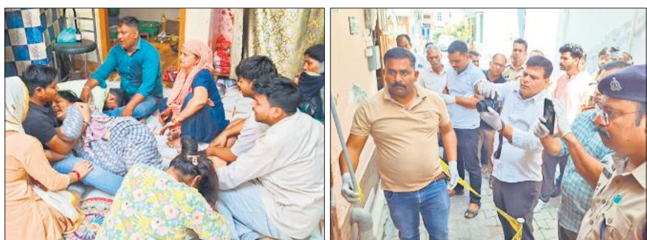
मृतक के रोते बिलखते परिजन। ● अमृत विचार घटना स्थल पर जांच करती पुलिस और फॉरेंसिक टीम।