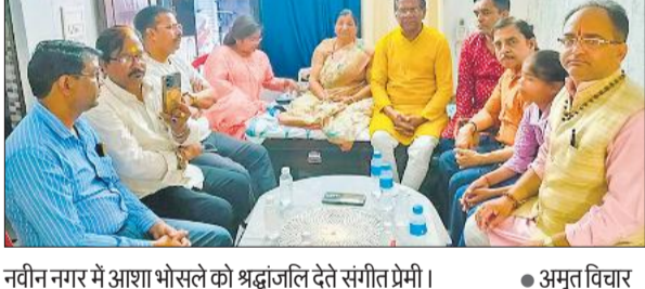
नवीन नगर में आशा भोसले को श्रद्धांजलि देते संगीत प्रेमी।