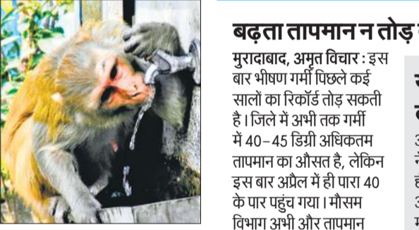
तपती गर्मी में प्यास बुझाना बंदर।