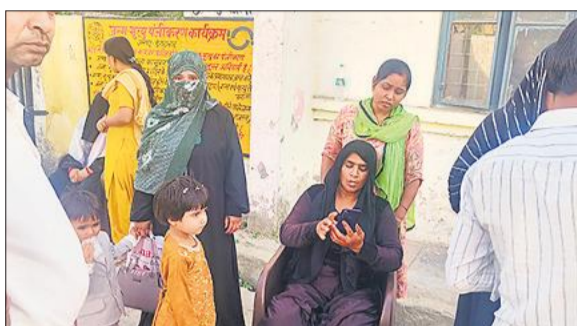
रोते बिलखते परिजन।