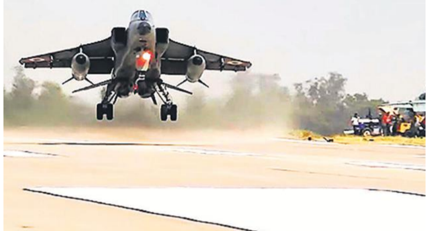
सुलतानपुर: वायुसेना के लड़ाकू विमानों का दो दिवसीय अभ्यास बुधवार को पूर्वांचल एक्सप्रेसवे-वे की आपातकालीन हवाई पट्टी पर शुरू हुआ। इस अभ्यास में बुधवार को सुखोई, जगुआर और मिराज विमानों ने टच एंड गो ऑपरेशन किया।