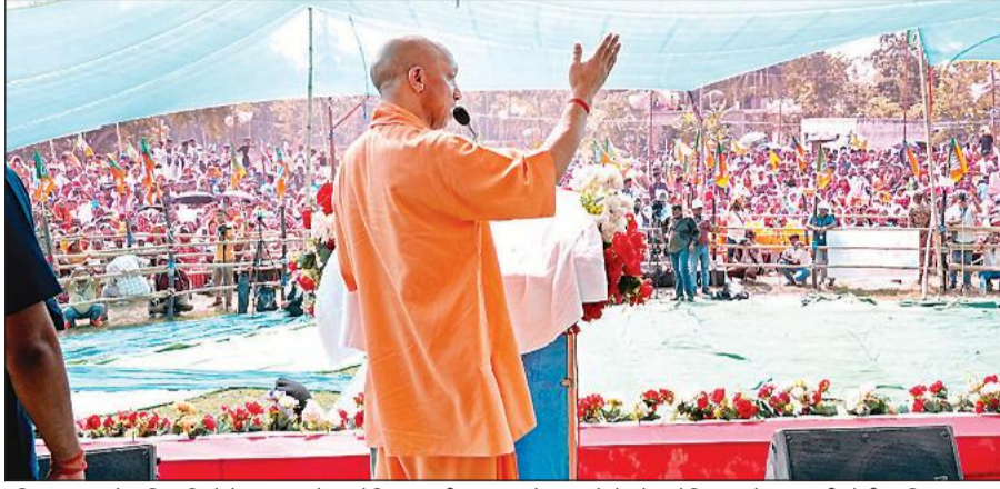
पश्चिम बंगाल के नदिया जिले के चकदहा में आयोजित चुनावी जनसभा में आए लोगों को संबोधित करते मुख्यमंत्री योगी आदित्यनाथ।

अस्मिता के साथ खिलवाड़ करने वालों को लोकतांत्रिक तरीके से जवाब दे। योगी ने टीएमसी शासन को "आतंक, माफिया राज और भ्रष्टाचार का पर्याय" बताते हुए कहा कि यहां उद्योग बंद हो रहे हैं, नौजवान बेरोजगार हैं और किसान परेशान हैं। उन्होंने बंगाल की सांस्कृतिक विरासत का उल्लेख करते हुए रवींद्रनाथ टैगोर और बंकिम चंद्र चट्टोपाध्याय जैसे महापुरुषों का नाम लिया और आरोप लगाया कि टीएमसी शासन में उनकी विरासत का सम्मान नहीं हो रहा।