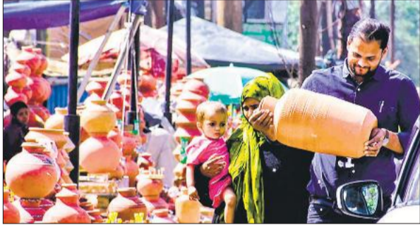
गर्मी में घर के लिए मिट्टी का पानी पीने का बर्तन पसंद करता युवक। ● अमृत विचार

मौसम विभाग ने इस बार पिछले कई वर्षों से अधिक गर्मी पड़ने की चेतावनी दी है। इसका असर अप्रैल के दूसरे पखवाड़े में ही दिख रहा है। बुधवार को दोपहर में सूरज की तपिश और लू के थपेड़ों ने लोगों को बेदम कर दिया। सनग्लास, कैप लगाने के बाद भी लोग लू से झुलसते रहे। दोपहिया वाहन चालकों के साथ ही आटो और ई-रिक्शा में बैठे लोग भी लू के थपेड़ों से बेहाल हो गए। सूरज की किरणें मानों