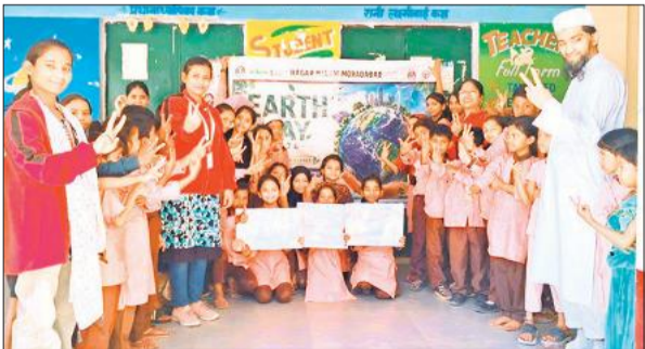
पृथ्वी दिवस पर स्कूलों में जागरूकता कार्यक्रम के दौरान मौजूद छात्र छात्राएं व शिक्षक।

वार्ड 19 स्थित चित्रगुप्त इंटर कॉलेज में नुककड़ नाटक के माध्यम से बच्चों को पर्यावरण संरक्षण के प्रति जागरूक किया गया। वहीं वार्ड 59 के बानालु कुरेश गल्ल्स इंटर कॉलेज में पोस्टर प्रतियोगिता कराई गई। इसमें सेव द अर्थ का संदेश दिया गया। बेसिक शिक्षा परिषद नगर क्षेत्र के कंपोजिट विद्यालय गंज गांधी पार्क में सोर्स सेग्रीगेशन विषय पर रंगारंग खेल के माध्यम से बच्चों को घर के कचरे को पृथक् करने की जानकारी दी गई। इसके माध्यम से