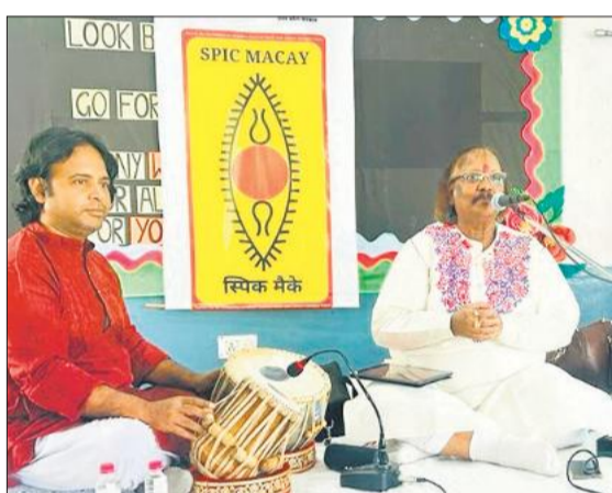
बांसुरी वादन करते पंडित राजेंद्र प्रसन्ना।