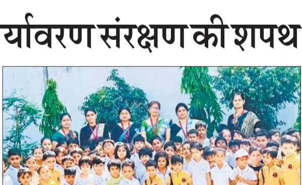
बबराला में पृथ्वी दिवस पर आयोजित कार्यक्रम में शामिल बच्चे।