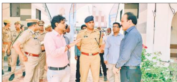
परीक्षा केंद्रों पर तैयारियों का निरीक्षण करते डीएम और एसपी।

अमरोहा, अमृत विचार : उतर प्रदेश पुलिस भर्ती एवं प्रोन्नति बोर्ड द्वारा आयोजित होने वाली होमगार्ड्स भर्ती परीक्षा को लेकर प्रशासन ने तैयारियां तेज कर दी हैं। बुधवार को डीएम नितिन गौड़ और एसपी लखन सिंह यादव ने परीक्षा केंद्रों का निरीक्षण कर व्यवस्थाओं का जायजा लिया। डीएम और एसपी ने आईएम इंटर कॉलेज, जेएस हिंदू इंटर कॉलेज तथा जेएस हिंदू पीजी कॉलेज (ब्लॉक-ए व ब्लॉक-बी) का निरीक्षण किया। अधिकारियों ने निर्देश दिए कि परीक्षा पूरी तरह नकलविहीन और शुचितापूर्ण ढंग से कराई जाए। निरीक्षण के दौरान सीसीटीवी कंट्रोल रूम और स्टॉफ रूम की व्यवस्थाओं को भी देखा गया। अधिकारियों ने निर्देश दिए कि निगरानी व्यवस्था लगातार सक्रिय रखी जाए और हर गतिविधि पर पनी नजर बनी रहे। डीएम नितिन गौड़ ने कहा कि परीक्षा केंद्रों पर पेयजल, स्वच्छता, निर्बाध विद्युत आपूर्ति और पर्याप्त प्रकाश व्यवस्था हर हाल में सुनिश्चित की जाए, ताकि परीक्षार्थियों को किसी प्रकार की असुविधा न