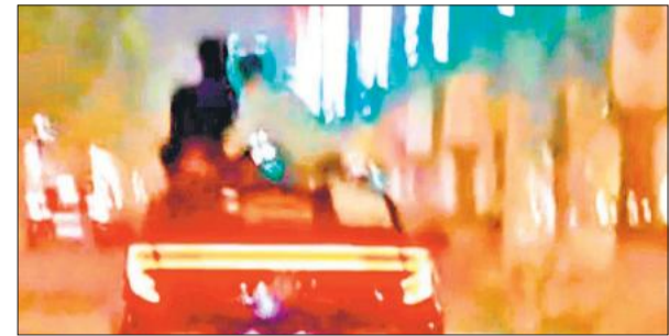
स्टंट करते कार सवार।

हाईवे पर रईसजादों ने कार पर किया जानलेवा स्टंट