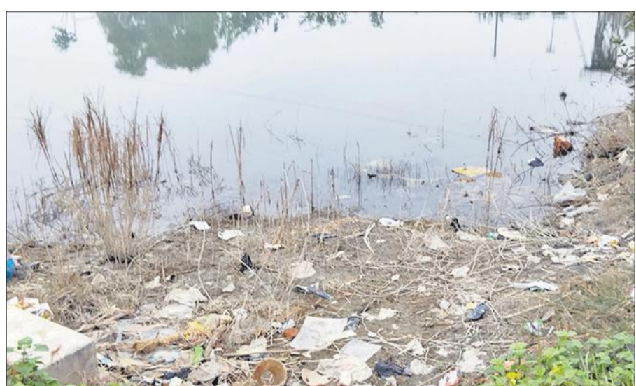
तालाब के निकट पड़ी प्लास्टिक।

भू-जल स्तर गिरने से चार ब्लॉक शाहबाद, स्वार, सैदनगर और चमरौआ डार्क जोन में पहुंच गए थे। तालाबों और कुएं खुदवाने के बाद चारों ब्लॉक क्रिटिकल से सेमी क्रिटिकल श्रेणी में आ गए हैं। जिले की 680 ग्राम पंचायतों में तालाबों को बेहतर बनाने के लिए उनके फिल्टर चैंबर बनाए जाएंगे, ताकि तालाबों तक प्लास्टिक की पहुंच खत्म हो सके। स्वच्छ भारत मिशन ग्रामीण के तहत पंचायती राज विभाग उन मॉडल तालाब बनाए जाने के लिए खाका तैयार किया है। इस खाके के मुताबिक 100 तालाबों के