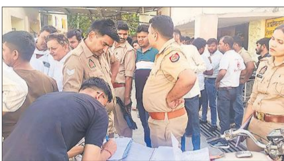
टाकुरद्वारा अस्पताल में परिजनों से पूछताछ करती पुलिस।