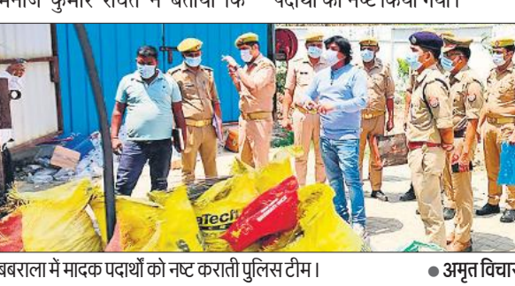
बबराला में मादक पदार्थों को नष्ट कराती पुलिस टीम।