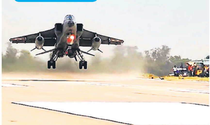
सुलतानपुर: वायुसेना के लड़ाकू विमानों का दो दिवसीय अभ्यास बुधवार को पूर्वांचल एक्सप्रेसवे-वे की आपातकालीन हवाई पट्टी पर शुरू हुआ। इस अभ्यास में बुधवार को सुखोई, जगुआर और मिराज विमानों ने टच एंड गों ऑपरेशन किया।