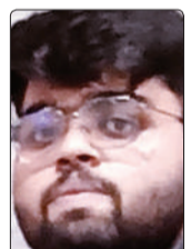
सक्षम सिन्हा छात्र

कैम्पस के बारे में पहले से सुनी बातों-यूनियनबाजी, गुटबंदी और झगड़े-मन में डर पैदा कर रही थीं। क्लास में जाने का साहस ही नहीं जुटा पा रहा था। तभी मैदान में कुछ सीनियर्स ने रोक लिया और वहीं मेरी 'क्लास' लग गई। किसी ने मेरे चश्मे और बालों में तेल देखकर मजाक उड़ाते हुए 'चम्पू' कह दिया। उस क्षण मैं बेहद असहज और छोटा महसूस करने लगा। आत्मसम्मान को ठेस पहुंची और मन भीतर तक आहत हो गया। उस दिन मैं बिना कुछ किए ही घर लौट आया और बिस्तर पर आंघोरी मुंह लेटकर देर तक रोता रहा। लगा जैसे यह दुनिया मेरे लिए नहीं बनी है। लेकिन अगले ही दिन हालात बदलने लगे। कुछ पुराने दोस्त घर आए, जिन्होंने उसी कॉलेज में दाखिला लिया था। उनसे खुलकर बात करने पर मन हल्का हुआ और भीतर कहीं हिम्मत जागी। उनके साथ कॉलेज जाना शुरू किया तो सब कुछ धीरे-धीरे आसान लगाने लगा। साथ में क्लास करना, लंच शेयर करना और कैम्पस में घूमना-इन छोटी-छोटी बातों ने मेरे अंदर आत्मविश्वास भर दिया। समय के