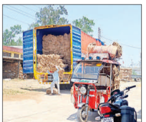
कृषि उत्पादन मंडी समिति में ट्रक से बोरो की उतारोती पल्लेदार।

गोंडा, अमृत विचार : जिले में गेहूं खरीद प्रक्रिया पिछले कुछ दिनों से बोरो की कमी के चलते धीमी पड़ गई थी। कई खरीद केंद्रों पर पर्याप्त बोरो उपलब्ध न होने के कारण केंद्र प्रभारी खरीद में रुचि नहीं दिखा रहे थे। हालांकि अब शासन ने त्वरित कदम उठाए हैं। जिले में 30 हजार बोरो की खेप पहुंच चुकी है, जिन्हें एजेंसियों को आवंटित कर दिया गया है।