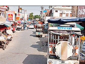
देवाधानकुंड मार्ग पर सड़क पर प्रतिबंध के बाद भी खड़े ई रिक्शा।

प्रतिबंध के बावजूद अवैध स्टैंड सीन-3 आरटीसी योजना में रायगंज तिराहे से रामघाट चौराहे तक के मार्ग को चिह्नित किया गया है। हाईवे व अयोध्या धाम रेलवे स्टेशन से राम मंदिर जाने वाले मार्गों में यह प्रमुख मार्ग है। यहां देवाधानकुंड मोड़ पर ही भारी अतिक्रमण है, साथ यहां ई- रिक्शा वाहनों ने प्रतिबंध के बावजूद अवैध स्टैंड बना रखा है। यहां यातायात कर्मियों की तैनाती भी है, लेकिन वह कार्रवाई करते नजर नहीं आते।