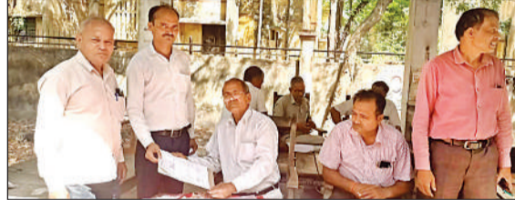
मिल्कीपुर बार एसोसिएशन में नामांकन पर्चा की खरीदारी करते अधिवक्ता।