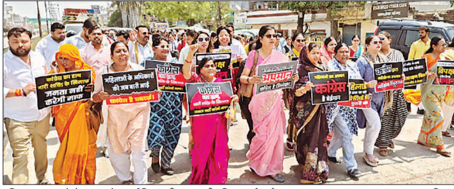
महिला आरक्षण को लेकर आक्रोश मार्च निकालती भाजपा की महिला कार्यकर्ता।

शक्ति के सम्मान में भाजपा मैदान सपा, कांग्रेस व अन्य विपक्षी दलों में और कांग्रेस का हाथ नारी शक्ति के खिलाफ नारी बाजी की। मार्च से पहले जिला पंचायत अध्यक्ष तखियां हाथों में ले रखी थी।