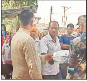
बेटी की लगन के लिए ले जा रहे स्टील की पराती को छीनते नेपाली सुरक्षाकर्मी।

सख्ती से खासे परेशान हैं। आलम यह है कि जो लोग वर्षों से सस्ती दरों के कारण भारतीय बाजारों से रानन और सब्जियां ले जाते थे, उन्हें अब एक दर्जन केले या छोटे-छोटे घरेलू सामानों के लिए भी सीमा शुल्क चुकाना पड़ रहा है या फिर उनके सामान को जब्त किया जा रहा है।