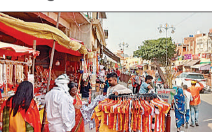
हनुमानगढ़ी चौराहे के पास फुटपाथ पर अतिक्रमण।

पटरी दुकानदारों ने किया अतिक्रमण सीन-2 आरटीसी योजना में चयनित मार्ग में हनुमानगढ़ी चौराहे के पास दोनों ओर फुटपाथ पर पटरी दुकानदारों द्वारा अतिक्रमण किया गया है। जबकि योजना के अनुसार इस मार्ग पर सड़क व फुटपाथ दोनों को अतिक्रमण मुक्त रखना है। फुटपाथ पर कई स्थानों पर स्थानीय दुकानदारों ने अपनी बाइक भी खड़ी कर रास्ते को बाधित कर रखा है।