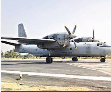
पूर्वांचल एक्सप्रेस-वे पर आयोजित एयर शो में रोमांचक करतब दिखाते फाइटर जेट ।