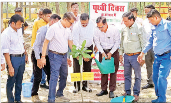
पौधरोपण करते कृषि विवि के कुलपति, अधिष्ठाता, निदेशक एवं शिक्षक।

कृषि विवि में पृथ्वी दिवस पर चला पौधरोपण अभियान