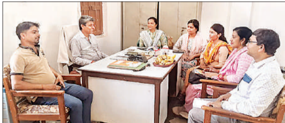
बैठक में मौजूद शिक्षक।