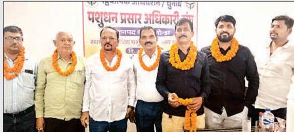
पशुधन प्रसार अधिकारी संघ के विजयी पदाधिकारी।