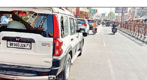
श्रीराम जन्मभूमि पथ के सामने सड़क किनारे खड़े बाहरी नंबर के वाहन।

रामपथ के दोनों किनारों पर खड़े वाहन सीन-1 यह दृश्य राम मंदिर जाने वाले प्रमुख मार्ग श्रीराम जन्मभूमि पथ के सामने का है। जो आरटीसी योजना में पोस्ट ऑफिस तिराहा से टेढ़ी बाजार मार्ग के बीच में पड़ता है। यहां बाहरी नंबर के वाहन रामपथ के दोनों किनारों पर खड़े हैं। यह यातायात व सुरक्षा दोनों की दृष्टि से ठीक नहीं है। इस मार्ग पर रूट मार्शल की तैनाती भी है लेकिन वह नजर नहीं आए।