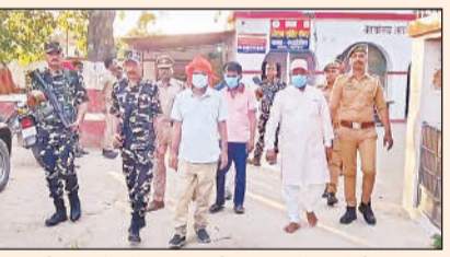
एसएसबी जवानों और पुलिस की हिरासत में आरोपी।