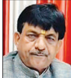
मंत्री कपिल देव अग्रवाल

होना चाहिए। इसके लिए आईटीआई संस्थानों में गुणवत्ता सुधार, आधुनिक तकनीकों को शामिल करने और पाठ्यक्रम को उद्योगों की जरूरतों के अनुरूप अपडेट करने पर जोर दिया गया। मंत्री ने आईटीआई के आधुनिकीकरण, टाटा टेक्नोलॉजीज के साथ सहयोग और ऑन-द-जॉब ट्रेनिंग को बढ़ावा देने की बात कही। साथ ही बढ़ते ड्रॉपआउट पर चिंता जताते हुए समाधान लागू करने के निर्देश दिए। 'प्रोजेक्ट प्रवीण' के तहत न्यू एज टेक्नोलॉजी आधारित कोर्स शुरू कर युवाओं को रोजगार योग्य बनाने पर भी बल दिया गया।