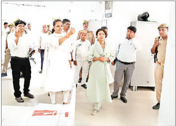
निरीक्षण करती नवागत आयुक्त दुर्गा शक्ति नागपाल।

निरीक्षण के दौरान आयुक्त ने विशेष रूप से कार्यालयों में स्वच्छता बनाए रखने, समय-समय पर रंगाई-पुताई कराने और कार्यस्थलों को व्यवस्थित रखने के निर्देश दिए। उन्होंने कहा कि स्वच्छ एवं सुव्यवस्थित कार्यालय न केवल कर्मचारियों की कार्यक्षमता बढ़ाते हैं, बल्कि आमजन में भी सकारात्मक संदेश देते हैं।