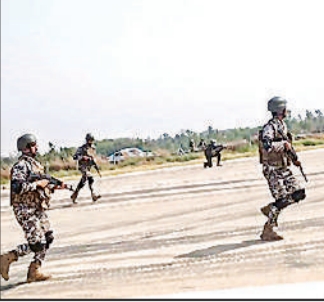
हैरतअंगेज करतब दिखाते सेना के जवान ।