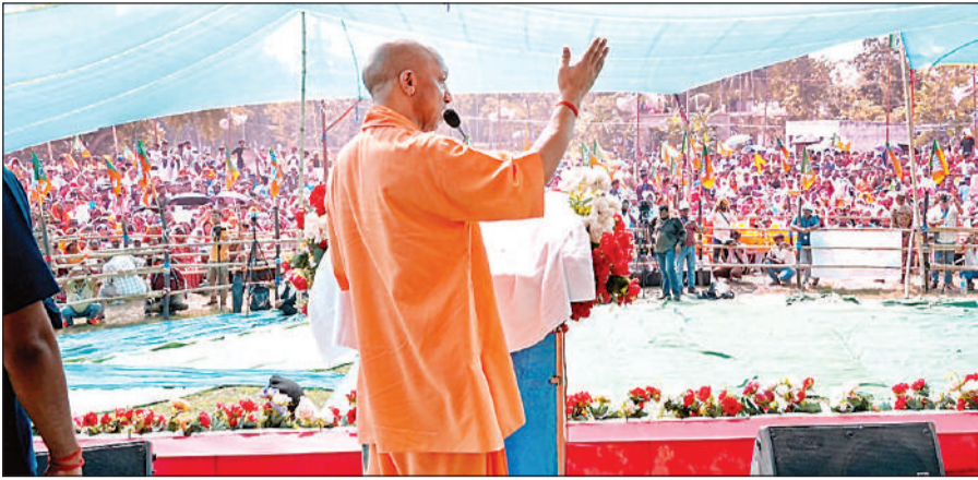
पश्चिम बंगाल के नदिया जिले के चकदहा में आयोजित चुनावी जनसभा में आए लोगों को संबोधित करते मुख्यमंत्री योगी आदित्यनाथ।

अस्मिता के साथ खिलवाड़ करने वालों को लोकतांत्रिक तरीके से जवाब दे। योगी ने टीएमसी शासन को "आतंक, माफिया राज और भ्रष्टाचार का पर्याय" बताते हुए कहा कि यहां उद्योग बंद हो रहे हैं, नौजवान बेरोजगार हैं और किसान परेशान हैं। उन्होंने बंगाल की सांस्कृतिक विरासत का उल्लेख करते हुए रवींद्रनाथ टैगोर और बंकिम चंद्र चट्टोपाध्याय जैसे महापुरुषों का नाम लिया और आरोप लगाया कि टीएमसी शासन में उनकी विरासत का सम्मान नहीं हो रहा।