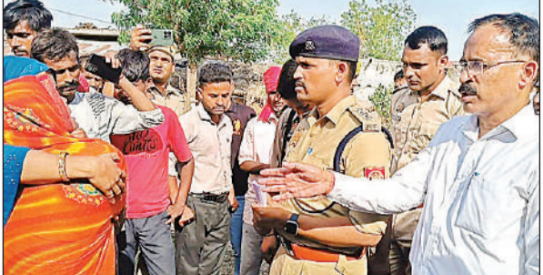
मृतक की पत्नी से वार्ता करते एसडीएम व सीओ ।