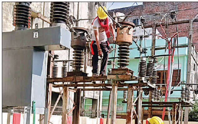
चौक विद्युत उपकेन्द्र की सिटी करंट ट्रांसफार्मर में आई खराबी ठीक करते बिजलीकर्मों।

विद्युत उप केन्द्र के प्रत्यक्षदर्शी कर्मियों के मुताबिक पहले तेज सायरन जैसी आवाज आई, फिर ट्रांसफार्मर से धुआं निकलने लगा और