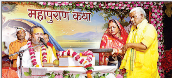
कथा सुनाते व्यास व आरती करते यजमान।