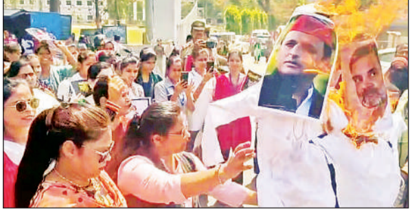
विपक्षी नेताओं का पुतला फूँकते भाजपा कार्यकर्ता। अमृत विचार