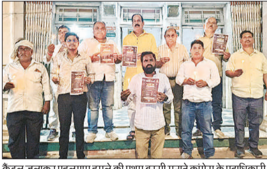
कैडल जलाकर पहलगाम हमले की प्रथम बरसी मनाते कांग्रेस के पदाधिकारी।

पदार्यों का सेवन करें, हल्का भोजन एवं हरी सब्जियों का उपभोग करें। बाहर निकलते समय जूते-चप्पल और धूप के चश्मे का प्रयोग करें। दोपहर 12 बजे से तीन बजे तक बाहर निकलने से बचें एवं दिन में कम से कम दो-तीन बार ठण्डे पानी से नहाएं। श्रम विभाग से निर्माण एजेंसियों, औद्योगिक इकाइयों के संचालकों, ईट-भट्टा निर्माता संघ और व्यापार मण्डल के प्रतिनिधियों को भी जारी किया है। कहा कि दोपहर की तेज धूप में श्रमिकों से कार्य न लिया जाए, कार्यस्थल पर छाया (शेड), ठंडे पेयजल एवं ग्लूकोज/ग्लूकोन-डी की व्यवस्था अनिवार्य रूप से की जाए। कार्य के समय में बदलाव कर श्रमिकों के स्वास्थ्य का ध्यान रखा जाए।