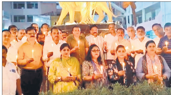
संघ के कार्यालय में मोमबत्ती जलाकर दी गई श्रद्धांजलि।