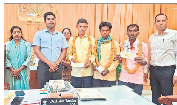
भूमि बिक्री करने वाले किसानों के साथ बीडीए के अधिकारी।