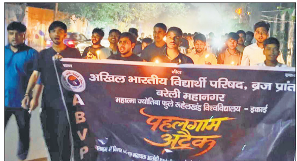
कैडल मार्च निकालते अभ्यापि के कार्यकर्ता।

रुहेलखंड विश्वविद्यालय में विचार गोष्ठी, छात्रों ने एकता और शांति का लिया संकल्प