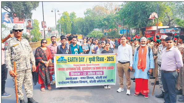
रैली निकालते बरेली कॉलेज के छात्र-छात्राएं।