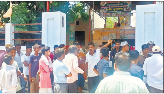
धार्मिक स्थल के बाहर जुटी लोगों की भीड़।