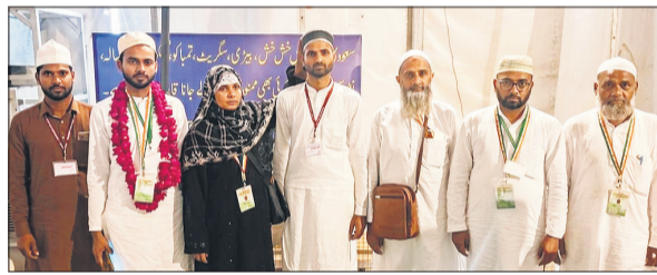
हज यात्रियों को रवाना करते परजिन।