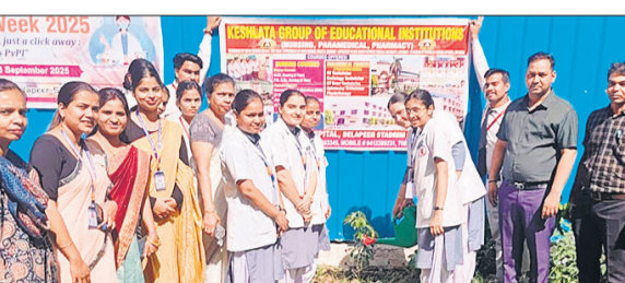
पौधरोपण करते छात्र- छात्राएं।