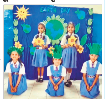
कार्यक्रम पेश करते बच्चे।

बरेली, अमृत विचार : नेहटा स्थित सेंट जेवियर्स कॉलेज में बुधवार को पृथ्वी दिवस पर पर्यावरण संरक्षण के लिए कार्यक्रमों का आयोजन किया गया। बच्चों ने विद्यालय परिसर में पौधरोपण किया और पृथ्वी को हरा भरा बनाने का संकल्प लिया। बच्चों ने रंगारंग वेशभूषा धारण कर विभिन्न गतिविधियों का प्रदर्शन किया। सभी विद्यार्थियों को पौधे वितरित किए गए ताकि वह अपने घरों में भी पौधरोपण करें। कार्यक्रम पेश करते बच्चे।