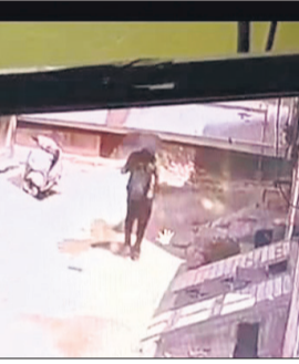
सीसीटीवी में कैद आरोपी पति।