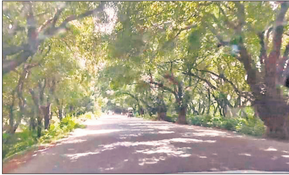
पीलीभीत रोड पहले ऐसा हरा-भरा दिखता था, जहां सुस्ताने को भी पेड़ नहीं बचे।

वो भी क्या दिन थे...यह जुमला बरेली वासियों की जुबां पर अक्सर देता है। पहले हरियाली से ओतप्रोत प्रमुख सड़कें जन्म का एहसास कराती थीं। घने पुराने पेड़ों की टहनियां सड़क के ऊपर मिलकर एक प्राकृतिक सुरंग बना देती थीं। सूरज की तपिश जमीन तक नहीं पहुंच पाती थी और ठंडी हवा का झोंका राहगीरों की थकान मिटा देता था। आज वही सड़कें विकास की दौड़ में अपनी पहचान खो चुकी हैं और कंक्रीट के तपते जाल में बदल गई हैं। इतिहास और विकास की बात करें तो नैनीताल हाईवे और पीलीभीत रोड के चौड़ीकरण की