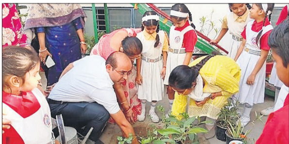
पौधरोपण करते अतिथि।