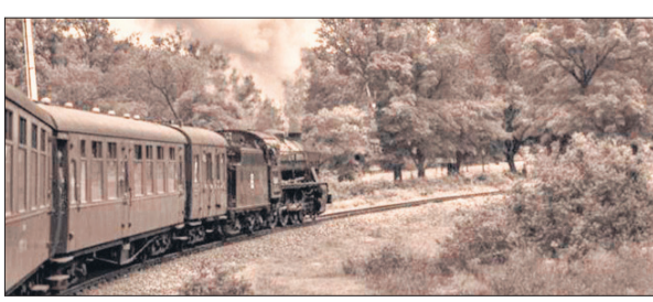
सालों पहले कोयले वाले इंजन से छुक-छुक चलती ट्रेन।

हो रहा है। बागेश्वर तक ट्रेन पहुंचाने की दिशा में नए सिरे से तैयारियां तेज हुई हैं। रेल बजट में प्रावधान होने के बाद जल्द सर्वे शुरू होने वाला है। इज्जतनगर रेल मंडल के पास नेटवर्क विस्तार का मसौदा पहुंच चुका है, जिसके बाद परियोजना के प्रांरिक चरण में तेजी आने की उम्मीद बंधी है। यह परिकल्पना अंग्रेज सरकार की तैयारी थी मगर समय के बाद फाइलें आगे बढ़ने की जगह पीछे धिक्कती रहीं। बरेली-कुमायूँ रेल लाइन का इतिहास करीब करीब डेढ़ सदी पुराना है। 1890 में अंग्रेजों ने पहली बार टनकपुर-बागेश्वर रेल मार्ग का