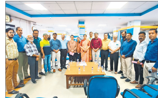
आंदोलन पर चर्चा को जुटे बैंक कर्म।