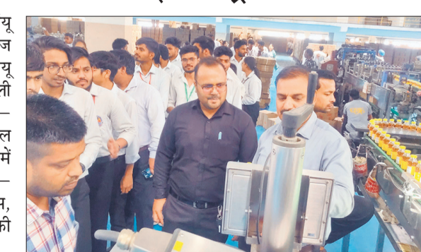
खंडेलवाल एडिबल ऑयल फैक्ट्री में शिक्षक व छात्र-छात्राएं।