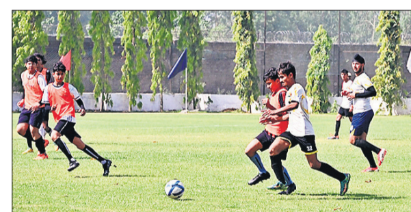
जीत के लिए जूझते खिलाड़ी।