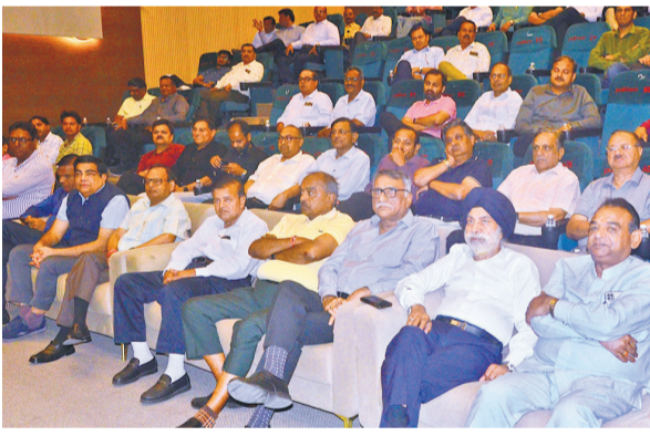
सेंट्रल यूपी चैंबर ऑफ कॉमर्स एंड इंडस्ट्री के सेमिनार में जुटे लोग। ● अमृत विचार

● सेंट्रल यूपी चैंबर ऑफ कॉमर्स एंड इंडस्ट्री ने किया सेमिनार