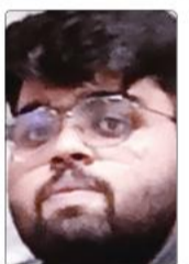
सक्षम सिन्हा छात्र

कैम्पस के बारे में पहले से सुनी बातों-यूनियनबाजी, गुटबंदी और झगड़े-मन में डर पैदा कर रही थीं। क्लास में जाने का साहस ही नहीं जुटा पा रहा था। तभी मैदान में कुछ सीनियर्स ने रोक लिया और वहीं मेरी 'क्लास' लग गई। किसी ने मेरे चश्मे और बालों में तेल देखकर मजाक उड़ाते हुए 'चम्पू' कह दिया। उस क्षण मैं बेहद असहज और छोटा महसूस करने लगा। आत्मसम्मान को ठेस पहुंची और मन भीतर तक आहत हो गया। उस दिन मैं बिना कुछ किए ही घर लौट आया और बिस्तर पर आँधे मुँह लेटकर देर तक रोता रहा। लगा जैसे यह दुनिया मेरे लिए नहीं बनी है। लेकिन अगले ही दिन हालात बदलने लगे। कुछ पुराने दोस्त घर आए, जिन्होंने उसी कॉलेज में दाखिला लिया था। उनसे खुलकर बात करने पर मन हल्का हुआ और भीतर कहीं हिम्मत जागी। उनके साथ कॉलेज जाना शुरू किया तो सब कुछ धीरे-धीरे आसान लगाने लगा। साथ में क्लास करना, लंच शेयर करना और कैम्पस में घूमना-इन छोटी-छोटी बातों ने मेरे अंदर आत्मविश्वास भर दिया। समय के