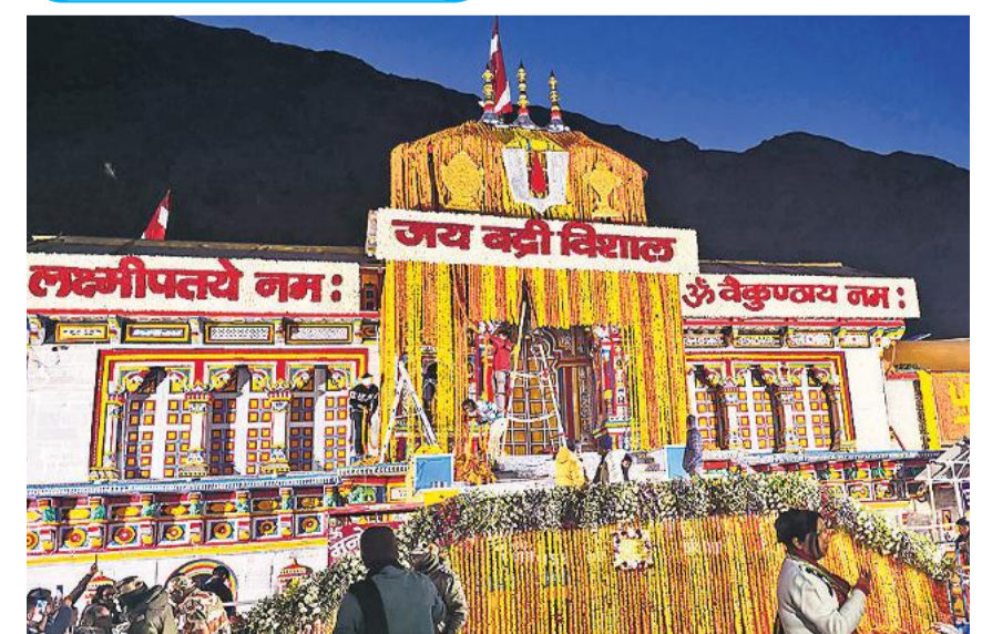
उत्तराखंड के चमोली जिले में, बुधवार को बद्रीनाथ धाम परिसर के द्वार-उद्घाटन समारोह की पूर्व संध्या पर पुष्पमालाओं से सजा धाम।