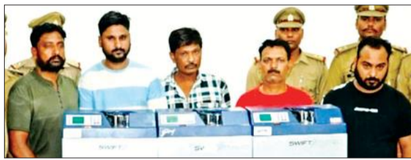
पकड़े गए सट्टारिया व बरामद नोट गिनने वाली मशीन।