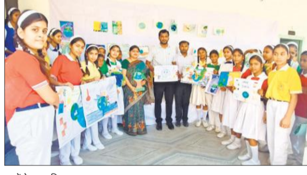
बच्चों के साथ शिक्षक।

अमृत विचार : बीडीएम पब्लिक स्कूल में अर्थ डे उमंग के साथ मनाया गया, जिसमें विद्यार्थियों एवं शिक्षकों ने बड़-चढ़कर भाग लिया। कार्यक्रम का उद्देश्य पर्यावरण संरक्षण के प्रति जागरूकता फैलाना रहा। इस अवसर पर किंडरगार्टन एवं कक्षा 1 से 8 तक के विद्यार्थियों द्वारा पौधारोपण अभियान आयोजित किया गया।