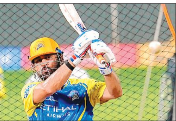
अभ्यास सत्र के दौरान महेंद्र सिंह धोनी।

इससे उनकी इंपैक्ट प्लेयर के रूप में वापसी की संभावना बन गई है। इन दोनों दिग्गज खिलाड़ियों की वापसी इसलिए भी महत्वपूर्ण मानी जा रही है कि अब तक पांच-पांच खिलाट जीतने वाली यह दोनों