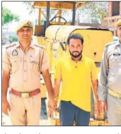
रोड रोलर के साथ पकड़ा गया आरोपी।