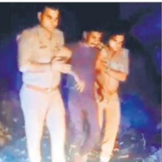
पुलिस की गिरफ्त में वन्यजीव के शिकार का आरोपी।

कुल पांच राउंड फायर हुए थे। वन विभाग ने विभागीय केस दर्ज करने के साथ ही माधोटांडा थाने में एफआईआर भी