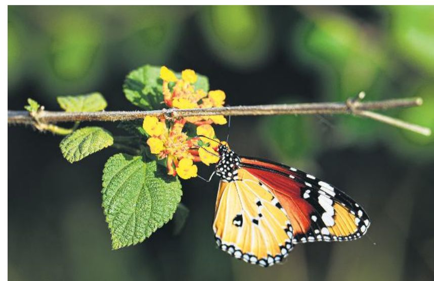
बुधवार को लखनऊ में एक मोनाक तितली लैटाना कैमारा फूल से पराम का रसपान करते हुए।