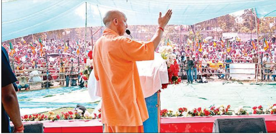
पश्चिम बंगाल के नदिया जिले के चकदहा में आयोजित चुनावी जनसभा में आए लोगों को संबोधित करते मुख्यमंत्री योगी आदित्यनाथ।

अस्मिता के साथ खिलवाड़ करने वालों को लोकतांत्रिक तरीके से जवाब दें। योगी ने टीएमसी शासन को "आतंक, माफिया राज और भ्रष्टाचार का पर्याय" बताते हुए कहा कि यहां उद्योग बंद हो रहे हैं, नौजवान बेरोजगार हैं और किसान परेशान हैं। उन्होंने बंगाल की सांस्कृतिक विरासत का उल्लेख करते हुए रवींद्रनाथ टैगोर और बंकिम चंद्र चट्टोपाध्याय जैसे महापुरुषों का नाम लिया और आरोप लगाया कि टीएमसी शासन में उनकी विरासत का सम्मान नहीं हो रहा।