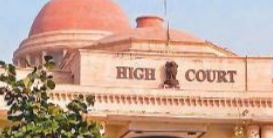
जाता। प्रयास यह होना चाहिए कि पर्याप्त संख्या में वेंटिलेटर उपलब्ध कराए जाएं, ताकि वेंटिलेटर की अनुपलब्धता के कारण किसी की मृत्यु न हो। कोर्ट ने तलख टिप्पणी करते हुए कहा कि प्रस्तुत आंकड़े इस पहलू पर संतोषजनक नहीं हैं। वस्तुतः ऐसा प्रतीत होता है कि राज्य में यह निर्धारित करने की कोई व्यवस्था ही नहीं है कि अस्पताल में वेंटिलेटर की मांग क्या है और जीवन बचाने हेतु कितने वेंटिलेटर उपलब्ध होने चाहिए। जब तक यह

व्यवस्था विकसित नहीं की जाती, तब तक इस प्रकार के आंकड़े देना निरर्थक होगा। कोर्ट ने कहा कि राज्य सरकार इस पूरे विषय पर पुनर्विचार करे और सिर्फ राष्ट्रीय चिकित्सा आयोग द्वारा निर्धारित न्यूनतम मानकों जैसे कि अस्पतालों में कुल बेड का 10 से 15 प्रतिशत वेंटिलेटर की उपलब्धता से संतुष्ट न रहे।