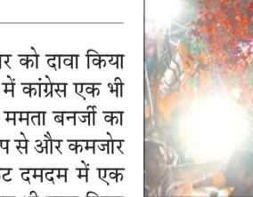
रोड शो करते केंद्रीय गृहमंत्री अमित शाह।

केंद्रीय गृह मंत्री अमित शाह ने बुधवार को दावा किया कि पश्चिम बंगाल विधानसभा चुनाव में कांग्रेस एक भी सीट नहीं जीत पायेगी और मुख्यमंत्री ममता बनर्जी का इस पार्टी से जुड़ाव उन्हें राजनीतिक रूप से और कमजोर करेगा। शाह ने न्यू बैरकपुर के निकट दमदम में एक चुनावी रैली को संबोधित करते हुए यह भी दावा किया कि कांग्रेस कई राज्यों में करारी हार की ओर बढ़ रही है। उन्होंने कहा कि मैं राहुल गांधी को बताना चाहता हूँ कि तमिलनाडु और पुडुचेरी में कांग्रेस दहाई के आंकड़े तक भी नहीं पहुंच पायेगी। पश्चिम बंगाल में तो आप अपना खाता भी नहीं खोल पाएंगे और असम में कांग्रेस को अब तक की सबसे बड़ी हार का सामना करना पड़ेगा। बनर्जी पर निशाना साधते हुए शाह ने कहा कि ममता दीदी, आप इसी कांग्रेस के साथ बैठे हैं। आपकी स्थिति भी बदतर होने वाली है। भाजपा के वरिष्ठ नेता ने कांग्रेस अध्यक्ष