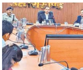
बैठक में डीएम और अन्य अधिकारी।