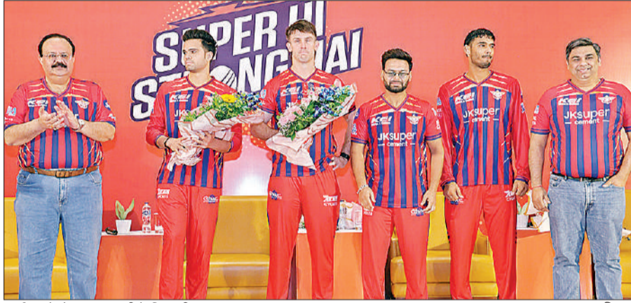
कार्यक्रम में मौजूद एलएसजी के खिलाड़ी।

मुकाबले से पहले तैयारियों में जुटी केकेआर ने गुरुवार को इकाना स्टेडियम में करीब तीन घंटे तक कड़ा अभ्यास किया। कप्तान अजिंक्य रहाणे की अगुवाई में टीम ने बल्लेबाजी,