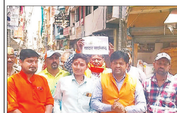
प्रदर्शन करते राष्ट्रीय हिन्दू महासभा के सदस्य।