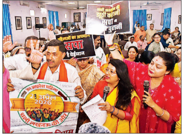
निंदा प्रस्ताव के दौरान विपक्ष पर हमलावर भाजपा के पार्षद और सदन का बहिष्कार कर गेट पर नारेबाजी करते विपक्षी सभासद।