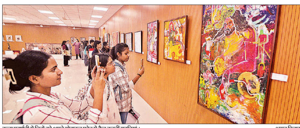
कला प्रदर्शनी में चित्रों को अपने मोबाइल फोन में कैद करती युवतियां।