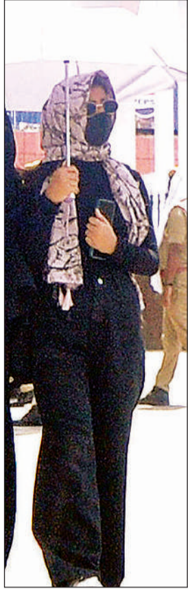
तेज धूप से खुद को बचाने के लिए दुपट्टे से सिर ढककर जाती युवती।

किया। 2014 में खरीदी गई एसी जनरथ बसें 12 लाख किलोमीटर से अधिक चल चुकी हैं। 105 बसों में 10 से 12 बसें रोज मरम्मत के अभाव में खड़ी रहती हैं और 5 से 7 बसें प्रतिदिन रास्ते में खराब हो जाती हैं। अवध डिपो में 45 बसें अपनी उम्र पूरी करने के करीब हैं, जिनमें से 26 बसें जल्द ही नीलामी के दायरे में आ जाएंगी। इस संबंध में एआरएम सत्य नारायण चौधरी ने कहा कि गर्मी अत्यधिक पड़ रही है जिसके कारण कूलिंग करने में दिक्कत आ रही है। 105 एसी बसों में 45 बसें 10 वर्ष से अधिक पुरानी हैं। हमारा पूरा प्रयास है कि यात्रियों को असुविधा का सामना न करना पड़े।