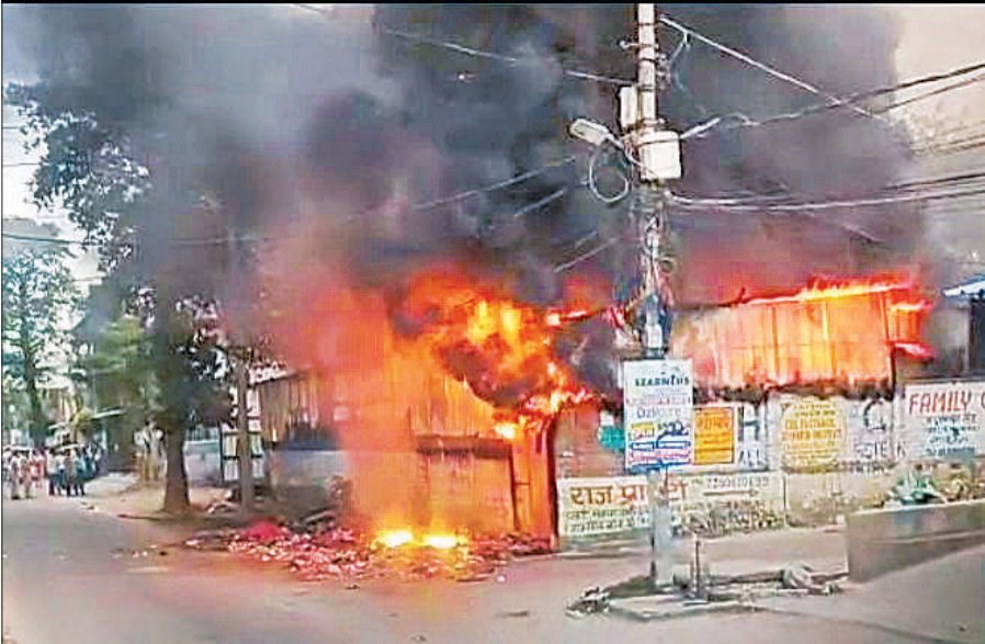
थाना मड़ियांव क्षेत्र की केशव नगर चौकी के पास राशन के गोदाम में लगी आग।