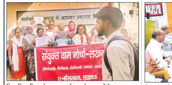
जिलाधिकारी कार्यालय पर प्रदर्शन करते वाम दलों के सदस्य।