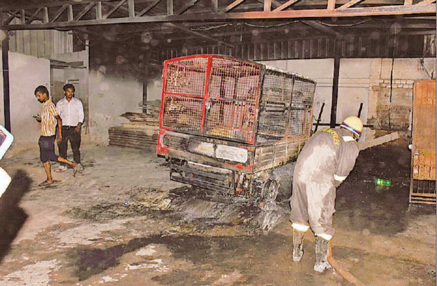
गोदाम में खड़े डाला में लगी आग बुझाते दमकलकर्मों।