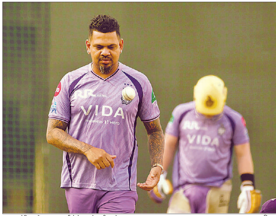
इकाना स्टेडियम में अभ्यास करती केकेआर के सुनील नरेन।