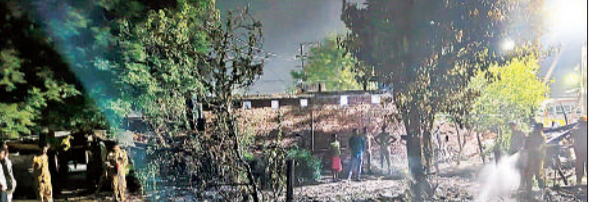
पास में आग बुझाते दमकलकर्मों।