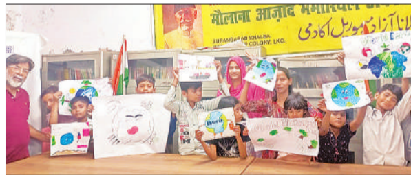
प्रतियोगिता के दौरान बनाई गई पेंटिंग दिखाते बच्चे।