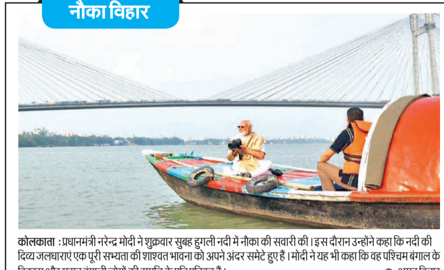
कोलकाता : प्रधानमंत्री नरेंद्र मोदी ने शुक्रवार सुबह हुगली नदी में नौका की सवारी की। इस दौरान उन्होंने कहा कि नदी की दिव्य जलधाराएं एक पूरी सभ्यता की शाश्वत भावना को अपने अंदर समेटे हुए हैं। मोदी ने यह भी कहा कि वह पश्चिम बंगाल के विकास और महान बंगाली लोगों की समृद्धि के प्रति प्रतिबद्ध हैं।

बने रहना संविधान पर हमला है। यह पूरी तरह समर्नाक है कि वह अब भी पद पर बने हुए हैं, ताकि प्रधानमंत्री और गृह मंत्री के इशारों पर काम कर सकें। विपक्ष ने ज्ञानेश कुमार के खिलाफ प्रस्ताव लाने का नया नोटिस देते हुए उनके विरुद्ध कई आरोप लगाए हैं, जिनमें सत्तारूढ़ दल के साथ निकटता, आचार संहिता से जुड़ी कार्रवाइयों में पक्षपात और 'जुट्टीपूर्ण' एसआईआर को पूरे देश में क्रियान्वित करना प्रमुख हैं।