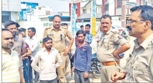
लोगों को समझाते पुलिस कर्मी।

अमृत विचार : तपती धूप में अव्यवस्थाओं के बीच उपभोक्ताओं ने लाइन में लगने के बाद भी गैस सिलेंडर नहीं मिला। आक्रोशित उपभोक्ताओं बदायूं फर्रुखाबाद हाईवे पर जाम लगा दिया। लोगों के जाम लगाते ही वाहनों की लंबी कतार लग गई। सूचना पर पहुंची पुलिस ने लोगों को शांत कर जाम खुलवाया। साथ ही एजेंसी संचालक को स्थल पर व्यवस्थाएं सही रखने और सिलेंडर मुहैया कराने को कहा। सिलेंडर की बुकिंग कराने में लोगों को दिक्कत हो रही है।