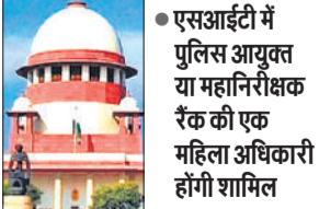
एसआईटी में पुलिस आयुक्त या महानिरीक्षक रैंक की एक महिला अधिकारी होगी शामिल

सुप्रीम कोर्ट ने शुक्रवार को यूपी के डीजीपी को निर्देश दिया कि वह पिछले महिने गाजियाबाद में चार साल की बच्ची के साथ हुए दुष्कर्म और उसकी हत्या के मामले में समयबद्ध जांच के लिए किसी आयुक्त या महानिरीक्षक रैंक की अधिकारी के नेतृत्व में पूरी तरह से महिला अधिकारियों की एसआईटी का गठन करे। कोर्ट ने मामले की जांच के प्रति गाजियाबाद पुलिस की टालमटोल को लेकर चिंता जताई थी। कोर्ट ने निर्देश दिया कि एसआईटी का गठन शनिवार को पूर्वाह्न 11 बजे तक अधिसूचित किया जाए। संबंधित घटना 16 मार्च को हुई थी जब एक पड़ोसी दिहाड़ी मजदूर