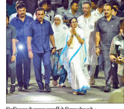
खिदिपुर में ममता बनर्जी ने किया रोड़ शो।

ममता ने कहा, चौरंगी, भवानीपुर, यादवपुर और टॉलींगज में मैंने लोगों को कड़े इरादे, दृढ़ संकल्प, विदेशनिर्देशों के अनुसार, मतदान केंद्रों पर लगे कैमरों में उपयोग किए गए एसडी कार्ड मतदान समाप्त होते ही तुरंत नहीं निकाले जा सकेंगे। संबंधित अधिकारियों को केवल कैमरे उतारने की अनुमति होगी, जिसके बाद कैमरे सेक्टर अधिकारी की निगरानी में रहेंगे।