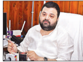
शिया सेन्ट्रल वक्फ बोर्ड के चेयरमैन अली जैदी

उन्होंने कहा कि मैं जब बोर्ड का अध्यक्ष बना तो कर्मचारियों का 37 मुक्त कराया। उन्होंने बताया कि बोर्ड की आमदनी बढ़ाकर बोर्ड के रिटायर हो चुके कर्मचारियों और काम कर रहे कर्मचारियों का लगभग 50 लाख रुपये का भुगतान कराया। मेरे कार्यकाल का 4 महीने का वेतन अभी