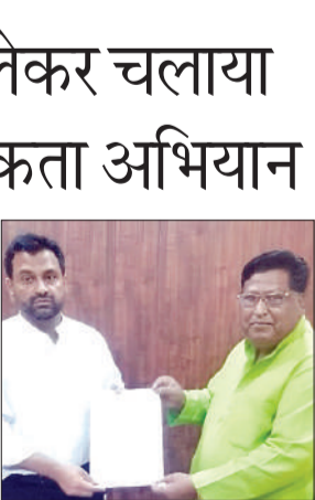
डीआईओएस को हीट वेव को पत्र देते रेडक्रॉस सचिव।