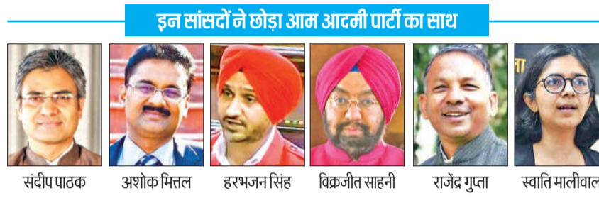
इन सांसदों ने छोड़ा आम आदमी पार्टी का साथ