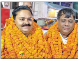
राष्ट्रीय अध्यक्ष जिलाध्यक्ष।