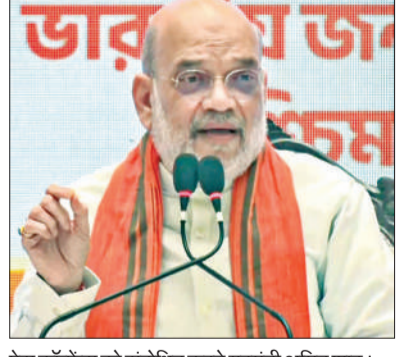
प्रेस कॉन्फ्रेंस को संबोधित करते गृहमंत्री अमित शाह।

भाजपा ने पश्चिम बंगाल में विधानसभा चुनाव के पहले चरण में 152 सीटों में से 110 सीटें जीतने का दावा करते हुए कहा है कि दूसरे चरण में भी जोरदार जीत हासिल कर वह राज्य में प्रचंड बहुमत के साथ सरकार बनाने जा रही है। केंद्रीय गृह मंत्री अमित शाह ने शुक्रवार को यहां एक संवाददाता सम्मेलन में सभी विधानसभा क्षेत्रों के पार्टी कार्यकर्ताओं से मिले फीडबैक को इस दावे का आधार बताया। उन्होंने कहा कि दूसरे चरण में भी जोरदार जीत के साथ भाजपा पांच मं भी जो राज्य में सरकार बनाने जा रही है। भाजपा नेता ने कहा कि राज्य के लोगों ने भाजपा के पक्ष में मतदान कर विकास की राह को चुना है। उन्होंने कहा कि राज्य में मतदान के सभी पुराने रिकार्ड टूट गये हैं और यह मतदान राज्य में सत्ता में परिवर्तन के लिए भाजपा के पक्ष में हुआ है। पश्चिम बंगाल की मुख्यमंत्री ममता बनर्जी के इन आरोपों पर कि भाजपा की