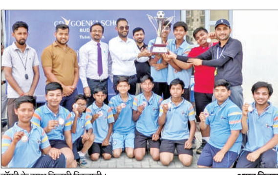
ट्रॉफी के साथ विजयी खिलाड़ी।