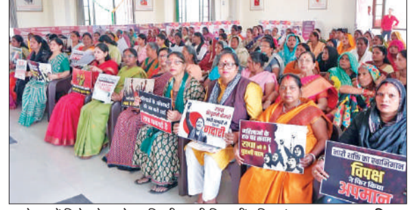
सम्मेलन में विरोध के स्लोगन लिखी तख्ती दिखाती महिलाएं।

अमृत विचार : भाजपा कार्यालय पर जन आक्रोश महिला सम्मेलन का आयोजन किया गया। राज्यमंत्री गुलाब देवी ने कहा कि 16 और 17 अप्रैल को संसद में जो घटनाक्रम हुआ, उसने स्पष्ट कर दिया कि कांग्रेस, सपा और उनके सहयोगी दल महिलाओं को उनका अधिकार देने के पक्ष में नहीं हैं। प्रधानमंत्री नरेंद्र मोदी के नेतृत्व में महिलाओं को लोकसभा और विधानसभाओं में 33 प्रतिशत आरक्षण देने का ऐतिहासिक निर्णय लिया गया, तब विपक्ष ने उसका विरोध कर अपनी महिला-विरोधी नीति को उजागर कर दिया। उन्होंने कहा कि देश की महिलाएं सिर्फ घर तक सीमित नहीं हैं, बल्कि हर क्षेत्र में अपनी प्रतिभा का प्रदर्शन कर रही हैं। पंचायतों से लेकर बड़े