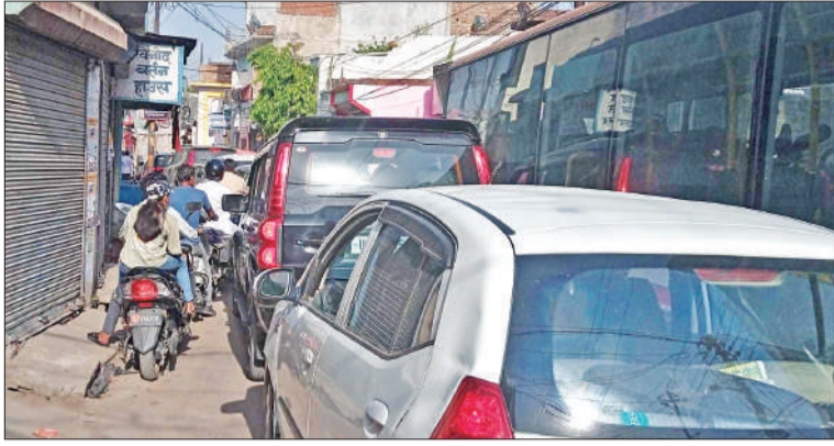
लाल इमली चौराहे से आवास विकास तिराहे तक लगा जाम।

लाल इमली चौराहे से सुभाष नगर नगर तिराहे तक दिन भर जाम लगा रहता है। साथ ही शाम आठ बजे के बाद जाम और अधिक हो जाता है। शाम को जाम लगने का मुख्य कारण है कि लाल इमली चौराहे से मात्र 100 गज की दूरी पर कई होटल है। होटल पर खाना खाने वाले लोग अपने चार पहिया और