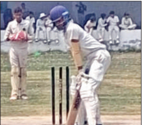
अंडर 16 क्रिकेट लीग में मैच खेलते खिलाड़ी।