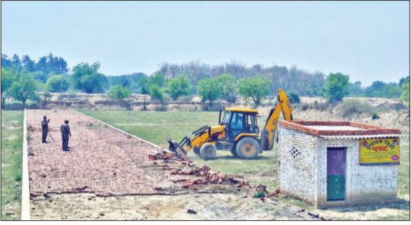
बिना नक्शा पास कराए विकसित की जा रही अवैध कॉलोनी की बाउंड्री तोड़ती जेसीबी।