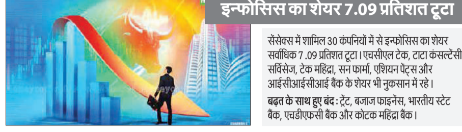
इन्कोसिस का शेयर 7.09 प्रतिशत टूटा