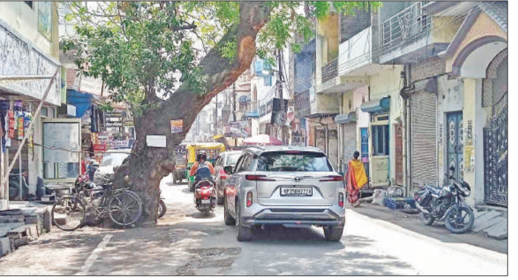
अमृत विचार सड़क पर नीम का पेड़ बना बाधक।

अधिक टेले लगते है। साथ ही ई बसों के निकलने से और जाम लग जाता है। इसके अलावा कुम्हारों वाली गली के पास मंदिर के निकट सड़क काफी सिकुड़ी है और सड़क पर खंभा लगा हुआ है। कुम्हारों ने अपनी दुकानें सड़क की पटरी पर लगा रखी है। यहां पर भी जाम की स्थिति बनी रहती है। लाल इमली चौराहे पर लोगों ने दुकानें नाले पर बना रखी है और सड़क को घेर