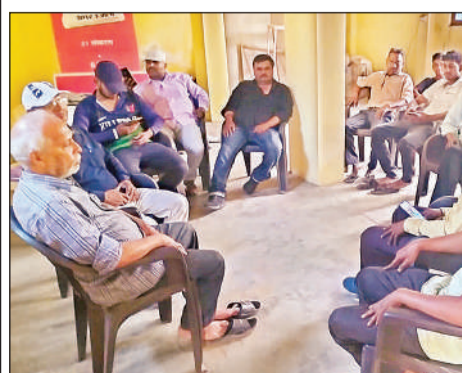
बैठक में उपस्थित न्यूज पेपर वितरक।