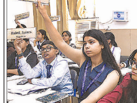
मॉडल यूनाइटेड नेशन में भाग लेते छात्र।