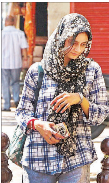
तेज धूप से खुद को बचाने के लिए चुनरी ओढ़कर और छाता लगाकर जाती युवतियां।

गोवंशों को गर्मी, धूप और लू से बचाने के निर्देश दिए हैं। कहा कि दोपहर में टीनशेड पन्नी, तिरपाल आदि से ढके रहें। टीनशेड के ऊपर पराली बिछा दें। इससे टीनशेड नहीं तपेंगे। गोवंशों को ताजा पानी पिलाएं, चारा व साइलेज दें। चिकित्सक नियमित जाकर स्वास्थ्य परीक्षण करें। लापरवाही मिली तो कार्रवाई करेंगे।