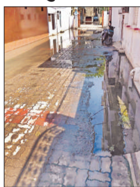
गली में भरा नाली का पानी।

अमृत विचार, लखनऊ: एलडीए रामनगर कॉलोनी में स्थानीय टेकेदार की मनमानी से लोगों के घरों में सीवर का गंदा पानी नाली के रसोई घरों में प्रवेश कर रहा है। हाल यह है कि लोगों का घर से बाहर निकलना मुश्किल है। गर्मी के मौसम में बदबूदार पानी में मच्छरों के लार्वा पनप रहे हैं। एक ओर जहां सरकारी महकमे संचारी रोग से बचाव के लिए अभियान चला रहे हैं, वहीं कॉलोनी के घरों में घुसा गंदा पानी लोगों के लिए समस्या बन गया है। इसी वार्ड के कुडरी रकाबगंज में नालियों में सिल्ट जमा है, लेकिन जिम्मेदार नालियों की डीसिल्टिंग करने में दिलचस्पी नहीं दिखा रहे हैं। खजुहा चौकी, सतीहा माता मंदिर के सामने के इलाकों की नालियों से गंदे पानी की निकासी सिल्ट के कारण बाधित है। इससे इलाके में मच्छर अधिक हैं।