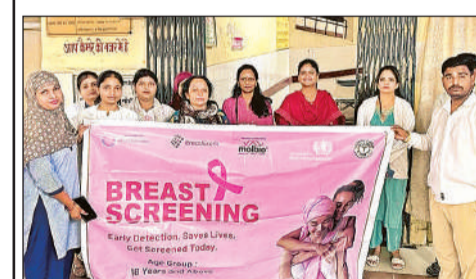
कार्यक्रम में मौजूद चिकित्सक व स्टाफ।