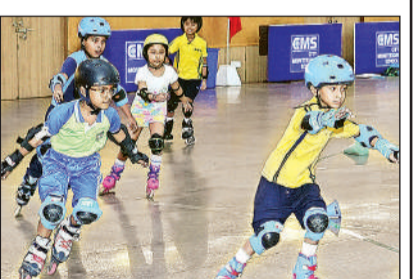
रोलर स्केटिंग में अपनी प्रतिभा का प्रदर्शन करते बच्चे।