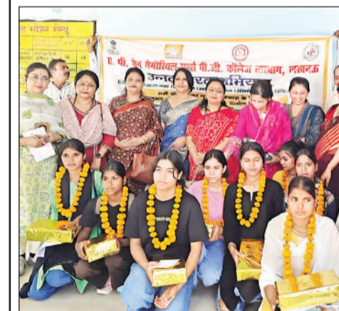
एपी सेन मेमोरियल गर्ल्स पीजी कॉलेज में स्कूली छात्राएं।