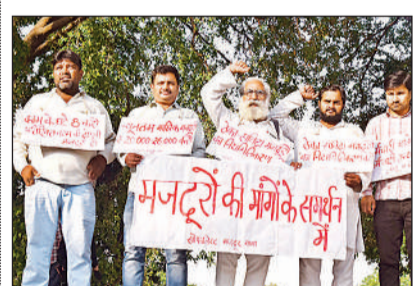
विरोध प्रदर्शन करते पदाधिकारी।