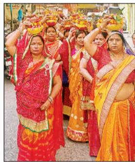
शोभायात्रा में शामिल महिलाएं।