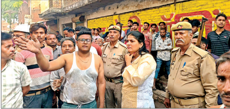
पीड़ित से बातचीत करती अधिकारी।

कर पा रहे हैं। किसानों के अनुसार, बिल्हौर क्षेत्र मक्का उत्पादन के लिए जाना जाता है, लेकिन समय पर पानी न मिलने से फसल सूख रही है। मजबूरन किसानों को डीजल इंजन चलाकर सिंचाई करनी पड़ रही है, जिससे खेती की लागत काफी बढ़ गई है। किसानों ने मांग की है कि खेती बचाने के लिए कम से कम 15 से 16 घंटे बिजली आपूर्ति सुनिश्चित की जाए।