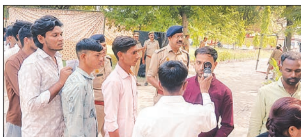
परीक्षा के दौरान परीक्षार्थियों की होती चेकिंग।

इस दौरान डीएम सबसे पहले अटल बिहारी इंटर कॉलेज पहुंचे। फिर उन्होंने राजकीय बालिका इंटर कॉलेज मोती नगर, राजकीय इंटर कॉलेज चमरौली व राजकीय बालिका इंटर कॉलेज का दौरा किया। डीएम ने केंद्रों पर बने कंट्रोल रूम जाकर सीसीटीवी कैमरों की कार्यप्रणाली देखी और निर्देश दिये कि हर एक गतिविधि की रिकॉर्डिंग व लाइव मॉनिटरिंग में कोई चूक न हो। उन्होंने स्ट्रॉग रूम की सुरक्षा व परीक्षा कक्षाओं में परीक्षार्थियों की उपस्थिति व शांतिपूर्ण माहौल का भी अवलोकन