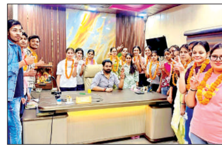
शिक्षक के साथ मौजूद मेधावी छात्र-छात्राएं।