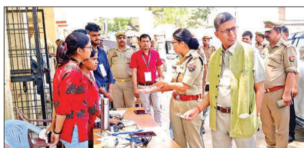
अकबरपुर इंटर कॉलेज में जानकारी लेते डीएम-एसपी।

इस दौरान परीक्षा केंद्रों पर अभ्यर्थियों के प्रवेश, बैठने की समुचित व्यवस्था, पेयजल, शौचालय, प्रकाश, वेंटिलेशन आदि की व्यवस्थाएं जांचीं। अधिकारियों ने केंद्र व्यवस्थापकों, पर्यवेक्षकों, कक्ष निरीक्षकों एवं पुलिस बल को स्पष्ट निर्देश दिए कि परीक्षा की