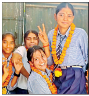
सहेली को गोद में उठाकर खुशी का इजहार करती छात्रा।