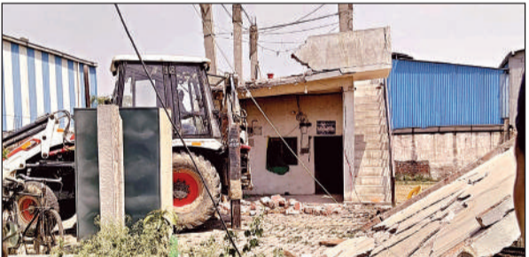
कच्चे ढहाता बुलडोजर।

लॉकर पहले से खुला था और दूसरे लॉकर की चाबी उसके कमरे में मिल गई। उसने चाबी से दूसरा लॉकर खोला और पूरे जेवर समेटकर एक झोले में रखा। पहचान छिपाए के लिए चेहरे पर अंगौछा डालकर निकल गया। पैदल ही अपने घर पहुंचा।