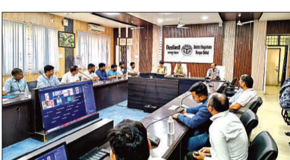
कलेक्ट्रेट में अधिकारियों संग डीएम-एसपी ने की बैठक। अमृत विचार

अमृत विचार: जिलाधिकारी कपिल सिंह व पुलिस अधीक्षक अशोक नरेंद्र पांडेय की संयुक्त अध्यक्षता में गैस आपूर्ति सुचारू बनाए रखने हेतु शनिवार को उच्चस्तरीय बैठक हुई। बैठक में जिला पूर्ति अधिकारी एवं समस्त पूर्ति निरीक्षकों के साथ विस्तृत चर्चा की गई। जनपद के समस्त उपजिलाधिकारियों एवं समस्त क्षेत्राधिकारियों ने वचुंअल माध्यम से प्रतिभाग किया। बैठक के दौरान गैस सिलेंडर की निर्बाध आपूर्ति, डिलीवरी व्यवस्था, डिपो एवं डिस्ट्रीब्यूटर्स की मॉनिटरिंग, शिकायत निवारण तंत्र को और अधिक प्रभावी बनाने तथा कालाबाजारी एवं जमाखोरी पर सख्त निगरानी रखने के संबंध में विस्तारपूर्वक चर्चा की गई। अधिकारियों को स्पष्ट निर्देश