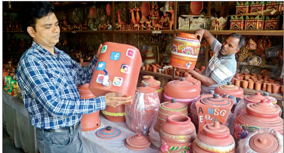
मिट्टी से बने कलात्मक उत्पाद।

थी लेकिन आज आधुनिकता के दौर में गुजरात और राजस्थान के कलाकारों ने हुनर से प्रदेश की सौंधी मिट्टी के घड़ों पर इस्टाग्राम, फेसबुक, व्हाट्सएप की आकृति बनाकर शहरवासियों को आकर्षित कर दिया। आजकल फ्रिज और फ्रिजर के साथ लोग ये मिट्टी के कलात्मक मटके खरीद रहे हैं।