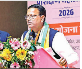
भाजपा प्रदेश अध्यक्ष पंकज चौधरी।