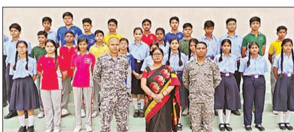
अंबिका स्कूल में एनसीसी ज्वाइन के लिये खड़े बच्चे।