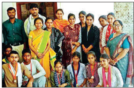
शिक्षकों के साथ मौजूद सफल विद्यार्थी।