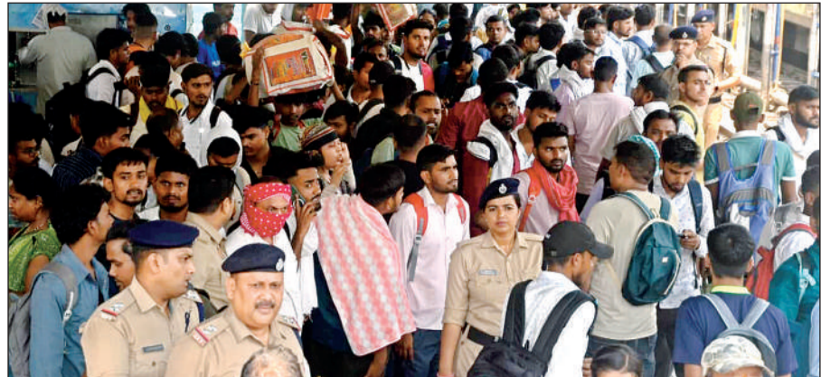
सेंट्रल स्टेशन पर परीक्षार्थियों की भीड़।

होमगार्ड भर्ती परीक्षा के दौरान सिविल डिफेंस वालंटियरों ने बाहर से आए अभ्यर्थियों की मदद की। शहर के प्रमुख चौराहों व स्टेशनों पर तैनात टीम ने रास्ता दिखाने से लेकर स्कूटी व ई-रिक्शा से केंद्र तक पहुंचाया। सेंट्रल स्टेशन से बाहर निकलने अभ्यर्थियों को वालंटियरों ने आटो व टैम्पो को बुक करने को लेकर लोगों की मदद की। परीक्षा शुरू होने से पहले सुबह 07 से 10 बजे व दोपहर 12 से 03 बजे तक कुल 144 वॉर्डन तैनात किए गए, जबकि 35 वॉर्डन रिजर्व में रखे गए। 108 से 10 वॉर्डन पर दो सीनियर वॉर्डन को प्रभारी बनाया गया था। जिलाधिकारी जितेंद्र प्रताप सिंह ने सिविल लाइन स्थित जेएनके इंटर कॉलेज परीक्षा केंद्र का निरीक्षण किया।