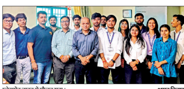
प्लेसमेंट ड्राइव में मौजूद युवा।