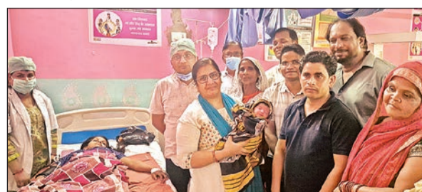
आपरेशन करने वाली टीम के साथ जच्चा-बच्चा व परिजन।