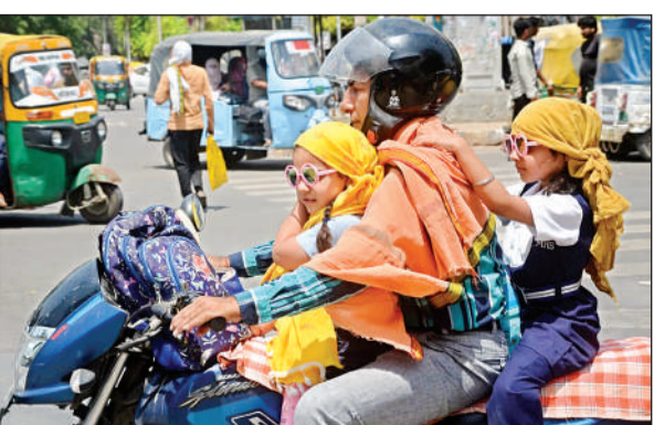
तेज धूप से बचने की जुगत।

अमृत विचार। शहर में शनिवार को तापमान 44 डिग्री सेल्सियस पार हो गया। शहर के अलग-अलग स्थानों पर तापमान में अंतर रहा। सबसे अधिक अधिकतम तापमान एयरफोर्स स्टेशन पर 44.2 दर्ज किया गया। कानपुर नगर का औसत तापमान 43.7 रिकॉर्ड किया गया। उधर भीषण गर्मी के बीच एक राहत भरी संभावना भी मौसम विशेषज्ञों ने जताई। उन्होंने बताया कि शहर में 27 से 30 अप्रैल तक बवंडरबादी व तेज हवाएं चलने की आशंका है। इस बीच कई क्षेत्रों में बारिश भी हो