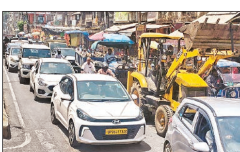
बड़ा चौराहा पर लगा भीषण जाम व मुख्य मार्ग पर भरे पानी से फांदकर निकलता युवक व महिला।

उज्जाव, अमृत विचार। शहर का हृदय स्थल कहा जाने वाला बड़ा चौराहा इन दिनों आम जनता के लिए जी का जंजाल बन चुका है। एक ओर जल निगम की लापरवाही और दूसरी ओर प्रशासन की सुस्ती ने राहगीरों व स्थानीय दुकानदारों का जीना मुहाल कर दिया है। चौड़ीकरण के नाम पर खोदे गए गड्डे व अब सड़क पर बहते गंदे पानी ने दावों की पोल खोल कर रख दी है।