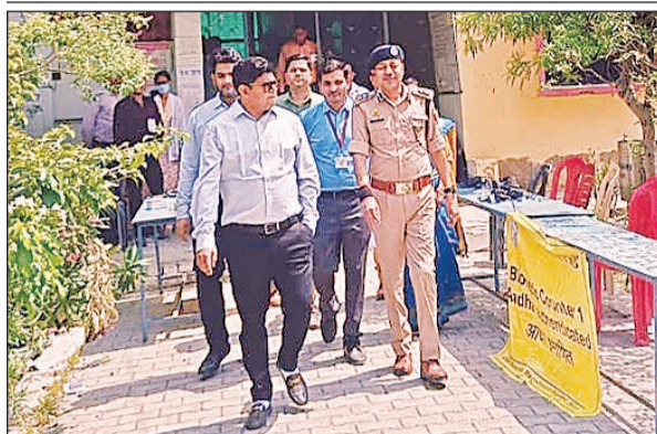
केंद्र का निरीक्षण कर बाहर निकलते डीएम व एसएसपी।