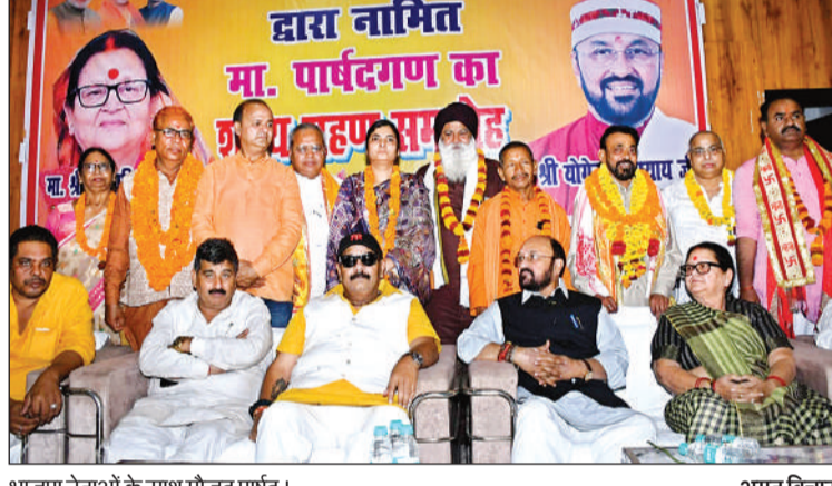
भाजपा नेताओं के साथ मौजूद पार्षद।