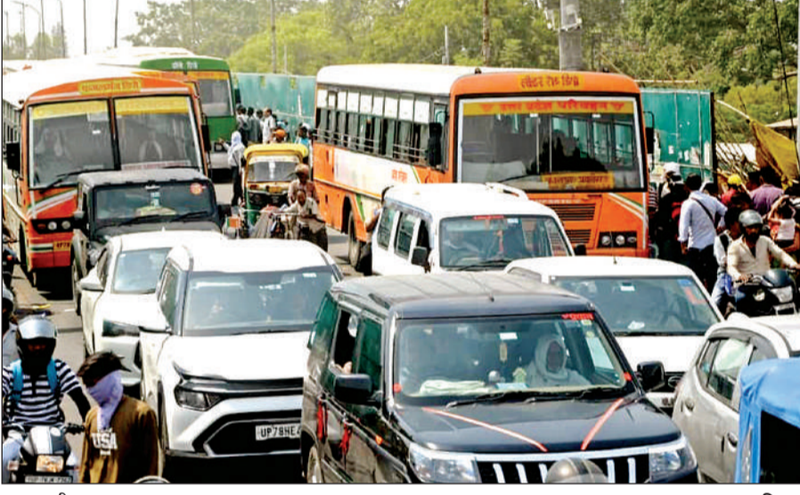
झकरकटी पुल पर लगा जाम। अमृत विचार

ट्रेड शो में इस बार युद्ध का असर भी दिखाई दे रहा है। बताया जा रहा है कि खासतौर पर खाड़ी देशों से आने वाले खरीदार ऑर्डर की सलाई डेट को फाइनल करने से बच रहे हैं। खाड़ी देशों के खरीदार यहां के निर्यातकों के साथ दो से तीन महीनों के बाद से ऑर्डर सलाई की बात कर रहे हैं।