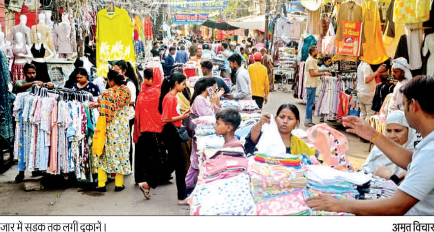
बाजार में सड़क तक लगी दुकानें। अमृत विचार

अमृत विचार। शहर में प्रदेश स्तर की कई बाजारें हैं, जहां अरबों खरबों का कारोबार होता है लेकिन इन बाजारों को आगे से बचाने का कोई इंतजाम नहीं है। अफसोसनाक पहलू ये है कि कई बाजारों जैसे कलक्टरगंज, किदवई नगर सब्जी मंडी, बगाही बाजार, हमराज कॉम्पलेक्स जैसी बड़ी बाजारें आगे से स्वाहा हो चुकी हैं लेकिन आगे से बचाव के संसाधन दुरुस्त नहीं हुए। अतिसेवेदनशील कहे जाने वाले कपड़ा बाजार जनरलगंज के अलावा बेकनगंज, पी रोड, बाकरगंज, गुमटी, गोविंदनगर समेत दर्जनों ऐसी बाजारें हैं, जहां आगे से बचाव की कोई व्यवस्था नहीं है। अधिकतर बाजारों में दुकानदारों ने फुटपाथ किराये पर उठा दिए हैं इस कारण सड़क तक दुकानें लग रही हैं। जहां चाहा, लोग दुकान लगा लेते हैं। इतनी भी जगह नहीं