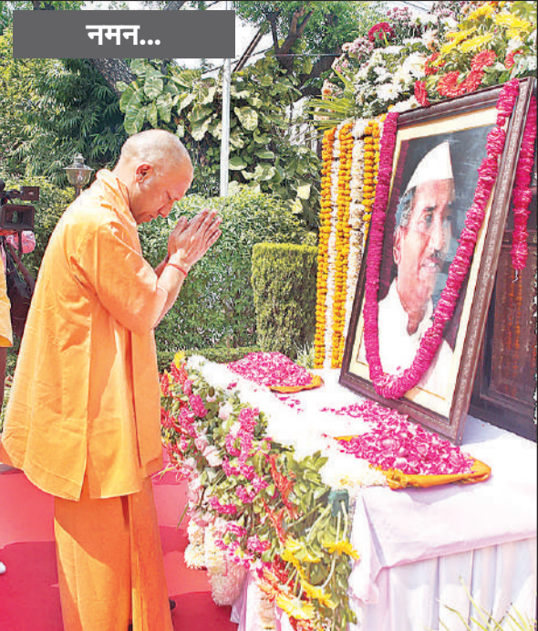
लखनऊ में हेमवती नंदन बहुगुणा के चित्र पर पुष्पांजलि अर्पित करते मुख्यमंत्री योगी।

अमृत विचार: उत्तर प्रदेश माध्यमिक शिक्षा परिषद (यूपी बोर्ड) के परीक्षा परिणामों में समाज कल्याण विभाग द्वारा संचालित जय प्रकाश नारायण सर्वोदय विद्यालयों ने उत्कृष्ट प्रदर्शन करते हुए सरकारी स्कूलों की गुणवत्ता का नया मानक स्थापित किया है। हाईस्कूल में इन विद्यालयों का परिणाम 99.19 प्रतिशत और इंटरमीडिएट में 99.03 प्रतिशत दर्ज किया गया है। अधिकारियों के अनुसार, यह सफलता गुणवत्तापूर्ण शिक्षा, बेहतर