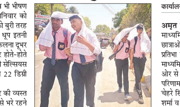
गमछा ओढ़कर गर्मी से बचाव करते छात्र।

गर्मी का सबसे अधिक असर शहर की व्यस्त सड़कों पर दिखा। अमूमन भीड़भाड़ से भरे रहने वाले गांधी नगर तिराहा, आड़वीपी, बड़ा चौराहा व धवन रोड में दोपहर में सन्नाटा पसरा रहा। लोग धूप व हीट स्ट्रोक के डर से घरों व दफ्तरों में दुबके रहे। सड़कों पर इक्का-दुक्का लोग ही नजर आए। जो फिर पर गमछा, छाता या दुपट्टा ओढ़कर खुद को धूप से बचाने का प्रयास कर रहे थे। बढ़ते तापमान के साथ चल रही गर्म पल्लुआ हवाओं ने लोगों की मुश्किलें और बढ़ा दी हैं। बाइक सवारों व पैदल चलने वालों को गर्म हवा के थपेड़ों से शरीर झूलसने का अहसास हो रहा है। राहत पाने के लिए राहगीर पेड़ों की छांव तलाशते दिखे। बाजारों में शीतल पेय पदार्थों, गन्ने के रस व तरबूज की दुकानों पर भी भीड़ देखी गई। लेकिन दोपहर की प्रचंड तपिश ने वहां