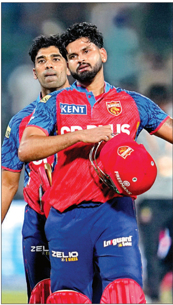
जीत दर्ज करने के बाद पैवेलिए लौटते पंजाब किंग्स के कप्तान श्रेयस अय्यर।

उन्होंने इस सप्ताह के मैड्रिड ओपन से नाम वापस ले लिया था। उन्होंने जब सोमवार को मैड्रिड में