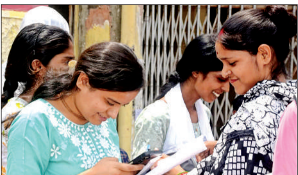
पेपर देकर निकले परीक्षार्थी।

27 अप्रैल तक चलने वाली होमगार्ड भर्ती की लिखित परीक्षा के लिए 53 केंद्र बनाए गए हैं। 20 सेंटर पूर्वी जोन में बनाए गए हैं, जबकि पश्चिम जोन में सबसे कम 7 केंद्र, साउथ जोन में 16 व