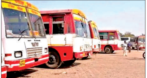
झकरकटी बस अड्डे पर घुप में खड़ी बसें।

अमृत विचार। भीषण गर्मी पड़ रही है, ऐसा नहीं है कि परिवहन विभाग के पास एसी बसें नहीं हैं लेकिन यात्रियों की संख्या को देखते हुए ये बसें कंट के मुंह में जीरा से ज्यादा कुछ नहीं हैं। यही कारण है कि जितनी तेजी के साथ प्राइवेट बसों की संख्या में इजाफा हो रहा है, उतनी तेजी से परिवहन के पास अपनी बसें कम होती जा रही हैं और बसों को किराये पर लेकर चलाने पर ज्यादा ध्यान दिया जा रहा है क्योंकि ये बसें घाटे में चल रही हैं। उधर शहीद मेजर सलमान खान झकरकटी बस अड्डा रेत की तरह