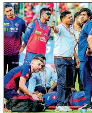
अर्धशतकीय पारी के दौरान शॉट लगाते इशान किशन।

नई दिल्ली। दक्षिण अफ्रीका के तेज गेंदबाज लुगी एंगिडी को दिल्ली कैपिटल्स और पंजाब किंग्स के बीच शनिवार को यहां आईपीएल मैच के दौरान गंभीर चोट लगने के बाद एंबुलेंस से स्थानीय अस्पताल ले जाया गया लेकिन अब उनकी हालत स्थिर है और उन्हें जल्द ही छुट्टी मिल जाएगी। जीत के लिए 265 रन का पीछा कर रही पंजाब किंग्स की पारी के तीसरे ओवर में कप्तान अक्षर पटेल की गेंद पर