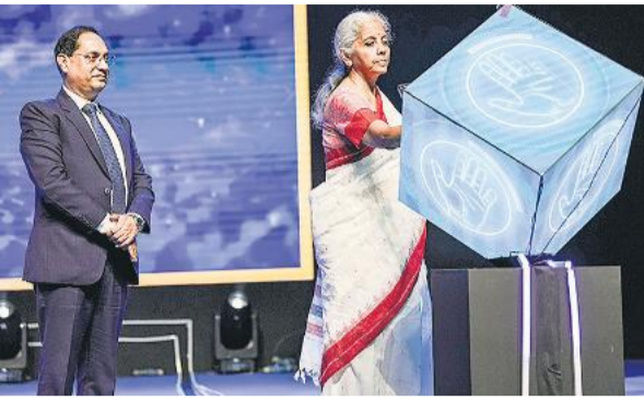
मुंबई में सेबी के 38वें स्थापना दिवस समारोह में अभियान 'जागरूक' का शुभारंभ करती वित्तमंत्री निर्मला सीतारमण। साथ खड़े हैं सेबी के चेयरमैन तुहिनकांत पांडेय।

श्रीमती सीतारमण ने भारतीय प्रतिभूति एवं विनियम बोर्ड (सेबी) के 38वें स्थापना दिवस समारोह को संबोधित करते हुए कहा कि भारतीय बाजारों की यात्रा पारंपरिक ट्रेडिंग रिंग से निकल कर आधुनिक इलेक्ट्रॉनिक ऑर्डर बुक तक, भौतिक शेरय प्रमाणपत्रों से पूर्ण डीमैटैरियलाइजेशन तक, और बिखरी हुई निगरानी से रीयल-टाइम नियामकीय पर्यवेक्षण तक पहुंच गयी