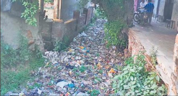
विशाल टॉकीज के पास नाले में जमा गंदगी। ● अमृत विचार

अमृत विचार : शहर के नालों की तलीझाड़ सफाई को लेकर नगरपालिका की तैयारी सुस्त है। पहले टेंडर प्रक्रिया करने में देरी की गई। टेंडर प्रक्रिया पूरी हुई तो अब वर्कआर्डर जारी नहीं हो सका है, जिससे समय पर सफाई कार्य पूरा होने पर सवाल खड़े हो गए हैं। हालात यह है कि नाले पूरी तरह से चोक हैं। पानी फ्लो एक दम बंद है। हल्की बारिश में ही नाले उफना जाते हैं। जिसका पानी सड़कों पर दिखाई देने लगता है। मगर इसके बाद भी जिम्मेदार लापरवाह बने हुए हैं। सवाल यह उठता है कि महज 51 दिनों के भीतर 38 नालों की तलीझाड़ सफाई करना किसी चुनौती से कम नहीं होगा। फिलहाल पालिका सफाई कराने का दिवा कर रही है। बता दें कि ढाई लाख से अधिक आबादी वाले शहर में 27 वार्ड,