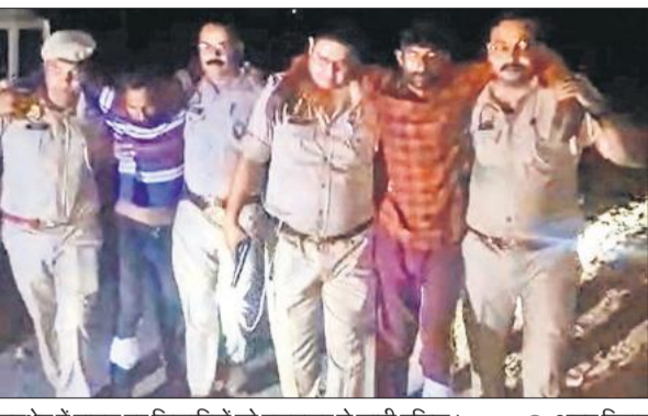
मुठभेड़ में घायल हुए शिकारियों को पकड़कर ले जाती पुलिस। ● अमृत विचार

बता दें कि 15 अप्रैल की रात पीलीभीत टाइगर रिजर्व के बराही रेंज के जंगल में शिकारी घुसे और जंगली सुअर का शिकार कर लिया। सूचना पर घेराबंदी करने पहुंची वन विभाग की टीम ने पकड़ने का प्रयास किया तो शिकारियों ने वन टीम पर फायरिंग कर दी थी। वन विभाग ने विभागीय केस दर्ज करने के साथ ही माधोटांडा थाने में एफआईआर भी दर्ज कराई थी। इसमें हजारों थाना क्षेत्र के ग्राम