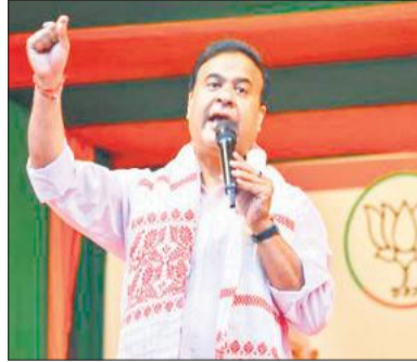
एक जनसभा के दौरान असम के सीएम। (फाइल फोटो) राजनीति के कारण सीमा पर बाड़ लगाने (फेंसिंग) की परियोजना को जानबूझकर धीमा कर रही है। उन्होंने बताया कि नियोजित 456 किलोमीटर के हिस्से में से केवल 77 किलोमीटर के लिए ही जमीन उपलब्ध करायी गयी है।

असम के मुख्यमंत्री हिमंत विश्व सरमा ने शनिवार को कहा कि पश्चिम बंगाल विधानसभा चुनाव महत्वपूर्ण है, क्योंकि इसका परिणाम देश के सभी पूर्वोत्तर राज्यों की सुरक्षा पर प्रभाव डालेगा। भाजपा के वरिष्ठ नेता बिस्वा सरमा ने कहा कि घुसपैठ जानी-मानी समस्या है, जो पश्चिम बंगाल को परेशान कर रही है। श्री सरमा ने कहा कि ये अवैध घुसपैठिये जो बेरोकटोक पश्चिम बंगाल की सीमा पार कर लेते हैं, वे अक्सर असम, त्रिपुरा और झारखंड जैसे पड़ोसी राज्यों में फैल जाते हैं। इससे बावजूद, तृणमूल कांग्रेस सरकार इस बारे में कुछ नहीं करती। श्री सरमा के अनुसार, यह स्थिति देश की सुरक्षा, विशेष रूप से पूर्वोत्तर राज्यों की सुरक्षा को गंभीर खतरे में डालती है। उन्होंने कहा कि बंगाल की ममता बनर्जी सरकार अपनी वोट बैंक की