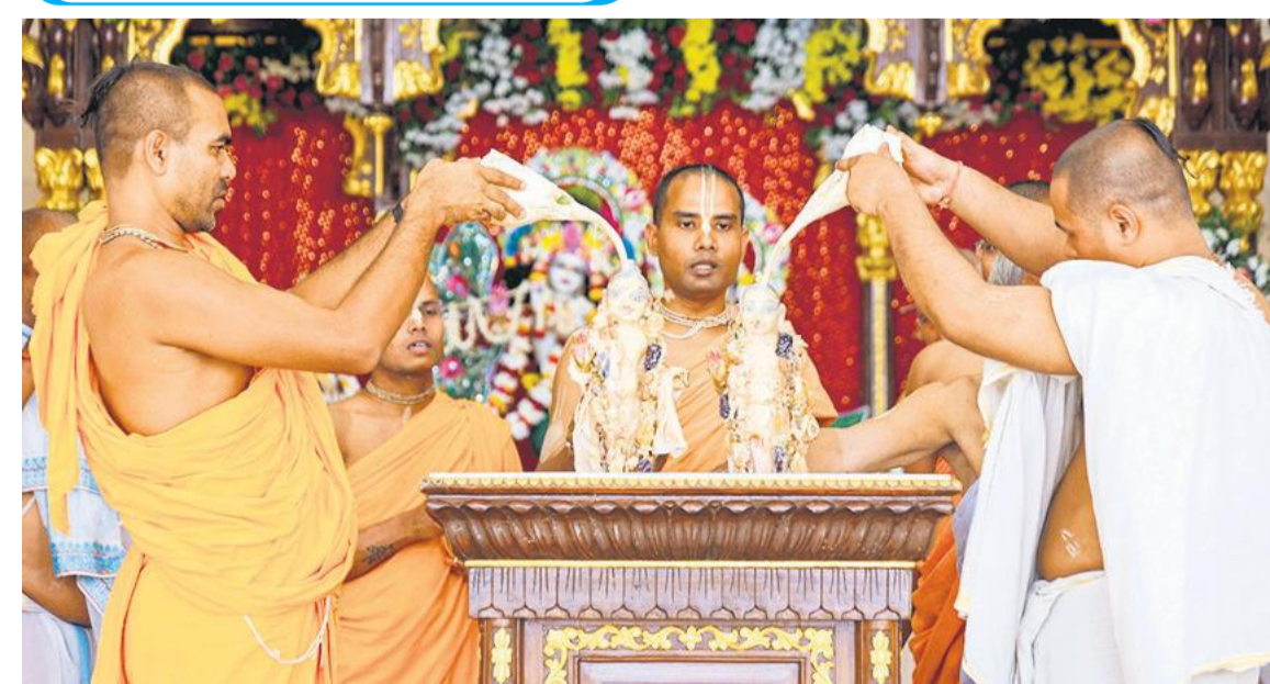
सीता नवमी के अवसर पर शनिवार को कानपुर स्थित इस्कॉन मंदिर में पुरोहित अनुष्ठान करते हुए।