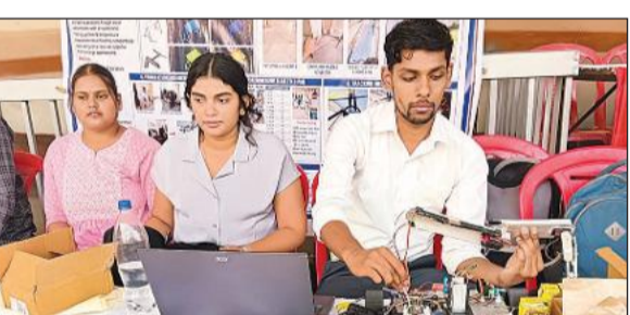
लखनऊ स्थित विज्ञान भवन में अपने प्रोजेक्ट का प्रदर्शन करते विद्यार्थी।

अमृत विचार: विज्ञान एवं प्रौद्योगिकी विभाग, उग्र, की ओर से विज्ञान एवं प्रौद्योगिकी परिषद में आयोजित इंजीनियरिंग अंतिम वर्ष के विद्यार्थियों की नवाचार आधारित परियोजनाओं के प्रदर्शन एवं मूल्यांकन कार्यक्रम में छात्रों के अभिनव प्रोजेक्ट्स ने आकर्षित किया। कार्यक्रम का आयोजन विज्ञान भवन, नबीउल्लाह रोड में किया गया, जहां प्रदेश के विभिन्न तकनीकी संस्थानों के विद्यार्थियों ने समाजोपयोगी और पर्यावरणीय समस्याओं के समाधान पर आधारित मॉडल प्रस्तुत किए। वर्ष 2017 से संचालित इस योजना के अंतर्गत इस बार 2025-