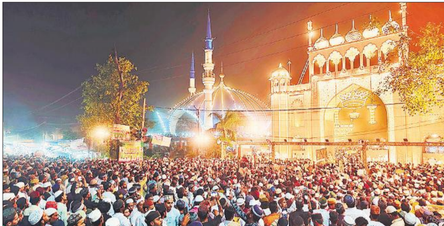
कुल शरीफ के मौके पर उमड़े अकीदतमंद।