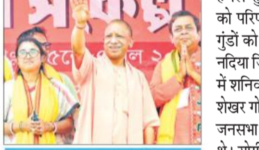
● बंगाल में गरजे सीएम योगी, कहा- 4 मई को टीएमसी के गुंडों को नहीं मिलेगी छिपने की जगह

प. बंगाल दौरे पर पहुंचे मुख्यमंत्री योगी ने टीएमसी पर तीखा हमला बोला। उन्होंने दो-टुक कहा कि ममता दीदी ने इसीलिए सीएए का विरोध किया था, क्योंकि उन्हें चिंता है कि हिंदू ज्यादा हो गए तो सड़कों पर इफ्तारी कैसे होगी। उन्होंने राज्य में अराजकता, माफिया राज, भ्रष्टाचार के लिए टीएमसी को जिम्मेदार ठहराते हुए कहा कि प्रदेश की जनता अब बदलाव चाहती है। मुख्यमंत्री ने कहा कि पहले चरण के मतदान में हुई घटनाओं से स्पष्ट