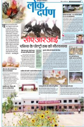
इस बार के रविवारीय संस्करण 'लोक दर्पण' में, सोएआरआई एशिया के पोर्टल हब की गौरवगाथा व अन्य विशेषों पर विशेष सामग्री दी जा रही है।