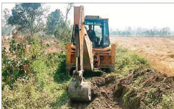
गोमती फीडर चैनल में जेसीबी से कराया जा रहा सफाई कार्य।