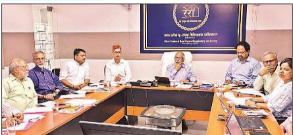
रेरा के लखनऊ मुख्यालय पर बैठक करते अध्यक्ष संजय भूस्रेड्डी।

इससे राजधानी में आवासीय व व्यावसायिक ढांचा और मजबूत होगा। मुरादाबाद में 335.77 करोड़ लागत की एक व्यावसायिक परियोजना में 627 आवासीय इकाइयां, बदायूं में 72 करोड़ की एक आवासीय परियोजना में 226 आवासीय इकाइयां, वाराणसी में 36.68 करोड़ लागत की एक आवासीय परियोजना में 98 आवासीय इकाइयां, मेरठ में 20.25 करोड़ लागत की एक आवासीय इकाइयां विकसित की जाएंगी।