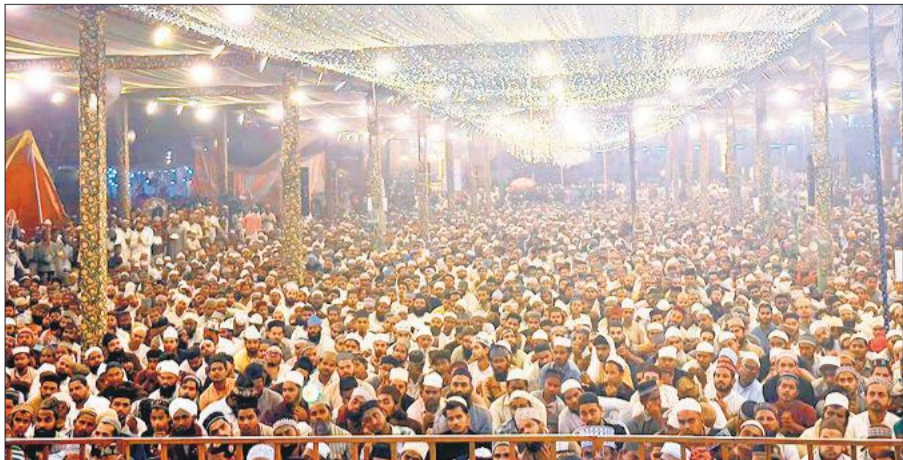
मथुरापुर में मदरसे में ताजुशरिया के कुल शरीफ के मौके पर मौजूद अकीदतमंद।