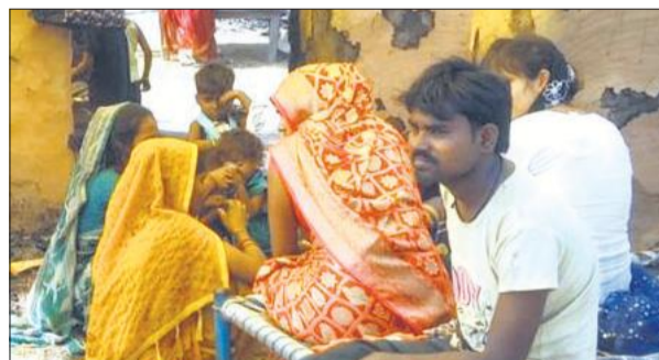
अमरपुर गांव में खुले आसमान के नीचे बैठा अग्नि पीड़ित परिवार।

ग्रामीणों ने बताया कि आग लगते ही वह अपने स्तर पर ही आग बुझाने में जुट जाते हैं। विशेयज्ञों का कहना है कि यदि ब्लॉक स्तर पर अग्निशमन केंद्र स्थापित किए जाएं और गांवों में प्राथमिक अग्निशमन उपकरण उपलब्ध कराए जाएं, तो आग पर शुरुआती स्तर पर ही काबू पाया जा सकता है। इसके साथ ही ग्रामीणों को भी आग से निपटने के