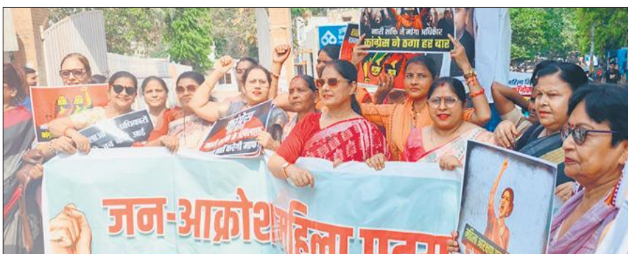
विपक्ष के खिलाफ पद यात्रा निकालतीं भाजपा महिला मोर्चा की पदाधिकारी।

इससे पहले जिला सहकारी बैंक के सभागार में महिला सम्मेलन में राज्य मंत्री ने कहा कि संसद में पेश नारी शक्ति वंदन अधिनियम को पारित न होने देना विपक्ष की सोच-समझी रणनीति का हिस्सा है। उन्होंने आरोप लगाया कि कांग्रेस और सपा ने इस ऐतिहासिक बिल का विरोध कर महिलाओं के अधिकारों को कमजोर करने का प्रयास किया है। कहा कि प्रधानमंत्री नरेंद्र मोदी का स्पष्ट विजन है कि विकसित