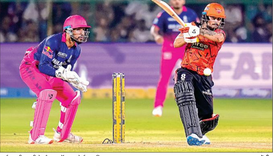
अर्धशतकीय पारी के दौरान शॉट लगाते इशान किशन।