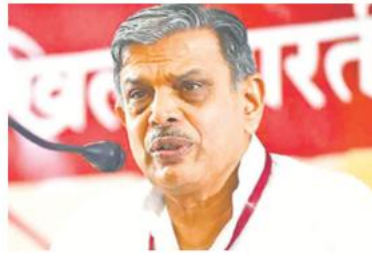
जिस भी देश में आप रहते हैं उसके प्रति पूरा वफादार बनें : होसबाले - 13