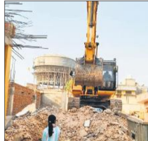
पौराणिक शिव मंदिर के पीछे हटाए गए मंदिरों का मलबा हटाती जेसीबी।