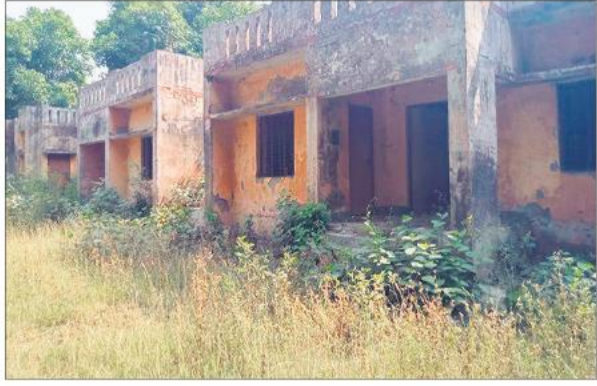
आवासीय परिसर में उगी झाड़ियां।

ग्रामीणों का कहना है कि अस्पताल में डॉक्टर, फार्मासिस्ट और स्टाफ नर्स की अनुपस्थिति से मरीजों को भारी दिक्कतों का सामना करना पड़ रहा है। हालात यह हैं कि वार्ड ब्याय ही मरीजों का इलाज करने के साथ दवाएं भी दे रहा है। महिलाओं के इलाज के लिए तैनात स्टाफ नर्स पिछले