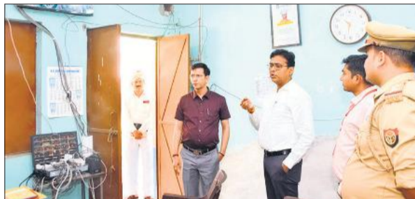
कंट्रोल रूम में सीसीटीवी का अवलोकन करते डीएम अंजनी कुमार सिंह।

अमृत विचार : उग्र होमगार्ड के पदों पर एनरोलमेंट 2026 के पहले दिन जनपद में 16 परीक्षा केंद्रों पर शनिवार को अभ्यर्थियों ने कड़ी सुरक्षा निगरानी में दोनों पाली की परीक्षा दी। इस दौरान दोनों पालियों में बुलाए गए 13056 में से 9970 अभ्यर्थी ही परीक्षा में शामिल हुए, जबकि 3086 ने गैर हाजिर रहकर परीक्षा छोड़ दी। परीक्षा को सफुल बनाने के लिए डीएम अंजनी कुमार सिंह, मजिस्ट्रेट ख्याति गर्ग समेत सेक्टर एमजिस्ट्रेट सतत भ्रमणशील रहकर परीक्षा केंद्रों का जायजा लेते रहे। वही स्टैटिक मजिस्ट्रेट परीक्षा केंद्रों पर मुस्तैद रहे।