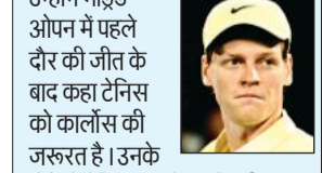
यानिक सिनर को उम्मीद है कि अल्काराज जल्द ही वापसी करेंगे।

यानिक सिनर को उम्मीद है कि अल्काराज जल्द ही वापसी करेंगे। उन्होंने मैड्रिड ओपन में पहले दौर की जीत के बाद कर्नाटक के कार्लोस की जरूरत है। उनके होने से टेनिस का खेल और भी बेहतर हो जाएगा। मुझे उम्मीद है कि वह जल्द वापसी करेंगे। मुझे लगता है कि उनका अगला लक्ष्य विंबलडन (जून में) है, और मैं यही उम्मीद करता हूँ। इसलिए मुझे उम्मीद है कि वह विंबलडन में वापसी करेंगे। इटालियन ओपन पांच मई से और फ्रेंच ओपन 18 मई से शुरू होगा।