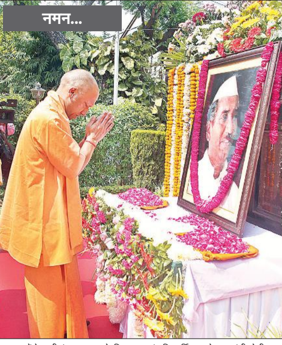
लखनऊ में हेमवती नंदन बहुगुणा के चित्र पर पुष्पांजलि अर्पित करते मुख्यमंत्री योगी।

अमृत विचार: उत्तर प्रदेश माध्यमिक शिक्षा परिषद (यूपी बोर्ड) के परीक्षा परिणामों में समाज कल्याण विभाग द्वारा संचालित जय प्रकाश नारायण सर्वोदय विद्यालयों ने उत्कृष्ट प्रदर्शन करते हुए सरकारी स्कूलों की गुणवत्ता का नया मानक स्थापित किया है। हाईस्कूल में इन विद्यालयों का परिणाम 99.19 प्रतिशत और इंटरमीडिएट में 99.03 प्रतिशत दर्ज किया गया है। अधिकारियों के अनुसार, यह सफलता गुणवत्तापूर्ण शिक्षा, बेहतर