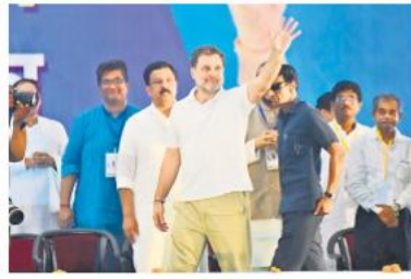
बंगाल में गरीबों की नहीं, अमीरों की मदद कर रही ममता : राहुल गांधी - 12