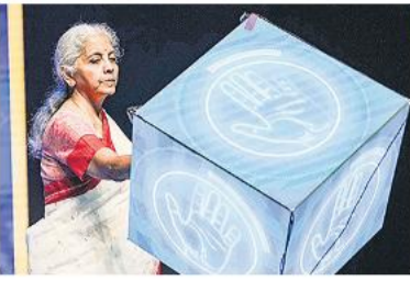
केंद्रीय वित्त मंत्री निर्मला सीतारमण बोली- देश के शेयर बाजार का सफर लम्बा और उपलब्धियां विरवस्तरीय - 12