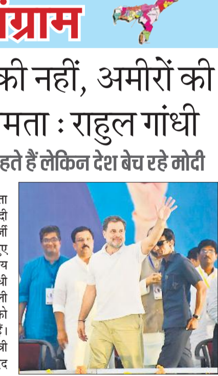
कोलकाता के शहीद मीनार में एक जनसभा के दौरान कांग्रेस नेता राहुल गांधी।

कोलकाता/श्रीरामपुर, एजेंसी। कांग्रेस नेता राहुल गांधी ने शनिवार को प्रधानमंत्री नरेन्द्र मोदी और पश्चिम बंगाल की मुख्यमंत्री ममता बनर्जी को एक ही श्रेणी में रखने का प्रयास करते हुए दोनों पर सत्ता के लालच में गरीबों के बजाय अमीरों की मदद करने का आरोप लगाया। गांधी ने हुगली जिले के श्रीरामपुर में एक चुनावी रैली को संबोधित करते हुए कहा कि मोदी स्वयं को देशभक्त कहते हैं, लेकिन वह देश को बेच रहे हैं। उन्होंने कहा कि पश्चिम बंगाल में मुख्यमंत्री ममता बनर्जी गरीबों के बजाय अमीरों की मदद कर रही हैं, वहीं मोदी पूरे देश में यही कर रहे हैं... दोनों का रोजगार के अवसर पैदा करने से कोई लेना-देना नहीं है। दोनों को सत्ता चाहिए, लेकिन जनता के लिए काम नहीं करते। लोकसभा में नेता प्रतिपक्ष ने आरोप लगाया कि प्रधानमंत्री जहां भी जाते हैं, लोगों में नफरत और डर फैलाते हैं। देश दो विचारधाराओं के बीच टकराव देख रहा है।