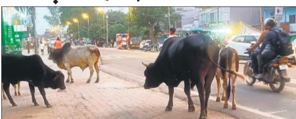
हाईवे पर छुट्टा पशुओं के झुंड। ● अमृत विचार

मझौला, अमृत विचार : कस्बे में पिछले कई दिनों से छुट्टा पशुओं की समस्या बढ़ती जा रही है। शाम के वक्त टनकपुर हाईवे और सितारगंज रोड पर बड़ी संख्या में पशुओं के झुंड विचरण करते हैं। इससे हादसे का डर बना हुआ है। बाजार और मुख्य मार्गों पर भी स्थिति बदहाल है। स्कूली बच्चे निकलते हैं तो उन पर हलके का डर सताया रहता है। कई बार लोग टक्कार खाए भी हो चुके हैं। वहीं, पशु भी सुरक्षित नहीं है। कस्बे के लोगों ने इस समस्या के समाधान की मांग की है।