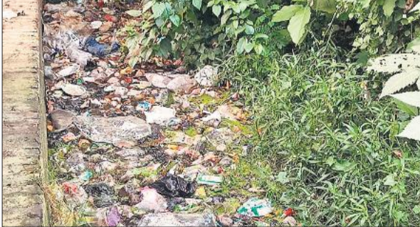
गांधी स्टैडियम रोड पर चोक नाला। ● अमृत विचार

से पहले इन नालों की तलीझाड़ सफाई कराई जाती है, ताकि जल निकासी सुचारु बनी रहे और सड़कों पर पानी न भर सके। इस बार टेंडर के बाद भी काम शुरू न होने से पूरी व्यवस्था पर प्रश्नचिह्न लगे गया है। जमीनी हकीकत यह है कि अधिकांश नालों में पॉलिथीन, कूड़ा-कचरा और