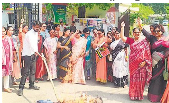
पुतला फूँकतीं और नारेबाजी करतीं महिलाएं।