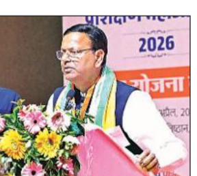
भाजपा प्रदेश अध्यक्ष पंकज चौधरी।

भूमिका निभाते हैं। उन्होंने जिला स्तर पर आयोजित होने वाले प्रशिक्षण वर्गों को सुव्यवस्थित और परिणामोन्मुखी बनाने के निर्देश दिए। कहा कि नरेंद्र मोदी के नेतृत्व में हो रहे कार्यों को जन-जन तक पहुंचाने में प्रशिक्षित कार्यकर्ताओं की अहम भूमिका है, इसलिए प्रशिक्षण को सतत प्रक्रिया के रूप में अपनाया जाना चाहिए। प्रदेश महामंत्री (संगठन) धर्मपाल सिंह ने कहा कि भाजपा