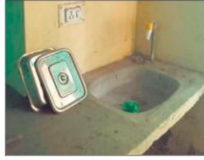
लैब में हैंडवॉश की खराब हालत।

करीब छह माह से अनुपस्थित हैं। वहीं लैब टेक्नीशियन के स्थानांतरण के बाद से सभी प्रकार की जांचें ठप पड़ी हैं। इससे खासकर गर्भवती महिलाओं को परेशानी झेलनी पड़ रही है। ग्रामीणों के अनुसार अस्पताल की दूरी और निगरानी के अभाव के चलते यहां अधिकारी भी कम ही पहुंचते हैं। नतीजतन मरीजों को जांच और इलाज के लिए करीब 20 किलोमीटर दूर गोला जाना पड़ता है। इमरजेंसी की स्थिति में यह देरी जानलेवा साबित हो सकती है। अस्पताल परिसर में चारों ओर गंदगी का अंबार लगा है। झाड़-झंखाड़, कूड़े के ढेर और बदबू से हालात बदतर हैं।