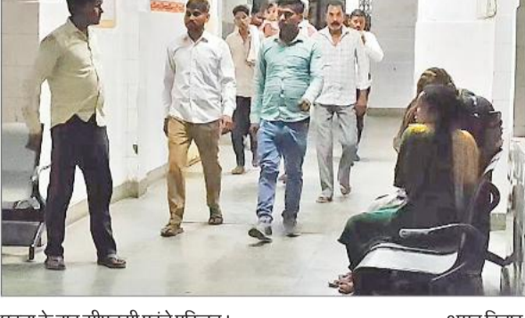
घटना के बाद सीएचसी पहुंचे परिजन।