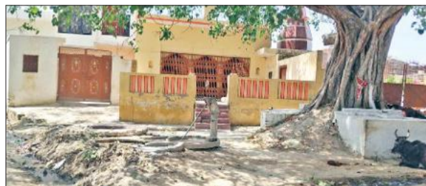
गांव पिंदारा स्थित ठाकुरजी महाराज मंदिर।

अमृत विचार : तहसील बिसौली क्षेत्र के एक गांव के कई अधिकारी बड़े पदों पर रहे हैं। कुछ सेवानिवृत्त हो गए तो बहुत से अभी सेवारत हैं। इसके बाद भी गांव मूलभूत सुविधाओं से वंचित है। सफाईकर्मों के तहसील पर संबद्ध होने की वजह से सफाई नहीं हो पा रही है। खेल मैदान न होने से युवा सेहत नहीं बना पा रहे हैं। गांव के श्मशान घाट तक जाने के लिए कोई मार्ग नहीं है। विकास क्षेत्र आसफपुर के गांव पिंदारा यादव और जाटव बाहुल्य है। गांव में 2800 मतदाता