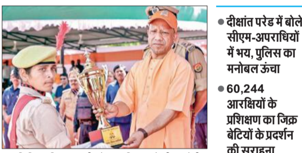
नवप्रशिक्षित महिला आरक्षी को सम्मानित करते सीएम योगी।

योगी ने बताया कि 60,244 आरक्षियों के इस बड़े बैच का प्रशिक्षण प्रदेश के विभिन्न केंद्रों में एक साथ संपन्न कराना यूपी पुलिस की क्षमता और सुधारों का प्रमाण है। उन्होंने कहा कि पुलिस बल को आधुनिक, सफा और संवेदनशील बनाने के लिए सरकार लगातार काम कर रही है। मुख्यमंत्री ने महिला आरक्षियों के प्रदर्शन की विशेष सराहना करते हुए कहा कि उन्होंने प्रशिक्षण के दौरान मजबूती, तत्परता, समर्पण और अनुशासन का उत्कृष्ट उदाहरण प्रस्तुत किया है। उन्होंने कहा कि प्रशिक्षण के दौरान जितना अधिक पसीना बहाया