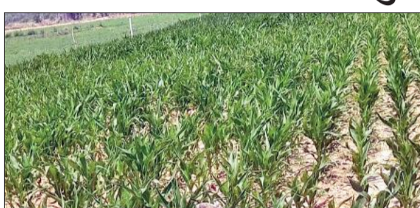
खेत में सूख रही मक्का की फसल।

जनपद के एक बड़े रकबे में मक्का की फसल खेतों में खड़ी है। साथ ही मेंथा और सब्जियां भी तैयार हो रही हैं। लेकिन मई-जून में तैयार होने वाली मक्का की फसल को हर आठवें दिन पानी चाहिए, तभी मक्का समय पर पककर तैयार होगी। इस समय बिजली की अघोषित कटौती होने से निजी ट्यूबवेल बंद हैं जिससे मक्का मेंथा की सिंचाई नहीं हो पा रही है। मक्का मुरझाने लगी है।