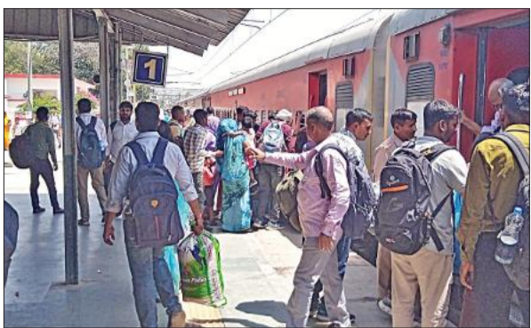
ट्रेन में होमगार्ड परीक्षार्थियों की भीड़।

परीक्षा के दौरान केंद्रों पर व्यवस्थाएं दुरुस्त रहीं और अभ्यर्थियों को किसी प्रकार की