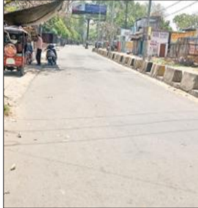
तेज धूप में सड़क पर पसरा सन्नाटा।

रविवार को आसमान से आग उगलने वाले सूरज की तपिश ने लोगों को घरों में कैद कर दिया। तेज गर्मी ने के चलते लोग बाहर नहीं दिखाई दिए। रविवार का तापान 42 डिग्री सेल्सियस के आस-पास रहा जिससे जनजीवन प्रभावित हुआ। अब हर दिन तेज धूप के साथ आ रहा है। सुबह सात बजे से ही गर्मी शुरू हो जाती है जो दोपहर होते-होते और कहर ढाने लगती है। आज गर्मी का आलम