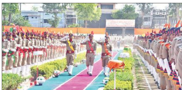
दीक्षांत परेड समारोह में शामिल रिक्रूट्स।