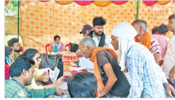
स्वास्थ्य मेले में मरीजों की जांच करते डॉक्टर।