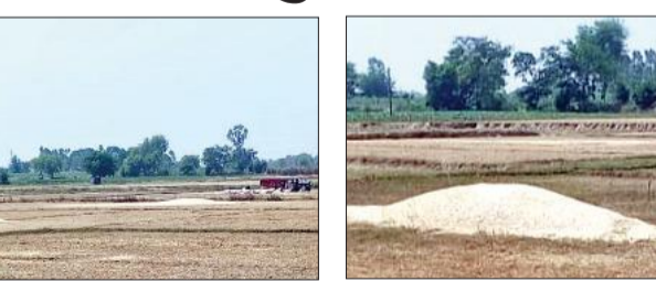
खेतों में जगह-जगह पड़ा भूसा।

पन्द्रह दिनों से खेतों में रात दिन काम कर रहे हैं। किसी तरह गेहूं को घर तक पहुंचाने में जुटे हैं। इन पन्द्रह दिनों में कई बार बादल छाए, तेज हवाएं चलीं जिससे किसानों की धड़कन घटती बढ़ती रही। हालांकि बारिश नहीं हुई। मौसम लगातार गर्म होता रहा जिससे किसान भी खेतों में डूटे रहे। मात्र पन्द्रह दिन के अंदर किसानों ने गेहूं काट कर घर तक पहुंचा दिया। अब गेहूं कुटिया में भरा जा रहा है जो पूरे साल किसान और