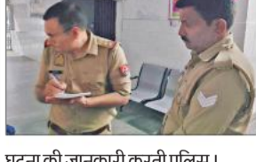
घटना की जानकारी करती पुलिस।