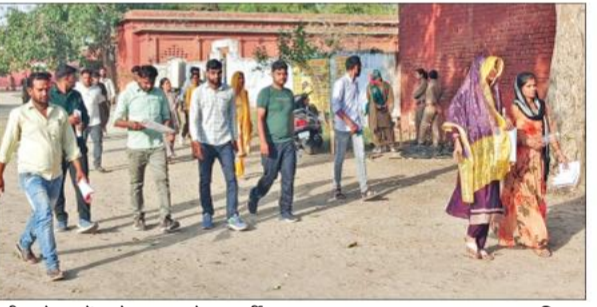
परीक्षा देकर केंद्र से बाहर आते अभ्यर्थी।

अमृत विचार : बेरोजगारी एक समस्या बन चुकी है। किसी भी विभाग में भर्ती निकलने पर आवेदनों की भरमार हो जाती है जिसमें स्नातक से लेकर एमएससी, बीएससी से लेकर डिग्रीधारी तक शामिल हो जाते हैं। जिले के 15 केंद्रों पर चल रही होमगार्ड भर्ती परीक्षा में भी ऐसा ही देखने मिल रहा है। हाईस्कूल योग्यता वाले पद के लिए बीएससी, एमएससी और बीएड डिग्रीधारी तक शामिल हैं। सभी एक ही बात कहते हैं कि जब रोजगार नहीं मिल रहा तो