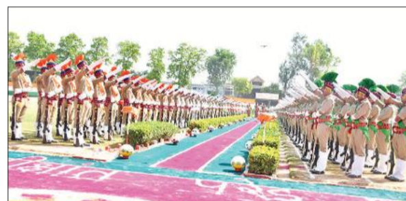
पद व गोपनीयता की शपथ लेते रिक्रूट्स।

भव्यता के साथ संपन्न हुआ। 489 प्रशिक्षु रिक्रूट आरक्षियों ने अपने कठोर और अनुशासित प्रशिक्षण के बाद परेड का शानदार प्रदर्शन कर अपनी दक्षता, अनुशासन