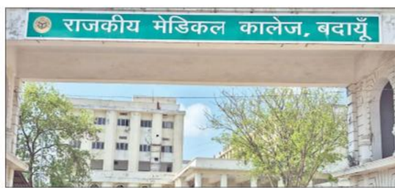
राजकीय मेडिकल कॉलेज एचएफएनसी वेंटिलेटर की सुविधा को तैयार।

राजकीय मेडिकल कॉलेज में पिछले कुछ सालों से कई तरह की सुविधाएं शुरू हो चुकी हैं जिससे मरीज लाभान्वित हो रहे हैं। फिर भी कुछ मरीजों की गंभीर स्थिति को देखते हुए बाहर को रेफर करना पड़ रहा है। यहां पर आईसीयू कक्ष काफी समय से है जिसमें वेंटिलेटर भी हैं। लेकिन यहां पर जो वेंटिलेटर हैं वह सामान्य स्तर के हैं उनसे मरीजों को ऑक्सीजन तो मिलती है लेकिन वह बहुत धीमी होती है जिससे कभी कभी मरीज को