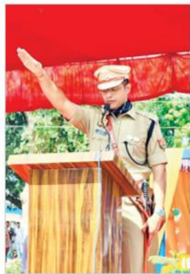
● अमृत विचार शपथ दिलाते एसपी।