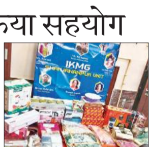
कन्या को भेंट की गई विवाह सामग्री।

अमृत विचार : आईकैमजी संस्था की ओर से अंतरराष्ट्रीय खत्री महासभा ग्रुप के नेतृत्व में जरूरतमंद कन्या के विवाह के लिए सहयोग किया गया। संस्था के सभी सदस्यों ने मिलकर विवाह के लिए आवश्यक सामग्री एकत्रित कर कन्या को प्रदान की।