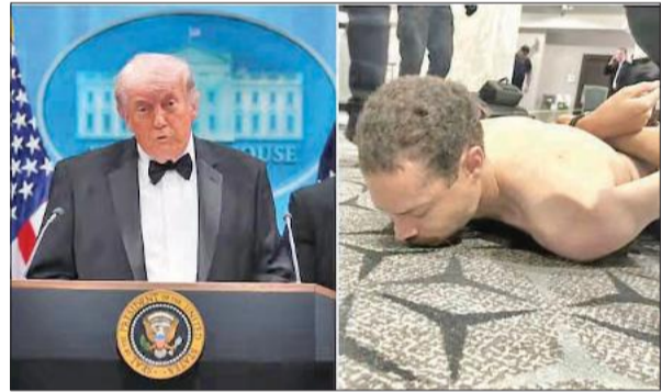
प्रेस कॉन्फ्रेंस कर घटना की जानकारी देते व दबोचा गया हमलावर।

घटना के दौरान वहां मौजूद मेहमान अपनी जान बचाने के लिए मेजों के नीचे छिप गए। कई लोगों ने बताया कि भूमिगत विशाल बॉलरूम के बाहर गोली चलने जैसी आवाजें सुनाई दीं। फायरिंग के दौरान एक गोली एक अधिकारी को लगी लेकिन बुलेटप्रूफ जैकेट पहने होने के कारण वह सुरक्षित