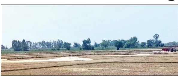
ट्रेक्टर ट्राली से भूसा ढोते किसान।

इस बार होली के बाद से कई बार मौसम बिगड़ चुका है, जिससे किसानों की गेहूं की फसल को नुकसान पहुंचा। आंधी-बारिश ने किसानों की धड़कने बढ़ा दी। गेहूं की फसल खेतों में गिर गई जिससे गेहूं का खाना पतला हो गया। उत्पादन में भारी कमी आ गयी। मौसम से घबराए किसान पिछले