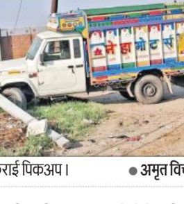
खंबे से टकराई पिकअप।