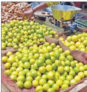
बाजार में ठेले पर बिकता नींबू।

गर्मी से राहत में नींबू एक बेहतर विकल्प माना जाता है। लोग नींबू की शिकंजी बनाकर पीने हैं। साथ ही सलाद में भी इसका उपयोग होता है। लेकिन भीषण गर्मी पड़ने के साथ-साथ नींबू के दामों में बेहताशा वृद्धि हुई है। इन दिनों ककराला रोड स्थिति मंडी में नींबू का थोक भाव 200 से 220 रुपये किलो पहुंच गया है। फुटकर में एक नींबू दस रुपये का बिक रहा है। किलो के हिसाब से तीन सौ रुपये बेचा जा रहा है जबकि अनार