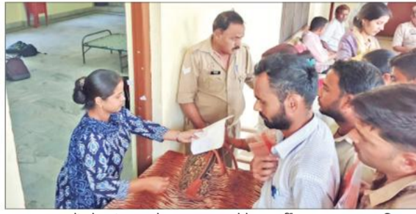
स्काउट भवन में बने स्टॉप रूम से अपना सामान लेते अभ्यर्थी।

परास्नातक की पढ़ाई है। पति भी प्रोफेसर सर्विस करते हैं। प्रोफेसर से मिलने वाले वेतन से घर चलाना मुश्किल हो रहा है इसलिए होमगार्ड के लिए प्रयासरत हूँ। अब सरकार इसमें भी अच्छा मानदेय देती है। होमगार्ड के हिस्सा से पेर और सरल होना चाहिए था।