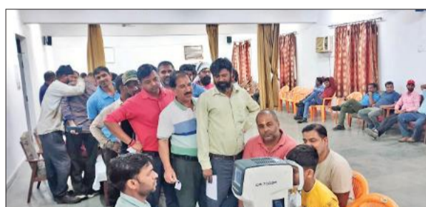
मकसूदापुर चीनी मिल में आयोजित नेत्र शिविर में मरीजों की जांच करते डॉक्टर।