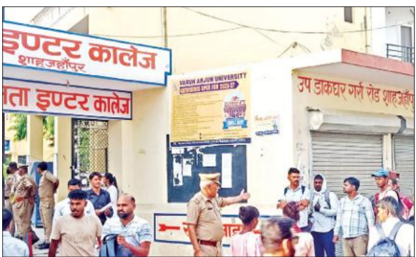
रविवार को जनता इंटर कॉलेज केंद्र से होमगार्ड परीक्षा देकर बाहर निकलते अभ्यर्थी।

● 5345 पंजीकृत में पहली पाली में 1118 और दूसरी में 975 रहे अनुपस्थित