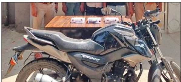
आरोपियों से बरामद की गई बाइक और लूटा गया सामान।