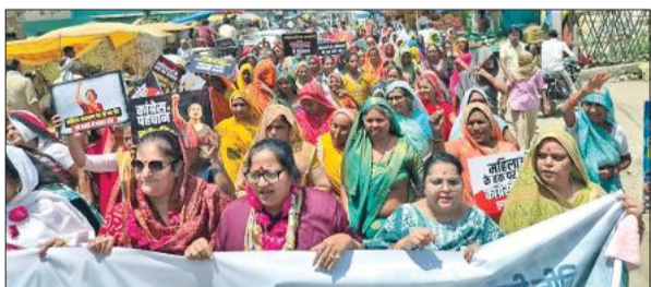
महिला जन आक्रोश मार्च में नारेबाजी करती महिलाएं।