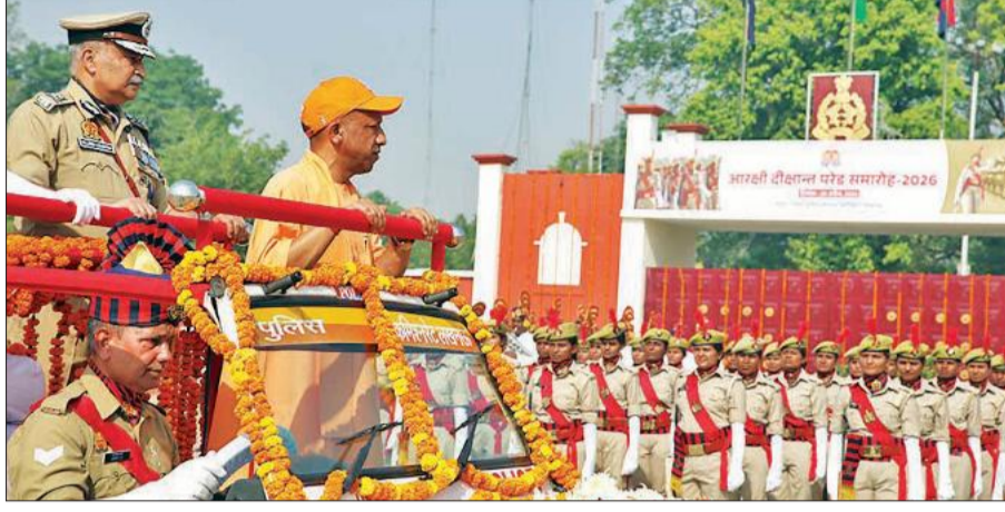
पुलिस लाइन लखनऊ में 60,244 आरक्षी नागरिक पुलिस सीधी भर्ती वर्ष 2025-26 बैच के पुलिस आरक्षियों के दीक्षांत परेड समारोह एवं परेड की सलामी लेते व निरीक्षण करते मुख्यमंत्री योगी।

लखनऊ। प्रधानमंत्री मोदी मंगलवार को उत्तर प्रदेश के दो दिवसीय दौरे पर आएंगे। प्रधानमंत्री पहले दिन 28 अप्रैल की शाम करीब पांच बजे वाराणसी में 'महिला सम्मेलन' में हिस्सा लेंगे, जहां वह लगभग 6350 करोड़ रुपये की विभिन्न विकास परियोजनाओं का लोकार्पण एवं शिलान्यास करेंगे। साथ ही वह एक जनसभा को भी सम्बोधित करेंगे। मोदी 29 अप्रैल को सुबह करीब साढ़े आठ बजे वाराणसी में श्री काशी विश्वनाथ मंदिर में दर्शन और पूजा करेंगे। इसके बाद प्रधानमंत्री हरदोई जाएंगे जहां वह गंगा एक्सप्रेसवे का उद्घाटन करेंगे और इस अवसर पर जनसभा को संबोधित भी करेंगे।