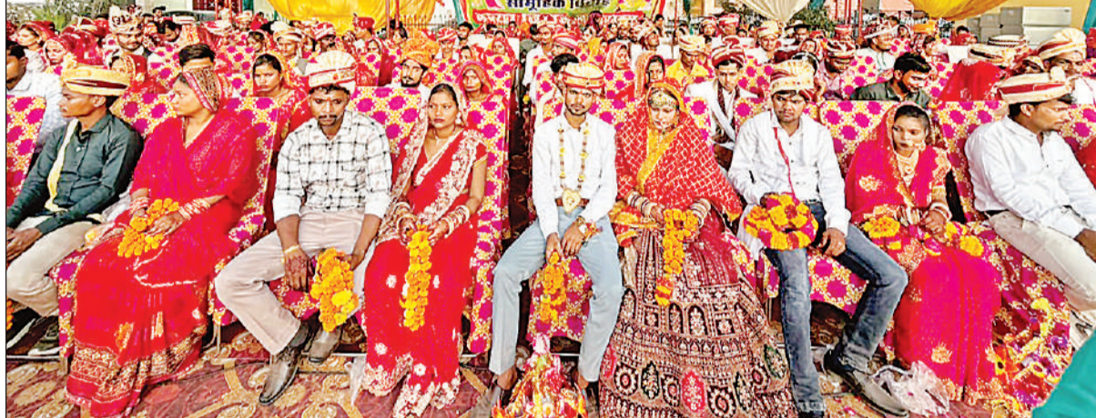
दुर्गा जी मंदिर कल्याण मंडप में नवयुगल और अन्य लोग।