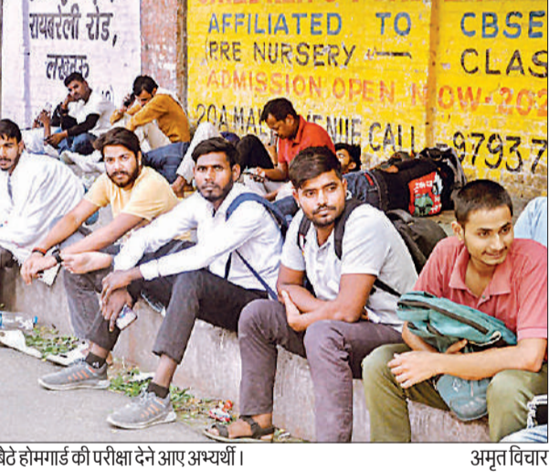
चारबाग स्थित एपीसेन पीजी कॉलेज के बाहर बैठे होमगार्ड की परीक्षा देने आए अभ्यर्थी।