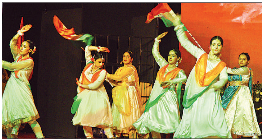
अटल की कविताओं पर आधारित नृत्य नाटिका प्रस्तुत करती कलाकार।