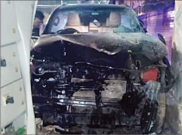
हादसे के बाद क्षतिग्रस्त कार।