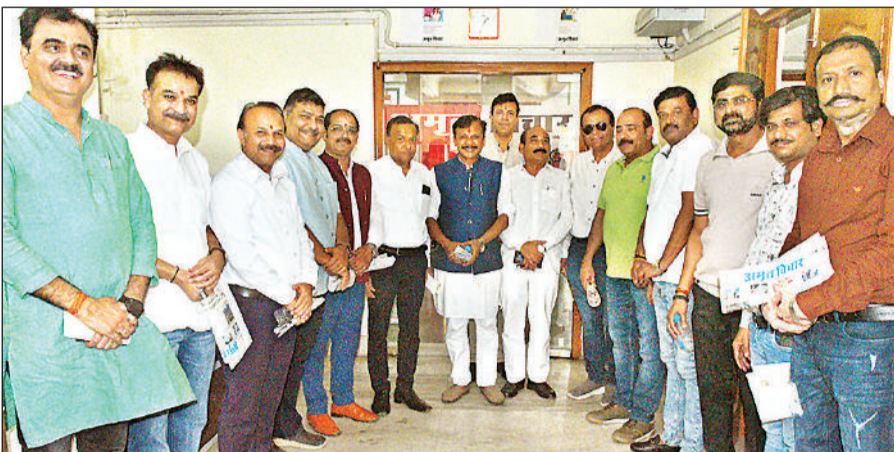
अमृत विचार कार्यालय में हुई परिचर्चा के बाद शहर के प्रतिष्ठित कारोबारी।