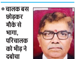
हादसा देख रहे वक्त हुआ हादसा मदेयगंज स्थित खदरा चुंगी की घटना

अमृत विचार : मदेयगंज स्थित खदरा चुंगी के पास रविवार सुबह रोडवेज बस से उतरते समय हाईकोर्ट के रिटायर्ड पेशकार असंतुलित होकर सड़क पर गिर गए। जब तक वह संभल पाते, चालक ने बस आगे बढ़ा दी और पहिए के नीचे आने से उनकी मौके पर ही दर्दनाक मौत हो गई। हादसे के बाद मौके पर चीख-पुकार मच गई। चालक बस छोड़कर फरार हो गया, जबकि भीड़ ने परिचालक को पकड़ लिया। सूचना पर पहुंची पुलिस ने शव को पोस्टमार्टम के लिए भेज दिया और बस को कब्जे में ले लिया।