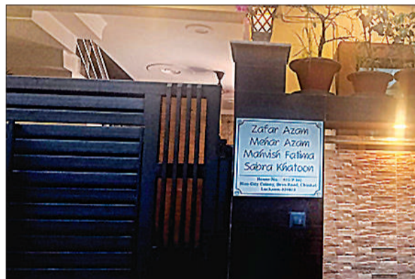
इसी बिल्डिंग में हुई घटना।