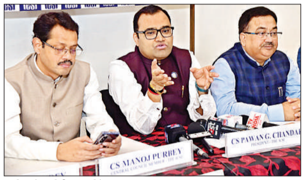
चर्चा करते आईसीएसआई के सदस्य।