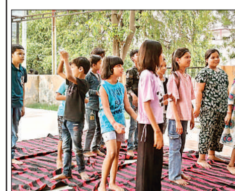
चबूतरा थियेटर पाठशाला में प्रशिक्षण लेते बच्चे।