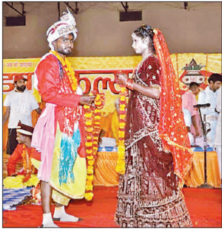
ऐशबाग रामलीला मैदान के आयोजन में एक दूसरे को जयमाला पहनाते वर-वधु और विवाह की रस्में पूरी करते जोड़े।