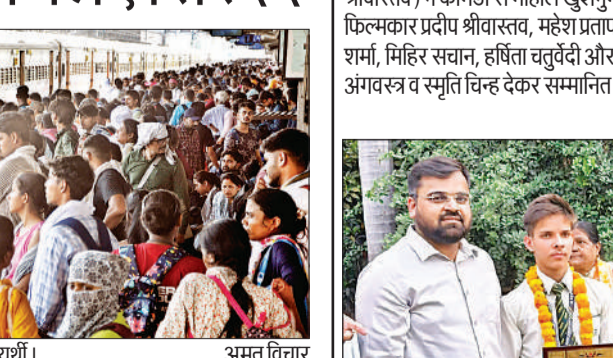
ट्रेन पकड़ने के लिए पहुंचे भारी संख्या में अभ्यर्थी। अमृत विचार

रही है, जिससे बादशाहनगर और लखनऊ जंक्शन पहुंचने वाले यात्रियों को लंबा इंतजार करना पड़ा। वहीं 05058 नई दिल्ली-गोरखपुर एक्सप्रेस लगेभग 5 घंटे देरी से संचालित हो रही है।