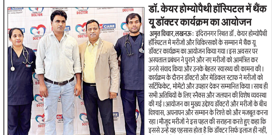
कार्यक्रम के मौके पर उपस्थित डॉक्टर और मरीज।