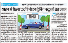
अमृत विचार में प्रकाशित खबर।