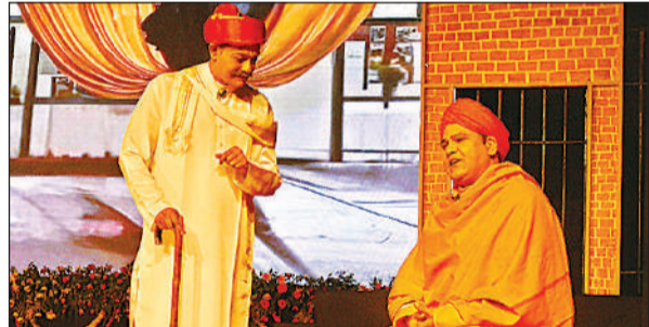
नाटक लोकमान्य बाल गंगाधर तिलक का मंचन करते कलाकार।