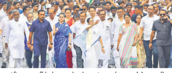
मुख्यमंत्री ममता बनर्जी ने कोलकाता रोड शो कर मांगा समर्थन।

तथा मतदाताओं से कई लुभावने वादे किए। दूसरे चरण में राज्य के 142 विधानसभा क्षेत्रों में 29 अप्रैल को मतदान होगा, जिसमें 1,64,35,627 पुरुष, 1,57,37,418 महिलाओं और 792 तृतीय-लिंग के मतदाताओं समेत कुल 3,21,73,837 मतदाता मतदान के पात्र हैं। पहले चरण में 152 सीट पर चुनाव के लिए मतदान