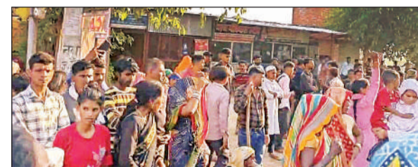
संडीला-मल्लावां मार्ग पर चक्का जाम करतेपरिजन।

अमृत विचार। क्षेत्र के एकगांव में हृदय विदारक घटना से पूरे गांव में सन्नाटा पसर गया घरमें बहन की विदाई की तैयारियां चल रही थी कि दुल्हन का भाई दहेज का सामान पिकअप डाले में लोड करा रहा था। चालक की लापरवाही से पिकअप ने युवक को टक्कर मार दी, जिससे दुल्हन का भाई गंभीर रूप से घायल हो गया। सीएचसी संडीला में डाक्टरों ने उसे मृत घोषित कर दिया। क्षेत्र के गांव निर्मलपुर निवासी