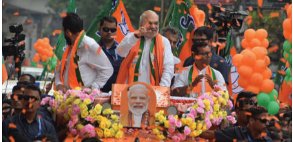
प. बंगाल के बेहला पश्चिम में रोड शो करते गृह मंत्री अमित शाह।

पश्चिम बंगाल की 294-सदस्यीय विधानसभा के लिए पहले चरण के