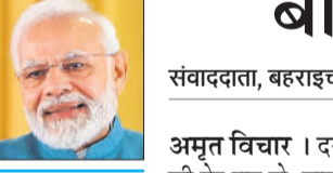
विस्तृत प्रदेश पेज पर

लखनऊ। प्रधानमंत्री मोदी मंगलवार 28 अप्रैल से यूपी के दो दिवसीय दौरे पर रहेंगे। 28 अप्रैल को पहले दिन अपने संसदीय निर्वाचन क्षेत्र वाराणसी में आयोजित होने वाले महिला सम्मेलन में हिस्सा लेंगे और 6350 करोड़ की विधिन विकास परियोजनाओं का शिलान्यास एवं लोकार्पण करने के बाद एक जनसभा को भी संबोधित करेंगे। मोदी 1050 करोड़ की लागत से पूरी हुई 48 से अधिक परियोजनाओं को राष्ट्र को समर्पित करेंगे। रेल कनेक्टिविटी को और बढ़ावा देने के लिये दो नई 'अमृत भारत एक्सप्रेस' ट्रेनों को भी हरी झंडी दिखाएंगे।