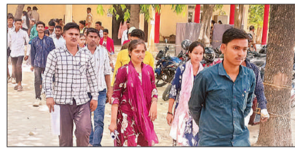
परीक्षा देकर बाहर निकलते अभ्यर्थी।

हरदोई, अमृत विचार। होमगार्ड भर्ती परीक्षा सोमवार को भी शुरू हुई। तीन दिवसीय इस परीक्षा के तीसरे दिन अभ्यर्थियों ने लिखित परीक्षा दी। सुबह और दोपहर की दोनों पालियां शांतिपूर्ण ढंग से संपन्न हुईं। परीक्षा केंद्रों के बाहर सुरक्षा के कड़े इंतजाम किए गए थे। जनपद में होमगार्ड के पदों पर एनरोलमेंट 2025 के लिए कुल 25,056 अभ्यर्थी पंजीकृत हैं। प्रत्येक पाली के लिए 4,176 अभ्यर्थियों को परीक्षा केंद्रों में आवंटित किया गया है। यह परीक्षा 25 अप्रैल से शुरू हुई थी। जिसके लिए 10 कॉलेजों को परीक्षा केंद्र बनाया गया था। होमगार्ड भर्ती परीक्षा