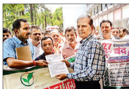
सिटी मजिस्ट्रेट को ज्ञापन देते कृषि व्यापारी।

जिससे उन पर मानसिक व आर्थिक दबाव बढ़ रहा है। ज्ञापन में व्यापारियों ने 7 सूत्रीय मांगें रखीं। जिनमें खाद के साथ अन्य उत्पादों की जबरन टैगिंग बंद हो। डीलर मॉनिंग बढ़ाकर 8 प्रतिशत हो। सीलबंद माल का सैंपल फेल होने पर कार्रवाई केवल कंपनी पर हो। डीलर को इसमें केवल गवाह बनाया जाए। व्यापारियों