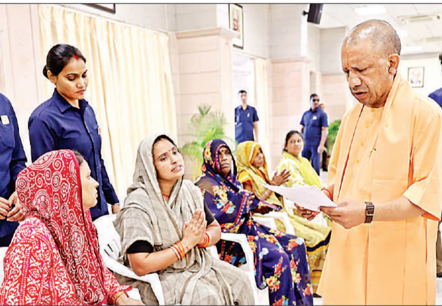
लखनऊ में आयोजित जनता दर्शन में महिला फरियादियों की समस्या सुनते मुख्यमंत्री योगी आदित्यनाथ।

अमृत विचार: मुख्यमंत्री योगी आदित्यनाथ ने विधानसभा चुनाव प्रचार के आखिरी दिन पश्चिम बंगाल रवाना होने से पहले सोमवार सुबह जनसेवा का संकल्प भी पूरा किया। 'जनता दर्शन' में प्रदेश भर से आए फरियादियों की पीड़ा सुनी। उन्होंने अधिकारियों को सख्त हिदायत दी कि हीलाहवाली नहीं चलेगी, समय सीमा के भीतर समाधान करना होगा।