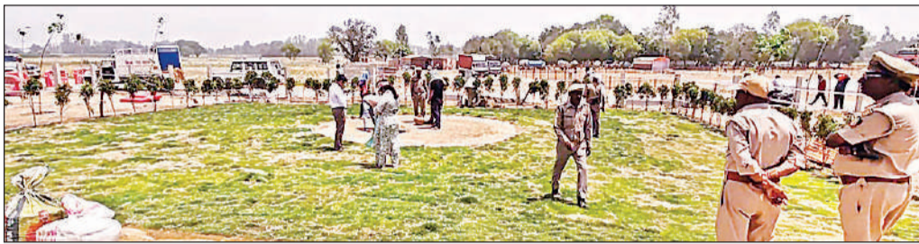
हेलीपैड व वाटिका को सुंदर बनाने में जुटे अधिकारी।