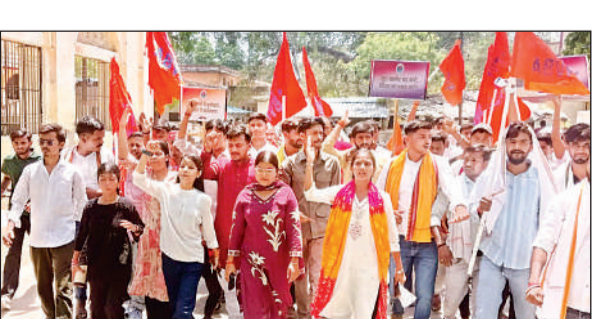
निजी स्कूलों की मनमानी के विरोध में प्रदर्शन करते एबीवीपी कार्यकर्ता।

प्रदर्शनकारियों ने कहा कि लगभग प्रत्येक निजी विद्यालय में एनसीआरटी की किताबें न चलाकर निजी प्रकाशकों की किताबें चलाई जाती हैं। इन किताबों को निश्चित दुकान से खरीदने के