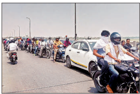
नवीन पुल पर जाम में फंसे वाहन सवार।

बीच सड़क पर कार खड़ी होने से जाम लगने लगा। कुछ ही देर में दोनों ओर वाहनों की कतारें लग गईं। जाम इतना बढ गया कि कानपुर से शुक्लागंज तक यातायात प्रभावित हो गया। तेज धूप में फंसे राहगीर व वाहन चालक गर्मी में बेहाल रहे। इधर चालक ने नई बैटरी मंगाकर कार ठीक कराई इसके बाद करीब 2 बजे कार हटाई जा सकी और यातायात बहाल हुआ। इसी दौरान