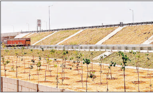
अमृत विचार एक्सप्रेस-वे के किनारे किया जा रहा पौधरोपण।