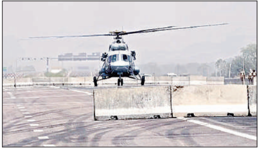
हेलीपैड पर रिहर्सल कर उड़ान भरता हेलीकाप्टर।

मल्लावां-मेहंदीघाट रोड से निकले गंगा एक्सप्रेस-वे पर बंदीपुर कलेनापुर के जनसभा के लिए पहले 65 हेक्टेयर भूमि को लिया गया था, लेकिन मुख्यमंत्री योगी आदित्य नाथ के निरीक्षण के बाद 144 हेक्टेयर जमीन पर व्यवस्था की जा रही है। सड़क के दोनों पाकिंग बनाई गई है। जेनवार तय किया गया। इसमें नौ सुपर जोन 19 जोन 61 सेक्टर, 109 सब सेक्टर बनाए गए हैं। पीएम मोदी के लिए गंगा एक्सप्रेस-वे पर बनाए गए दोनों हेलीपैड पर सोमवार को हेलीकाप्टर उतारे गए। सुरक्षा को लेकर पायलटों ने कई बार उड़ान भरी और एस्पोजी जवानों से बात कर लौट गए। हेलीपैड के पास बनी वाटिका को सुन्दर बनाने को लेकर अधिकारी जुटे हुए हैं। बनाए गए गड्डों में प्रधानमंत्री नरेन्द्र मोदी