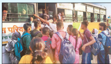
बस में बैठने के लिये जड़ोहद करते अभ्यर्थी।

उज्जाव: जिले में आयोजित होमगार्ड भर्ती परीक्षा संपन्न होने के बाद परीक्षार्थियों की भारी भीड़ के चलते यातायात व्यवस्था चरमरा गई। लखनऊ बाईपास पर बसों में बैठने के लिए अभ्यर्थियों में भारी जड़ोहद देखने को मिली। जैसे ही केंद्रों से अभ्यर्थी निकले लखनऊ बाईपास चौराहे पर युवाओं का हुजूम उमड़ पड़ा। लखनऊ, कानपुर व अन्य दिशाओं में जाने वाली रोडवेज बसों के आते ही उनमें सीट पाने के लिए आधाघण्टी मच गई। भीड़ इतनी अधिक थी कि बस रुकते ही वह पूरी तरह पैक हो जा रही थी। सरकारी बसों में जगह न मिलने और घंटों इंतजार करने के बाद परेशान अभ्यर्थियों ने निजी ड्रामाकार वाहनों का सहारा लिया। मजबूरी का फायदा उठाते हुए कई वाहन चालकों ने निर्धारित से दोगुना किराया वसूला, जिससे दूर-दराज से आए युवाओं को आर्थिक परेशानी का भी सामना करना पड़ा।