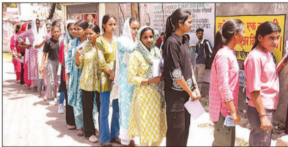
केंद्र में परीक्षा देने जाने को लाइन में लगी महिला अभ्यर्थी।

सदर तहसील क्षेत्र के रऊकरना स्थित जनता शिक्षा निकेतन उच्चतर माध्यमिक विद्यालय को परीक्षा के केंद्र बनाया गया था। यहां हरदोई, लखनऊ, लखीमपुर, रायबरेली व सीतापुर आदि जिलों से अभ्यर्थी पहुंचे थे। ग्रामीण क्षेत्र होने से यहां रुकने का कोई उचित प्रबंध नहीं था। दूर से आए छात्र रात में ही केंद्र