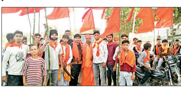
रैली निकालते राष्ट्रीय गौ-संरक्षण दल के लोग।

इसे सामाजिक जिम्मेदारी के रूप में अपनाने की अपील की। संगठन ने केंद्र सरकार से मांग की कि गौ माता को राष्ट्र माता, राष्ट्र देव व राष्ट्र धरोहर घोषित किया जाए। संपूर्ण भारत में गौ हत्या पर पूर्ण प्रतिबंध लगे। गौ सेवा के लिए एक सशक्त