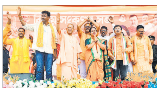
हुगली के धानेखाली क्षेत्र में जनता का अभिवादन स्वीकार करते मुख्यमंत्री योगी।

योगी ने बंगाल के हुगली, नदिया व उत्तर 24 परगना में आखिरी चरण के मतदान से पहले जनसभाओं और रोड शो को संबोधित करते हुए 'ममता' का कभी कला, साहित्य और औद्योगिक विकास के लिए पहचाने जाने वाले बंगाल को पिछले 15 वर्षों में टीएमसी शासन ने कमजोर कर दिया है। उन्होंने कहा कि 'योगी-योगी' के नारे लगे।