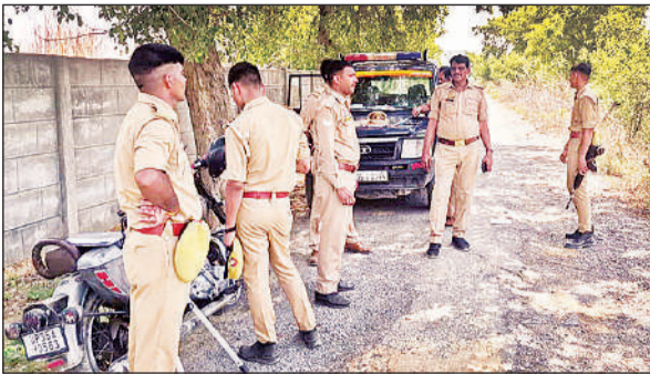
घटनास्थल पर जांच करती पुलिस।

के साथ मौके का निरीक्षण किया। आसपास के लोगों से पहचान कराने की कोशिश की लेकिन चेहरा बुरी तरह झुलसने से शिनाख्त नहीं हो सकी। इसके बाद पुलिस ने शव