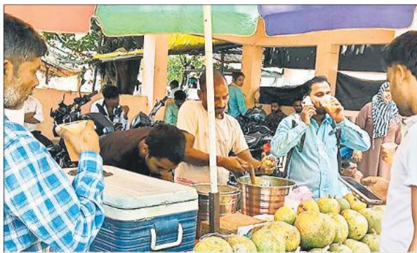
सोमवार को तपती गर्मी में टेले पर जूस से प्यास बुझाते राहगीर।