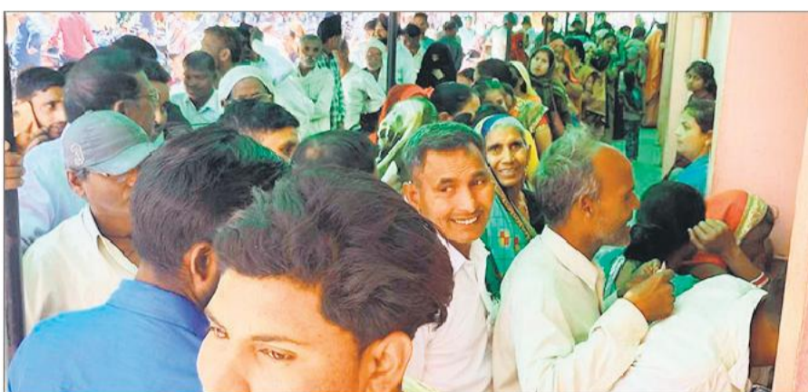
मेडिकल कॉलेज की ओपीडी के दौरान पार्वा काउंटर पर लगी कतार।

अप्रैल से ही गर्मी ने तेवर दिखाए शुरू कर दिए हैं। आलम यह है कि अप्रैल में ही जून जैसी तपिश देखने को मिल रही है। गर्म हवाएं लोगों को बीमार कर रही हैं। दिन पर दिन तापमान में लगातार बढ़ोतरी हो रही है। ऐसे में तेज धूप लोगों को परेशान कर रही है। सोमवार को अधिकतम तापमान 40.2 डिग्री सेल्सियस और न्यूनतम 26.1 डिग्री दर्ज किया गया। जिस वजह से गर्मी चरम पर थी। सुबह से ही धूप में तेजी देखने को मिली। बढ़ती गर्मी के चलते