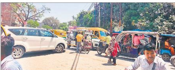
जाम में आड़े-तिरछे फंसे वाहन।