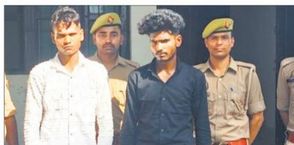
पुलिक गिरफ्त में आरोपी।