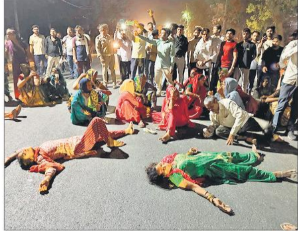
सड़क पर लेटकर प्रदर्शन करती महिलाएं।

ठाकुरद्वारा, अमृत विचार : नारी सम्मान और सुरक्षा के मुद्दे पर भाजपा कार्यकर्ताओं ने भगतपुर क्षेत्र के ग्राम चालपुर में जोरदार विरोध प्रदर्शन किया। 'नारी का अपमान नहीं सहेंगा हिंदुस्तान' के मुंडते नारों के बीच कार्यकर्ताओं ने कांग्रेस को कोतवाली में शिकायत की डम थोकें लगाईं। उन्होंने नैतुव भागीदारी देखने को मिली, जिसने पूरे आयोजन को और प्रभावशाली बना दिया। प्रदर्शनकारियों ने एक स्वर में महिला सम्मान की रक्षा का संकल्प दोहराया।