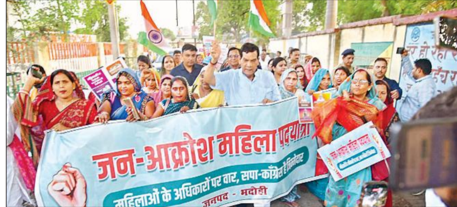
भदोही में महिला जन आक्रोश रैली का नेतृत्व करते नगर विकास एवं ऊर्जा मंत्री एके शर्मा।

इस दौरान नारी शक्ति वंदन अधिनियम को लेकर किए गए संवाद में नगर विकास मंत्री ने विश्वास जताया कि भविष्य में यह विधेयक अवश्य पारित होगा। उन्होंने कहा