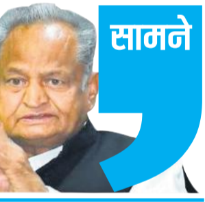
सामने पूर्व मुख्यमंत्री, राजस्थान

पायलट कांग्रेस में ही रहेंगे। सचिन पायलट सब समझ भी गए हैं और संभल भी गए हैं। उनकी दोनों टांगें कांग्रेस में ही हैं, कहीं नहीं जाएंगी। पार्टी एकजुट है, पहले उन्हें बहला-फुसला मानेसाले गए थे, लेकिन अब वे गलती नहीं करेंगे।