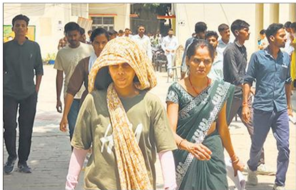
परीक्षा समाप्त होने के बाद जीजीआईसी केंद्र से निकलते अभ्यर्थी।

गतिविधि पर निगरानी रखी गई। सुबह से ही परीक्षा केंद्रों के बाहर अभ्यर्थियों की भीड़ जुटनी शुरू