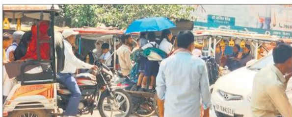
जाम में फंसे रिक्शे पर सवार होकर स्कूल से घर जा रहे छोटे-छोटे बच्चे।

नतीजतन शहर में जाम पहले की तरह ही फिर आम हो गई है। सोमवार दोपहर की चिलचिलाती धूप और तेज तापमान के बीच शहर के बीचों बीच कृष्णा टॉकीज रेलवे क्रॉसिंग के पास भीषण जाम लग गया। दोनों तरफ से वाहनों की लंबी कतारें लग गईं। जाम में फंसे लोग बेहाल नजर आए। सबसे ज्यादा परेशानी स्कूली बच्चों को