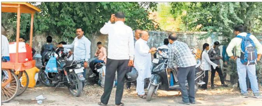
गौहनिया चौराहा पर पेड़ के नीचे बैठे होमगार्ड भर्ती की परीक्षा देने आए अभ्यर्थी।