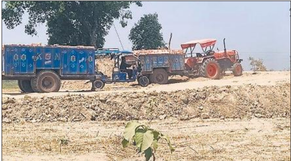
पीलीभीत माधोटांडा रोड पर कल्यानपुर गांव के पास अस्थायी रास्ते के नाम पर लगाया मिट्टी का ढेर में खड़ी ट्रैक्टर ट्रॉलिया।

है। करीब तीन साल पहले मैदानी और पहाड़ी इलाकों में हुई मूसलाधार बारिश के बाद कई जगह बाढ़ के हालात बन गए थे। बाढ़ के पानी के तेज बहाव से सड़कें कट गईं और पुलियां भी बह गईं थीं। जिसके बाद से आवागमन मुश्किल बना हुआ है। तीन साल होने को हैं, लेकिन अभी तक आवागमन की व्यवस्था दुरुस्त नहीं हो सकी है। लंबे समय तक पहले बजट का इंतजार चलता रहा। इसके बाद बजट आने के बाद काम भी शुरू करा दिए गए हैं। मगर अभी तक आवागमन की समस्या दूर