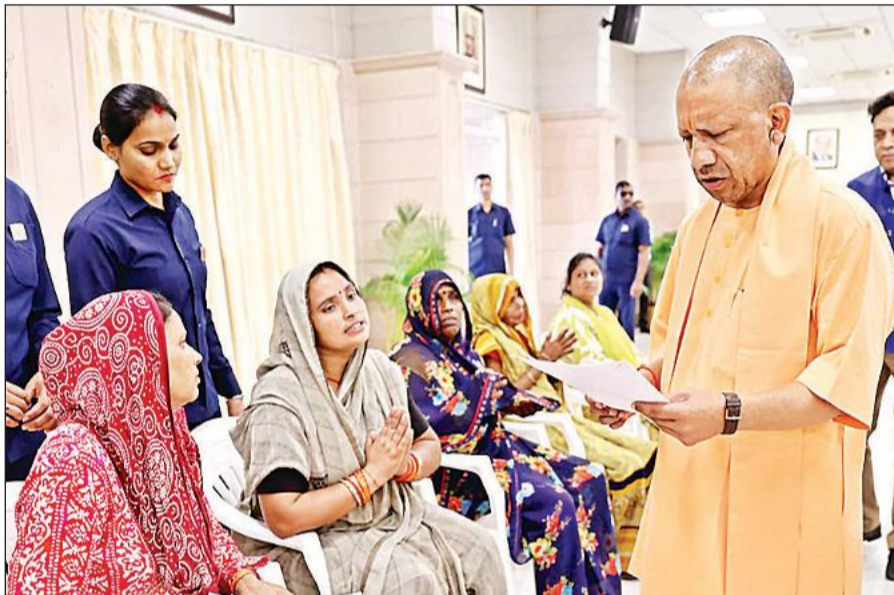
लखनऊ में आयोजित जनता दर्शन में महिला फरियादियों की समस्या सुनते मुख्यमंत्री योगी आदित्यनाथ।

मुख्यमंत्री ने 'जनता दर्शन' में आए सभी फरियादियों से मुलाकात की। एक-एक कर उनको समस्याएं सुनीं, प्रार्थना पत्र लिया, फिर अधिकारियों को संवेदनशील होकर जनता की समस्याओं के निराकरण का निर्देश दिया। राजस्व व पुलिस से जुड़ी शिकायतों पर मुख्यमंत्री ने निर्देश दिया कि हीलाहवाली नहीं चलेगी, समयसीमा के भीतर समस्याओं का समाधान करके पीड़ित को सूचित करना होगा। कुछ फरियादियों से मुख्यमंत्री ने पूछा