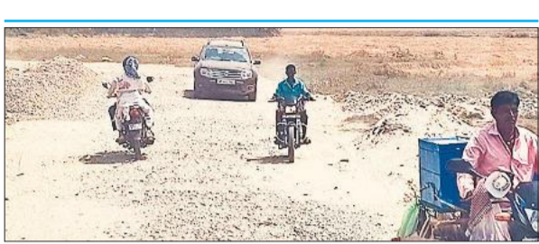
जमुनिया के पास बनाए गए अस्थायी रास्ते में पत्थरों और धूल के बीच गुजरते राहगीर।

इन जर्जर रास्तों पर सफर दिन के वक्त ही मुश्किल भरा है। मगर रात के वक्त और खतरा बढ़ जाता है। एक तरफ गहरे गड्ढे खोदे गए हैं। उनके किनारे निर्माण सामग्री के ढेर लगे हुए हैं। इसके अलावा रोशनी के भी पूरुखा इंतजाम नहीं है। निर्माण कार्य का पता चल सके, इसके लिए भी कोई बैरियर या रेडियम रिपलेक्टर आदि का इंतजाम नहीं है। जिससे मार्ग के बारे में चालक एहसास कर सके। स्थानीय लोगों का कहना है कि स्कूली बच्चों और मरीजों को भी आवाजाही में अधिक परेशान होना पड़ता है।