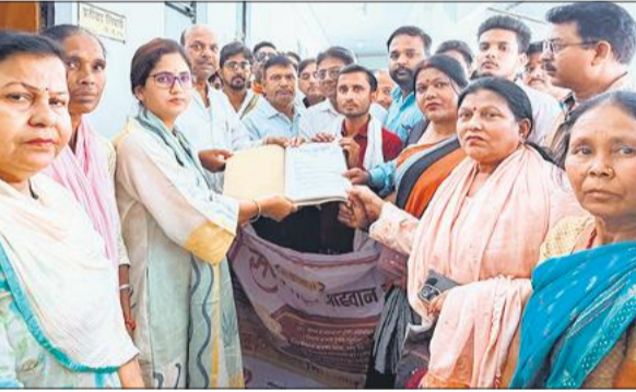
गोला में एसडीएम को ज्ञापन देते पालिकाध्यक्ष और बजरंग दल के पदाधिकारी।

अमृत विचार: गौ सम्मान आवाहन अभियान के तहत संगठन और भारतीय बजरंग दल के पदाधिकारियों ने एसडीएम को ज्ञापन सौंपकर गौ माता को राष्ट्र माता एवं राष्ट्रीय पशु घोषित किए जाने की मांग की।