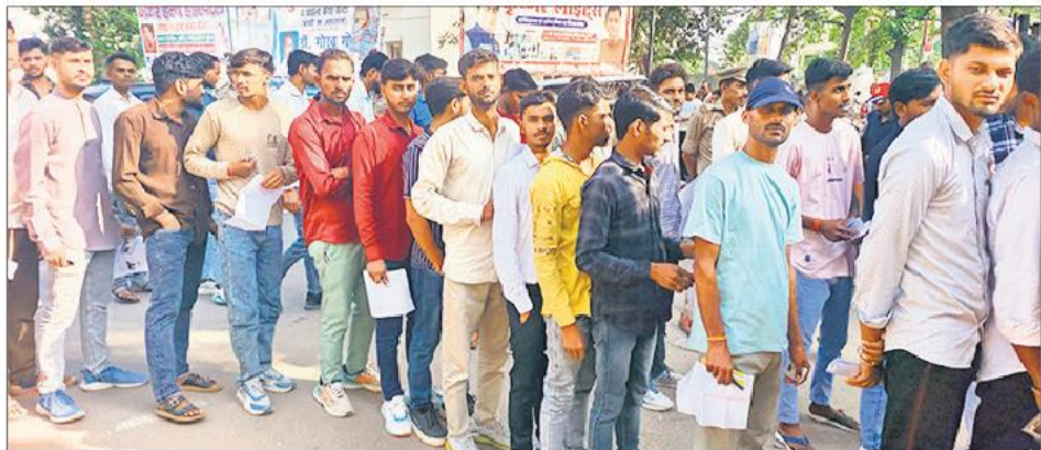
राजकीय इंटर कॉलेज केंद्र पर प्रवेश के लिए लगी अभ्यर्थियों की लाइन।

परीक्षा केंद्रों पर सुरक्षा के व्यापक इंतजाम किए गए थे। अभ्यर्थियों को मेटल डिटेक्टर, फोटो स्कैनर व बायोमीट्रिक सत्यापन के बाद ही प्रवेश दिया गया। परीक्षा के दौरान सीसीटीवी कैमरों के माध्यम से हर