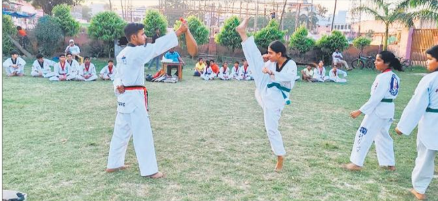
क्लर बेल्ट टेस्ट देते ताइक्वांडो खिलाड़ी।