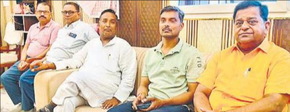
गोला में पत्रकार वार्ता करते प्रबंध समिति के पदाधिकारी।