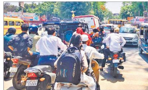
गौहनिया चौराहा पर लगा वाहनों का लंबा जाम।