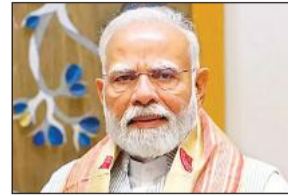
और शिलान्यास करेंगे। कार्यक्रम में योगी आदित्यनाथ समेत कई वरिष्ठ नेता और मंत्री मौजूद रहेंगे।