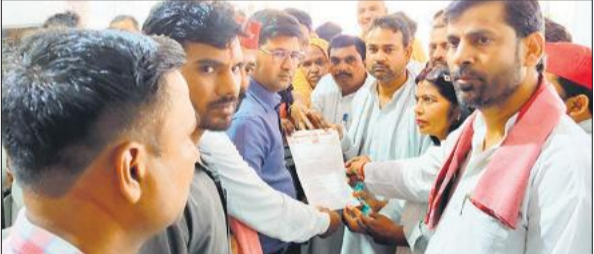
तहसील पहुंचकर ज्ञापन देते सपा कार्यकर्ता।

अमृत विचार : करण्डा (गाजीपुर) के ग्राम कटरिया में युवती की दुष्कर्म के बाद हत्या किए जाने की घटना के बाद जानकारी लेने गए सपा कार्यकर्ताओं पर किए गए पथराव की घटना का विरोध किया गया। सोमवार को सपा कार्यकर्ताओं ने नगर में जुलूस निकालकर तहसील पहुंचकर नारेबाजी की और ज्ञापन सौंपा। समाजवादी पार्टी के कार्यकर्ता नगर कार्यालय पर एकत्र हुए और फिर जुलूस की शक्ति में नारेबाजी करते हुए तहसील पहुंचे। प्रदर्शन कर एसडीएम की गैर मौजूदगी में राज्यपाल को संबोधित ज्ञापन तहसीलदार को सौंपा। जिसमें बताया कि जिसमें