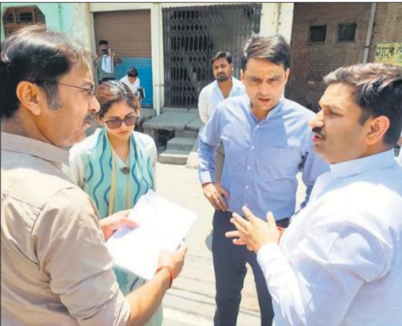
नक्शा देखते विधायक व सीडीओ।