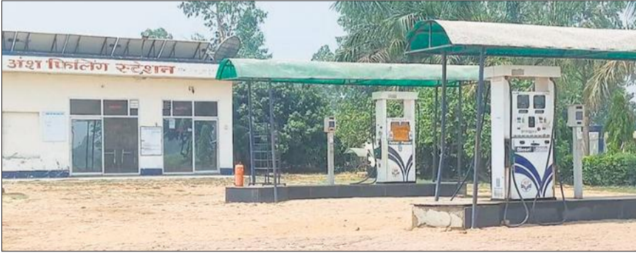
सूना पड़ा अंश फिलिंग स्टेशन।

अमृत विचार: गोला तहसील क्षेत्र के गांव सिक्कड़ाबाद, जडौरा, तेन्दुआ, बघमरा, सेहरूआ सहित में परिजनों ने एम्बुलेंस की मदद से लगी पंपों पर पेट्रोल व डीजल की सप्लाई न होने से किसान चिंतित हैं। किसान नेता ने कहा है कि वर्तमान समय में गन्ने की सिंचाई हेतु किसानों को डीजल की अत्यंत आवश्यकता है। जिला पूर्ति अधिकारी डीजल और पेट्रोल की कोई कमी नहीं बता रहे हैं, लेकिन किसान पेट्रोल पंपों से खाली हाथ लौट रहे हैं। क्षेत्र के कुछ पेट्रोल पंप मालिक पंप पर डीजल और पेट्रोल उपलब्ध