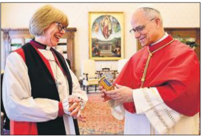
कैटरबरी की आर्चबिशप सारा मुलाली के साथ पोप लियो।

पोप धर्मो 14वें ने सोमवार को वेटिकन में कैटरबरी की आर्चबिशप सारा मुलाली के साथ प्रार्थना की और संकल्प जताया कि मतभेद चाहे कितने ही जटिल क्यों न हों, उन्हें दूर करने के प्रयास जारी रहेंगे। यह मुलाकात ऐतिहासिक मोताजा रही है, क्योंकि सारा मुलाली चर्च ऑफ इंग्लैंड की पहली महिला प्रमुख और वैश्विक एंग्लिकन कम्यूनिन की आध्यात्मिक नेता हैं। ईसाई धर्म के इन दो प्रमुख धार्मिक नेताओं के बीच यह मुलाकात कुछ वर्ष पहले तक कल्पना से परे मानी