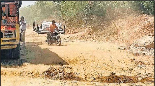
माधोटांडा खटीमा रोड पर अस्थायी रोडपर एक तरफ फेंसा ट्रक, बकाया हिस्से से गुजरता बाइक सवार।

अमृत विचार : तीन साल पहले आई बाढ़ में कटी सड़क और पुलियों के बाद माधोटांडा रोड पर खड़ी हुई आवागमन की समस्या का समाधान नहीं हो सका है। लंबे समय तक बजट का इंतजार रहा और अब काम शुरू होने के बाद बरती जा रही लापरवाही परेशानी का सबब बन चुकी है। मुख्य मार्ग पर निर्माण कार्य के चलते आवागमन को बनाए गए अस्थायी रास्तों को बनाने में महज औपचारिकता दिखाई गई है। कहीं मिट्टी के ढेर लगा दिए हैं तो कहीं पत्थर बिछा दिए गए। आलम ये है कि एकाध जगह तो खेतों से होकर वाहनों को निकालना पड़ रहा है और वाहन फंसकर रह जाते हैं। पीलीभीत शहर से माधोटांडा होते हुए पीटीआर (पीलीभीत टाइगर रिजर्व) के मुस्तफाबाद के बुकिंग स्टेशन तक की दूरी करीब 40 किमी के आसपास है। वैसे तो इस मार्ग पर सब व्यवस्थाएं दुरुस्त हो तो दूरी तय करने में 50 मिनट या फिर अधिक से अधिक एक घंटे का समय लगता