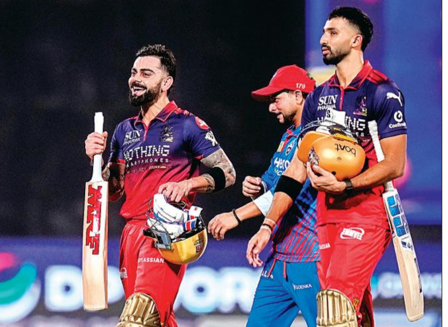
जीत की खुशी मनाते रॉयल चैलेंजर्स बंगलुरु के विराट कोहली व देवदत्त पडविकल।

भुवनेश्वर कुमार (तीन ओवर में पांच रन पर तीन विकेट) और जोश हेजलवुड (3.3 ओवर में 12 रन पर चार विकेट) की कमाल की गेंदबाजी के दम पर रॉयल चैलेंजर्स बंगलुरु (आरसीबी) ने इंडियन प्रीमियर लीग (आईपीएल) टी20 मैच में सोमवार को यहां दिल्ली कैपिटल्स को 81 गेंद शेष रहते नौ विकेट से करारी शिकस्त दी।