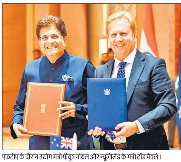
एफटीए के दौरान उद्योग मंत्री पीयूष गोयल और न्यूजीलैंड के मंत्री टॉड मैक्ले।