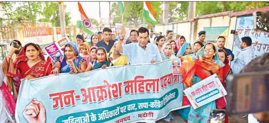
भदोही में महिला जन आक्रोश रैली का नेतृत्व करते नगर विकास एवं ऊर्जा मंत्री एके शर्मा।

अमृत विचार: नगर विकास एवं ऊर्जा मंत्री एके शर्मा ने भदोही में महिला जन आक्रोश मार्च में शामिल होकर महिलाओं के अधिकारों के समर्थन में अपनी भागीदारी दर्ज कराई। इस दौरान उन्होंने आरोप लगाया कि महिला आरक्षण विधेयक को पारित कराने में विपक्ष का रवैया सहयोगात्मक नहीं रहा, जिससे यह अब तक संभव नहीं हो सका। इस दौरान नारी शक्ति वंदन अधिनियम को लेकर किए गए संवाद में नगर विकास मंत्री ने विश्वास जताया कि भविष्य में यह विधेयक अवश्य पारित होगा। उन्होंने कहा