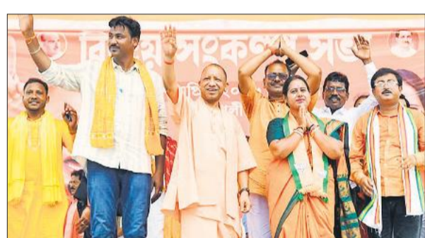
हुगली के धानेखाली क्षेत्र में जनता का अभिवादन स्वीकार करते मुख्यमंत्री योगी।

योगी ने बंगाल के हुगली, नादिया व उत्तर 24 परगना में आखिरी चरण के मतदान से पहले जनसभाओं और रोड शो को संबोधित करते हुए में कहा कि कभी कला, साहित्य और औद्योगिक विकास के लिए पहचाने जाने वाले बंगाल को पिछले 15 वर्षों में टीएमसी शासन ने कमजोर कर दिया है। उन्होंने कहा कि कानून-व्यवस्था का माहौल की स्थिति खराब हुई है और जनता