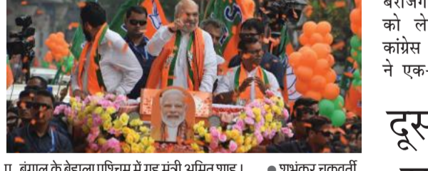
प. बंगाल के बेहाला पश्चिम में गृह मंत्री अमित शाह।