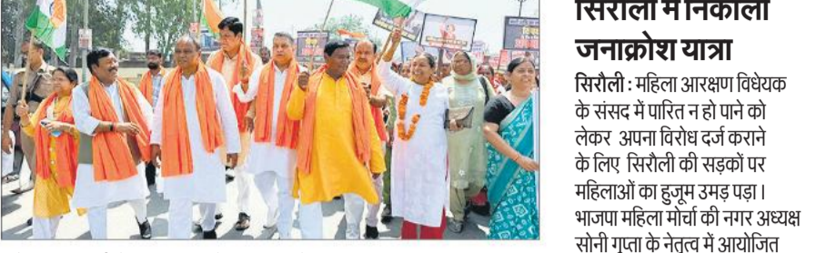
फतेहगंज पश्चिमी में महिला जनाक्रोश पद यात्रा में शामिल सांसद विधायक।