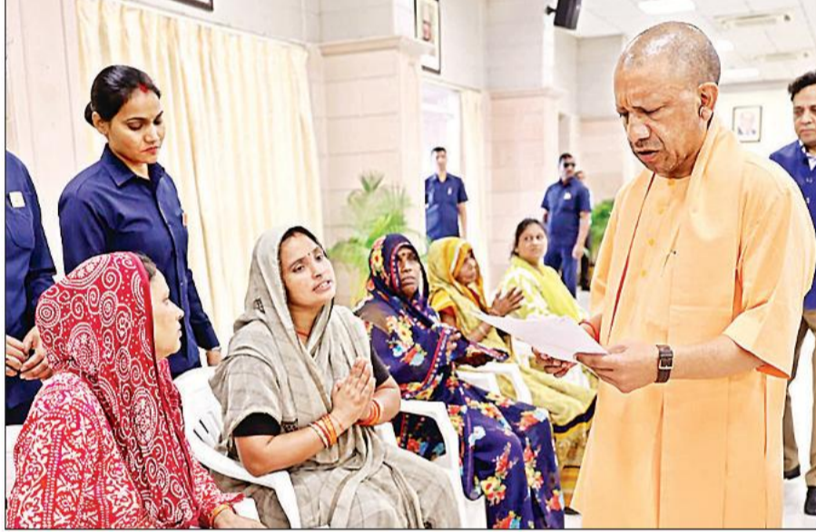
लखनऊ में आयोजित जनता दर्शन में महिला फरियादियों की समस्या सुनते मुख्यमंत्री योगी आदित्यनाथ।

मुख्यमंत्री योगी आदित्यनाथ ने विधानसभा चुनाव प्रचार के आखिरी दिन पश्चिम बंगाल रवाना होने से पहले सोमवार सुबह जनसेवा का संकल्प भी पूरा किया। 'जनता दर्शन' में प्रदेश भर से आए फरियादियों की पीड़ा सुनी। उन्होंने अधिकारियों को सख्त हिदायत दी कि हीलाहवाली नहीं चलेगी, समय सीमा के भीतर समाधान करना होगा। मुख्यमंत्री ने 'जनता दर्शन' में आए सभी फरियादियों से मुलाकात की। एक-एक कर उनका समस्याएं सुनीं, प्रार्थना पत्र लिया, फिर अधिकारियों को संवेदनशील होकर जनता की समस्याओं के निराकरण का निर्देश दिया। राजस्व व पुलिस से जुड़ी शिकायतों पर मुख्यमंत्री ने निर्देश दिया कि हीलाहवाली नहीं चलेगी, समयसीमा के भीतर समाधान करें। पीड़ित को सूचित करना होगा। कुछ फरियादियों से मुख्यमंत्री ने पूछा