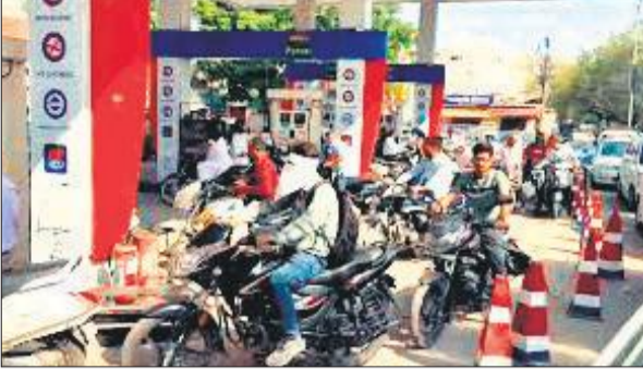
विजयवाड़ा के एक पेट्रोल पंप पर पेट्रोल लेने के लिए लगी कतार।

सरकार की ओर से इस बीच पेट्रोल और डीजल की कमी न होने का आश्वासन दिया गया लेकिन इसके बाद भी लोगों की घबराहट कम नहीं हुई। कई पेट्रोल पंपों पर कतारों में खड़े वाहन चालकों की संख्या हजारों में थी। राजामुंदरी के एक पेट्रोल पंप पर तमाम दोपहिया वाहन, कार, ट्रक और अन्य वाहन लंबी कतार में लगे दिखे। लोग पेट्रोल और डीजल खरीदने के लिए प्लास्टिक के डिब्बे भी लिए हुए नजर आए। विजयवाड़ा के आंटो नगर स्थित एक पेट्रोल पंप पर भी ऐसी ही स्थिति देखने को मिली, जहां कई वाहन कतार में लगे हुए थे।