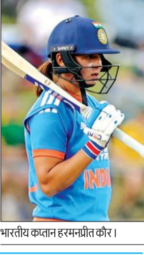
भारतीय कप्तान हरमनप्रीत कौर।

दक्षिण अफ्रीका के 156 रन के लक्ष्य का पीछा करते हुए भारतीय टीम मलाबा (15 रन पर दो विकेट) और डि क्लर्क (26 रन पर दो विकेट) की प्रभावी गेंदबाजी के सामने आठ विकेट पर 132 रन ही बना सकी। एलिज मारी मार्क्स, क्लो ट्रायोन और अयाबोंगा खाका ने भी एक-एक विकेट चटकवाया। भारत की ओर से भारत फुलमन्री ने सर्वाधिक 40 रन बनाए। उनके अलावा त्रय्या घोष (नाबाद 25) और कप्तान हरमनप्रीत कौर (22) ही 20 रन के आंकड़े को पार कर पाईं। दक्षिण अफ्रीका की धारदार गेंदबाजी