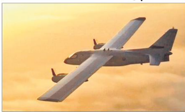
सौर ऊर्जा से चलने वाला मानव रहित हवाई वाहन तेजस्वान।

अमृत विचार, आईआईटी, कानपुर द्वारा इनक्यूबेटेड डीप-टेक स्टार्टअप मराल एयरोस्पेस ने अपने सौर ऊर्जा से चलने वाले मानव रहित हवाई वाहन (यूएवी) तेजस्वान का सफल परीक्षण पूरा कर लिया है। कंपनी के इस कदम को ड्रोन तकनीक में बड़ा कदम माना जा रहा है। स्वच्छ ऊर्जा विमानन और निरंतर निगरानी के लिए डिजाइन किया गया तेजस्वान यूएवी पारंपरिक ईंधन पर निर्भरता के बिना लंबे समय तक हवा में उड़ सकता है। इसका इस्तेमाल रक्षा, सीमा निगरानी, इंटरलिजेंस, सर्विलांस, मैपिंग और आपदा प्रबंधन