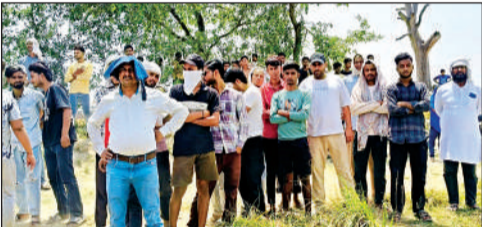
खंडहरनुमा हड्डी मिल में शव मिलने पर एकत्र लोग।