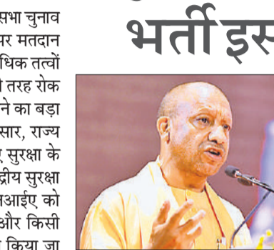
राज्य ब्यूरो, लखनऊ

अमृत विचार: मुख्यमंत्री योगी आदित्यनाथ ने मंगलवार को युवाओं के लिए बड़ी घोषणा करते हुए कहा कि प्रदेश में इस वर्ष पुलिस बल में एक लाख नई भर्तियों की जाएंगी। उन्होंने कहा कि योग्य और सक्षम युवा बड़ी संख्या में पुलिस सेवा से जुड़ना चाहते हैं और भर्ती एवं प्रशिक्षण बोर्ड उन्हें निष्पक्ष अवसर उपलब्ध करा रहा है। मुख्यमंत्री इंदिरा गांधी प्रतिष्ठान में आयोजित कार्यक्रम में उत्तर प्रदेश पुलिस दूरसंचार विभाग के 936 प्रधान परिचालक व प्रधान परिचालक (यांत्रिक) को नियुक्ति पत्र वितरित कर रहे थे। इस अवसर पर उन्होंने कहा कि पिछले तीन दिन में यूपी होमगार्ड में भी 41 हजार भर्ती के लिए परीक्षा हुई। सिविल पुलिस, एसआई, होमगार्ड आदि की भर्ती प्रक्रिया तेजी से बढ़ी है। प्रदेश में भर्ती प्रक्रिया पूरी तरह पारदर्शी और ईमानदारी के साथ संपन्न हुई है। अब नवचयनित अभ्यर्थियों का दायित्व है कि वे भी उसी निष्ठा और साफ नीयत से अपनी सेवाएं दें। उन्होंने बताया कि हाल ही में प्रदेश के 112 केंद्रों पर 60 हजार आरक्षियों की दीक्षांत परेड आयोजित हुई, जिसके बाद ये सभी जवान फील्ड में तैनात हो चुके हैं। पिछले नौ वर्षों में उत्तर प्रदेश पुलिस में 2.20 लाख