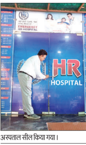
अस्पताल सील किया गया।

हॉस्पिटल के बोर्ड पर आईसीयू और एनआईसीयू सुविधा अंकित मिला जिसे अवैध माना गया।