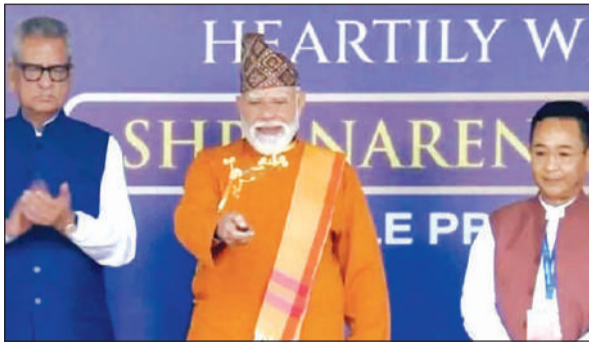
गंगटोक में एक समारोह के दौरान वर्चुअल माध्यम से उद्घाटन करते पीएम मोदी।

यह खेल के बुनियादी ढांचे को मजबूत करने और पूर्वोत्तर क्षेत्र को अपार खेल क्षमता को सामने लाने की दिशा में एक महत्वपूर्ण कदम है।' उद्घाटन समारोह में अंतरराष्ट्रीय क्रिकेट परिषद (आईसीसी) के चेयरमैन जय शाह और बीसीसीआई के पदाधिकारी मौजूद थे जबकि पूर्वोत्तर के अन्य पांच राज्यों के प्रशासक वीडियो कॉन्फ्रेंस के जरिए इस कार्यक्रम से जुड़े। बीसीसीआई ने कहा, 'इस परियोजना की परिकल्पना बीसीसीआई द्वारा की