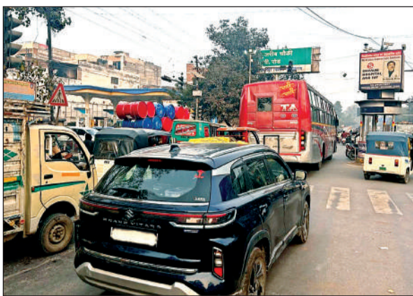
फजलगंज चौराहे के पास से बरबादों पुल। अमृत विचार

मरियमपुर से बर्बादों बाईपास तक एलीवेटेड पुल के निर्माण से शहर के दक्षिण व उत्तर क्षेत्र के बीच रोज आवागमन करने वाले करीब आठ लाख लोगों को राहत मिलनी है। अभी वाहन सवारों को मरियमपुर, फजलगंज, चावला मार्केट, नंद लाल चौराहा, दीप तिराहा, सचान गेस्ट हाउस चौराहा पर लगने वाले