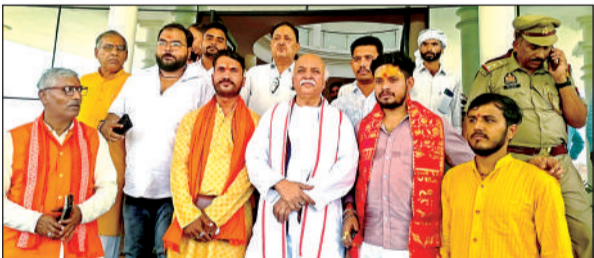
रसूलाबाद पहुंचे अंतर्राष्ट्रीय हिंदू परिषद के राष्ट्रीय अध्यक्ष प्रवीण तोगड़िया।

यह बात मंगलवार को यहां आए अंतर्राष्ट्रीय हिंदू परिषद के राष्ट्रीय अध्यक्ष प्रवीण तोगड़िया ने कही। उन्होंने राजकीय अतिथि गृह में पत्रकारों से बातचीत में कहा कि अंतर्राष्ट्रीय हिंदू परिषद, राष्ट्रीय बजरंग दल, राष्ट्रीय महिला दल एवं ओजस्विनी दल मिलकर मई व जून में युवक-युवतियों को सुरक्षा की ट्रेनिंग देंगे। स्कूल-कॉलेजों में आत्म रक्षा के लिए जागरूक किया जाएगा। यह अभियान पूरे