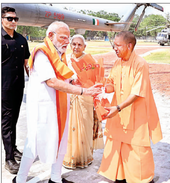
काशी में बीएलडब्ल्यू हेलीपैड पर प्रधानमंत्री नरेंद्र मोदी को पुष्पगुच्छ देकर स्वागत करते मुख्यमंत्री योगी आदित्यनाथ, साथ में मौजूद राज्यपाल आनंदी बेन पटेल।

मुख्यमंत्री मंगलवार को पीएम मोदी की उपस्थिति में बनारस लोकोमोटिव वर्क्स ग्राउंड में आयोजित 'नारी वंदन सम्मेलन' को संबोधित कर रहे थे। उन्होंने कहा कि प्रधानमंत्री के विजन का ही परिणाम है कि आज हम सभी नए भारत का दर्शन कर रहे हैं। उन्होंने कहा कि प्रधानमंत्री ने हमेशा इस बात पर जोर दिया है कि देश में चार ही जातियां हैं- नारी, गरीब, युवा और अन्नदाता किसान। इन चारों में हमारा पूरा समाज समाहित होता है। यह एक विराट विजन है, जिसके अनुरूप ये चारों वर्ग समग्र भारत का प्रतिनिधित्व करते हैं। इसीलिए हमने उन्हें भारत की राजनीति का केंद्र बनाकर प्रत्येक योजना का लाभ इन वर्गों तक पहुंचाया है। पीएम मोदी ने इन वर्गों के आर्थिक स्वावलंबन,