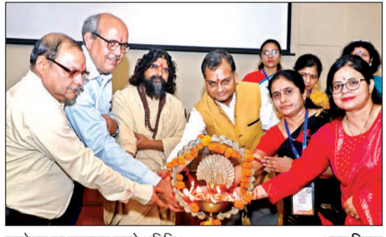
सम्मेलन का उद्घाटन करते अतिथि।

। छत्रपति शाहू जी महाराज विश्वविद्यालय (सीएसजेएमयू) के स्कूल ऑफ बेसिक साइंसेज द्वारा डीआरडीओ के सहयोग से एक सम्मेलन आयोजित किया गया। इस दौरान 'एडवांस्ड रिसर्च एंड एआई-इनेबल्ड इनोवेशंस इन साइंस एंड टेक्नोलॉजी फॉर प्रेजेंट चैलेंजेस एंड फ्यूचर ऑपच्युनिटीज' विषय पर चर्चा की गई। विशेषज्ञों ने कहा कि एआई की सहायता से होने वाले शोध भविष्य में सभी को चौंकाएंगे। इसके अलावा इनसे मिलने वाली सुविधा और चुनौतियां का भी सभी को सामना करना होगा। यह अंतरराष्ट्रीय सम्मेलन हाइब्रिड मोड में आयोजित हुआ।