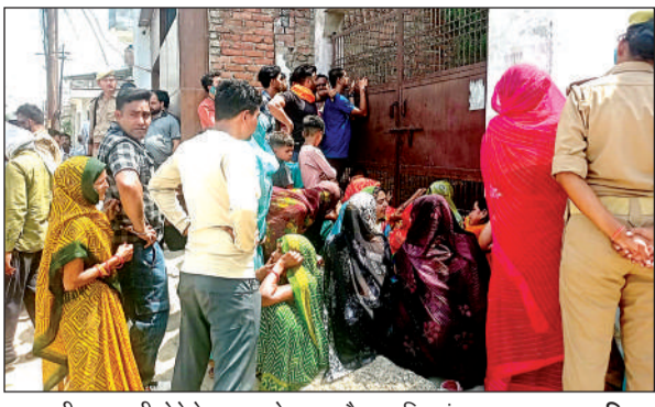
घटना की जानकारी होने के बाद घर के बाहर मौजूद महिलाएं। अमृत विचार

पत्नी पर हत्या का आरोप, हिरासत में लिया गया