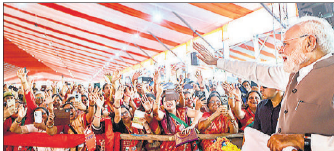
वाराणसी में महिला सम्मेलन में उमड़ा जनसैलाब, प्रधानमंत्री ने किया जनता का अभिवादन।

अमृत विचार: प्रधानमंत्री नरेंद्र मोदी ने मंगलवार को विपक्ष पर निशाना साधते हुए कहा कि कुछ परिवारवादी दल नारी शक्ति से भयभीत हैं और नहीं चाहते कि महिलाएं विधानसभा और संसद तक पहुंचें। उन्होंने कहा कि विपक्ष को डर है कि यदि महिलाएं बड़ी संख्या में राजनीति में आईं, तो उनकी पारंपरिक राजनीति समाप्त हो जाएगी। पीएम मोदी मंगलवार दोपहर दो दिवसीय दौरे पर काशी आने के बाद शाम को बरेका में आधी आबादी से खचाखच भरे जन आक्रोश महिला सम्मेलन को संबोधित कर रहे थे। यहां महिलाओं के बीच से होकर पीएम मंच पर पहुंचे। उन्होंने