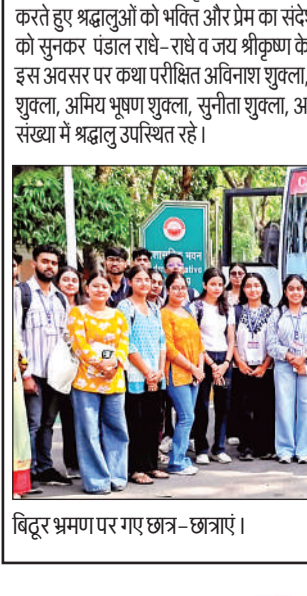
बिदूर भ्रमण पर गए छात्र-छात्राएं।