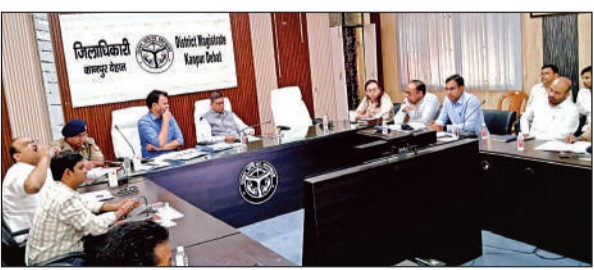
बैठक में डीएम ने अफसरों के साथ विचार-विमर्श किया। अमृत विचार

अमृत विचार: कलेक्ट्रेट सभागार में मंगलवार को कपिल सिंह की अध्यक्षता में बाढ़ एवं जलप्लावन प्रबंधन योजना के अनुश्रवण एवं प्रभावी क्रियान्वयन के संबंध में स्टियरिंग कमेटी की बैठक हुई। इसमें जनपद के संवेदनशील एवं बाढ़ प्रभावित क्षेत्रों की समीक्षा करते हुए सभी संबंधित विभागों को समय रहते आवश्यक तैयारियां सुनिश्चित करने के निर्देश दिए गए। जिलाधिकारी ने निर्देशित किया कि बाढ़ की संभावित स्थिति को दृष्टिगत रखते हुए राहत एवं बचाव कार्यों के लिए सभी आवश्यक संसाधन पूर्व से ही उपलब्ध एवं