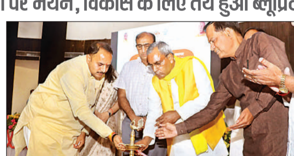
दीप जलाकर कार्यशाला की शुरुआत करते पंचायती राज मंत्री ओम प्रकाश राजभर।

अमृत विचार: पंचायती राज मंत्री ओम प्रकाश राजभर ने कहा कि जनभागीदारी और पारदर्शिता के जरिए गांवों के विकास को नई गति दी जा सकती है। उन्होंने कहा कि क्षेत्र पंचायत प्रमुख पंचायती व्यवस्था की मजबूत कड़ी हैं और उन्हें नेतृत्वकारी भूमिका निभानी होगी। साथ ही, उन्होंने लंबित कार्यों के शीघ्र निस्तारण और निधियों के बेहतर उपयोग पर जोर दिया। पंचायत राज मंत्री, मंगलवार को पंचायती राज विभाग की राज्य स्तरीय एक दिवसीय कार्यशाला में संबोधित कर रहे थे। कार्यशाला में क्षेत्र पंचायत प्रमुखों के साथ वर्ष