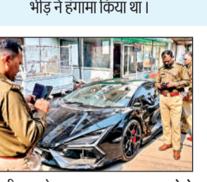
इसी कार से हुआ था हादसा। फाइल फोटो