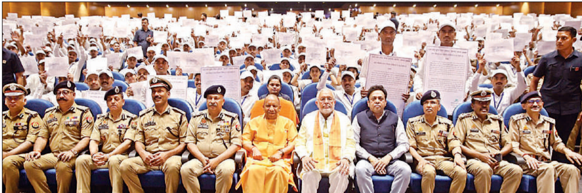
चयनित अभ्यर्थियों को नियुक्ति पत्र देने के बाद ग्रुप फोटो खिंचवाते मुख्यमंत्री योगी आदित्यनाथ, साथ में वित्त मंत्री सुरेश खन्ना व पुलिस अधिकारी।