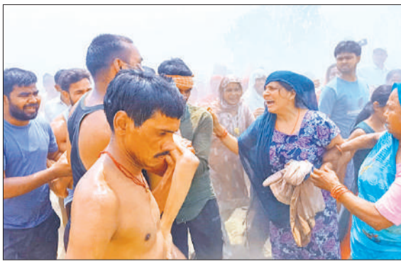
शिवम की मौत पर विलाप करते परिजन।