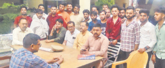
थाने में मौजूद हिंदूवादी संगठनों के पदाधिकारी।