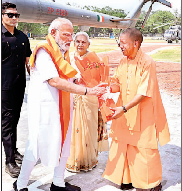
काशी में बीएलडब्ल्यू हेलीपैड पर प्रधानमंत्री नरेंद्र मोदी को पुष्पगुच्छ देकर स्वागत करते मुख्यमंत्री योगी आदित्यनाथ, साथ में मौजूद राज्यपाल आनंदी बेन पटेल।

मुख्यमंत्री मंगलवार को पीएम मोदी की उपस्थिति में बनारस लोकोमोटिव वर्क्स ग्राउंड में आयोजित 'नारी वंदन सम्मेलन' को संबोधित कर रहे थे। उन्होंने कहा कि प्रधानमंत्री के विजन का ही परिणाम है कि आज हम सभी नए भारत का दर्शन कर रहे हैं। उन्होंने कहा कि प्रधानमंत्री ने हमेशा इस बात पर जोर दिया है कि देश में चार ही जातियां हैं- नारी, गरीब, युवा और अन्नदाता किसान। इन चारों में हमारा पूरा समाज समाहित होता है। यह एक विराट विजन है, जिसके अनुरूप ये चारों वर्ग समग्र भारत का दर्शन कर रहे हैं। उन्होंने कहा कि राजनीति का केंद्र बनाकर प्रत्येक योजना का लाभ इन वर्गों तक पहुंचाया है। पीएम मोदी ने इन वर्गों के आर्थिक स्वावलंबन,