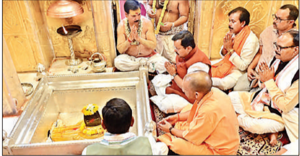
काशी विश्वनाथ धाम में पूजन करते मुख्यमंत्री योगी, भाजपा अध्यक्ष नितिन नवीन व अन्य।

सम्मान व सुरक्षा को सुनिश्चित करने के लिए दूरदर्शी सोच के तहत 'नए भारत' और 'विकसित भारत' इस अवसर पर राज्यपाल