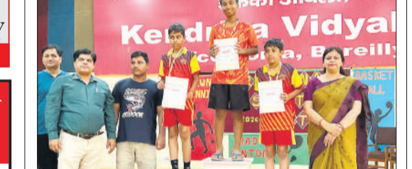
विजयी प्रतिभागियों को सम्मानित किया गया।