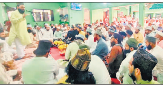
उर्स में मौजूद अकीदतमंद।