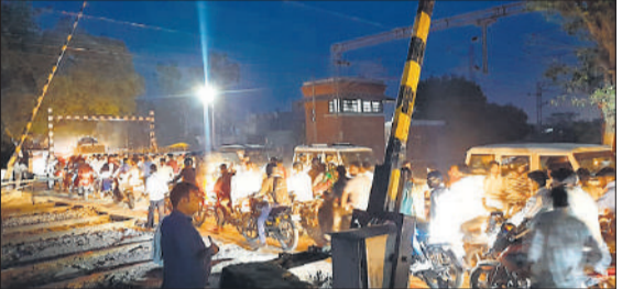
बिलपुर रेलवे क्रॉसिंग पर जाम में फंसे वाहन।

:निर्माणाधीन ओवरब्रिज व साप्ताहिक बाजार के चलते कस्बे से दातागंज को जाने वाले मार्ग पर बिलपुर रेलवे फाटक 344-सी पर मंगलवार को देर शाम तक जाम के हालात बन रहे। एंबुलेंस समेत सैकड़ों वाहन काफी देर तक जाम में फंसे रहे। कस्बे में बिलपुर रेलवे फाटक पर पुल निर्माण कार्य के दौरान सुरक्षा और ट्रैफिक प्रबंधन के पुख्ता इंतजाम नहीं किए गए हैं। इसका खामियाजा आम लोगों के साथ-साथ गंभीर मरीजों को