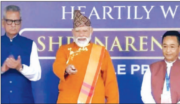
गंगटोक में एक समारोह के दौरान वर्चुअल माध्यम से उद्घाटन करते पीएम मोदी।

यह खेल के बुनियादी ढांचे को मजबूत करने और पूर्वोत्तर क्षेत्र को अपार खेल क्षमता को सामने लाने की दिशा में एक महत्वपूर्ण कदम है।' उद्घाटन समारोह में अंतरराष्ट्रीय क्रिकेट परिषद (आईसीसी) के चेयरमैन जय शाह और बीसीसीआई के पदाधिकारी मौजूद थे जबकि पूर्वोत्तर के अन्य पांच राज्यों के प्रशासक वीडियो कॉन्फ्रेंस के जरिए इस कार्यक्रम से जुड़े। बीसीसीआई ने कहा, 'इस परियोजना की परिकल्पना बीसीसीआई द्वारा की