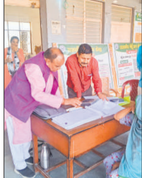
संबंधित अधिकारियों के खिलाफ सख्त कार्रवाई की जाएगी।