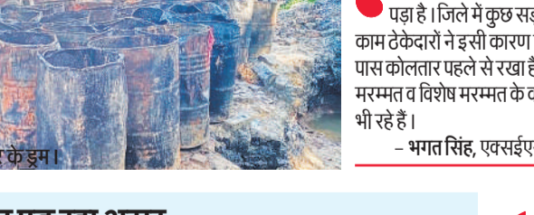
एक प्लांट पर खाली रखे कोलतार के ड्रम।

अमृत विचार: पश्चिम एशिया युद्ध ने जिले की सड़कों के निर्माण की रफ्तार पर भी ब्रेक लगा दिया है। युद्ध ने कोलतार के बाजार में ऐसी आग लगाई है कि प्रति मीट्रिक टन कीमतों में करीब सवा सौ प्रतिशत का उछाल आया है। दो माह पहले तक कोलतार 40 हजार रुपये मीट्रिक टन था, वह अब 90 हजार रुपये के रिकॉर्ड स्तर पर पहुंच गया है। हालांकि विभाग ने अभी आधिकारिक तौर पर प्रोजेक्ट्स की लागत रिवाइज नहीं की है, लेकिन धरातल पर संकट गहरा गया है। आलम यह है कि निर्माण स्थलों पर रोड रोलर, मिक्सर व हॉट मिक्स मशीनों के पहिये थम गए हैं। इससे 400 करोड़ से अधिक की परियोजनाएं प्रभावित होने की संभावना जताई जा रही है।