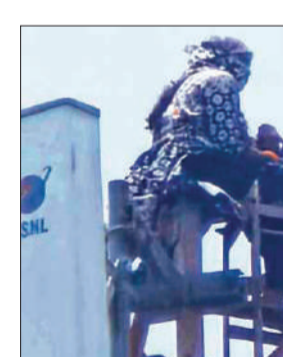
टावर के ऊपर चढ़कर बैठी महिला।