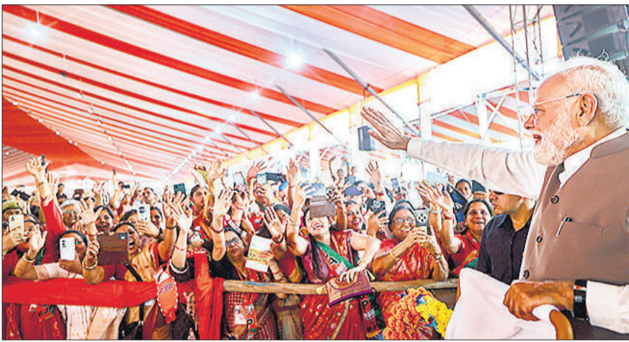
वाराणसी में महिला सम्मेलन में उमड़ा जनसैलाब, प्रधानमंत्री ने किया जनता का अभिवादन।

पीएम मोदी मंगलवार दोपहर दो दिवसीय दौरे पर काशी आने के बाद शाम को बरेका में आधी आबादी से खचाखच भरे जन आक्रोश महिला सम्मेलन को संबोधित कर रहे थे। यहां महिलाओं के बीच से होकर पीएम मंच पर पहुंचे। उन्होंने जैसे ही 6332 करोड़ रुपये की 163 योजनाओं का लोकार्पण और शिलान्यास किया, पूरा पंडाल "हर-हर महादेव" और "मां गंगा" के जयघोष से गूंज उठा। पीएम ने बनारस-पुणे व अयोध्या-मुंबई अमृत भारत एक्सप्रेस ट्रेनों को हरी