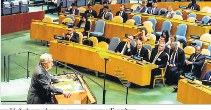
न्यूयॉर्क में सोमवार को शुरू हुआ परमाणु अप्रसार संधि सम्मेलन।

विद्यमान में ईरान मिशन ने एक वयान में कहा कि यह चुनाव वैश्विक स्तर पर परमाणु हथियारों को खत्म करने के लिए ईरान की भूमिका और वकालत का सम्मान है। ईरान ने अपना पुराना नारा दोहराते हुए कहा, परमाणु उर्जा सभी के लिए, लेकिन परमाणु हथियार किसी के लिए नहीं। ईरान ने अपने दावे में यह भी कहा कि उनके यहां परमाणु हथियारों के इस्तेमाल पर रोक लगाई गई है। मौलतब बोरंड ने एक प्रस्ताव पारित किया था, जिसमें अमेरिकी डॉलर का एक समझौता किया था और इनमें से तीनों की आपूर्ति पहले ही की जा चुकी है। मिसाइल प्रणाली की आपूर्ति के लिए संशोधित समयसीमा के अनुसार, पांचवीं इकाई नवंबर तक सुपुर्द कर दी जाएगी। ऑपरेशन सिद्धूर के दौरान एस-400 मिसाइल प्रणालियों ने महत्वपूर्ण भूमिका निभाई थी।