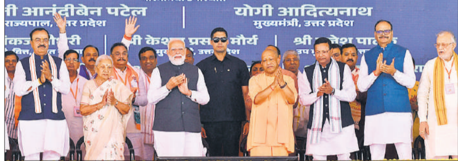
गंगा एक्सप्रेसवे के लोकार्पण अवसर पर मंच पर उपस्थित पीएम मोदी, राज्यपाल आनंदीबेन, सीएम योगी तथा अन्य।

● पीएम बोले-किसानों, उद्योग व युवाओं के लिए नई लाइफलाइन, 12 जिलों में बढ़ेंगे अवसर