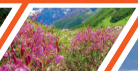
फूलों की घाटी