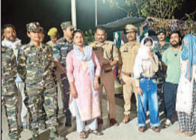
पुलिस व एसएसबी की गिरफ्त में आरोपी व बरामद लड़कियां। अमृत विचार

अमृत विचार। पुलिस व एसएसबी की संयुक्त टीम ने मानव तस्करी का प्रयास विफल कर दिया। टीम ने मंगलवार रात दो नेपाली लड़कियों को मुक्त कराया।