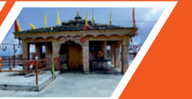
कार्तिक स्वामी मंदिर