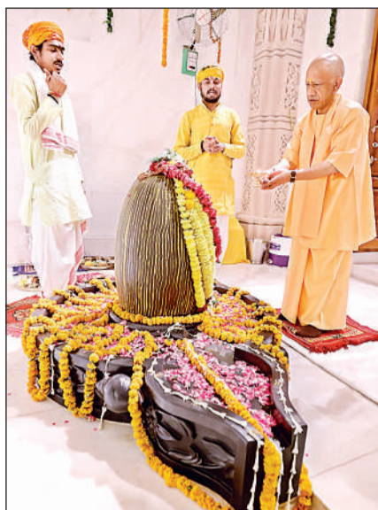
शिव मंदिर में पूजन - अर्चन करते मुख्यमंत्री ।