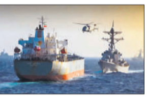
● ईरान की ओर जाने का था शक पुष्टि न होने के बाद छोड़ा

अमेरिकी मरीन सैनिकों ने इस शक के कारण अरब सागर में एक वाणिज्यिक जहाज पर धावा बोल दिया कि वह होर्मुज जलडमरूमध्य में अमेरिकी नाकाबंदी तोड़कर ईरान जा रहा था। एम/वी ब्लू स्टार 3 नाम के इस जहाज की तलाशी ली गई और बाद में यह पुष्टि होने के बाद उसे छोड़ दिया गया कि वह किसी ईरानी बंदरगाह की ओर नहीं जा रहा था। अमेरिकी सेंट्रल कमान ने मंगलवार को एक्स पर लिखा कि सुबह अरब सागर में अमेरिकी मरीन सैनिकों ने एम/वी ब्लू स्टार 3 नामक एक