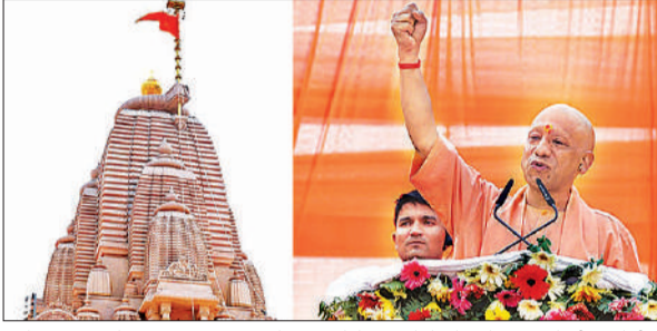
अयोध्या: मंदिर के शिखर पर धर्म ध्वजारोहण करने के बाद लोगों को संबोधित करते सीएम योगी।

अमृत विचार: मुख्यमंत्री योगी आदित्यनाथ ने कहा कि प्रभु श्रीराम, श्रीकृष्ण और भगवान शिव भारत को जोड़ने की सबसे बड़ी शक्ति हैं। श्रीराम उत्तर-दक्षिण, श्रीकृष्ण पूर्व-पश्चिम और भगवान शंकर द्वादश ज्योतिर्लिंगों के माध्यम से पूरे देश को एक सूत्र में बांधते हैं। उन्होंने कहा कि जहां अयोध्या और राम होंगे, वहां विजय सुनिश्चित है। सीएम योगी बुधवार को श्रीराम जन्मभूमि मंदिर परिसर स्थित शिव मंदिर के शिखर पर वैदिक मंत्रोच्चार के साथ धर्म ध्वजारोहण करके भगवान शिव व श्रीरामलला का विधिवत दर्शन-पूजन और आरती के बाद लोगों को संबोधित कर रहे थे। योगी ने कहा कि डॉ. लोहिया कहते थे कि श्रीराम, श्रीकृष्ण व शिवशंकर हैं तो कोई भारत का बाल बांका नहीं कर सकता, लेकिन यह बात उनके शिष्य नहीं समझेंगे, क्योंकि समझ उन्हें आता है, जिनमें समझ का सामर्थ्य होता है। जिनमें समझ का सामर्थ्य