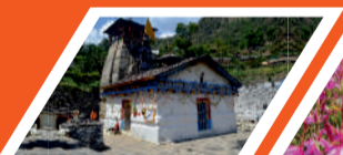
त्रियुगी नारायण मन्दिर

माण्डा गांव, व्यास गुफा और गणेश गुफा, भीमशिला, औली, फूलों की घाटी, वसुधारा जलप्रपात, चरणपादुका, तमकुंड, नारदकुंड, ज्योतिर्मठ (जोशीमठ), सतोपंथ झील, पाण्डुकेश्वर, आदिबदरी मन्दिर, हेमकुंड साहिब