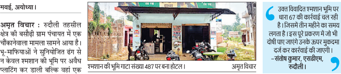
श्मशान की भूमि गाटा संख्या 487 पर बना होटल ।