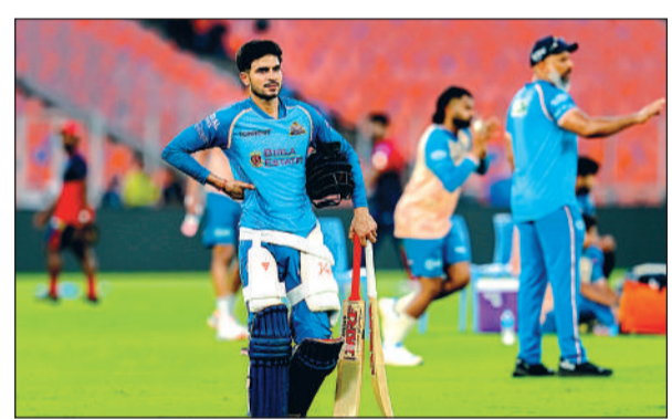
अभ्यास सत्र के दौरान गुजरात टाइटंस के कप्तान शुभमन गिल।

निरंतरता हासिल करने के लिए बेताब गुजरात टाइटंस को गुरुवार को यहां होने वाले इंडियन प्रीमियर लीग (आईपीएल) के मैच में शानदार फॉर्म में चल रही रॉयल चैलेंजर्स बेंगलुरु की टीम की कड़ी चुनौती का सामना करना पड़ेगा। अब जबकि टूर्नामेंट का आधा चरण पूरा हो चुका है तब गुजरात टाइटंस की टीम आठ मैचों में चार जीत और चार हार के साथ अंक तालिका में आगे बढ़ने के लिए संघर्ष कर रही है। दूसरी तरफ मौजूदा चैंपियन आरसीबी शानदार फॉर्म में है और उसने आठ मैचों में से छह में जीत दर्ज की है। आरसीबी अभी अंक तालिका में दूसरे स्थान पर है। आरसीबी की तरफ से उसके तेज गेंदबाजी भुवनेश्वर कुमार और जोश हेजलवुड ने मिलकर कहर बरपाया है। जहां भुवनेश्वर ने अपनी शानदार स्विंग से पुराने दिनों की याद दिला दी है, वहीं हेजलवुड ने टेस्ट मैच के स्तर की गेंदों से बल्लेबाजों को परेशान किया है। वह बल्ले के बाहरी किनारे को लक्ष्य बनाकर गेंदबाजी कर रहे हैं। इसके