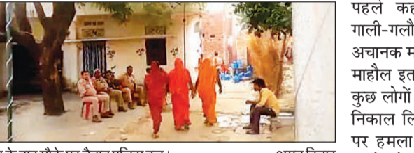
घटना के बाद मौके पर तैनात पुलिस बल। अमृत विचार

अमृत विचार। जिले के जीवनपुर थाना क्षेत्र के इंदिरा नगर, अजमतगढ़ में एक शादी समारोह उस समय दर्दनाक हादसे में बदल गया, जब जयमाल के दौरान कूलर की हवा को लेकर शुरू हुआ मामूली विवाद देखते ही देखते खूनी संघर्ष में तब्दील हो गया। इस घटना में एक युवक की मौके पर ही मौत हो गई, जबकि कई लोग गंभीर रूप से घायल हो गए। घटना के बाद पूरे इलाके में तनाव का माहौल