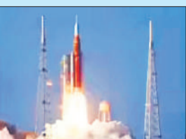
आर्टेमिस-3 : चंद्रमा पर 2028 में पड़ेंगे इसानी कदम आर्टेमिस-2 से पहले आखिरी बार 1972 में अंतरिक्ष यात्री अपोलो 17 मिशन में चंद्रमा तक गए थे। आर्टेमिस-3 के लिए नया कैस्पूल और नया वालक दल होगा। वे पृथ्वी की कक्षा में रहकर स्पेसएक्स और ब्लू ऑरिजिन द्वारा विकसित किए जा रहे चंद्र लैंडर के साथ डॉकिंग अभ्यास करेंगे। इसके बाद 2028 तक दो नए अंतरिक्ष यात्रियों के चंद्रमा पर उतरने का मार्ग प्रशस्त होगा।

केनवरल लाया गया। इंजीनियर अगले वर्ष आर्टेमिस-3 मिशन के दौरान पृथ्वी की कक्षा में यानों को जोड़ने (डॉकिंग) के परीक्षण की तैयारी के लिए कैस्पूल की हीट शील्ड सहित सभी प्रणालियों की विस्तार से जांच करेंगे। कैस्पूल के इलेक्ट्रॉनिक बॉक्स हटाकर दोबारा उपयोग में लाए जाएंगे, साथ ही अनुसंधान उपकरण भी निकाले जाएंगे। अमेरिका-कनाडा के चालक दल द्वारा 'इंटीग्रीटी' नाम दिया गया यह कैस्पूल अंतरिक्ष यात्रियों को अब तक मानव द्वारा तय की गई सबसे अधिक दूरी तक अंतरिक्ष में ले गया।