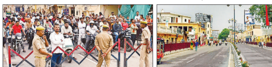
मुख्यमंत्री के आगमन के दौरान गेट नंबर 11 के पास लगे बैरियर पर रोका गया आवागमन और खाली कराया गया रामपथ।