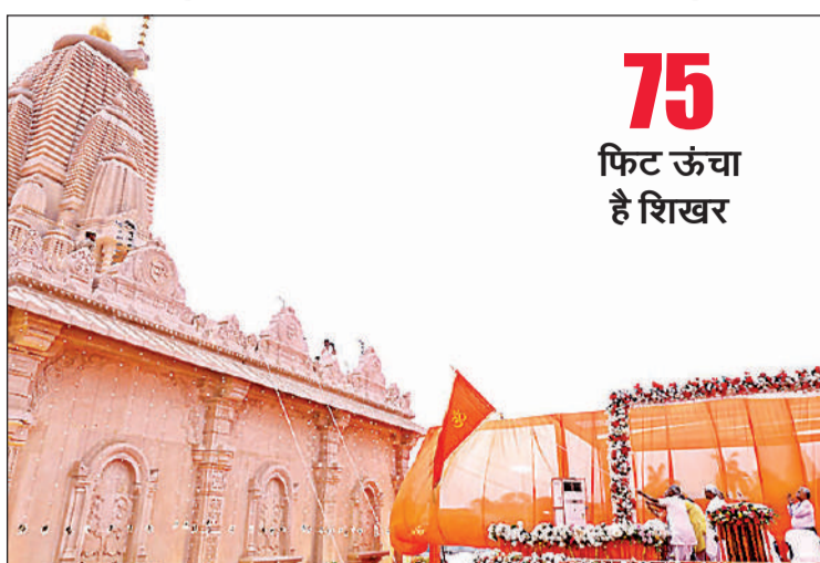
शिव मंदिर के शिखर पर धर्म ध्वजा का आरोहण करते मुख्यमंत्री योगी आदित्यनाथ ।

अमृत विचार : मुख्यमंत्री योगी आदित्यनाथ ने बुधवार शाम करीब 5:45 बजे शुभ मुहूर्त में राम मंदिर परिसर स्थित शिव मंदिर के 75 फिट ऊंचे शिखर पर धर्म ध्वजा का आरोहण किया। इससे पूर्व उन्होंने वैदिक मंत्रोच्चारण के बीच ध्वज का पूजन-अर्चन किया। मंच से अतिथियों को संबोधित करते हुए मुख्यमंत्री ने कहा कि इतना बड़ा आंदोलन और अंततः विजय यह अयोध्या में ही संभव है। इससे संदेश गया कि हम झुकेंगे नहीं, रुकेंगे नहीं, अपने लक्ष्य को प्राप्त करेंगे। यह अयोध्या ने दुनिया को बताया है। कहा कि सभी सनातन धर्मावलंबी बोल उठे थे तब राम जन्मभूमि में मंदिर निर्माण का मार्ग प्रशस्त हो पाया। हमारे विभाजन का हमेशा से लाभ उठाया गया। हम आज एकजुट होकर जब उसका मुकाबला कर रहे हैं तो सुरक्षित है। हर व्यक्ति सुरक्षित है। अपनी विरासत को गौरव के साथ आगे बढ़ते हुए आने वाली पीढ़ी को गौरव के साथ बताने की स्थिति में हैं। यह गौरवमयी क्षण हमने अपनी आंखों से देखा है। हमें अपने पूर्व जन्म का पुण्य प्राप्त हो रहा है। हमने इसके महत्व को भी समझा है और इसको वर्तमान और भावी पीढ़ी को बताएं।