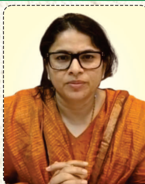
प्रियंका निरंजन जिलाधिकारी गोंडा