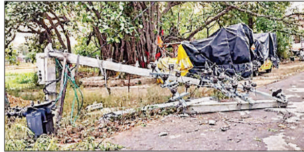
वसापुर चौराहे के पास गिरा विद्युत पोल, सड़क पर गिरा ट्रांसफार्मर।