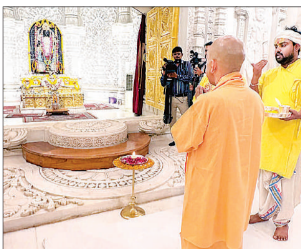
रामलला को हाथ जोड़कर नमन करते मुख्यमंत्री ।