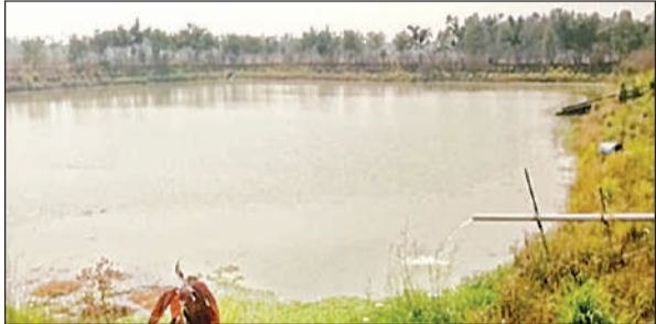
पांपसेट के माध्यम से तालाब में भरा जा रहा पानी।