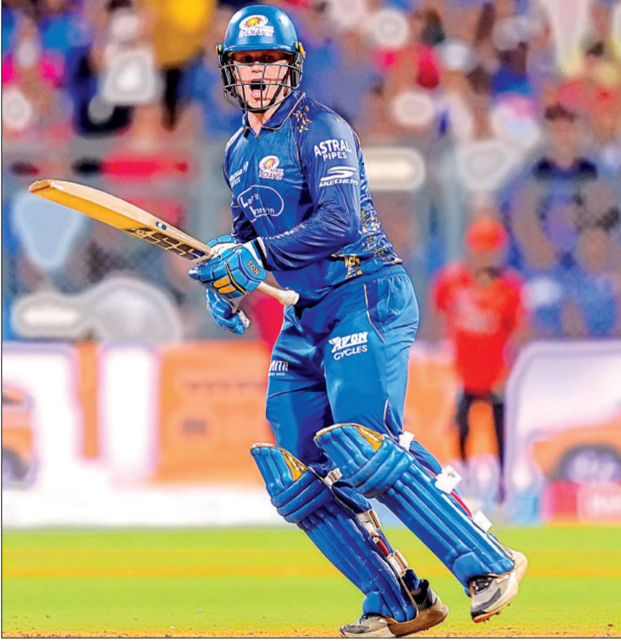
शतकीय पारी के दौरान शांत लगाते रियान रिकेल्टन।