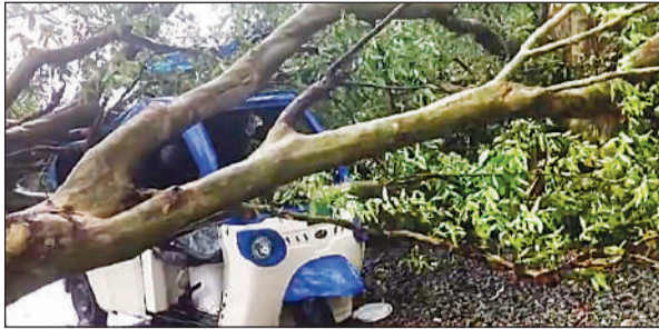
मटिया तिराहे पर आंधी से आँटो पर गिरा पेड़।