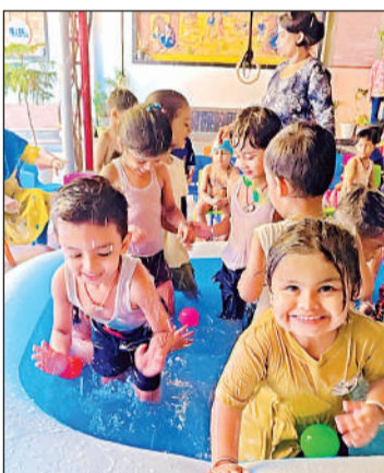
कनक किड्स इंटरनेशनल स्कूल में आयोजित पूल पार्टी में मस्ती करते बच्चे।

अयोध्या, अमृत विचार : पंचकोसी परिक्रमा मार्ग स्थित प्रतिष्ठित कनक किड्स इंटरनेशनल स्कूल में बुधवार को नर्सरी के बच्चों के लिए पूल पार्टी का आयोजन किया गया। बच्चों ने पानी में विभिन्न खेलों का आनंद लिया। रंग-बिरंगे स्विमिंग ट्यूब, आकर्षक पानी के खेलों