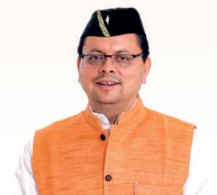
पुष्कर सिंह धामी मुख्यमंत्री, उत्तराखण्ड

माननीय प्रधानमंत्री जी ने 21वीं सदी के तीसरे दशक को उत्तराखण्ड का दशक कहा है। हम प्रधानमंत्री जी के विजन के अनुरूप राज्य को हर क्षेत्र में आदर्श राज्य बनाने के लिये विकल्प रहित संकल्प के साथ काम कर रहे हैं।