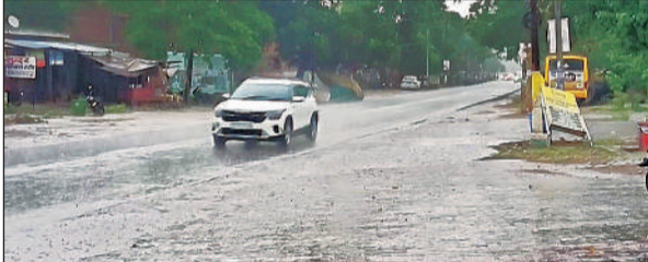
अकबरपुर-टांडा मार्ग पर बारिश के बीच जाते वाहन। अमृत विचार

अमृत विचार। बुधवार दोपहर बाद अचानक मौसम ने करवट ले ली। तेज धूप और भीषण गर्मी के बीच अचानक आसमान में काले घने बादल छा गए। लगभग 3 बजे दिन में ही अंधेरा जैसा माहौल हो गया। कुछ ही देर में तेज हवाएं चलने लगीं और फिर झमाझम बारिश शुरू हो गई। बारिश के साथ चली ठंडी हवाओं से तापमान में गिरावट दर्ज की गई और लोगों को कई दिनों से पड़ रही भीषण गर्मी से राहत मिली।