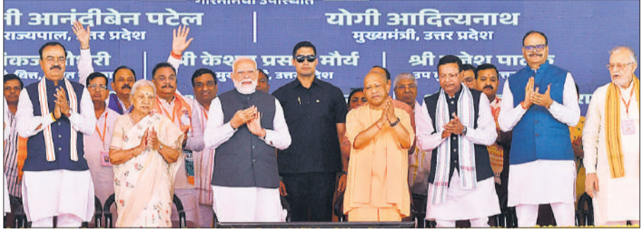
गंगा एक्सप्रेसवे के लोकार्पण अवसर पर मंच पर उपस्थित पीएम मोदी, राज्यपाल आनंदीबेन, सीएम योगी तथा अन्य।

प्रधानमंत्री मोदी बुधवार को हरदोई के तहसील बिलग्राम स्थित मल्लावां कट के पास गंगा एक्सप्रेस-वे का लोकार्पण करने के बाद जनसभा को संबोधित कर रहे थे। प्रधानमंत्री ने कहा कि मां गंगा के नाम पर बना यह एक्सप्रेस-वे प्रदेश की विरासत और विकास दोनों का प्रतीक है। इससे अब