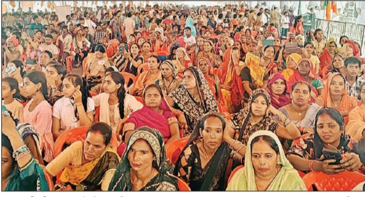
प्रधानमंत्री की जनसभा में मौजूद महिलाएं।

गर्मियों के चलते पानी की मांग बहुत तयत रही। प्रशासन की माफूल व्यवस्था के चलते कहीं पर कोई अत्यवस्था नहीं रही। कई दिनों से अधिकारी दिन-रात एक कर व्यवस्था बनाने में लगे हुए थे।