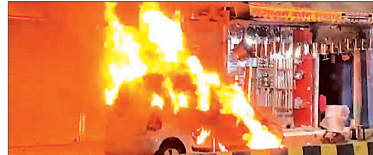
शहर के मुख्य मार्ग पर धू-धूकर जलती कार।