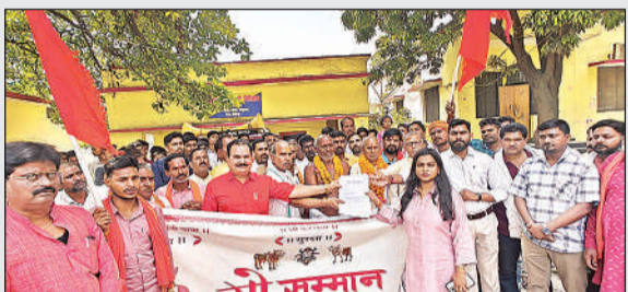
एसडीएम को झापन सौंपते संत व अन्य।