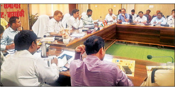
बैठक में दिशा-निर्देश देते जिलाधिकारी।