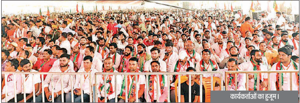
कार्यकर्ताओं का हुजूम।

हरदोई, अमृत विचार। मुख्यमंत्री योगी आदित्यनाथ ने कहा एक समय था यूपी माफियाओं से भरा था आये दिन कर्पूर के साथ अराजकता का माहोल रहता था। उसे जड़ से खत्म कर के यूपी में नये निवेश की परिकल्पना साकार हो रही है। यूपी के अंदर कई एक्सप्रेस वे, हाई वे डिस्ट्रिक्ट से और ग्रामीण सड़कों के विकास के साथ ब्लॉक और तहसील मुख्यालयों को फोर लेन के साथ जोड़ा जा रहा है। 594 किलोमीटर का यह गंगा एक्सप्रेस वे 18000 एकड़ लैंड अन्नदान किसानों ने दिया और 7000 एकड़ गंगा एक्सप्रेस वे के समीप औद्योगिक क्षेत्र के लिए दिया जिससे ये गंगा एक्सप्रेस वे युवाओं को रोजगार में बढ़ावा मिलेगा। गंगा एक्सप्रेस वे के निर्माण में किसानों की अहम भूमिका रही तभी यूपी विकास की ओर तेजी से बढ़ पा रहा है। विकास भारत के योगदान में किसानों ने भरपूर साथ दिया, विकसित भारत की परिकल्पना को सार्थक किया है।