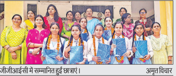
जीजीआईसी में सम्मानित हुई छात्राएं।