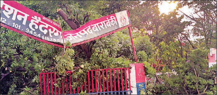
हैदरगढ़ तहसील गेट पर गिरा पेड़।

हैदरगढ़ प्रतिनिधि के अनुसार बुधवार की दोपहर लगभग तीन बजे अचानक तेज हवाएं चलने लगीं और हवाओं ने आधी तूफान का रूप ले लिया। इसी दौरान तहसील मुख्यालय के गेट के निकट जड़ से उखड़े बालम खीरा के विशालकाय पेड़ ने तहसील परिसर की चहारदीवारी तोड़ी फिर फायर स्टेशन के परिसर में जा गिरा। पेड़ की चपेट में आकर फायर स्टेशन का गेट भी क्षतिग्रस्त हो गया। इस दौरान तहसील