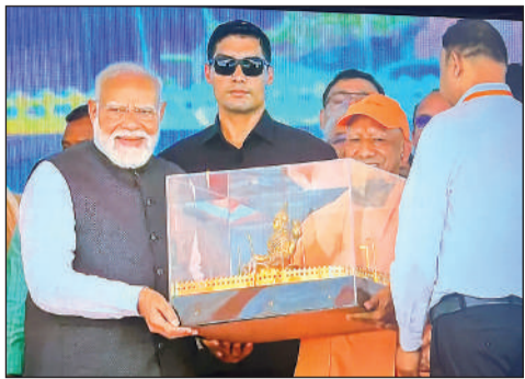
उद्घाटन समारोह में प्रधानमंत्री मोदी को स्मृति चिह्न भेंट करते मुख्यमंत्री योगी।

जनसभा सम्बोधित करते हुए प्रधानमंत्री ने कहा कि आज उत्तर प्रदेश में विकास की नई तस्वीर उभर कर सामने आ रही है। एक्सप्रेसवे बन रहे हैं, उद्योग लग रहे हैं, लोगों को रोजगार मिल रहा है। भयमुक्त प्रदेश में बड़े-बड़े उद्योगपति निवेश कर रहे हैं, यूपी को पहले बीमारू और गड़बड़े वाला प्रदेश कहा जाता था। लेकिन अब एक्सप्रेसवे वाला प्रदेश है। कहा कि उत्तर प्रदेश में बदल इंजन की सरकार ने विकास की नई नींव रखी है पुरानी सोच को बदला है और तेजी से विकास कर रहा है। पहले एक सड़क बनने में वर्षों लगते थे फ़ाइल दब जाती थी। अब तेजी से ब्लॉक मुख्यालय से लेकर राजधानी तक एक्सप्रेस हाइवे से जोड़ा जा रहा है। लेकिन सपा सहित पूरे विपक्ष को यह विकास रास नहीं आ रहा है। वह समाज को तोड़ने के साथ-साथ विकास को भी रोकना चाहते हैं। विकास विरोधी सपा ने नारी शक्ति वंदन बिल को पास नहीं होने दिया। सपा किसी भी वर्ग का विकास नहीं चाहती है। बिल पास न होने से सपा की महिला विरोधी मानसिकता उजागर हो गई है।