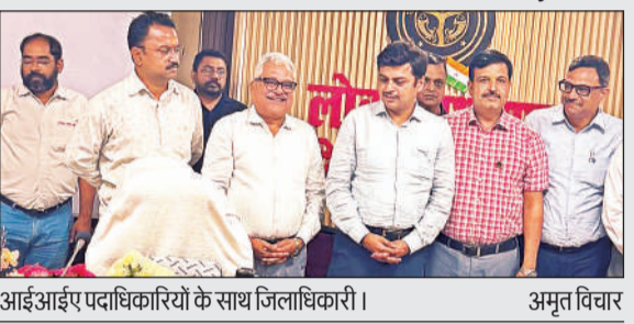
आईआईए पदाधिकारियों के साथ जिलाधिकारी।