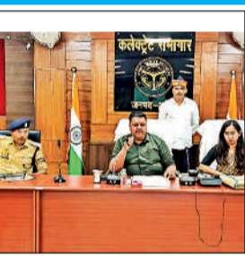
बैठक करते डीएम व मौजूद अधिकारी।

उन्होंने कहा कि शिकायतकर्ता की संतुष्टि सर्वोच्च प्राथमिकता होनी चाहिए। बैठक में विभागों की रैकिंग सुधारने पर विशेष जोर दिया गया। डीएम ने चेतावनी दी कि खराब प्रदर्शन करने वाले विभागों के खिलाफ सख्त कार्रवाई की जाएगी। निर्माण कार्यों की समीक्षा करते हुए उन्होंने स्पष्ट किया कि सभी परियोजनाएं निर्धारित समय में और गुणवत्ता के साथ पूरी हों। मानकहीन कार्य या अनियमितता मिलने पर