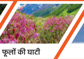
फूलों की घाटी