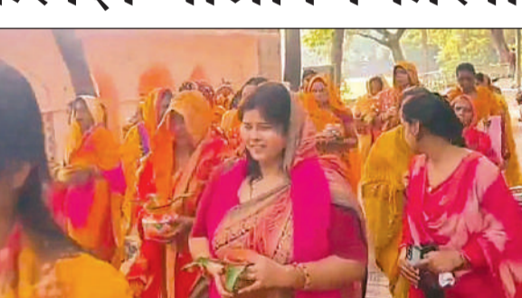
कलश यात्रा में शामिल महिलाएं।

अमृत विचार। भाजपा की पूर्व सांसद अंजू बाला का आवास लोकार्पण स्थल से कुछ ही दूर पर है, लेकिन वह समारोह में नहीं पहुंचीं। उन्होंने अपनी छत से प्रधानमंत्री मोदी का हेलीकाप्टर देखकर उनका अभिभावदन किया। इसकी रील सोशल मीडिया पर वायरल की। अंजू बाला की यह रील चर्चा का विषय बनी हुई है। पूर्व सांसद सोशल मीडिया पर रील बनाकर काफी सक्रिय रहती हैं। गत दिवस भी उन्होंने रील बनाकर कहा था कि इस एक्सप्रेसवे की शुरुआत