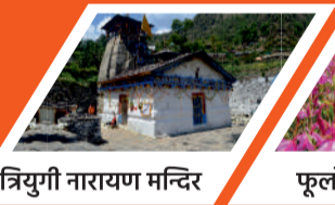
त्रियुगी नारायण मन्दिर

माणगा गांव, व्यास गुफा और गणेश गुफा, भीमशिला, औली, फूलों की घाटी, वसुधारा जलप्रपात, चरणपादुका, तप्तकुंड, नारदकुंड, ज्योतिर्मठ (जोशीमठ), सतोपंथ झील, पाण्डुकेश्वर, आदिबदरी मन्दिर, हेमकुंड साहिब