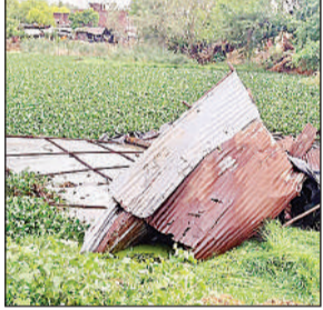
आंधी आने के बाद गिरी टीनशेड।

बैती मस्जिद के पास स्थित बरगद का पेड़ धराशायी होने से महिला श्रद्धालुओं की आस्था को