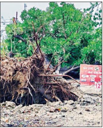
हैदरगढ़ फायर स्टेशन के गेट पर गिरा पेड़।