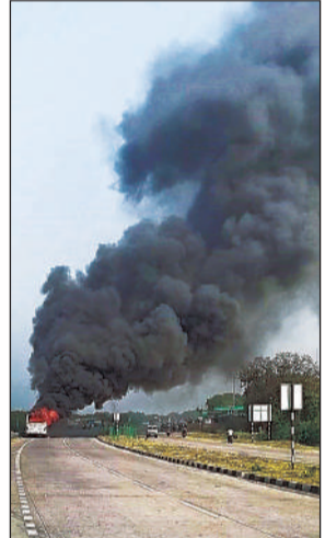
हाईवे पर धू-धूकर जलती बस।

अमृत विचार। एक चर्म इकाई में कार्यरत आधा सैकड़ा से अधिक श्रमिक व कर्मियों को ले जा रही निजी बस में उन्नाव-लालगंज हाईवे पर अचानक आग लगने से हड़कंप मच गया। चालक ने सूझबूझ से काम लेते हुए बस सड़क किनारे रोक दी। जिससे इसमें बैठे लोगों ने खिड़की व दरवाजे से कूदकर अपनी जान बचाई। कुछ देर में बस जलकर खाक हो गई। इस दौरान हाईवे पर जाम लग गया। पीएम की रैली में जा रही बसों को डायवर्ट कर निकाला गया। बारासगवर थानाक्षेत्र