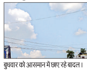
बुधवार को आसमान में छपर रहे बादल।

हरदोई, अमृत विचार। पिछले कई दिनों से गर्मी का सितम लगातार जारी था। बुधवार को अचानक बदले मौसम से लोगों को राहत मिली। दोपहर से ही बादल छाने लगे। अधिकांश समय बादल रहने से तापमान गिर कर 35.6 डिग्री सेल्सियस रह गया। तापमान गिरने के साथ ही आठ किलोमीटर प्रति घंटा की रफ्तार से चली हवा ने गर्मी से भी कुछ राहत दिलाई। कई दिनों से बेहाल लोगों ने बुधवार को राहत की सांस ली। मौसम वेधशाळा के अनुसार बूंदाबांदी भी हो सकती है। मौसम का यह बदलाव अभी दो-तीन दिन तक रहेगा। मौसम के इस बदलाव से कई दिनों से गर्मी की मार