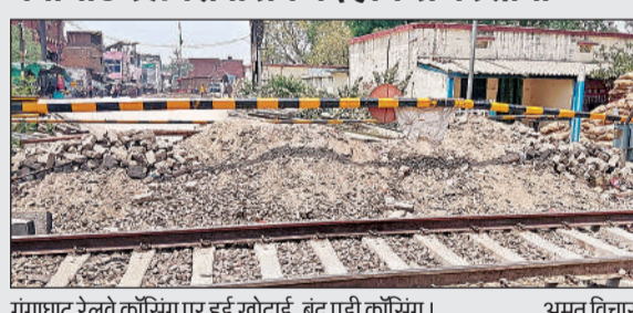
गंगाघाट रेलवे क्रॉसिंग पर हुई खोदाई, बंद पड़ी क्रॉसिंग।