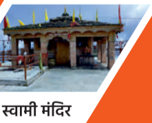
कार्तिक स्वामी मंदिर