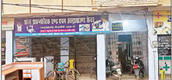
बंद किया गया शरल डाइग्नोस्टिक एंड एवन अल्ट्रासाउंड सेंटर।