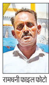
रामधनी फाइल फोटो

बिन मां कैसे होगी बच्चों की परवरिश बोलें चालक का परिवार भी बिखरा