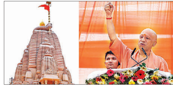
अयोध्या: मंदिर के शिखर पर धर्म ध्वजारोहण करने के बाद लोगों को संबोधित करते सीएम योगी।

सीएम योगी बुधवार को श्रीराम जन्मभूमि मंदिर परिसर स्थित शिव मंदिर के शिखर पर वैदिक मंत्रोच्चार के साथ धर्म ध्वजारोहण करके भगवान शिव व श्रीरामलला का विधिवत दर्शन-पूजन और आरती के बाद लोगों को संबोधित कर रहे थे। योगी ने कहा कि डॉ. लोहिया कहते थे कि श्रीराम, श्रीकृष्ण व शिवशंकर हैं तो कोई भारत का बाल बांका नहीं कर सकता, लेकिन यह बात उनके शिष्य नहीं समझेंगे, क्योंकि समझ उन्हें आता है, जिनमें समझ का सामर्थ्य होता है। जिनमें समझ का सामर्थ्य