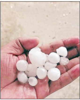
बाबागंज में गिरे ओले।