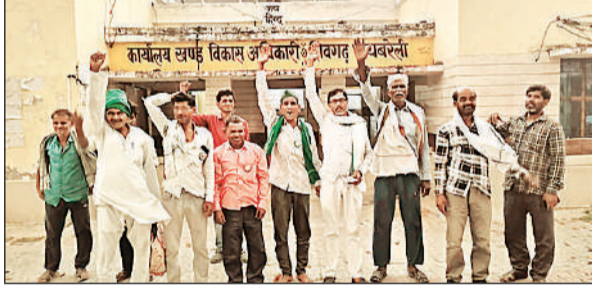
शिवगढ़ ब्लाक परिसर में प्रदर्शन करते किसान यूनियन के पदाधिकारी।

अमृत विचार। खण्ड विकास कार्यालय में बुधवार को आयोजित ब्लॉक दिवस के दौरान बीडीओ समेत अन्य कर्मचारियों के अनुपस्थित रहने पर किसान यूनियन अराजनीतिक के कार्यकर्ताओं ने विरोध प्रदर्शन किया। साथ ही विकास खण्ड परिसर में खराब पड़े इंडिया मार्का हैंडपंप को लेकर भी नाराजगी जताई।