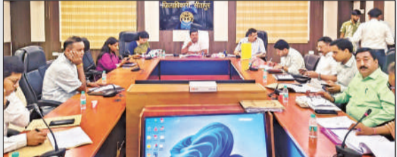
अधिवक्ता को अच्छे व्यवहार की नसीहत देते जिलाधिकारी।