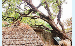
तेज आंधी आने से घर पर गिरा पेड़।

महराजगंज। भीषण गर्मी और चिलचिलाती धूप से झूलस रहे क्षेत्रवासियों को बुधवार दोपहर उस समय बड़ा झटका लगा, जब अचानक मौसम ने करवट ली। दोपहर करीब दो बजे आई तेज आंधी, मूसलाधार बारिश और भारी ओलावृष्टि ने जनजीवन को अस्त-व्यस्त कर दिया। हालांकि इस बदलाव ने लोगों को गर्मी से राहत तो दी, लेकिन इसके साथ आई तबाही ने भारी नुकसान पहुंचाया है। श्रुतवासा, पहरेमऊ और