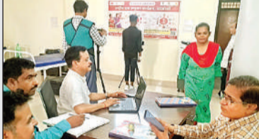
टीबी स्क्रीनिंग शिविर में मौजूद चिकित्सक।

रायबरेली, अमृत विचार। टीबी मुक्त भारत अभियान के तहत चल रहे 100 दिवसीय विशेष अभियान के अंतर्गत बुधवार को राजकीय प्रेक्षण गृह में टीबी स्क्रीनिंग शिविर आयोजित किया गया। इस दौरान एआई आधारित हैंडहेल्ड एक्स-रे मशीन से कुल 64 व्यक्तियों की जांच की गई, जिनमें 50 किशोर, स्टाफ और अन्य लोग शामिल रहे।