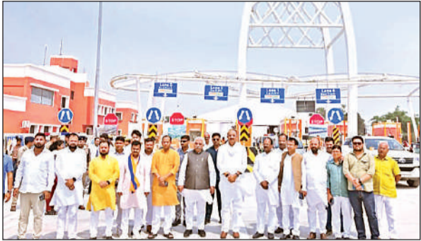
टोल प्लाजा के समीप गंगा एक्सप्रेसवे के लोकार्पण अवसर पर मौजूद अतिथि।

ऊंचाहार क्षेत्र में औद्योगिक विकास की आधारशिला: एक्सप्रेसवे के साथ ही ऊंचाहार विधानसभा क्षेत्र के इटौटा बुजुर्ग में औद्योगिक विकास की संभावनाएं भी तेज हो गई हैं। उत्तर प्रदेश एक्सप्रेसवे औद्योगिक विकास प्राधिकरण द्वारा लगभग सौ हेक्टेयर भूमि औद्योगिक क्षेत्र के रूप में