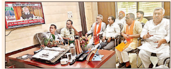
लोकार्पण का लाइव प्रसारण देखते भाजपा कार्यकर्ता।