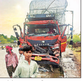
हादसे के बाद खड़ा क्षतिग्रस्त वाहन।

अमृत विचार। इहौना थाना क्षेत्र के रत्नेश्वर मंदिर के सामने बुधवार को एक सड़क हादसा हो गया, जहां एक डीसीएम ने सड़क किनारे खड़े टाटा ट्रक में पीछे से जोरदार टक्कर मार दी। हादसे के बाद मौके पर अफरा-तफरी मच गई। जनकपुर के अनुसार, डीसीएम लखनऊ से सुल्तानपुर की तरफ जा रहा था तभी वह अनियंत्रित होकर खड़े ट्रक में पीछे से जा भिड़ी। टक्कर इतनी तेज थी कि डीसीएम का अगला हिस्सा बुरी तरह क्षतिग्रस्त हो गया।