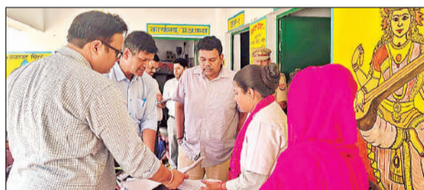
आंगनबाड़ी केंद्र पर जानकारी लेते डीएम।