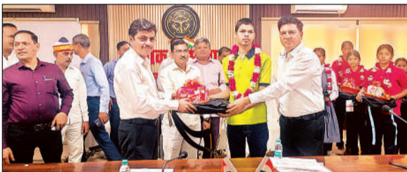
मेधावियों को सम्मानित करते जिलाधिकारी।