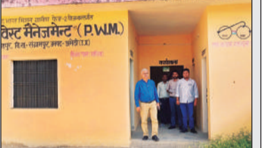
पीडब्ल्यूएम प्लांट का निरीक्षण करते डीपीआरओ।

सिंगमपुर (अमेठी) अमृत विचार। क्षेत्र के भवसिंहपुर पंचायत भवन के पास स्थापित प्लास्टिक वेस्ट मैनेजमेंट प्लांट ब्ल्यूएम प्लांट ब्लोअर मशीन के अभाव में बंद पड़ा है। लाखों रुपये की लागत से स्थापित इस प्लांट का उद्देश्य क्षेत्र में प्लास्टिक, कांच, पन्नी व गते जैसे कचरे का निस्तारण कर स्वच्छता