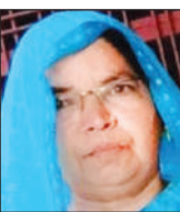
बितान फाइल फोटो