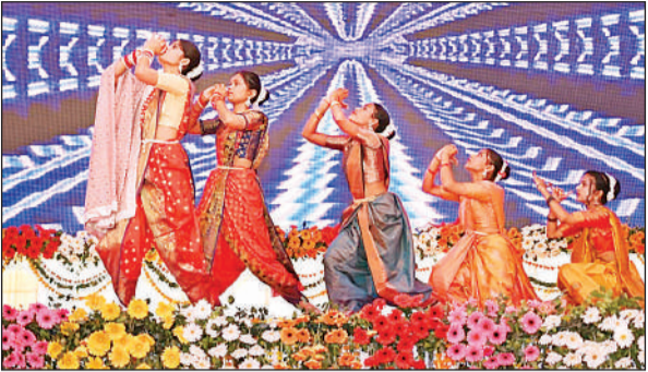
आयोजित कार्यक्रम में सामूहिक नृत्य प्रस्तुत करती युवतियां।