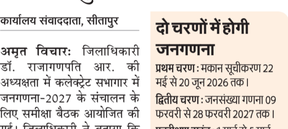
कार्यालय संवाददाता, सीतापुर