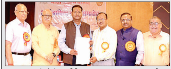
शपथ ग्रहण समारोह में मौजूद अतिथि।