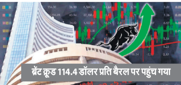
ब्रेट कूड 114.4 डॉलर प्रति बैरल पर पहुंच गया

एशिया के अन्य बाजारों में दक्षिण कोरिया का सूचकांक कांसो, चीन का शंघाई कंपोजिट और हांगकांग का हैंग सेंग बढ़त के साथ बंद हुए।