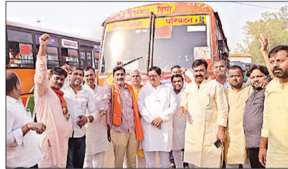
प्रधानमंत्री के कार्यक्रम को लेकर रवाना होते भाजपा कार्यकर्ता।