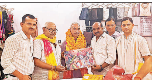
सभासद का स्वागत करते कार्यकर्ता।

में खाने-पीने व पानी की समुचित व्यवस्था थी। बता दें कि नगर पालिका के सामने से 12 बसें, जाजमऊ से 4, सहजनी व देवारा से 4 तथा हाजीपुर क्षेत्र से 5 बसें रवाना हुईं। भीड़ बढ़ाने को नगर पालिका के 400 कर्मचारी भी गए। शुक्लागंज: उद्घाटन में शामिल होने नगर पालिका गंगाघाट के 400 से अधिक कर्मी भी बसों से रवाना हो गए। इसके चलते शहर में सफाई व्यवस्था प्रभावित रही और पालिका कार्यालय पहुंचे लोगों को कामकाज के लिए भटकना पड़ा। वहीं कर्मचारियों के न होने से नगर में जगह-जगह कूड़े का ढेर लगा रहा। जिससे लोगों को परेशानी उठानी पड़ी।