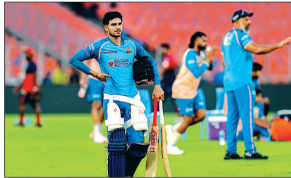
अभ्यास सत्र के दौरान गुजरात टाइटंस के कप्तान शुभमन गिल।

निरंतरता हासिल करने के लिए बेताब गुजरात टाइटंस को गुरुवार को यहां होने वाले इंडियन प्रीमियर लीग (आईपीएल) के मैच में शानदार फॉर्म में चल रही रॉयल चैलेंजर्स बेंगलुरु की टीम की कड़ी चुनौती का सामना करना पड़ेगा। अब जबकि टूर्नामेंट का आधा चरण पूरा हो चुका है तब गुजरात टाइटंस की टीम आठ मैचों में चार जीत और चार हार के साथ अंक तालिका में आगे बढ़ने के लिए संघर्ष कर रही है। दूसरी तरफ मौजूदा चैंपियन आरसीबी शानदार फॉर्म में है और उसने आठ मैचों में से छह में जीत दर्ज की है। आरसीबी अभी अंक तालिका में दूसरे स्थान पर है। आरसीबी की तरफ से उसके तेज गेंदबाजों भुवनेश्वर कुमार और जोश हेजलवुड ने मिलकर कहर बरपाया है। जहां भुवनेश्वर ने अपनी शानदार स्विंग से पुराने दिनों की याद दिला दी है, वहीं हेजलवुड ने टेस्ट मैच के स्तर की गेंदों से बल्लेबाजों को परेशान किया है। वह बल्ले के बाहरी किनारे को लक्ष्य बनाकर गेंदबाजी कर रहे हैं। इसके