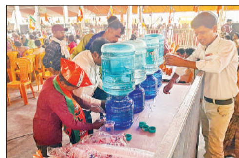
गर्मी के चलते पानी के टैबल पर भी रही कार्यकर्ताओं की भीड़।