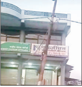
रतापुर में स्थित नवजीवन अस्पताल।