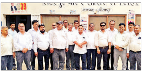
जीत के बाद मौजूद बार एसो. के पदाधिकारी।

कार्यालय संवाददाता, सीतापुर, अमृत विचार: जनपद में महिलाओं को सर्वाधिक कैंसर गर्भाशय ग्रीवा कैंसर से सुरक्षित रखने के लिए प्रशासन ने कम्प कस ली है। जिलाधिकारी डॉ. राजागणपति आर. ने जनपदवासियों के नाम एक पत्र जारी कर 14 से 15 वर्ष की किशोरियों के लिए एचपीवी व्हायरस वैपिलोमा वायरस टीकाकरण अभियान में सहयोग की अपील की है। जिलाधिकारी ने बताया कि महिलाओं में होने वाला यह दूसरा सबसे आम कैंसर है, जिसे समय पर टीकाकरण के जरिए पूरी तरह रोका जा सकता है। उन्होंने स्पष्ट किया कि यह टीका पूरी तरह सुरक्षित है और विश्व के 100 से अधिक देशों में इसका सफल प्रयोग किया जा रहा है। बाजार में इसकी कमी अधिक होने के कारण, सरकार द्वारा देश की बेटियों को यह सुरक्षा चक्र पूर्णतः निःशुल्क प्रदान किया जा रहा है। जनपद के सभी सामुदायिक स्वास्थ्य केंद्रों और जिला महिला चिकित्सालय में इसके लिए विशेष सत्र आयोजित किए जा रहे हैं। टीकाकरण के समय किशोरों का जन्म प्रमाण-पत्र या आयु प्रमाणित करने वाला कोई भी सरकारी दस्तावेज साथ ले जाना अनिवार्य होगा।