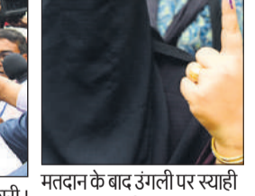
मतदान के बाद उंगली पर स्याही का चिह्न दिखाती महिला।

मुख्यमंत्री ममता बनर्जी ने इस्से पहले भवानीपुर विधानसभा क्षेत्र के कई मतदान केंद्रों का दौरा किया था, जिनमें चेतला, पद्मपुर और चक्रबेड़िया इलाके शामिल हैं। यह दौरा स्थानीय तुणमूल कांग्रेस नेताओं से कथित धमकी और अनियमितताओं की शिकायतें मिलने के बाद किया गया।