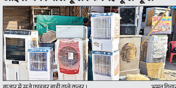
बाजार में सजे फाइबर बाड़ी वाले कूलर।