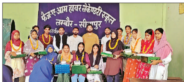
मेधावी छात्रों के साथ अतिथिगण।