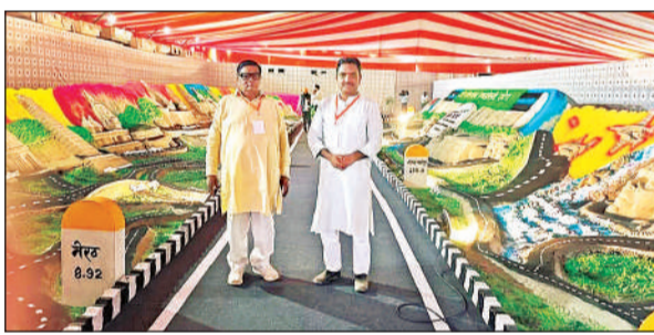
गंगा एक्सप्रेसवे की झांकी देखते मंत्री असीम अरुण।

हरदोई। लोकार्पण स्थल पर गंगा एक्सप्रेसवे की एक झांकी भी सजाई थी, जिसमें दिखाया गया था कि तरह तरह एक्सप्रेसवे किन-किन जिलों से होकर निकलेगा और इसके आसपास कौन सी सुविधाएं उपलब्ध रहेंगी। झांकी को भी आए हुए अतिथियों ने देखा। मंत्री असीम अरुण ने झांकी के साथ सेल्फी भी ली।