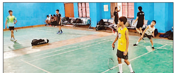
प्रतियोगिता में बैडमिंटन खेलते खिलाड़ी।