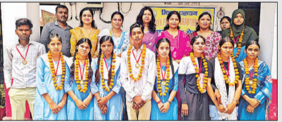
सम्मानित हुए मेधावी।