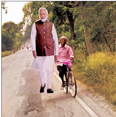
प्रधानमंत्री का कट आउट ले जाता साइकिल सवार।

मल्लावां। जनसभा में प्रधानमंत्री ने कहा कि आज लोकतंत्र का उत्सव का भी है। बंगाल में दूसरे चरण का मतदान हो रहा है। कई खबरों से पता चल रहा है भारी मतदान हो रहा है। पहले की तरह बड़ी संख्या में लोग घरों से निकल रहे हैं। लम्बी-लम्बी कतारें लगी हैं। जो पिछले 6,7 दशकों में न हुआ वो आज हो रहा है, लोग भय मुक्त होकर निर्भीकता से वोटिंग कर रहे हैं। उन्होंने बंगाल की जनता का आभार प्रकट किया। कहा कि बिहार में जो इतिहास रचा, वही इन पांच राज्यों के चुनाव में भी होने जा रहा है। 14 मई के नतीजे विकसित भारत के संकल्प को मजबूत करेंगे, देश के विकास की गति को नई ऊर्जा मिलेगी।