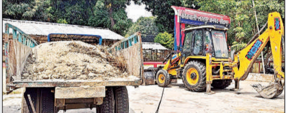
जब जेसीबी और बालू लदी ट्रैक्टर-ट्रॉली।