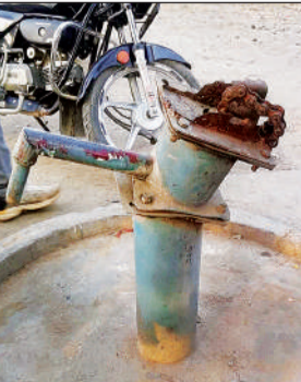
खराब हैंडपंप से गायब हटका।

पानी के लिए इधर-उधर भटकना पड़ रहा है। नगर पालिका द्वारा लगवाई गई पानी की टंकियां भी महज शोपीस बनकर रह गई हैं,