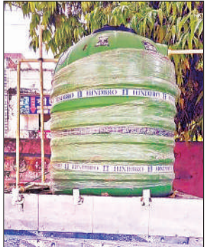
सीएचसी में रखी खाली टंकी।

सबसे चिंताजनक स्थिति सामुदायिक स्वास्थ्य केंद्र की है, जहां लगा हैंडपंप लंबे समय से खराब है। यहां आने वाले मरीजों और उनके तीमारदारों को पीने के