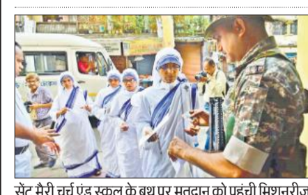
सेंट मैरी चर्च एंड स्कूल के बूथ पर मतदान को पहुंची मिशनरीज ऑफ चैरिटी की नन, उनकी जांच करते केंद्रीय बल के जवान।