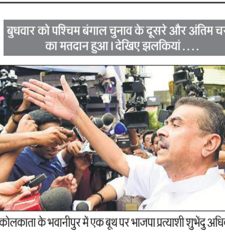
कोलकाता के भवानीपुर में एक बूथ पर भाजपा प्रत्याशी शुभेंदु अधिकारी।