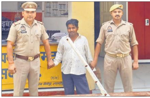
भिर्जापुर पुलिस की गिरफ्त में आरोपी पति व बरामद फावड़ा।