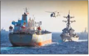
● ईरान की ओर जाने का था शक पुष्टि न होने के बाद छोड़ा

अमेरिकी मरीन सैनिकों ने इस शक के कारण अरब सागर में एक वाणिज्यिक जहाज पर धावा बोल दिया कि वह होर्मुज जलडमरूमध्य में अमेरिकी नाकाबंदी तोड़कर ईरान जा रहा था। एम/वी ब्लू स्टार 3 नाम के इस जहाज की तलाशी ली गई और बाद में यह पुष्टि होने के बाद उसे छोड़ दिया गया कि वह किसी ईरानी बंदरगाह की ओर नहीं जा रहा था। अमेरिकी सेंट्रल कमान ने मंगलवार को एक्स पर लिखा कि सुबह अरब सागर में अमेरिकी मरीन सैनिकों ने एम/वी ब्लू स्टार 3 नामक एक