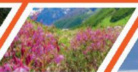
फूलों की घाटी