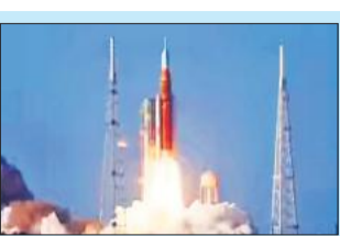
आर्टेमिस-3: चंद्रमा पर

केनवरल लाया गया। इंजीनियर अगले वर्ष आर्टेमिस-3 मिशन के दौरान पृथ्वी की कक्षा में यानों को जोड़ने (डॉकिंग) के परीक्षण की तैयारी के लिए कैस्पूल की हीट शील्ड सहित सभी प्रणालियों की विस्तार से जांच करेंगे। कैस्पूल के इलेक्ट्रॉनिक बॉक्स हटाकर दोबारा उपयोग में लाए जाएंगे, साथ ही अनुसंधान उपकरण भी निकाले जाएंगे। अमेरिका-कनाडा के चालक दल द्वारा 'इंटीग्रेटी' नाम दिया गया यह कैस्पूल अंतरिक्ष यात्रियों को अब तक मानव द्वारा तय की गई सबसे अधिक दूरी तक अंतरिक्ष में ले गया।