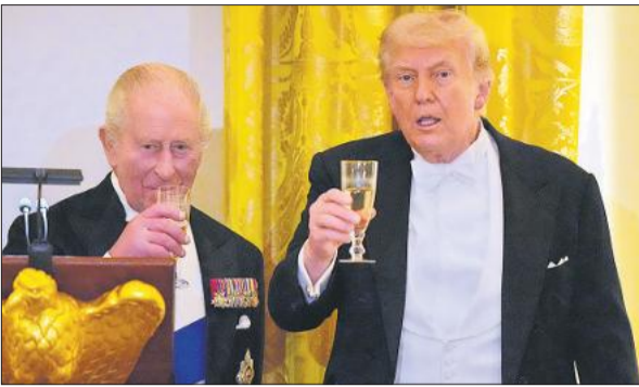
बुधवार को ट्रंप ने ब्रिटेन के राजा चार्ल्स तृतीय के साथ राजकीय रात्रिभोज किया।

अमेरिकी कानून वॉर पावर्स रिजोल्यूशन 1973 के तहत अमेरिकी राष्ट्रपति कांग्रेस की अनुमति के बिना 60 दिनों तक युद्ध छेड़ सकते हैं। इसके बाद कांग्रेस को युद्ध की मंजूरी देनी होती है वना राष्ट्रपति को सैन्य कार्रवाई समाप्त करनी पड़ती है। फिलहाल अमेरिका और ईरान के बीच युद्धविराम लागू है, लेकिन ईरानी बंदरगाहों की नाकेबंदी बनाए रखने के लिए तैनात अमेरिकी नौसैनिक बलों और जहाजों पर यह कानून लागू होगा। ऐसे में इन सवालो का जवाब तलाश माना मुश्किल साबित हो रहा है कि 60 दिनों की समयसीमा समाप्त होने के बाद