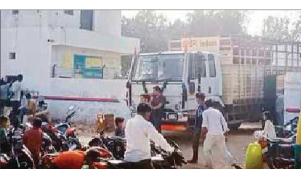
सिलेंडर के लिए एजेंसी पर खड़े ग्रामीण