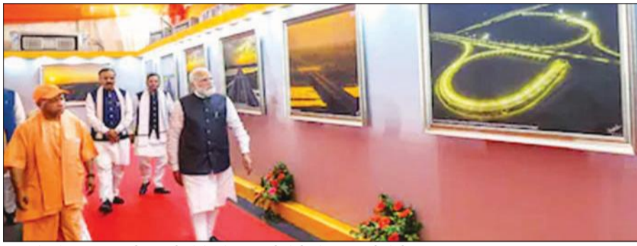
उत्तर प्रदेश के विकास संबंधी प्रदर्शनी को देखते प्रधानमंत्री मोदी और मुख्यमंत्री योगी।

योगी आदित्यनाथ ने स्वयं प्रधानमंत्री को एक्सप्रेसवे नेटवर्क की रणनीतिक उपयोगिता, कनेक्टिविटी