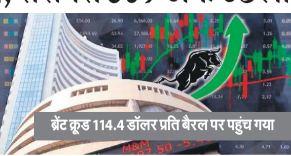
ब्रेट क्रूड 114.4 डॉलर प्रति बैरल पर पहुंच गया

एशिया के अन्य बाजारों में दक्षिण कोरिया का सूचकांक कांफसी, चीन का शंघाई कंपोजिट और हांगकांग का हैंग सेंग बढ़त के साथ बंद हुए।