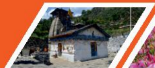
त्रियुगी नारायण मन्दिर

माण्डा गांव, व्यास गुफा और गणेश गुफा, भीमशिला, औली, फूलों की घाटी, वसुधारा जलप्रपात, चरणपादुका, तप्तकुंड, नारदकुंड, ज्योतिर्मठ (जोशीमठ), सतोपंथ झील, पाण्डुकेश्वर, आदिबदरी मन्दिर, हेमकुट साहिब