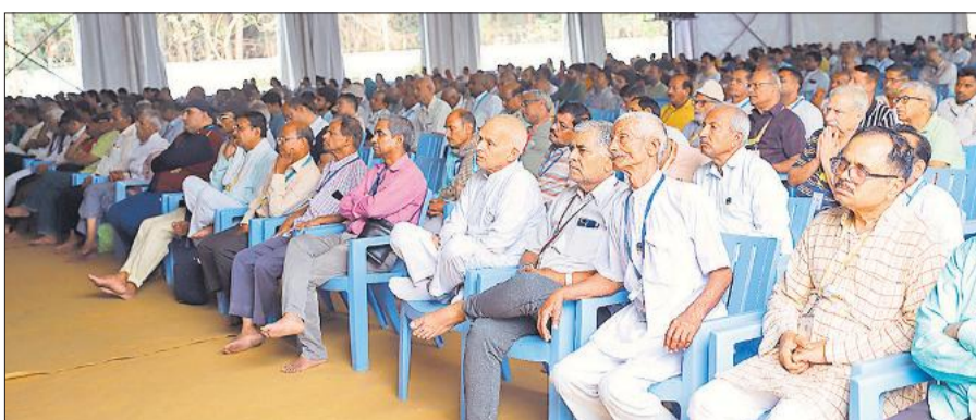
रामचन्द्र मिशन आश्रम में जयंती समारोह के दौरान सामूहिक ध्यान में लीन साधक।