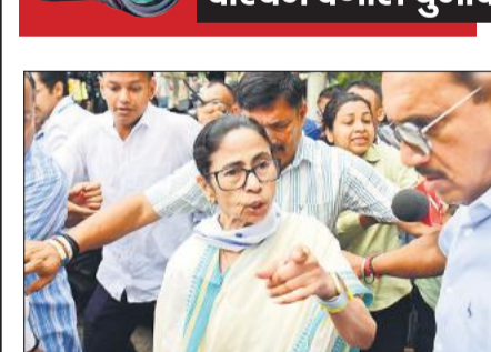
कोलकाता में अपने गृह निर्वाचन क्षेत्र भवानीपुर में एक बूथ का निरीक्षण करने पहुंची मुख्यमंत्री ममता बनर्जी।