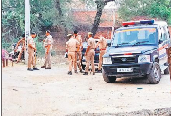
दारानगर गांव में घटना के बाद तैनात पुलिस बल।