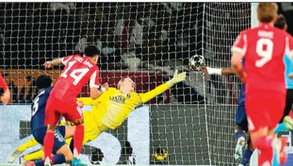
पीएसजी के खिलाफ गोल करते बायर्न के लुई ड्रियाज।

बायर्न की तरफ से हैरी केन ने 17वें मिनट में पेनल्टी पर गोल करके अपनी टीम को शुरुआती बढ़त दिलाई, लेकिन पीएसजी ने दूसरे हाफ की शुरुआत में ही 5-2 की बढ़त बना ली, जिसमें तेजतरंगी विंगर ख्विचा क्वारात्सखेलिया (24वें और 56वें मिनट) और ऑस्मान डेम्बेले (45वें और 58वें मिनट) ने दो-दो गोल किए। पीएसजी के लिए जोआओ नेवेस