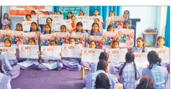
देहज प्रतिषेध दिवस कार्यक्रम में पोस्टर प्रदर्शित करती छात्राएं।