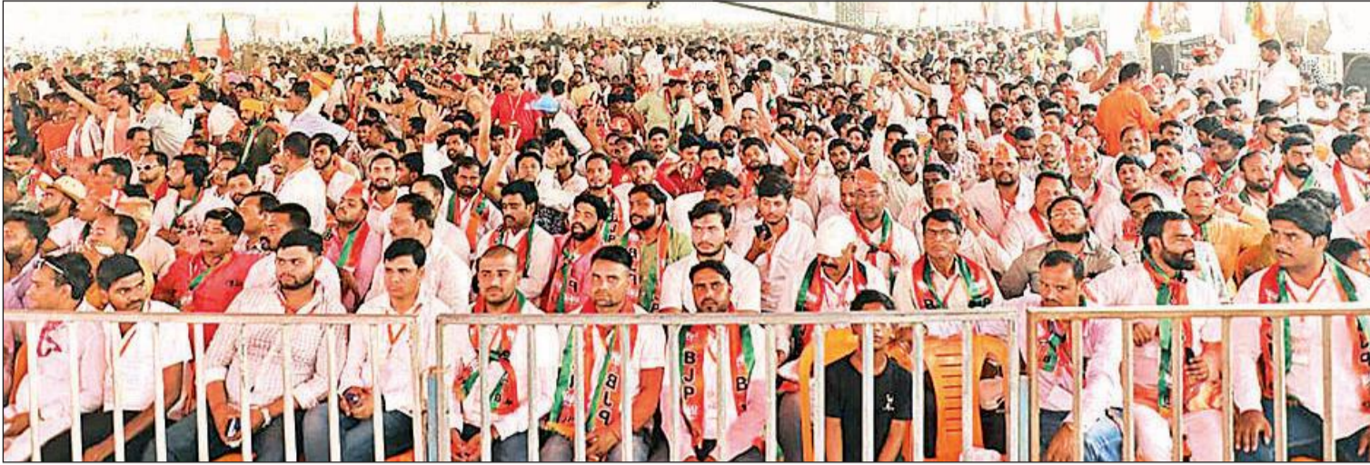
हरदोई में गंगा एक्सप्रेसवे के लोकार्पण समारोह के पंडाल में प्रधानमंत्री नरेंद्र मोदी व मुख्यमंत्री योगी को देखने के लिए भारी संख्या में पहुंची लोगों की भीड़।

कार्यक्रम स्थल का दृश्य किसी बड़े उत्सव से कम नहीं था। हर दिशा में लोगों की भीड़, हाथों में मोबाइल फोन, और चेहरों पर उत्साह हर कोई इस ऐतिहासिक