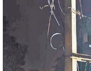
खेड़ा रट गांव में खराब पड़ा ट्रांसफार्मर।