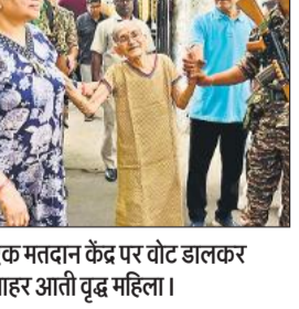
एक मतदान केंद्र पर वोट डालकर बाहर आती वृद्ध महिला।