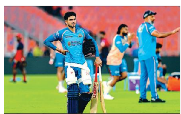
अन्यास सत्र के दौरान गुजरात टाइटंस के कप्तान शुभमन गिल।

आरसीबी की तरफ से उसके तेज गेंदबाजों भुवनेश्वर कुमार और जोश हेजलवुड ने मिलकर कहर बरपाया है। जहां भुवनेश्वर ने अपनी शानदार स्विंग से पुराने दिनों की याद दिला दी है, वहीं हेजलवुड ने टैटल मैच के स्तर की गेंदों से बल्लेबाजों को परेशान किया है। वह बल्ले के बाहरी किनारे को लक्ष्य बनाकर गेंदबाजी कर रहे हैं। इसके