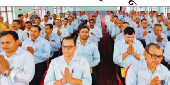
कार्यक्रम में उपस्थित स्कूल प्रधानाचार्य

की जाती है। लेकिन बेसिक स्कूलों के शिक्षकों के द्वारा ऐसा नहीं किया जा रहा। बुधवार को गंगा एक्सप्रेस वे के उद्घाटन को लेकर वीएसए ने परिषदीय स्कूलों में अवकाश घोषित कर दिया था। जिसकी जानकारी कादरचौक ब्लॉक क्षेत्र के गांव मोहम्मद गंज के बच्चों और उनके माता पिता को नहीं दी गई। जानकारी के अभाव में बच्चे स्कूल पहुंच गए और शिक्षकों का इंतजार करने लगे। घंटों इंतजार करने के बाद वह वापस लौट गए।