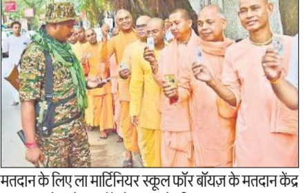
मतदान के लिए ला माटिनियर स्कूल फॉर बॉयज के मतदान केंद्र पर कतार में खड़े इस्कॉन के साधुओं की जांच करता जवान।