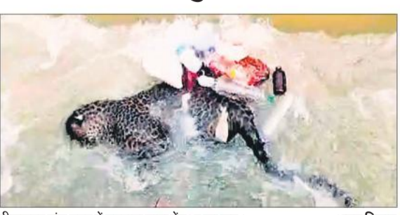
बीसलपुर ब्रांच नहर में उतराता मादा तेंदुआ का शव।

अमृत विचार : जनपद में वन्यजीवों की सुरक्षा को लेकर किए जाने वाले दावों पर एक बार फिर सवालिया निशान लगा। बुधवार सुबह बरखेड़ा क्षेत्र के अंतर्गत बीसलपुर ब्रांच नहर की झाल में एक मादा तेंदुआ का शव उतराता मिलने से इलाके में सनसनी फैल गई। तमाम ग्रामीण मौके पर इकट्ठा हो गए। सूचना पर टीम के साथ मौके पर पहुंचे डिप्टी रेंजर ने शव को नहर से बाहर निकलवाया। तीन सदस्यीय पैनल द्वारा तेंदुआ का शव का पोस्टमार्टम किया गया। मगर, पोस्टमार्टम के बाद भी तेंदुआ की मौत की वजह पता नहीं चल सकी। घटना पीलीभीत रेंज के अंतर्गत बरखेड़ा थाना क्षेत्र में बुधवार सुबह की है। गांव जाकर कल्लिया से नरयानदेर जाने वाले मार्ग पर बीसलपुर ब्रांच नहर की पलिया के पास ग्रामीणों ने पानी में एक