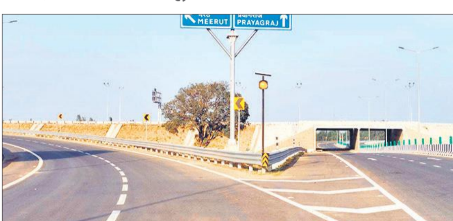
जलालाबाद क्षेत्र के पास गंगा एक्सप्रेसवे।

गंगा एक्सप्रेसवे के चालू होने से शाहजहांपुर, खासकर जलालाबाद क्षेत्र के विकास को नई गति मिलने की उम्मीद है। सड़क संपर्क बेहतर होने से स्थानीय व्यापार, कृषि उत्पादों की आवाजाही और छोटे उद्योगों को बड़ा लाभ मिलेगा। साथ ही निवेश बढ़ने और रोजगार के नए अवसर बनने की संभावना भी मजबूत हुई है। एक्सप्रेसवे के आसपास के इलाकों में जमीन की कीमतों में तेजी और नए