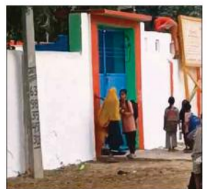
स्कूल के गेट पर खड़े बच्चे।

अक्सर देखने में आता है जब प्रशासन के द्वारा स्कूलों में अवकाश घोषित किया जाता है तो उसकी जानकारी बच्चों को नहीं मिल पाती। जबकि वर्तमान में देश भर की जानकारी सार्वजनिक हो जाती है। लेकिन परिषदीय स्कूलों के शिक्षकों के द्वारा जानकारी न देना उनकी लापरवाही को उजागर करता है। निजी स्कूलों के द्वारा बच्चों और उनके अभिभावकों का व्हाट्सएप ग्रुप बनाकर सभी जानकारीयों प्रदान