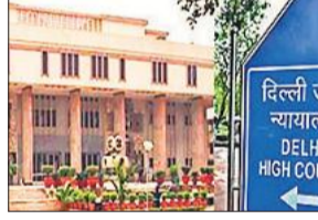
● मुख्य न्यायाधीश ने दिए रिकॉर्डिंग का प्रसारण रोकने के निर्देश