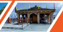
कार्तिक स्वामी मन्दिर