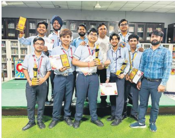
ट्रॉफी व प्रमाण पत्र के साथ विचज क्वेंचर प्रतियोगिता के विजेता।

प्रतियोगिता में कैब्रिज कॉन्वेंट, मारवाह मॉडर्न, कर्नल्स एकेडमी, सेठ एम आर