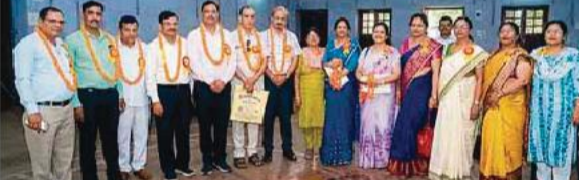
प्रधानाचार्य परिषद के मनोनीत पदाधिकारी।

नीट की परीक्षा के लिए जिले के छह कॉलेज श्री कृष्णा इंटर कॉलेज, एनएमएसएन दास डिग्री कॉलेज, पीएम श्री केंद्रीय