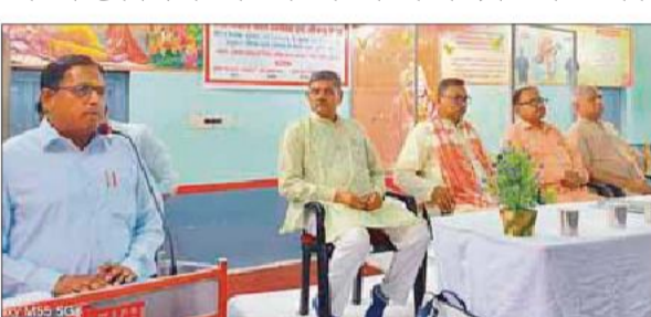
कार्यक्रम को संबोधित करते वक्ता कार्यालय संवाददाता, बदायूं