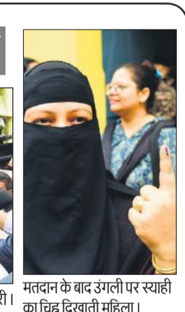
मतदान के बाद उंगली पर स्याही का चिह्न दिखाती महिला।