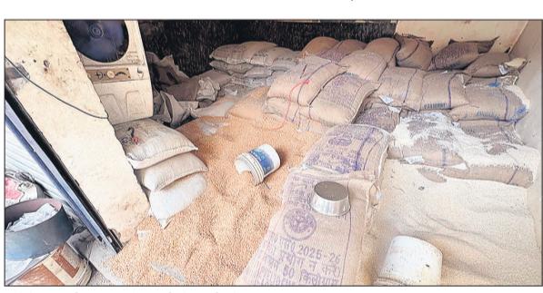
कोटेदार की दुकान में मिली गेहूँ की बोरियां।