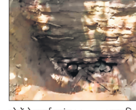
चोरों ने बनाई सुरंग।। ● अमृत विचार

उन्होंने देखा कि फिछली दीवार के पास गड्ढा खोदकर सुरंग बनाकर अंदर घुसे चोर कॉपर स्क्रेप चोरी कर ले गए। पंकज