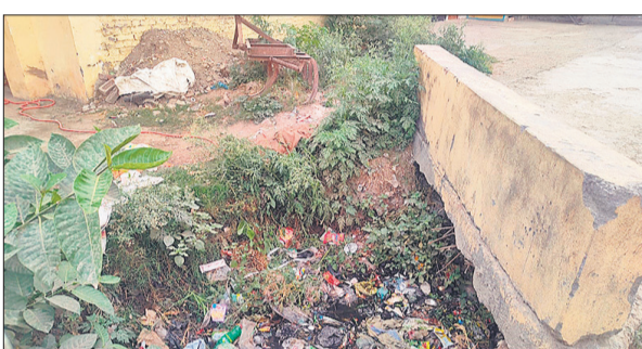
इसी नाले में मिला युवक का शव।