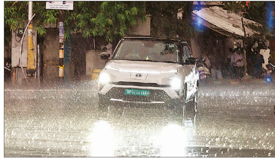
बारिश के दौरान लालबती चौराहे से हंड लाइट जलाकर निकलते चौपहिया वाहन।

के लोगों ने सूचना दी। मौके पर पहुंची दमकल टीम ने शटर के ताले तोड़कर अंदर लगी आग