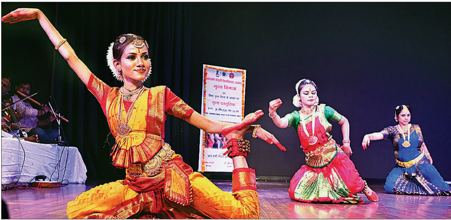
विश्व नृत्य दिवस पर भातखंडे संस्कृति विश्वविद्यालय के कलामंडपम में भरतनाट्यम प्रस्तुत करती कलाकार।