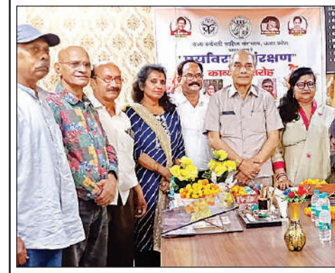
गोष्ठी के दौरान मौजूद लोग।