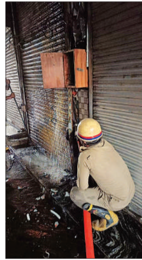
आग बुझाता दमकलकर्मी।

के लोगों ने सूचना दी। मौके पर पहुंची दमकल टीम ने शटर के ताले तोड़कर अंदर लगी आग