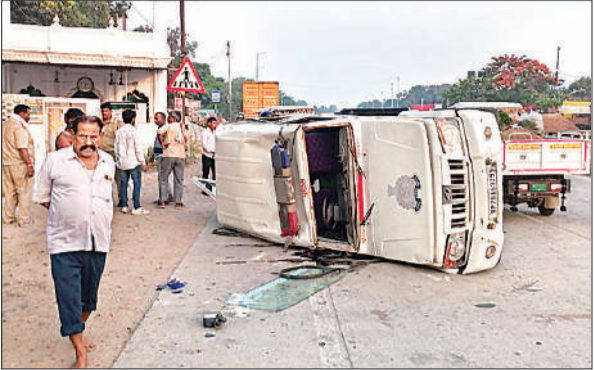
सड़क पर पलटी स्कॉर्ट गाड़ी।