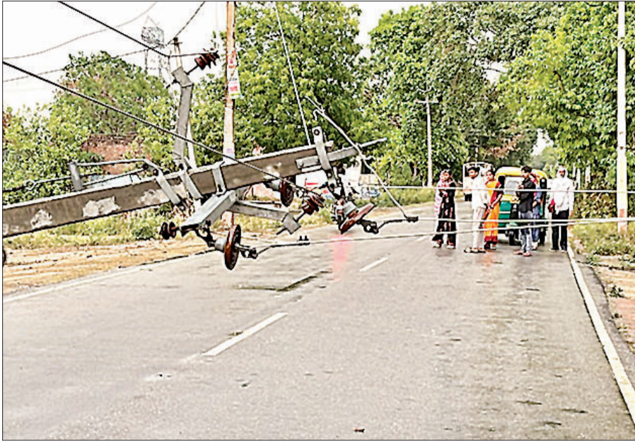
आंधी से टूटकर सड़क पर गिरा बिजली का खंभा।

आंधी से मोहनलालगंज, निगोहां, नगराम, गोसाईंगंज, सरोजनीनगर, काकोरी, रहीमाबाद और मलिहाबाद