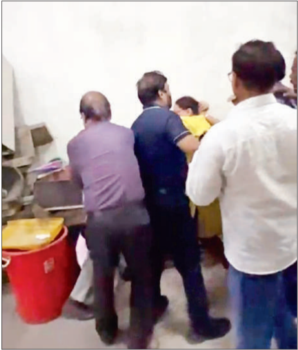
सुशांत गोल्फ सिटी स्थित ओमेक्स रेसीडेंसी सोसाइटी में मारपीट का फुटेज।