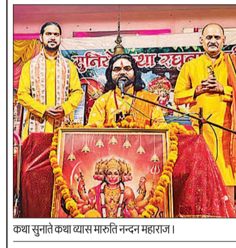
कथा सुनाते कथा व्यास मारुति नन्दन महाराज।