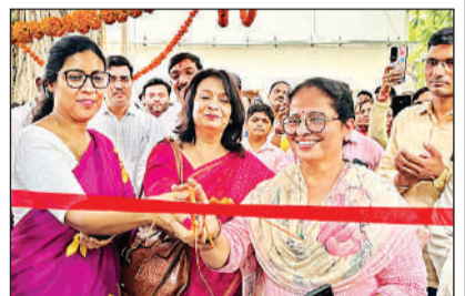
कैटीन का उद्घाटन करती मुख्य अतिथि व अन्य।