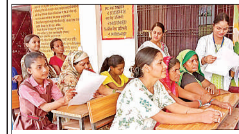
कार्यक्रम में शामिल महिलाएं और किशोरियां।