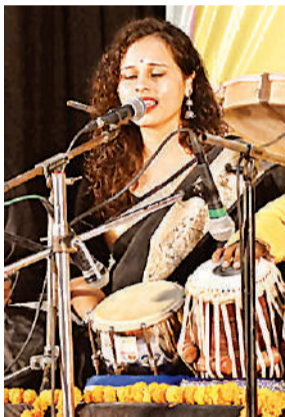
गायन प्रस्तुत करती कलाकार।