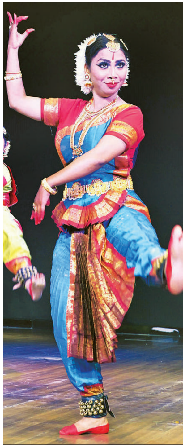
भरत नाट्यम की प्रस्तुति देती कलाकार।