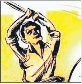
मौके