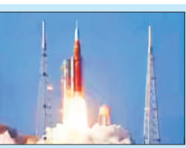
आर्टेमिस-3 : चंद्रमा पर

केनवरल लाया गया। इंजीनियर अगले वर्ष आर्टेमिस-3 मिशन के दौरान पृथ्वी की कक्षा में यानों को जोड़ने (डॉकिंग) के परीक्षण की तैयारी के लिए केप्सूल की हीट शील्ड सहित सभी प्रणालियों की विस्तार से जांच करेंगे। केप्सूल के इलेक्ट्रॉनिक बॉक्स हटाकर दोबारा उपयोग में लाए जाएंगे, साथ ही अनुसंधान उपकरण भी निकाले जाएंगे। अमेरिका-कनाडा के चालक दल द्वारा 'इंटीग्रीटी' नाम दिया गया यह केप्सूल अंतरिक्ष यात्रियों को अब तक मानव द्वारा तय की गई सबसे अधिक दूरी तक अंतरिक्ष में ले गया।