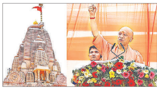
मंदिर के शिखर पर ध्वजारोहण करने के बाद लोगों को संबोधित करते सीएम योगी।

अयोध्या कार्यालय अमृत विचार: मुख्यमंत्री योगी आदित्यनाथ ने कहा कि प्रभु श्रीराम, श्रीकृष्ण और भगवान शिव भारत को जोड़ने की सबसे बड़ी शक्ति हैं। श्रीराम उत्तर-दक्षिण, श्रीकृष्ण पूर्व-पश्चिम और भगवान शंकर द्वादश ज्योतिर्लिंगों के माध्यम से पूरे देश को एक सूत्र में बांधते हैं। उन्होंने कहा कि जहां अयोध्या और राम होंगे, वहां विजय सुनिश्चित है।