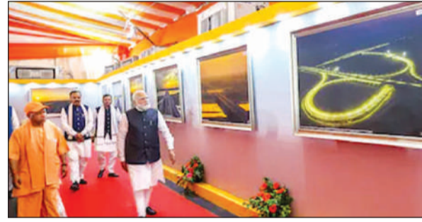
उत्तर प्रदेश के विकास संबंधी प्रदर्शनी को देखते प्रधानमंत्री मोदी और मुख्यमंत्री योगी।

योगी आदित्यनाथ ने स्वयं प्रधानमंत्री को एक्सप्रेसवे नेटवर्क की रणनीतिक उपयोगिता, कनेक्टिविटी और भविष्य की योजनाओं के बारे में विस्तार से जानकारी दी। प्रधानमंत्री