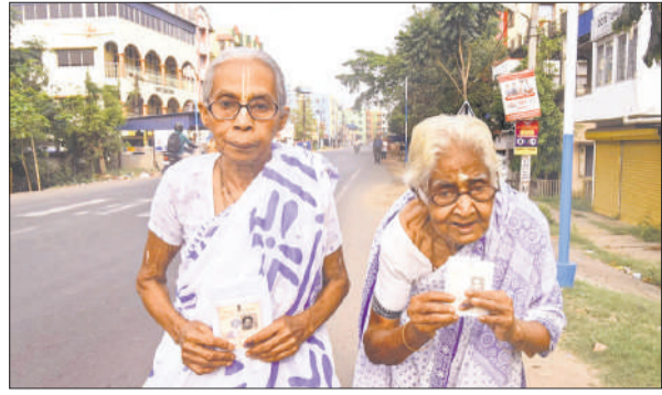
उत्तर 24 परगना जिले में मतदान के बाद अपने पहचान पत्र दिखातीं बुजुर्ग महिलाएं।