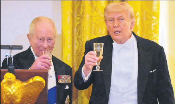
बुधवार को ट्रंप ने ब्रिटेन के राजा चार्ल्स तृतीय के साथ राजकीय रात्रिभोज किया।

अमेरिकी कानून वॉर पावर्स रिजोल्यूशन 1973 के तहत अमेरिकी राष्ट्रपति कांग्रेस की अनुमति के बिना 60 दिनों तक युद्ध छोड़ सकते हैं। इसके बाद कांग्रेस को युद्ध की मंजूरी देनी होती है वना राष्ट्रपति को सैन्य कार्रवाई समाप्त करनी पड़ती है। फिलहाल अमेरिका और ईरान के बीच युद्धविराम लागू है, लेकिन ईरानी बंदरगाहों की नाकेबंदी बनाए रखने के लिए तैनात अमेरिकी नौसैनिक बलों और जहाजों पर यह कानून लागू होगा। ऐसे में इन सवालो का जवाब तलाश माना मुश्किल साबित हो रहा है कि 60 दिनों की समयसीमा समाप्त होने के बाद