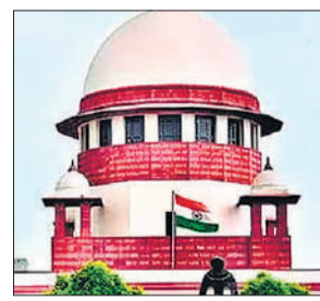
देश भर में नफरती भाषण (हेट स्पीच) पर अंकुश लगाने के लिए सुप्रीम कोर्ट ने नए दिशा-निर्देश जारी करने से साफ इनकार कर दिया है।