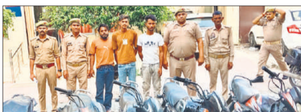
चोरी की बाइकों के साथ गिरफ्तार गैंग के सदस्य।