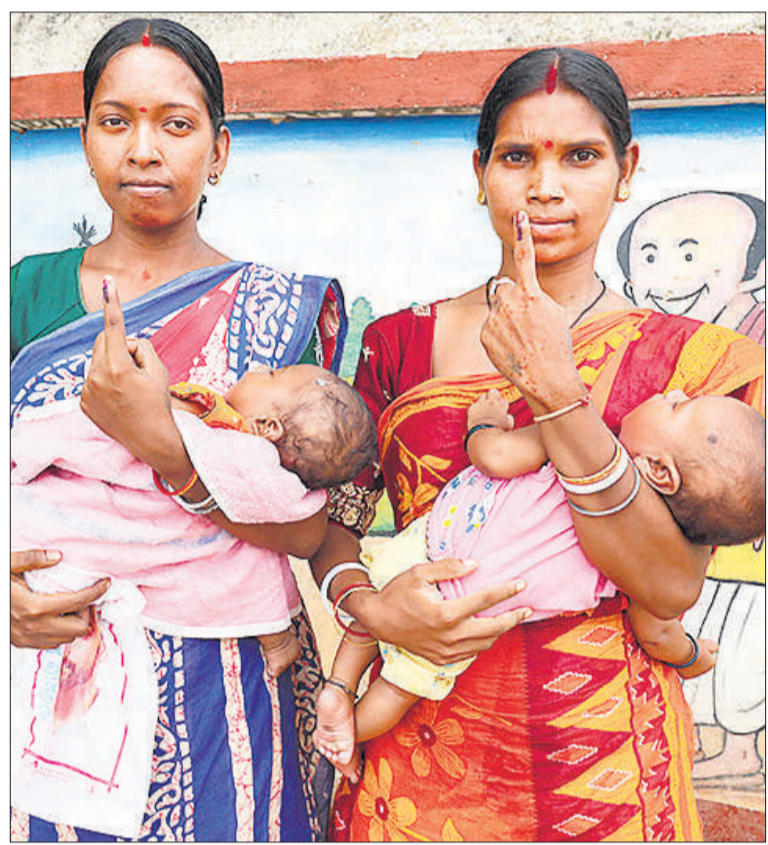
पूर्वी बर्धमान के हरगरियाडांगा में मतदान के बाद उंगली में लगी स्याही दिखातीं आदिवासी समुदाय की महिलाएं।

बर्धमान जिला 92.46 प्रतिशत मतदान के साथ शीर्ष पर रहा। निर्वाचन आयोग की ओर से जारी एक विज्ञापित में बताया गया है कि दूसरे चरण के मतदान में शाम 7.45 बजे तक 91.66 प्रतिशत मतदान दर्ज किया गया, जिससे दोनों चरणों को मिलाकर कुल मतदान प्रतिशत 92.47 प्रतिशत हो गया है। मतगणना चार मई को होगी। पश्चिम बंगाल में स्वतंत्रता के बाद मत प्रतिशत के लिहाज से यह अब तक का सबसे अधिक भागीदारी वाला विधानसभा चुनाव है। भागीदारी के विशाल पैमाने ने चुनाव के बारे में तत्काल एक राजनीतिक संदेश दिया कि मतदाता उदासीन नहीं थे। वे इतनी बड़ी संख्या में मतदान करने पहुंचे थे कि हर बात पर सवाल उठने लगे और हर दावे में राजनीतिक रंग भर गया। यदि पहले चरण में यह परखा गया कि क्या भाजपा उत्तर बंगाल में अपने गढ़ को बरकरार रख सकती है तो दूसरा और अंतिम चरण भाजपा के लिए असली लड़ाई थी कि क्या वह सत्तारूढ़ टीएमसी के दक्षिणी गढ़ कोलकाता, हावड़ा, हुगली, नादिया, उत्तर और दक्षिण 24 परगना और पूर्वी बर्धमान में संघ लगा सकती है।