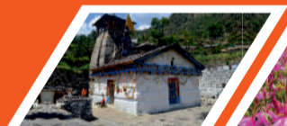
त्रियुगी नारायण मन्दिर

माण्डा गांव, व्यास गुफा और गणेश गुफा, भीमशिला, औली, फूलों की घाटी, वसुधारा जलप्रपात, चरणपादुका, तप्तकुंड, नारदकुंड, ज्योतिर्मठ (जोशीमठ), सतोपंथ झील, पाण्डुकेश्वर, आदिबदरी मन्दिर, हेमकुंड साहिब