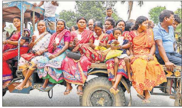
पुरबा बर्धमान जिले में मतदान केंद्र पर वोट डालने पहुंचे मतदाता।