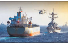
ईरान की ओर जाने का था शक पुष्टि न होने के बाद छोड़ा

अमेरिकी मरीन सैनिकों ने इस शक के कारण अरब सागर में एक वाणिज्यिक जहाज पर धावा बोल दिया कि वह होर्मुज जलजलमरुमध्य में अमेरिकी नाकाबंदी तोड़कर ईरान जा रहा था। एम/वी ब्लू स्टार 3 नाम के इस जहाज की तलाशी ली गई और बाद में यह पुष्टि होने के बाद उसे छोड़ दिया गया कि वह किसी ईरानी बंदरगाह की ओर नहीं जा रहा था। अमेरिकी सेंट्रल कमान ने मंगलवार को एक्स पर लिखा कि सुबह अरब सागर में अमेरिकी मरीन सैनिकों ने एम/वी ब्लू स्टार 3 नामक एक