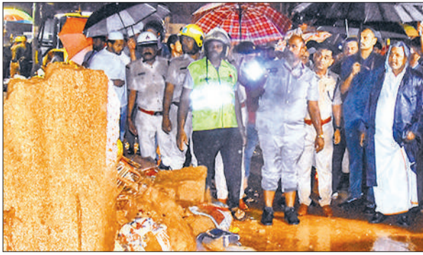
घटनास्थल का मुआयना करने पहुंचे मुख्यमंत्री सिद्धरमैया।

कर्नाटक की राजधानी बेंगलुरु में बुधवार को भारी बारिश के कारण बॉरिंग और लेडी कर्जन अस्पताल परिसर की दीवार ढहने से दो बच्चों सहित सात लोगों की मौत हो गई जबकि सात लोग घायल हो गए। मुख्यमंत्री सिद्धरमैया ने घटनास्थल का जायजा लिया और घटना की जांच का निर्देश दिया। उन्होंने इस घटना के वृहद बेंगलुरु प्राधिकरण के अफसरों को जिम्मेदार ठहराया। पुलिस ने बताया कि तेज बारिश, तूफानी हवाओं और ओलावृष्टि के कारण इलाके में भारी तबाही मची, उसी दौरान एक दीवार के अचानक गिरने से उसके पास शरण लिए हुए लोग मलबे में दब गए जिनमें से सात की मौके पर ही मौत हो गई।