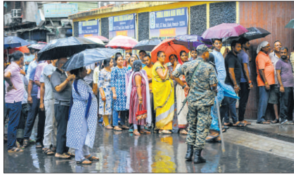
हावड़ा के एक मतदान केंद्र पर बारिश के बीच वोट डालने का इंतजार करते लोग।