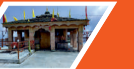
कार्तिक स्वामी मंदिर