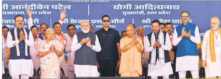
गंगा एक्सप्रेसवे के लोकार्पण अवसर पर मंच पर उपस्थित पीएम मोदी, राज्यपाल आनंदीबेन, सीएम योगी तथा अन्य।

पीएम बोले-किसानों, उद्योग व युवाओं के लिए नई लाइफलाइन, 12 जिलों में बढ़ेंगे अवसर