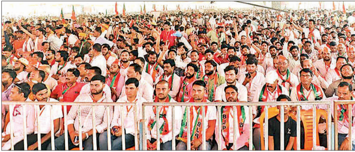
हरदोई में गंगा एक्सप्रेसवे के लोकार्पण समारोह के पंडाल में प्रधानमंत्री नरेंद्र मोदी व मुख्यमंत्री योगी को देखने के लिए भारी संख्या में पहुंची लोगों की भीड़।

कार्यक्रम स्थल का दृश्य किसी बड़े उत्सव से कम नहीं था। हर दिशा में लोगों की भीड़, हाथों में मोबाइल फोन, और चेहरों पर उत्साह हर कोई इस ऐतिहासिक