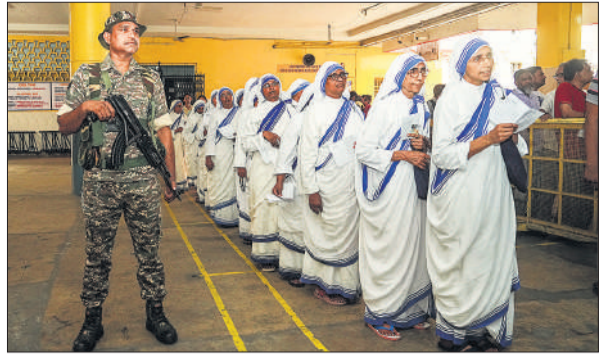
कोलकाता में वोट डालने को कतार में इंतजार करती मिशनरीज ऑफ़ चैरिटी की नर्सें।