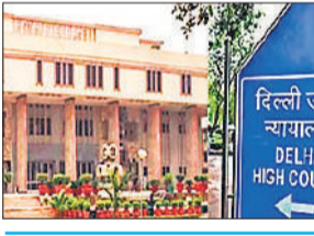
मुख्य न्यायाधीश ने दिए रिकॉर्डिंग का प्रसारण रोकने के निर्देश

पवित्रता और समग्र सत्यनिष्ठा को नुकसान पहुंचाती हैं। उन्होंने कहा, मुझे पता चला है कि दोपहर के भोजन से पहले के सत्र में एक नहीं है। इस ऑडियो में कहा जा रहा है, मीटिंग तुरंत बंद करें। आप हैक हो गए हैं। मीटिंग बंद करें। मीटिंग अभी खत्म नहीं हुई है। प्रत्येक घटना के बाद वर्चुअल मीटिंग कुछ समय के लिए रोक दी गई।