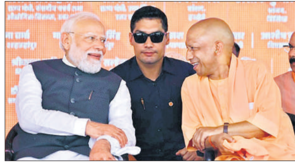
हरदोई में गंगा एक्सप्रेस-वे के लोकार्पण कार्यक्रम के दौरान पीएम मोदी और सीएम योगी।

भूमि अधिग्रहण से लेकर निर्माण तक हर चरण में समयबद्धता और पारदर्शिता सुनिश्चित की गई। उन्होंने हरदोई की पावन धरती को भगवान