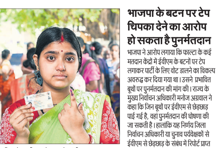
नादिया में पहली बार वोट डालने पहुंची एक मतदाता।

कोलकाता। दूसरे चरण में बुधवार को जिन 142 सीटों के लिए मतदान हुआ उनमें से टीएमसी ने 2021 में 123 सीटें जीती थीं, जबकि भाजपा को केवल 18 और आईएसएफ को एक सीट मिली थी। उत्तर और दक्षिण 24 परगना, कोलकाता और हावड़ा मिलकर बंगाल की 294 सदस्यीय विधानसभा में 91 सीट का योगदान करते हैं, जो सदन का लगभग एक तिहाई हिस्सा है। इस दक्षिणी क्षेत्र में जीत हासिल किए बिना भाजपा के लिए नबन्ना पहुंचने का कोई वास्तविक रास्ता नहीं है। टीएमसी के लिए भी गणित उतना ही स्पष्ट है: दक्षिण बंगाल में जीत हासिल कर लें तो ममता बनर्जी के लगातार चौथी बार सत्ता में आने का रास्ता खुला रहेगा। भारी मतदान ने दोनों खेमों को राजनीतिक हथियार मुहैया करा दिए। टीएमसी के लिए, इससे संकेत मिला कि भ्रष्टाचार के आरोपों, भर्ती घोटालों, सत्ता-विरोधी लहर और शासन व्यवस्था पर लगातार हमलों के बावजूद ममता बनर्जी की कल्याणकारी नीतियां, महिला केंद्रित योजनाएं और व्यक्तिगत जुड़ाव बरकरार हैं। भाजपा के लिए इसी तरह के मतदान ने सत्ताधारी शासन के खिलाफ मौन आक्रांश, टीएमसी विरोधी वोटों के एकीकरण और बदलाव के लिए संभावित जनदेश को दर्शाया।