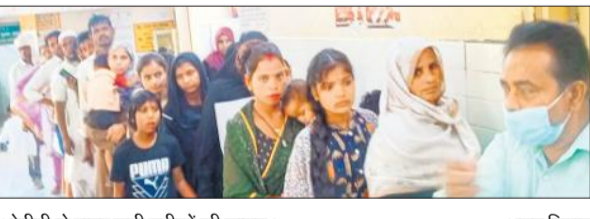
ओपीडी से बाहर लगी मरीजों की लाइन।

अमृत विचार : तेजी से बढ़ रही बीमारियों के चलते जिला अस्पताल में मरीजों की लंबी लाइन लग रही है। टाइफाइड और बुखार के मरीजों की संख्या पिछले दस दिन में दो गुनी बढ़ चुकी है जिससे डॉक्टर भी हैरान हैं। अस्पताल प्रशासन ने डॉक्टरों को निर्देशित किया है कि दो बजे से पहले ओपीडी बंद न