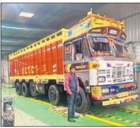
फिटनेस के लिए खड़ा ट्रक (प्रतीकात्मक)।

अमृत विचार : व्यवसायिक वाहन स्वामियों को जल्द ही बड़ी राहत मिलने वाली है। वाहनों की फिटनेस के लिए अब उन्हें बरेली के चक्कर नहीं लगाने पड़ेंगे। जिले में ही उनके वाहनों की फिटनेस होगी और प्रमाण पत्र जारी किए जाएंगे। अब तक फिटनेस कराने के लिए बरेली स्थित एटीएस (ऑटोमेटेड टेस्टिंग स्टेशन) जाना पड़ता था। अब परिवहन अधिकारी अपने स्तर से फिटनेस करके प्रमाण पत्र जारी करेंगे। जल्द ही जिले में एटीएस बनने की उम्मीद है। इसके लिए दो आवेदन भी विभाग