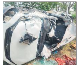
हादसे में क्षतिग्रस्त हुई कार।