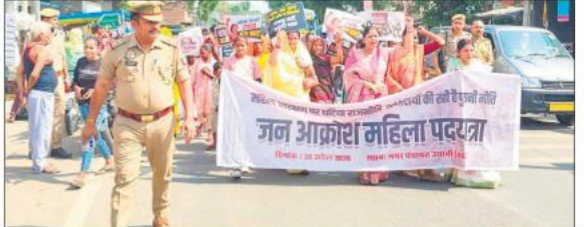
जन आक्रोश रैली निकालती महिलाएं।