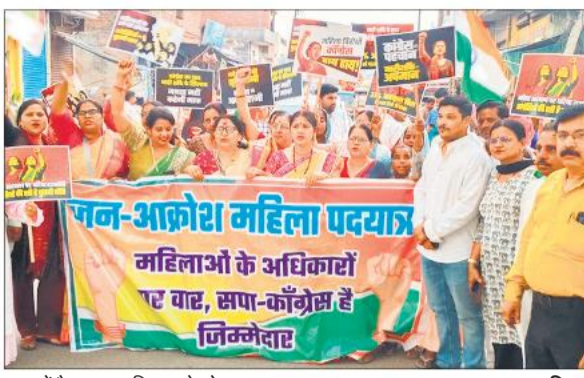
नगर में पैदल यात्रा निकालते लोग।