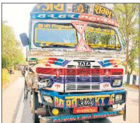
नेपाल के इसी टैंकर से हुआ हादसा।