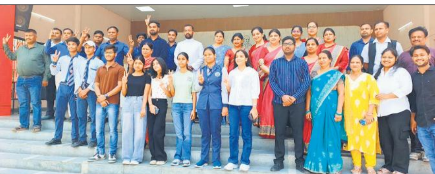
शिक्षक और माता-पिता के साथ खुशी का मनाते मेधावी विद्यार्थी।