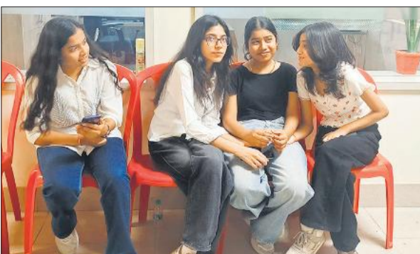
परिणाम को लेकर आपस में चर्चा करती छात्राएं।