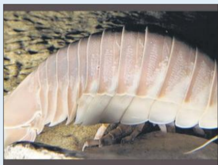
बचाता है और इसके कई पैर होते हैं, जिनकी मदद से यह समुद्र की सतह पर धीरे-धीरे चलता है। यह जीव मांसाहारी प्रवृत्ति का होता है, लेकिन खुद शिकार

विशाल आइसोपोड (Giant Isopod) समुद्र की गहराइयों में पाया जाने वाला एक बेहद अनोखा और रहस्यमय जीव है, जो देखने में जर्मन पर पाए जाने वाले कीड़ों या जूँ जैसे जीवों से मिलता-जुलता लगता है, लेकिन आकार में उनसे कहीं अधिक बड़ा होता है। सामान्यतः जहाँ स्थलीय कीट छोटे होते हैं, वहीं यह समुद्री जीव लगभग 16 इंच तक लंबा हो सकता है, जो इसे अपने वर्ग के जीवों में खास बनाता है। यह मुख्य रूप से समुद्र तल यानी डीप-सी (Deep Sea) में रहता है, जहाँ सूरज की रोशनी तक नहीं पहुंच पाती और तापमान बेहद कम होता है। इतनी कठिन परिस्थितियों में जीवित रहना ही इसे एक अद्भुत जीव बनाता है। विशाल आइसोपोड का शरीर कठोर खोल से ढका होता है, जो इसे बाहरी खतरों से