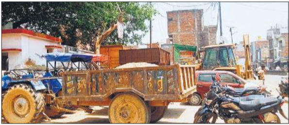
थाने पर खड़ी खनन करते पकड़ी गई ट्रैक्टर-ट्रॉली।

अमृत विचार : अवैध खनन की सूचना पर खनन अधिकारी पुलिस बल के साथ मौके पर पहुंचे। घेराबंदी करके तीन ट्रैक्टर-ट्रॉली और एक जेसीबी पकड़ी है। थाना बिनावर क्षेत्र में लंबे समय से अवैध खनन का कार्य चल रहा है। खनन करने वाले लोग रात में जेसीबी और ट्रैक्टर-ट्रॉलियों से मिट्टी ले जाते हैं। वह गांव से होकर गुजरते हैं। सुबह गांव की सड़कों पर मिट्टी बिखर हुई मिलती है। बुधवार देर रात बिनावर क्षेत्र के जंगल में खनन चल रहा था। किसी