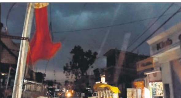
आसमान छाई काली घटाएं, चलती हवाएं।

अमृत विचार : गुरुवार को शाम को मौसम का मिजाज अचानक बदल गया। शाम करीब 6 बजे तेज धूलभरी आंधी के साथ आधा घंटे तक हल्की बारिश हुई। शाम को हवाओं के साथ हुई बारिश के बाद दिनभर की भीषण गर्मी और उमस से लोगों को बड़ी राहत मिली। दिन में दोपहर के समय तेज धूप और गर्म हवाओं के कारण बाजार और सड़कों पर सन्नाटे वाली स्थिति बनी हुई थी। शाम को बारिश के बाद लोगों ने राहत महसूस की। पिछले दो दिनों से मौसम में परिवर्तन देखा जा रहा है। बीते बुधवार की सुबह तेज हवाओं के बीच हुई बारिश के बाद शाम को उमस भरी