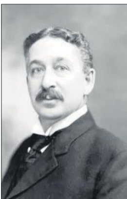
पुस्तक भी लिखी। 1932 में उनका निधन हुआ, लेकिन उनके आविष्कार ने उन्हें अमर बना दिया।

‘The Human Drift’ नामक पुस्तक भी लिखी। 1932 में उनका निधन हुआ, लेकिन उनके आविष्कार ने उन्हें अमर बना दिया।