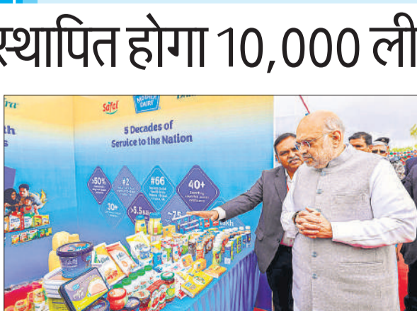
करगिल में लेह मिल्क प्लांट के नए उत्पादों के रस्टल का निरीक्षण करते अमित शाह।

10,000 लीटर प्रतिदिन क्षमता वाला आधुनिक डेयरी प्रसंस्करण संयंत्र लगभग 25 करोड़ रुपये की लागत से राष्ट्रीय डेयरी विकास बोर्ड