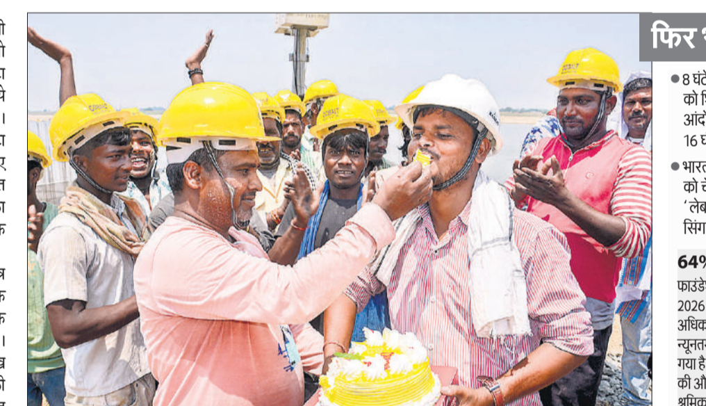
मिर्जापुर के एक कार्यक्रम पर काम कर रहे मजदूरों ने शुक्रवार को केक काटकर मजदूर दिवस मनाया।

बिजली मांग करीब 250 गीगावाट के सर्वाधिक उच्च स्तर पर पहुंच गई थी। विद्युत मंत्रालय के अनुसार, 2026 की गर्मियों में अधिकतम बिजली मांग 270 गीगावाट तक पहुंच सकती है। पिछले वर्ष गर्मियों में अधिकतम मांग जून 2025 में 242.77 गीगावाट रही थी जो सरकार के 277 गीगावाट के अनुमान से कम थी।