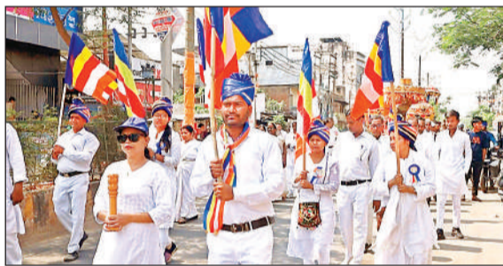
प्रभात फेरी निकालते दि बुद्धिस्त सोसाइटी के लोग।

अमृत विचार : जिले में बुद्ध पूर्णिमा का पर्व श्रद्धा, उत्साह और भक्ति के साथ मनाया गया। दि बुद्धिस्त सोसाइटी ऑफ इंडिया, उत्तर प्रदेश मध्यांचल के तत्वावधान में जिले के विभिन्न स्थानों पर बुद्ध की 2570वीं त्रिविध पावनी पूर्णिमा के अवसर पर कार्यक्रम आयोजित किए गए। इस दौरान शहर में निकाली गई प्रभात फेरी मुख्य आकर्षण का केंद्र रही, जिसमें सैकड़ों लोगों ने बहु-चहदकर हिस्सा लिया। प्रभात फेरी रेलवे स्टेशन से शुरू होकर पंचचरन्दा, दरियापुर स्थित अंबेडकर बौद्ध विहार, अंबेडकर पार्क, खैराबाद डाकखाना होते