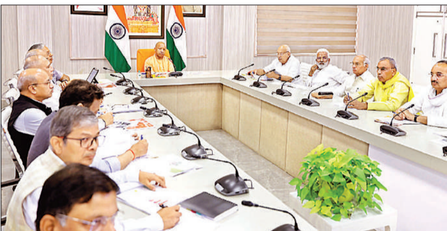
अपने आवास पर मंत्रियों और अधिकारियों के साथ उच्चस्तरीय समीक्षा बैठक करते मुख्यमंत्री योगी आदित्यनाथ।