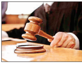
विधि संवाददाता, सुलतानपुर