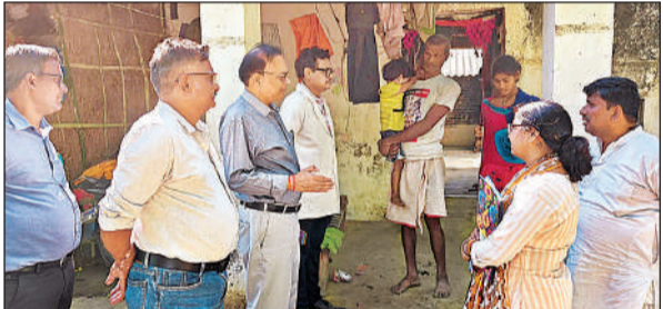
महाराजगंज तराई में पीड़ित बच्चों का हाल लेते सीएमओ और अन्य।