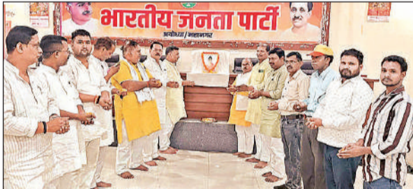
सहादतगंज स्थित भाजपा कार्यालय में भगवान बुद्ध के चित्र पर मात्पांजलि करते पदाधिकारी।