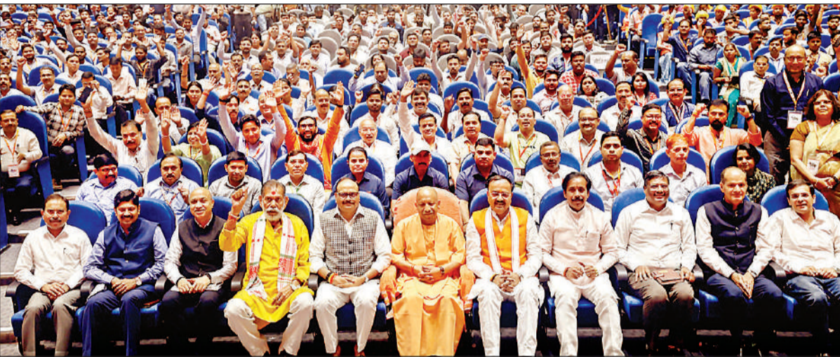
‘श्रमवीर गौरव समारोह-2026’ के दौरान श्रमिकों और उनके मेधावी बच्चों को सम्मानित करने के बाद गुगु फोटो खिंचवाते मुख्यमंत्री योगी, साथ में अन्य।

राजधानी लखनऊ के इंदिरा गांधी प्रतिष्ठान में आयोजित कार्यक्रम में मुख्यमंत्री ने उत्कृष्ट कार्य करने वाले श्रमिकों और अटल आवासीय विद्यालयों के मेधावी विद्यार्थियों को प्रमाणपत्र और टैबलेट देकर सम्मानित