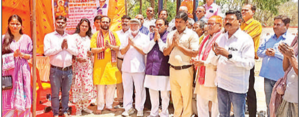
बुद्ध जयंती पर आयोजित पंचशील पाठ में शामिल लोग।

अमृत विचार: बुद्ध पूर्णिमा के पावन अवसर पर अखिल विश्व गायत्री परिवार, शांतिकुंज हरिद्वार के निर्देशन में क्षेत्र के हजारों लोगों ने अपने-अपने घरों में गायत्री महायज्ञ का आयोजन किया। "मानव में देवत्व का उदय, धरती पर स्वर्ग का अवतरण" और "विश्वव्यापी संकट निवारण" की कामना के साथ श्रद्धालुओं ने सामूहिक रूप से यज्ञ कर आहुतियां अर्पित कीं। गायत्री परिवार द्वारा वर्ष 2018 से प्रत्येक बुद्ध पूर्णिमा पर एक ही समय में करोड़ों घरों में यज्ञ की परंपरा निरंतर निभाई जा रही है। इसी क्रम