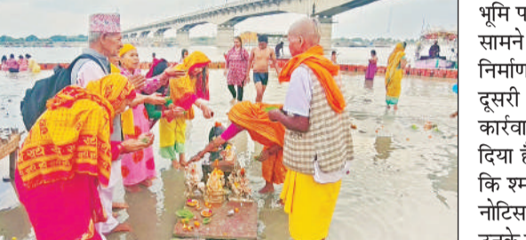
सरयू में स्नान करने के बाद घाट पर पूजन करते श्रद्धालु।