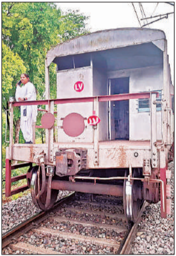
दो भागों में बंटने के बाद खड़ी मालगाड़ी।

अमृत विचार : अयोध्या-मनकापुर रेलवे ट्रैक पर शुक्रवार सुबह एक मालगाड़ी अचानक तकनीकी खराबी का शिकार हो गई। चलते समय उसके 10 डिब्बे इंजन से अलग हो गए, जिससे कुछ देर के लिए रेल संचालन प्रभावित रहा।