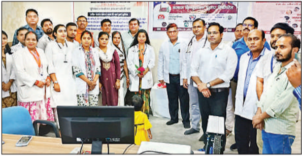
चीनी मिल में श्रमिकों का स्वास्थ्य परीक्षण करने पहुंची चिकित्सकों की टीम।

मेले में बच्चों का स्वास्थ्य परीक्षण व टीकाकरण किया गया। टीबी जांच के लिए स्क्रिनिंग तथा एक्स-रे की व्यवस्था भी की गई। चिकित्सकों की टीम ने सामान्य जांच, शुगर, ब्लड प्रेशर आदि