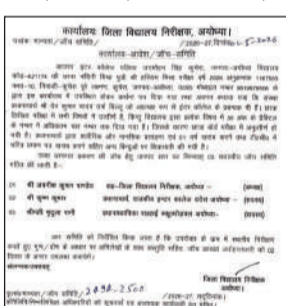
जिला विद्यालय निरीक्षक द्वारा शुक्रवार को जारी जांच कमेटी का पत्र।