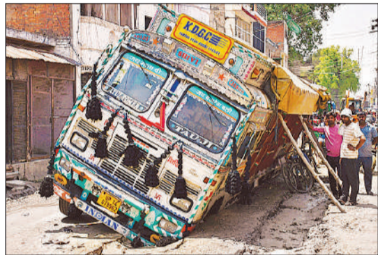
मकबरा-फतेहगंज मार्ग पर गणेशनगर के पास फंसी ट्रक।