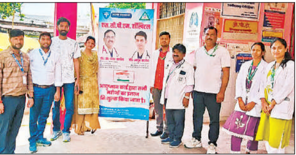
श्रमिक दिवस पर लगे स्वास्थ्य शिविर में मौजूद डॉक्टर व कर्मचारी।