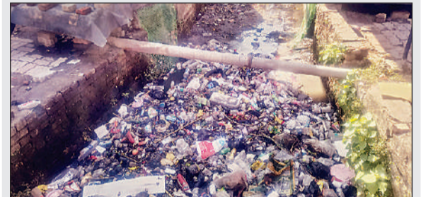
बारिश के चलते जलनिकासी न होने पर उत्तरोला नगर के नाले में भरी गंदगी।

उत्तरोला, बलरामपुर: भीषण गर्मी के बीच गुरुवार-शुक्रवार की मध्यरात्रि हुई तेज बारिश ने लोगों को बड़ी राहत दी। कई दिनों से तापमान 40-41 डिग्री सेल्सियस के आसपास बना हुआ था, जिससे जनजीवन प्रभावित था। आधी रात से शुरू हुई वर्षा सुबह तक जारी रही, जिससे मौसम सुहावना हो गया। लेकिन राहत के साथ परेशानियां भी सामने आईं। बारिश के दौरान उत्तरोला नगर व आसपास के ग्रामीण क्षेत्रों में बिजली आपूर्ति बाधित कर दी गई, जो सुबह करीब 11 बजे तक बहाल नहीं हो सकी। उमस भरी रात में बिजली न रहने से लोग रातभर जागते-जागते गुजर रहे। स्थानीय लोगों ने बताया कि क्षेत्र में बिजली कटौती की समस्या लंबे समय से बनी हुई है और विभाग इस ओर गंभीर नहीं है। वहीं बारिश के बाद नगर पालिका की सफाई व्यवस्था भी सवाल में है। कई वार्डों में नालियों की सफाई न होने से जलभराव की स्थिति बन गई है, जिससे मच्छरों का प्रकोप बढ़ रहा है। मच्छर नियंत्रण के लिए प्रभावी छिड़काव भी नहीं कराया जा रहा है। लोगों ने प्रशासन से बिजली व्यवस्था सुधारने व साफ-सफाई के लिए कदम उठाने की मांग की है।