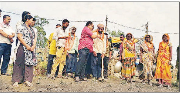
कार्यस्थल पर मजदूरों का सम्मान करते बीडीओ व अन्य। अमृत विचार