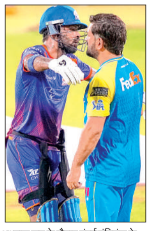
अध्यास सत्र के दौरान मुंबई इंडियंस के कप्तान हार्दिक पंड्या (बाएं) और चेन्नई सुपर किंग्स के एमएस धोनी। एजेसी

अब तक अपेक्षित प्रदर्शन नहीं करने वाली चेन्नई सुपर किंग्स (सीएसके) और मुंबई इंडियंस की टीमों के बीच इंडियन प्रीमियर लीग (आईपीएल) में शनिवार को यहां करो या मरो का मुकाबला होगा, जिसमें दोनों का लक्ष्य प्लेऑफ की दौड़ में बने रहने की उम्मीद जीवंत रखना होगा। आईपीएल इतिहास की दो सबसे सफल टीम का अब तक का अभियान निराशाजनक रहा है और वे लय हासिल करने के लिए संघर्ष कर रही हैं। सीएसके के लिए एमए चिदंबरम स्टेडियम की परिस्थितियाँ अनुकूल रही हैं लेकिन उनके प्रदर्शन में वह प्रभाव देखने को नहीं मिला है जो वर्षों से उसकी पहचान रही है।