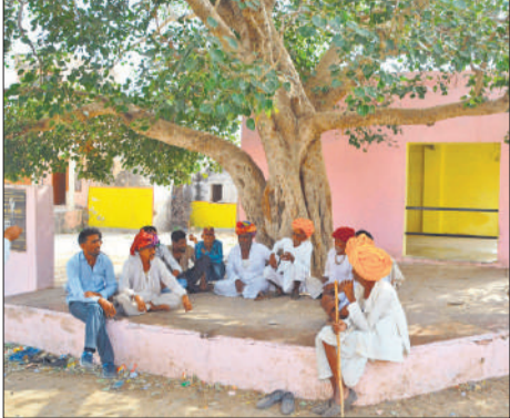
● मौके पर समाधान व लाभ वितरण, अंतिम व्यक्ति तक पहुंचाने पर जोर