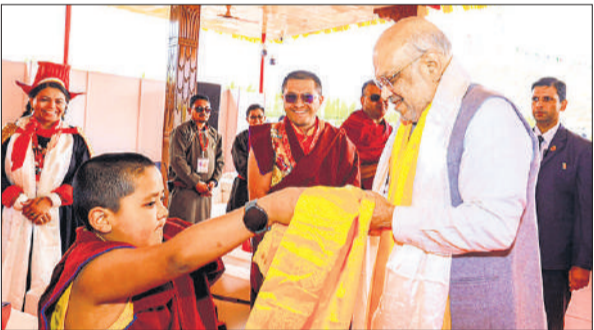
लद्दाख में बुद्ध पूर्णिमा के अवसर पर भगवान बुद्ध के पवित्र अवशेषों की पहली अंतर्राष्ट्रीय प्रदर्शनी के उद्घाटन के दौरान एक बाल भिक्षु से बातचीत करते केंद्रीय गृहमंत्री अमित शाह।

केंद्रीय गृह मंत्री अमित शाह ने भगवान बुद्ध के पवित्र अवशेषों की 75 साल बाद लद्दाख वापसी को ऐतिहासिक पुनर्मिलन बताते हुए शुक्रवार को कहा कि यह केंद्रशासित प्रदेश सदियों से धर्म की जीवंत भूमि रहा है, जिसने बौद्ध ज्ञान को सहेजा एवं पोषित किया है। शाह ने बुद्ध की शिक्षाओं की आधुनिक समय में प्रासंगिकता पर जोर देते हुए कहा कि शांति, करुणा एवं मध्यम मार्ग का संदेश 2,500 साल पहले की तुलना में आज कहीं अधिक महत्वपूर्ण है। लद्दाख के दो-दिवसीय दौरे पर आए केंद्रीय गृह मंत्री अमित शाह ने शुक्रवार को लेह में तथागत बुद्ध के पवित्र अवशेषों को दर्शनार्थ रखे जाने के कार्यक्रम और 2569वें बुद्ध पूर्णिमा समारोह का उद्घाटन किया। शाह ने उद्घाटन के बाद कहा कि लद्दाख सदियों से धर्म की जीवंत भूमि रहा है। जब दलाई लामा यहां आते हैं तो वह कहते हैं कि यह भूमि केवल भौगोलिक जमीन नहीं, बल्कि बौद्ध संस्कृति एवं करुणा की जीवंत प्रयोगशाला है। उन्होंने लद्दाख को करुणा की भूमि बताते हुए कहा कि इस भूमि ने ज्ञान को सहेजा और