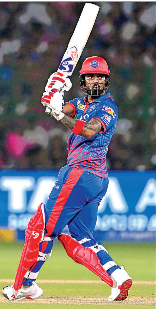
अर्धशतकीय पारी के दौरान शॉट लगाते केएल राहुल।

आईपीएल-2026 : राजस्थान रॉयल्स को सात विकेट से हराया, केएल राहुल ने खेली शानदार पारी