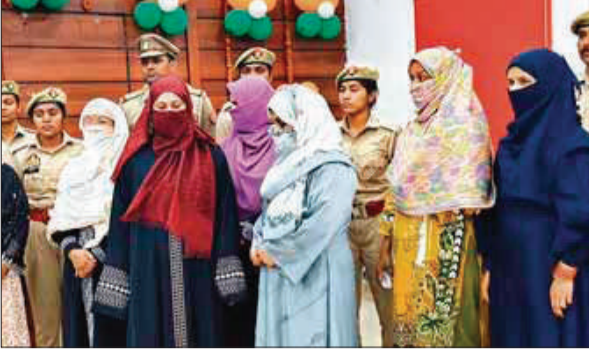
पुलिस की गिरफ्तार में आरोपी महिलाएं।