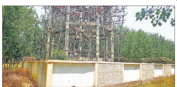
गांव बैरमनगर में अधर में लटका ओवरहेड टैंक का निर्माण।

अमृत विचार : हर घर नल, हर घर जल योजना के तहत गांव बैरमनगर में करीब तीन साल बाद भी ओवरहेड टैंक का निर्माण पूरा नहीं हो सका है। विभागीय अनदेखी के चलते घरों में टंकी का पानी नहीं पहुंच पा रहा है। ग्रामीणों के अनुसार करीब 70 फीसदी घरों में पाइप व तामा घरों में टोटियां लगा दी गई हैं, लेकिन पानी की आस अभी तक पूरी नहीं हो सकी है। ग्रामीणों को तबच्छ पेयजल मुहैया कराने के दावे कागजों में दम तोड़ रहे हैं। ऐसा नहीं है कि इसकी जानकारी विभागीय अधिकारियों को नहीं है। ग्रामीण अधिकारियों को जनप्रतिनिधियों को समस्या से अवगत करा चुके हैं मगर जिम्मेदार इस ओर ध्यान नहीं दे रहे हैं।