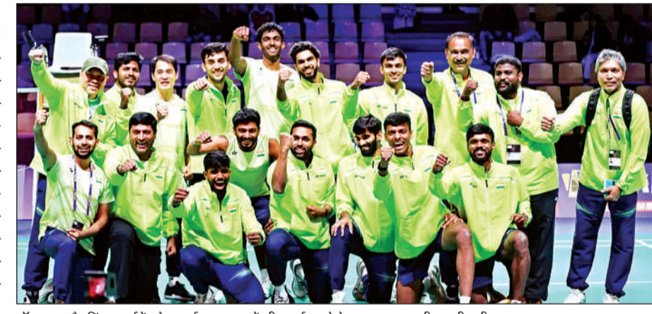
थॉमस कप बैडमिंटन टूर्नामेंट के क्वार्टर फाइनल में जीत दर्ज करने के बाद जयन मनाती भारतीय टीम।

लक्ष्य की मैच अंक से असाधारण वापसी फोरम होर्संस के कोर्ट नंबर दो पर सेमीफाइनल का पहला रबर खेलने उतरे विश्व नंबर 11 लक्ष्य ने दो मैच च्वॉइंट बचाते हुए असाधारण वापसी की और विश्व के छठे नंबर के शटलर चोट टिएन चेन को हराकर भारत को शुरुआती बढ़त दिलाई। 24 वर्षीय लक्ष्य अधिकतर समय तक पीछे चल रहे थे, लेकिन उन्होंने गजब का जुझारूपन दिखाया तथा एक घंटा 28 मिनट तक खिंची मैराथन कश्मकश में 18-21, 22-20, 21-17 से जीत दर्ज की। सात्विक-