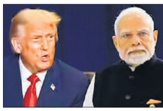
● जीटीआरआई ने किया प्रतिवाद, कहा- भारत की बौद्धिक संपदा व्यवस्था डब्ल्यूटीओ के अनुरूप

ट्रंप के इस कदम से वैश्विक अर्थव्यवस्था पर असर पड़ने की आशंका जताई जा रही है। अमेरिकी राष्ट्रपति और यूरोपीय आयोग की अध्यक्ष उर्सुला फॉन डेर लेएन के बीच पिछले साल जुलाई में व्यापार समझौता हुआ था, जिसके तहत अधिकांश वस्तुओं पर 15% शुल्क की सीमा तय की गई थी। यह शुल्क ढांचा टर्नबेरी समझौता के नाम से जाना जाता है जिसका नाम स्कॉटलैंड में ट्रंप के गोल्फ कोर्स पर रखा गया था। दोनों पक्षों ने पहले इस समझौते को बनाए रखने की प्रतिबद्धता जताई थी। हालांकि, इस वर्ष अमेरिकी सुप्रीम कोर्ट के एक फैसले के बाद इस समझौते को लेकर अनिश्चितता पैदा हो गई। शीर्ष अदालत ने कहा था कि ट्रंप के पास आर्थिक आपातकाल घोषित कर यूरोपीय संघ के उत्पादों पर शुल्क लगाने का कानूनी अधिकार नहीं है।