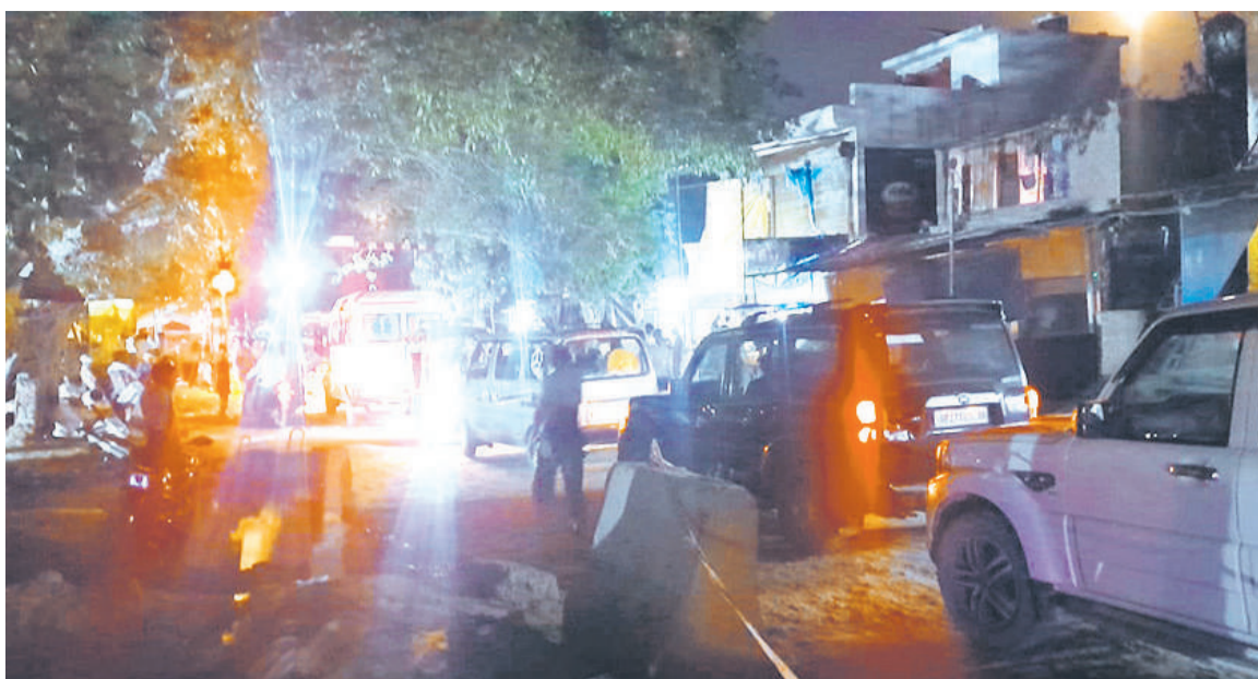
कस्बा फतेहगंज पूर्वी में दातागंज को जाने वाले मार्ग पर बिलपुर रेलवे क्रॉसिंग पर ओवर ब्रिज निर्माण के चलते शुक्रवार को जाम लग गया। काफी देर तक एंबुलेंस समेत दर्जनों वाहन फंसे रहे। लोगों को परेशानी से जूझना पड़ा। दरअसल, ओवर ब्रिज निर्माण के चलते आए दिन क्रॉसिंग पर जाम के हालात बने रहते हैं। वाहन चालकों को परेशानी से जूझना पड़ रहा है। लोगों का कहना है कि अगर पुलिस रेलवे क्रॉसिंग पर तैनात की जाए तो जाम की समस्या को काफी हद तक कम किया जा सकता है।