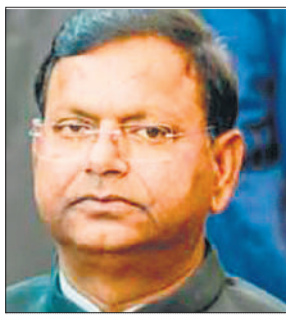
● ईडी को दी गई शक्तियां किसी को निशाना बनाने के लिए नहीं

केंद्रीय वित्त राज्य मंत्री चौधरी ने केंद्रीय एजेंसी को वित्तीय अपराधों के खिलाफ राष्ट्र की ढाल बताते हुए कहा कि यह न केवल पिछली सरकारों के भरोसे पर खरी उतरी है, बल्कि नए मानक भी स्थापित किए हैं। उन्होंने कहा कि ईडी का नाम न केवल भारत में बल्कि एफएटीएफ सहित विभिन्न वैश्विक मंचों पर भी सम्मानित है, जिसने इसकी जांच