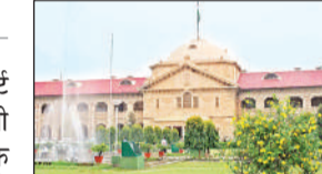
● कहा- मात्र आशंका, कल्पना या वैचारिक असहमति को आपराधिक अभियोजन का आधार नहीं बनाया जा सकता

याचिका में संभल (चंदौसी) की अदालतों के उन आदेशों को चुनौती दी गई थी, जिनमें राहुल गांधी के खिलाफ एफआईआर दर्ज कराने की मांग अस्वीकार कर दी गई थी। मामला 15 जनवरी 2025 को राहुल गांधी द्वारा दिए गए उस बयान से जुड़ा था, जिसमें कथित तौर पर कहा गया था कि उनकी “लड़ाई” एक संगठन, एक राजनीतिक दल और भारतीय राज्य