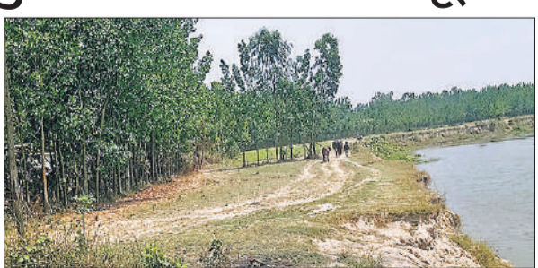
ओवरहेड टैंक के पास में बह रही किच्छा नदी।

● किच्छा नदी में बाढ़ आई तो टैंक तक पहुंच जाएगा पानी तीन सालों से ग्रामीणों को टोटियों में पानी आने का इंतजार है। वर्ष 2023 में ओवरहेड टैंक के निर्माण की शुरुआत हुई थी तो नदी का किनारा 500 मीटर दूर था मगर अब 20 मीटर रह गया है। अगर