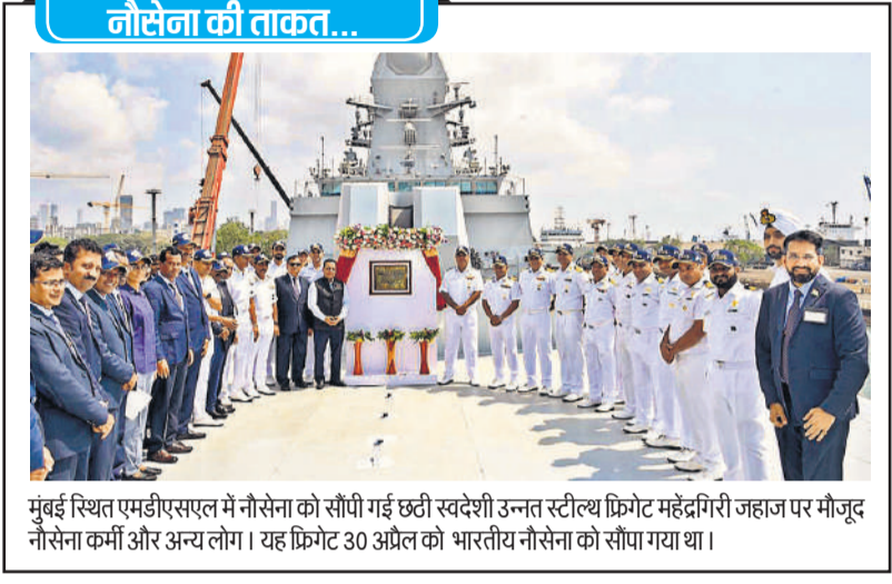
मुंबई स्थित एमडीएसएल में नौसेना को सीपी गई छटी स्वदेशी उन्नत स्टील्स फ़िग्टे महेंद्रगिरी जहाज पर मौजूद नौसेना कर्मी और अन्य लोग। यह फ़िग्टे 30 अप्रैल को भारतीय नौसेना को सौंपा गया था।

नै उनसे कहा कि वह लगभग 3.8 किग्रा वजन की ट्रॉफी को विमान में अपने साथ नहीं रख सकते। उन्होंने कहा कि मार्च में ऑस्कर जीतने के बाद से वह बिना किसी घटना के एक दर्जन से अधिक बार ट्रॉफी के साथ हवाई यात्रा कर चुके हैं। लुफ्थान्सा की उड़ान से बृहस्पतिवार सुबह जर्मनी के फ्रैंकफर्ट में पहुंचे तालाकिन ने कहा कि यह बात पूरी तरह से समझ से परे है कि वे ऑस्कर (ट्रॉफी) को हथियार कैसे मानते हैं... (मैंने) इसे अपने साथ केबिन में लेकर यात्रा की है, और कभी कोई समस्या नहीं हुई। तालाकिन को पुरस्कार को कार्गो के रूप में दर्ज करने के लिए कहा गया। अपने सामान की पहले ही जांच करा चुके फिल्म निर्माता को एयरलाइन अधिकारियों द्वारा गले का डिब्बा दिया गया, और फिर दो एजेंटों ने ऑस्कर ट्रॉफी को 'बबल रैप' में लपेटा तथा उसे परिवहन के लिए लगे गए। इस पूरी प्रक्रिया को तालाकिन ने अपने फोन में रिकॉर्ड किया। हालांकि, जब फिल्म निर्माता फ्रैंकफर्ट पहुंचे, तो वह डिब्बा कहीं नहीं मिला।