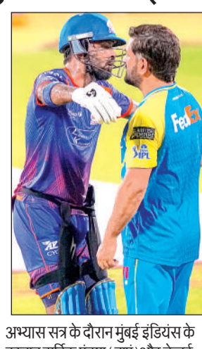
सीएसके के दौरान मुंबई इंडियंस के कप्तान हार्दिक पंड्या (बाएं) और चेन्नई सुपर किंग्स के एमएस धोनी।

सीएसके के लिए एमए चिदंबरम स्टेडियम की परिस्थितियां अनुकूल रही हैं लेकिन उनके प्रदर्शन में वह प्रभाव देखने को नहीं मिला है जो वर्षों से उसकी पहचान रही है।