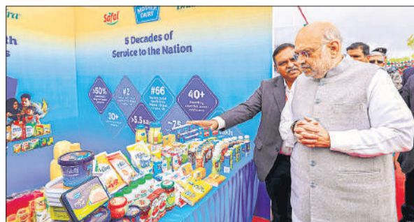
करगिल में लेह मिटक प्लांट के नए उत्पादों के स्टॉल का निरीक्षण करते अमित शाह।

केंद्रीय सहकारिता मंत्री अमित शाह ने करगिल में 10,000 लीटर प्रतिदिन क्षमता वाले डेयरी संयंत्र की शुरुआत का आधारशिला रखी। इसके साथ लद्दाख के लिए डेयरी विकास से जुड़ी कई पहल भी ऑनलाइन माध्यम से पेश कीं। इनमें मोबाइल दूध परीक्षण प्रयोगशालाएं, आधुनिक दूध शीतलन प्रणाली और डेयरी अवसंरचना को मजबूत करना शामिल है, ताकि यहां आत्मनिर्भरता को बढ़ावा मिल सके। अधिकारियों ने बताया कि