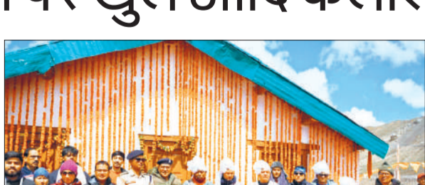
कपाट खुलने के दौरान अधिकारी, पुलिस-आईटीवीपी के जवान और जनप्रतिनिधि।