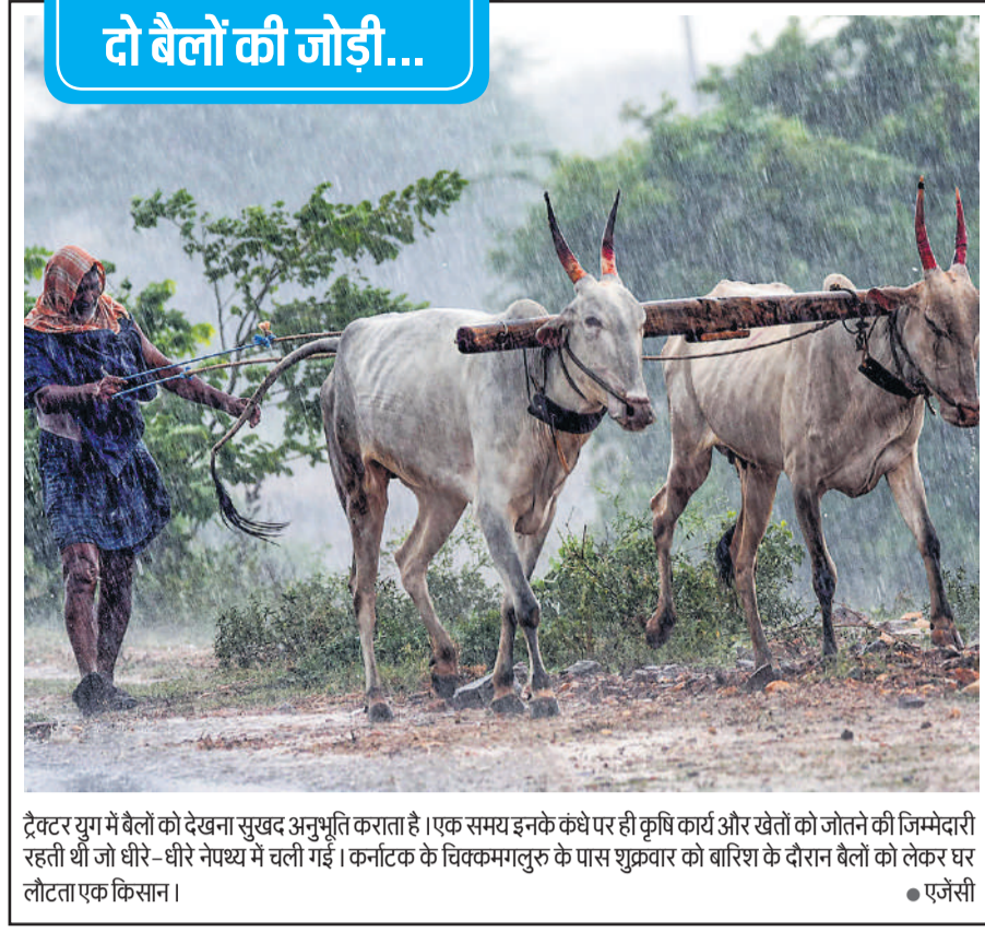
ट्रैक्टर युग में बैलों को देखना सुखद अनुभूति करता है। एक समय इनके कंधे पर ही कृषि कार्य और खेतों को जोतने की जिम्मेदारी रहती थी जो धीरे-धीरे नेपथ्य में चली गई। कर्नाटक के चिक्मगलुरु के पास शुक्रवार को बारिश के दौरान बैलों को लेकर घर लौटता एक किसान।