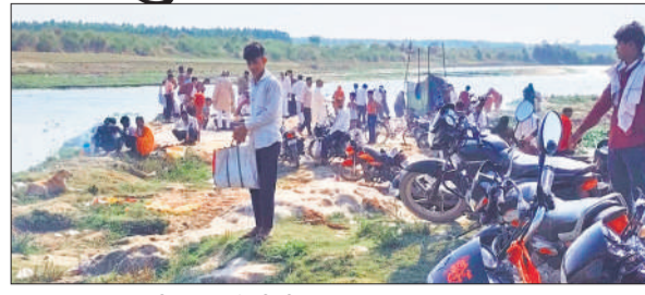
रामगंगा घाट पर जुटी श्रद्धालुओं की भीड़।

अमृत विचार : बुद्ध पूर्णिमा पर गोरा लोकनाथपुर और कपूरपुर रामगंगा घाटों पर श्रद्धालुओं की भारी भीड़ उमड़ी। शुक्रवार तड़के से ही हजारों की संख्या में लोगों ने रामगंगा में आस्था की डुबकी लगाई और पुण्य लाभ अर्जित किया। रामगंगा घाटों पर सुबह से ही श्रद्धालुओं का आना-जाना लगा रहा। स्नान के बाद लोगों ने विधि-विधान से पूजा-अर्चना की और प्रसाद वितरित किया। घाटों के किनारे पूजा सामग्री की दुकानें सजी थीं, जहां बच्चों ने मेलों और झूलों का आनंद लिया। कई परिवारों ने बच्चों के मुंडन और अन्य धार्मिक संस्कार भी संपन्न कराए। जिला प्रशासन और पुलिस बल पूरी तरह मुस्तैद रहा। मुख्य स्थानों पर