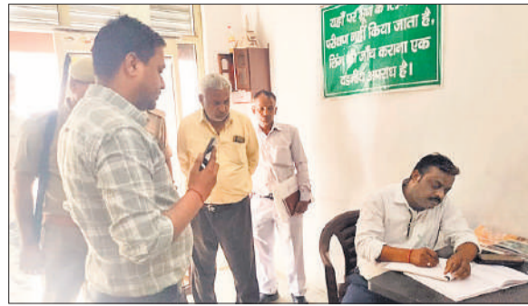
शीशगढ़ में अल्ट्रासाउंड सेंटर का निरीक्षण करते एसडीएम।