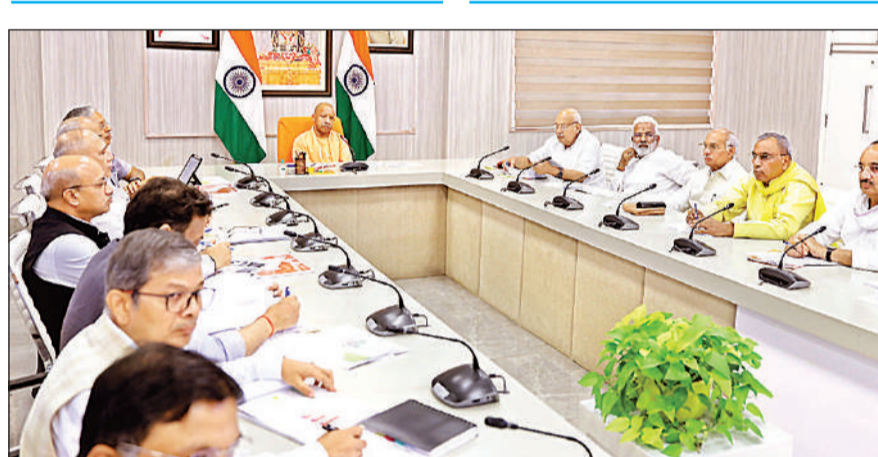
अपने आवास पर मंत्रियों और अधिकारियों के साथ उच्चस्तरीय समीक्षा बैठक करते मुख्यमंत्री योगी आदित्यनाथ।

● किसानों के हित सर्वोपरि, टेल एंड तक पानी पहुंचाने और वैकल्पिक इंतजाम पुख्ता करने पर जोर