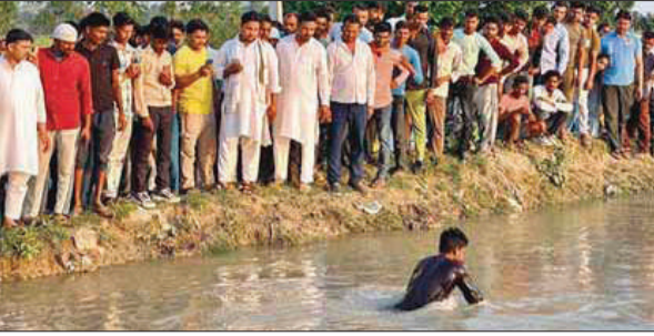
हादसे के बाद नहर के पास लगी भीड़।

बीसलपुर रजवाहा नहर में नहाते वक्त डूबकर दो दोस्तों की मौत