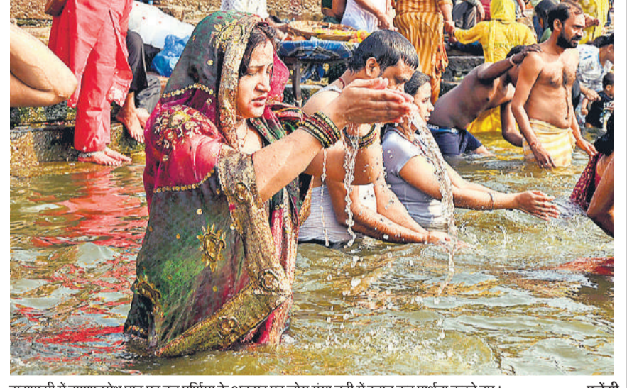
वाराणसी में दशरथवध घाट पर बुद्ध पूर्णिमा के अवसर पर लोग गंगा नदी में स्नान कर प्रार्थना करते हुए।