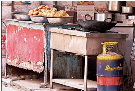
चाय-नाश्ते की दुकान पर रखा कमर्शियल सिलेंडर।

शनिवार से ज्येष्ठ माह भी शुरू हो रहा है। इस शहर में ज्येष्ठ के मंगलवार को भंडारे होते हैं। इस बार तो आठ मंगलवार हैं। कमर्शियल सिलेंडरों के दाम बढ़ने का असर भंडारों पर भी पड़ेगा। इसके अलावा कम्प्यूटरी किचन और नियमित चलने वाले भंडारे में प्रभावित होने की आशंका है। लोगों का कहना है कि यदि जल्द ही गैस सिलेंडर की आपूर्ति बहाल नहीं हुई तो कम्प्यूटरी किचन और भंडारा सेवाओं पर संकट और गहरा सकता है, जिससे गरीब और जरूरतमंद लोगों को सबसे ज्यादा