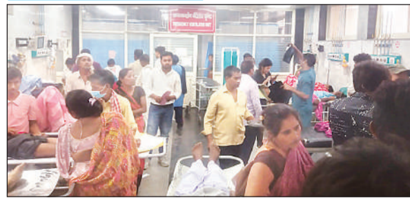
केजीएमयू के ट्रॉमा सेंटर के कैजुअल्टी वार्ड में मरीजों की भीड़।

● 42 बेड कैजुअल्टी वार्ड के ज्यादातर समय भर रहे हैं