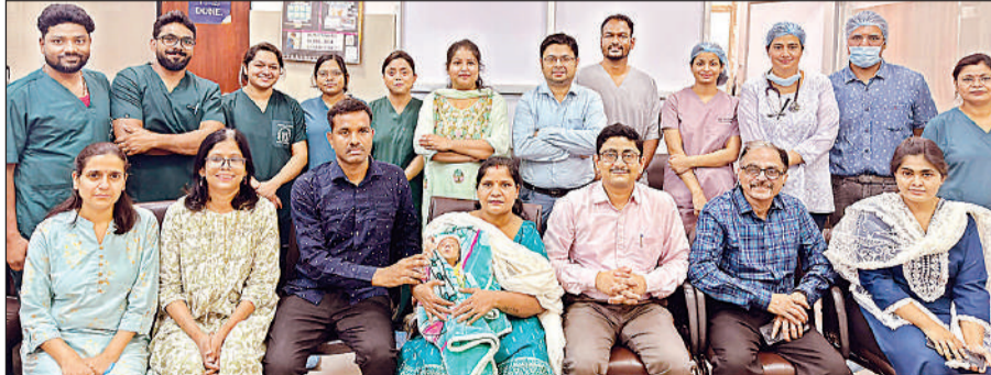
बच्चे के साथ माता-पिता और चिकित्सकों की टीम।