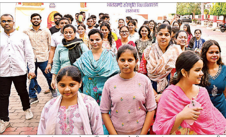
गुजरात स्थापना दिवस पर हनुमंत धाम हनुमान सेतु तक मंदिर दर्शन पर यात्रा में शामिल छात्र छात्राएं।