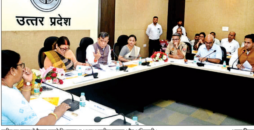
नवीन सभागा में बैठक करते विधानसभा अध्यक्ष सतीश महाना और अधिकारी।

शनिवार को सरसैया घाट स्थित नवीन सभागा में कानपुर के इंफ्रास्ट्रक्चर की विकास गति की रफ्तार को और तेज करने पर विचार विमर्श किया गया। इस बैठक में जन प्रतिनिधियों एवं सभी विभागों के अधिकारियों ने कई अहम फैसले लिये। अधिकारियों ने बैठक में यातायात प्रबंधन को प्राथमिकता देते हुए आईटीबीपी नरवल मोड़ पर अंडरपास निर्माण करने एवं जाजमऊ से एयरपोर्ट तक सड़क को जाम मुक्त बनाने तथा शहर के प्रमुख मार्गों को व्यवस्थित करने पर जोर दिया गया। एयरपोर्ट के वैकल्पिक मार्ग को भी सुव्यवस्थित