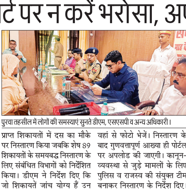
पुरवा तहसील में लोगों की समस्याएं सुनते डीएम, एसएसपी व अन्य अधिकारी।