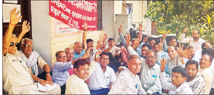
डीआईओएस कार्यालय के बाहर धरना देते शिक्षक संघ के पदाधिकारी।