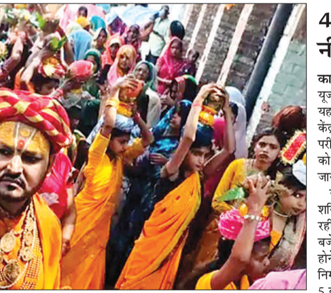
शनिवार को कथा शुरू होने से पहले कलश यात्रा निकाली गई, जिसमें श्रद्धालु महिलाएं शामिल हुईं। अमृत विचार

43 केंद्रों पर होगी नीट यूजी परीक्षा कानपुर। शहर में रविवार को नीट यूजी परीक्षा आयोजित की जाएगी। यह परीक्षा शहर के 43 परीक्षा केंद्र में होगी। परीक्षा में 21843 परीक्षार्थी शामिल हो रहे हैं। शनिवार को परीक्षा केंद्रों का अंतिम सुरक्षा जायजा लिया गया। नीटयूजी की परीक्षा के लिए शनिवार देर रात तक तैयारी होती रही। यह परीक्षा दोपहर को 2 बजे शुरू होगी। एक पाली में होने वाली परीक्षा सीसीटीवी की निगरानी में कराया जाएगा। शाम 5 बजे तक चलने वाली परीक्षा के लिए पुलिस बल सुरक्षा के लिए लगाया गया है। बताया गया कि कड़ी सुरक्षा व्यवस्था के बीच प्रश्न पत्रों को केंद्र तक पहुंचाया जाएगा। इसके लिए परीक्षा देने आने वाले परीक्षार्थियों को भी सुरक्षा के बीच होकर कक्ष तक जाने को मिलेगा। यह परीक्षा शहर के एसएन सेन बालिका विद्यालय, श्रीकेशनाथ नाथ बालिका विद्यालय, कानपुर कन्या महाविद्यालय इंटर कॉलेज, एलपी इंटर कॉलेज, महिला महाविद्यालय, जीएनके इंटर कॉलेज, बीएनडी कॉलेज, जीआईसी चुन्नीगंज सहित अन्य परीक्षा केंद्रों पर होगी।