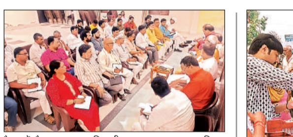
बैठक में मौजूद भाजपा पदाधिकारी। अमृत विचार

इससे नदी के किनारे गिट्टियों के ढेर लग गए हैं और आसपास जंग, धूल व मिट्टी फैल गई है। स्थानीय लोगों का कहना है कि इस तरह की गतिविधियों से गंगा का पानी प्रदूषित हो रहा है, जिससे जलीय जीवों पर भी प्रतिकूल प्रभाव पड़ सकता है। हैरानी की बात यह है कि यह सब कार्य अधिकारियों की मौजूदगी में हो रहा है, लेकिन रोकथाम के लिए कोई ठोस कदम नहीं उठाए जा रहे। गौरतलब है कि सरकार गंगा को स्वच्छ और अखिल बनाने के लिए लगातार अभियान चला रही है, लेकिन विभागीय लापरवाही इन प्रयासों को कमजोर कर रही है। स्थानीय लोगों ने संबंधित अधिकारियों से इस पर तत्काल रोक लगाने और जिम्मेदारों के खिलाफ कार्रवाई की मांग की है।