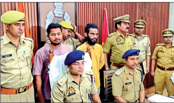
आरोपियों को गिरफ्तार करने के बाद खुलासा करते डीसीपी पूर्वी। अमृत विचार

● पकड़े गए दोनों साथियों ने उगला सच, पुलिस ने दोनों को भेजा जेल