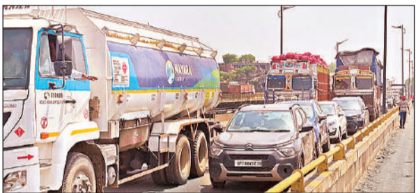
हाईवे पर जाम में फंसे बड़े वाहन।

अमृत विचार। शनिवार को एनएचआई द्वारा जाजमऊ पुल पर कराए गए पैचवर्क के चलते लखनऊ-कानपुर हाईवे पर दोनों लेन में भीषण जाम लग गया। सुबह लखनऊ से कानपुर जाने वाली लेन पर काम शुरू होते ही आधी सड़क धिर गई। इससे बड़े वाहनों की आवाजाही बाधित हुई और लंबा जाम लग गया। यह स्थिति सुबह करीब नौ बजे से साढ़े दस बजे तक बनी रही। दोपहर में कानपुर से लखनऊ की लेन पर भी पैचवर्क शुरू होने से यातायात फिर