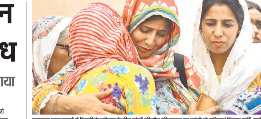
जबलपुर कूज हादसे में दिल्ली के परिवार के तीन लोगों की मौत की सूचना घर पहुंची तो महिलाएं बिलख पड़ीं, उन्हें संभालती और ढांडस बंधती आस-पड़ोस की महिलाएं।