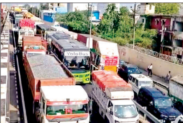
हादसे के बाद हाईवे पर लंबा जाम लगा रहा।

● क्रेन से दोनों डंपरों को अलग करने के बाद शव निकाले