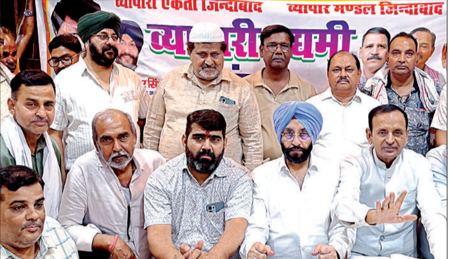
सड़क से जुड़े नक्शा के मुद्दे को लेकर भारतीय उद्योग व्यापार प्रतिनिधिमंडल ने संवाद किया। अमृत विचार

अदानी डिफेंस एंड एयरोस्पेस की डिफेंस कॉरिडोर साइड स्थित फैक्ट्री में मिसाइल का उत्पादन शुरू करने की तैयारियां चल रही हैं। अभी फैक्ट्री में विभिन्न प्रकार की बंदूकों की गोलियों का उत्पादन हो रहा है। मिसाइल उत्पादन के लिए फैक्ट्री में अलग कॉम्प्लेक्स का निर्माण कार्य चल रहा है। कंपनी का लक्ष्य अगले साल तक मिसाइल का उत्पादन शुरू करने का है। पिछले साल पाकिस्तान के साथ हुए आपरेशन सिंदूर के दौरान मिसाइल और ड्रोन की महत्ता साबित हुई थी। मिसाइल से दुश्मन देश की सीमा पार किए बिना लक्ष्यों को निशाना बनाया जा सकता है। आपरेशन सिंदूर में अदानी डिफेंस एंड एयरोस्पेस में तैयार कई उपकरणों का इस्तेमाल हुआ था।