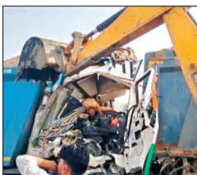
हाईवे से डंपर को क्रेन से हटाया गया।