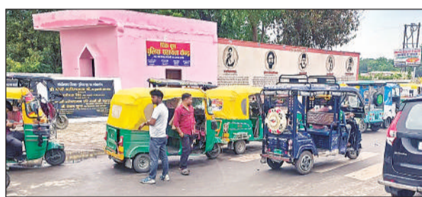
चौराहे पर फैली आँटों व टैपो चालकों की अराजकता। अमृत विचार

दोपहर 12 बजे नवीन पुल पर वाहनों का दबाव अचानक बढ़ा। जिससे पुल से फोरलेन तक जाम लग गया। यातायात व कोतवाली पुलिस ने मशकत कर आड़े-तिरछे खड़े वाहनों को व्यवस्थित कराया। इसके बाद डेढ़ बजे यातायात धीरे-धीरे सुचारु हो सका। ट्रेक्टर फंसने से फोरलेन ठप: ऋषि नगर के पास नगर पालिका का ट्रेक्टर फंसने से फोरलेन पर जाम लग गया। पीछे से आ रहे वाहन रुक गए और स्थिति बिगड़ गई। बाद में ट्रेक्टर-ट्रॉली हटाने के बाद यातायात सामान्य हो पाया।