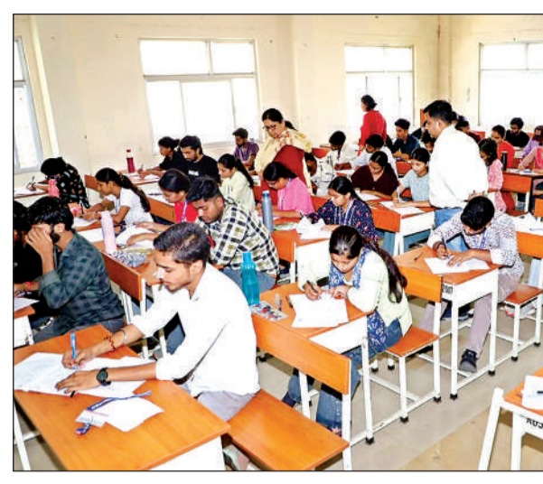
शनिवार को परीक्षा देते छात्र-छात्राएं।

बोलने और सुनने में कठिनाईवाले मरीजों के लिए वरदान परियोजना पूर्ण होने पर उत्तर भारत के मरीजों और विद्यार्थियों को इन सुविधाओं के लिए दूर नहीं जाना पड़ेगा। अब तक जिन सेवाओं के लिए मैसूर का रुख करना पड़ता था, वे सुविधाएं क्षेत्रीय स्तर पर ही उपलब्ध होंगी, जिससे उपचार और प्रशिक्षण की पहुंच अधिक सुलभ हो सकेगी।