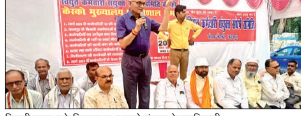
बिजली व्यवस्था के खिलाफ सभा करते संगठन के पदाधिकारी।

अमृत विचार। सिविल लाइंस स्थित केस्को मुख्यालय में शनिवार को विद्युत कर्मचारी संयुक्त संघर्ष समिति, उत्तर प्रदेश के बैनर तले बिजली कर्मियों ने सभा का आयोजन किया, जिसमें केस्को डिस्कोम से आए कर्मचारियों और अभियंताओं ने पावर कॉरपोरेशन के शीर्ष प्रबंधन के खिलाफ आक्रोश व्यक्त कर कहा कि यदि प्रबंधन बिजली व्यवस्था संभालने में अक्षम है तो नैतिक जिम्मेदारी लेते हुए तत्काल पद छोड़ दें। वहीं, गोविंद नगर मुख्यालय और पनकी ताप