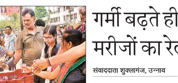
महावीर मंदिर के बाहर बांटा गया शर्बत।