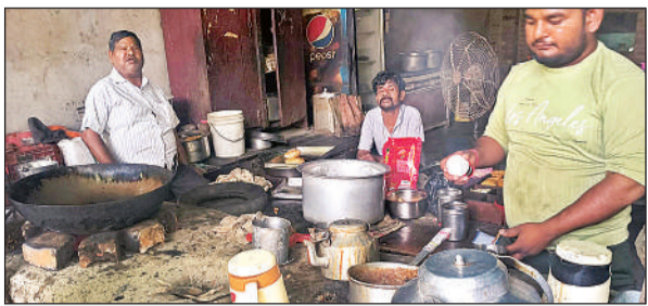
कोयले की भट्टी में चाय व पूड़ी बनाते दुकानदार। अमृत विचार

होटलों व ढाबों पर मिलने वाली साधारण थाली की कीमतों में फिर से बढ़ोतरी तय मानी जा रही है। इससे आम आदमी का दैनिक बजट पूरी तरह चरमरा गया है। कामशियल एलपीजी सिलेंडर के दाम बढ़ोतरी होने से लोगों को काफी कठिनाइयों का सामना करना पड़ रहा है। इसके साथ ही बड़े सिलेंडर के साथ-साथ पांच किलो वाले छोटे सिलेंडरों की दरों में भी वृद्धि की गई है। छोटे सिलेंडर की कीमत 549 से बढ़ाकर 815 रुपये के आसपास हो गई है। यह वृद्धि उन रेहड़ी-पट्टरी वालों के लिए बड़ी मुसीबत है जो अपनी जीविका के लिए पूरी तरह इन सिलेंडरों पर निर्भर हैं।