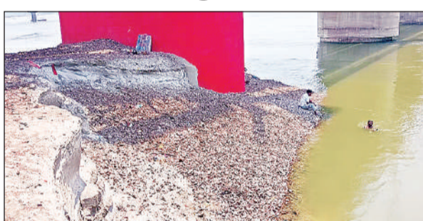
गंगा नदी के निकट फैली गंदगी और लगा गिट्टियों का ढेर। अमृत विचार

अमृत विचार। एक ओर केंद्र व राज्य सरकार गंगा सफाई अभियान पर करोड़ों खर्च कर रही हैं। वहीं दूसरी ओर रेलवे की लापरवाही इस प्रयास पर सवाल खड़े कर रही है। शनिवार को गंगा रेलवे ब्रिज पर एचबीम स्लीपर लगाते समय ट्रैक व स्लीपर के बीच पड़ी गिट्टियों व कचरा खुलेआम गंगा नदी में फेंका गया। जानकारी के अनुसार ब्रिज पर एचबीम स्लीपर डालने के लिये ट्रैक की सफाई व गिट्टी हटाने का कार्य हो रहा है। लेकिन हटाई गई सामग्री के निस्तारण की कोई व्यवस्था नहीं की गई। ऐसे में सफाई कार्य में लगे कर्मचारी गिट्टियों और गंदगी को सोधे गंगा में डाल रहे हैं।