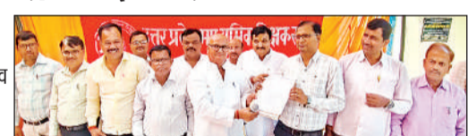
शिक्षा भवन में आयोजित धरने के दौरान डीआईएस के प्रतिनिधि को ज्ञापन देते माध्यमिक शिक्षक संघ के पदाधिकारी।