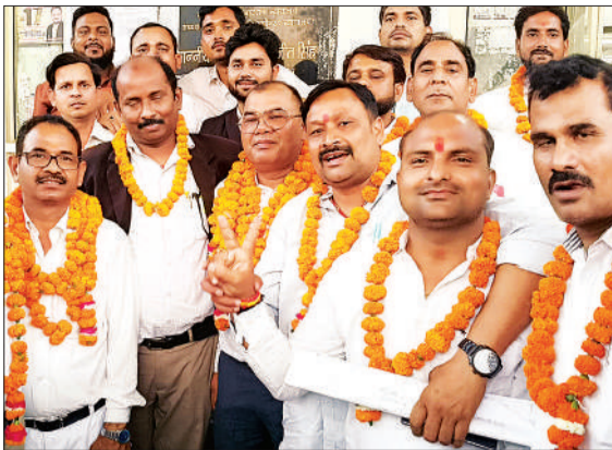
बुनाव जीतने के बाद खुशी जताते पदाधिकारी।

थाना ललिया पुलिस ने ट्रक को कब्जे में लेकर शव पोस्टमार्टम के लिए भेज दिया है और आवश्यक विधिक कार्रवाई जारी है।