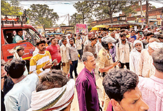
खाद न मिलने पर जाम लगाकर प्रदर्शन करते किसान।

किसानों का आरोप है कि इफको केंद्रों पर पहले खाद कार्ड से आसानी से खाद मिल जाती थी, लेकिन अब खतौनी