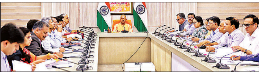
अपने सरकारी आवास पर स्टेट ट्रांसफॉर्मेशन समीक्षण की बैठक करते मुख्यमंत्री योगी आदित्यनाथ।

अमृत विचार : प्रदेश में औद्योगिक विकास को रफ्तार देने के लिए मुख्यमंत्री योगी आदित्यनाथ ने प्रमुख अवसंरचना परियोजनाओं को मिशन मोड में पूरा करने के सख्त निर्देश दिए हैं। शनिवार को स्टेट ट्रांसफॉर्मेशन समीक्षा की बैठक में मुख्यमंत्री ने काफी कड़ा कि प्रक्रियागत बाधाओं को प्राथमिकता पर दूर कर समयबद्ध प्रगति सुनिश्चित की जाए। मुख्यमंत्री ने फर्रुखाबाद लिंक, चित्रकूट लिंक और जेवर लिंक एक्सप्रेसवे के लिए 31 मई तक 90 प्रतिशत भूमि अधिग्रहण का लक्ष्य तय किया। जिलाधिकारियों को निर्देश दिए गए कि भूमि स्वामियों से सीधे संवाद कर उचित मुआवजा