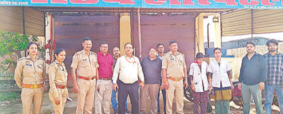
मेडीवे अस्पताल सील करते स्वास्थ्य विभाग और पुलिस प्रशासन के अधिकारी।