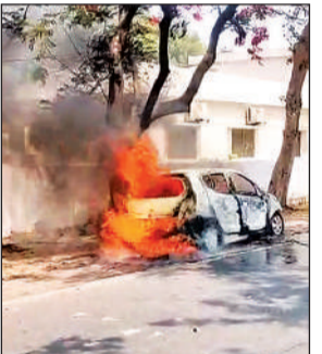
धु-धूकर के जलती कार। अमृत विचार

से जा रहे लोगों की घटना की सूचना दमकल विभाग को दी, जिसके बाद मौके पर पहुंचे फायर कर्मियों ने आग पर काबू पाया। वाहन में आग कैसे लगी इसका पता नहीं चल सका है। गाँडा-बहराइच हाईवे पर गिरा पेड़, टैपो सवार महिला घायल, पयागपुर: गाँडा-बहराइच स्टेट हाईवे पर शनिवार को एक बड़ा हादसा हो गया। खुटेदारा चौकी क्षेत्र