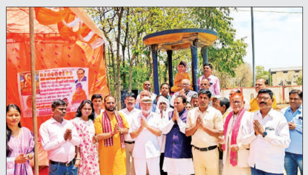
भगवान बुद्ध की जयंती पर श्रद्धांजलि अर्पित करते लोग।