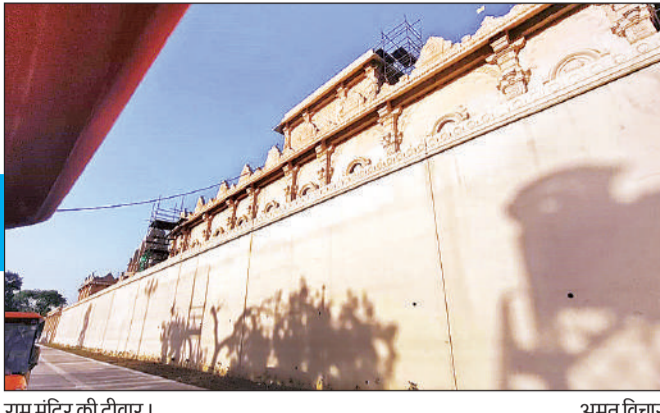
राम मंदिर की दीवार।

अमृत विचार : राममंदिर परिसर के सुरक्षा की पहली लेयर में बाउंड्री वॉल को मजबूत स्तंभ और आधुनिक सुरक्षा से तैयार किया जा रहा है। लगभग 3.5 किलोमीटर लंबी बाउंड्री वॉल के निर्माण में 30 प्रतिशत कार्य पूरा कर लिया गया है। इसे सितंबर से अक्टूबर माह के बीच पूरा करने का लक्ष्य रखा गया है।