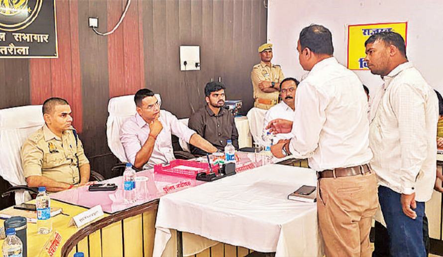
संपूर्ण समाधान दिवस में लोगों की शिकायत सुनते डीएम और अन्य अधिकारी।