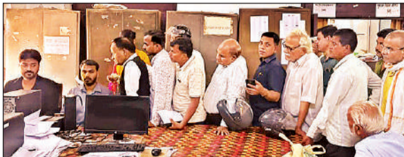
नगर निगम के कर अनुभाग में अपना टेक्स जमा कराने पहुंचे लोग।

अमृत विचार : नगर निगम ने संपत्ति कर वसूली को तेज करने के लिए बड़े कदम उठाए हैं। तीन दिन के भीतर 42 हजार गृहस्वामियों को एसएमएस भेजकर कर जमा कराने की अपील की है। इसके साथ ही चालू मांग ( करंट ईयर) पर करदाताओं को बड़ी राहत देते हुए 10 प्रतिशत छूट देने का ऐलान कर दिया है। हालांकि इस छूट से नगर निगम को कोई फायदा नहीं होने वाला, लेकिन करदाताओं को प्रोत्साहित करने के लिए एक स्कीम लागू की गई है। छूट का लाभ 31 जुलाई तक ही उठाया जा सकता है।