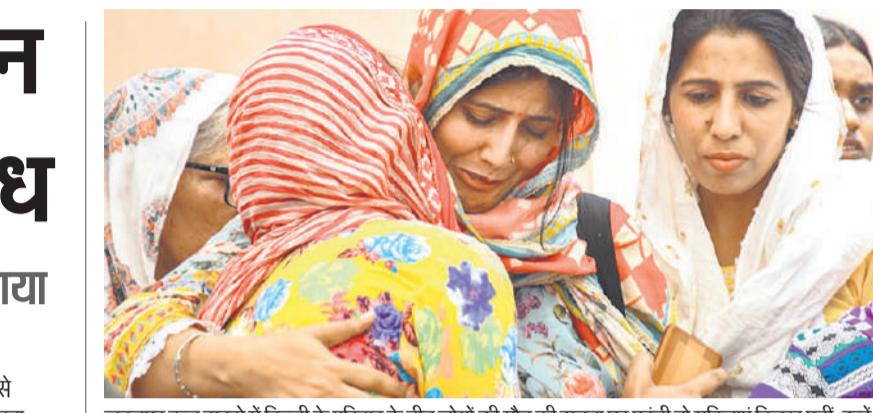
जबलपुर कूज हादसे में दिल्ली के परिवार के तीन लोगों की मौत की सूचना घर पहुंची तो महिलाएं बिलख पड़ीं, उन्हें संभालती और ढांडस बंधती आस-पड़ोस की महिलाएं।

अनौपचारिक अदला-बदली, या अन्य प्रकार के वस्तु-आधारित भुगतान भी शामिल हो सकते हैं, जिनमें परमार्थ दान और ईरानी दूतावासों में किए जाने वाले भुगतान भी शामिल हैं। ओएफएसी ने कहा कि वह यह चेतावनी इसलिए जारी कर रहा है ताकि अमेरिकी और गैर-अमेरिकी व्यक्तियों को इस बात से अवगत कराया जा सके कि ईरानी शासन को सुरक्षित मार्ग के लिए भुगतान करने या उससे गारंटी की मांग करने पर प्रतिबंधों का सामना करना पड़ सकता है। उसने यह भी स्पष्ट किया कि ये जोखिम भुगतान के किसी भी तरीके पर लागू होते हैं। अमेरिका ने 13 अप्रैल को ईरान द्वारा जलडमरूमध्य बंद किए जाने के जवाब में अपनी ओर से एक नौसैनिक