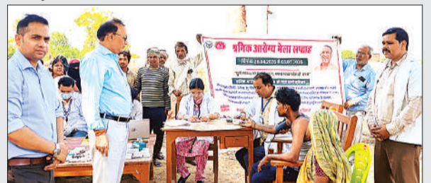
श्रमिक आरोग्य मेले का निरीक्षण करते सीएमओ और अन्य।