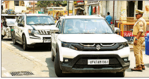
पोस्ट ऑफिस तिराहा बैरियर पर बाहरी वाहनों को रोकते पुलिसकर्मी।

अमृत विचार : जिला प्रशासन ने अयोध्या धाम में रहने वाले स्थानीय लोगों को बड़ी राहत दी है। अब अयोध्या धाम के सभी बैरियरों पर यूपी-42 नंबर के वाहनों के आने जाने पर किसी तरह की रोक टोकी नहीं होगी। इसके लिए वाहन पास की भी आवश्यकता नहीं होगी। यही नहीं बाहर से आने वाले रिश्तेदारों या शादी विवाह में बावत आदि को पास जारी किया जाएगा। हालांकि संदिग्ध दिखने पर वाहनों की तलाशी व पहचान पत्र की जांच जरूर की जाएगी। "अमृत विचार" ने 21 अप्रैल के अंक में इससे संबंधित खबर को प्रमुखता से प्रकाशित किया था, जिस पर अब मोहर लग गई है।