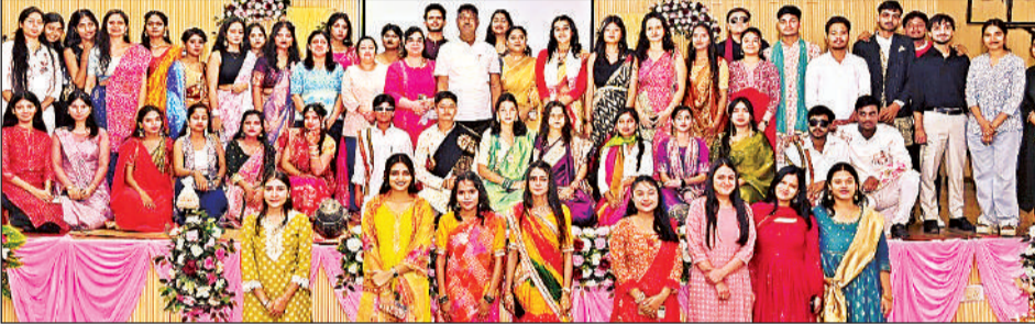
गुजरात स्थापना दिवस के अवसर पर फैशन शो के बाद गुप में मौजूद प्रतिभागी छात्र एवं छात्राएं।

वह सामुदायिक विज्ञान महाविद्यालय सभागार में गुजरात के स्थापना दिवस के अवसर पर शुक्रवार देर शाम आयोजित सांस्कृतिक कार्यक्रम को बतौर मुख्य