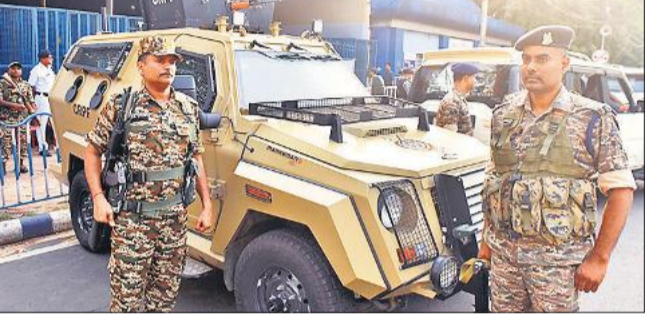
कोलकाता: खुदीराम बोस अनुशीलन केंद्र में बने स्ट्रांगरूम पर तैनात सुरक्षा बल।

देश के पांच राज्यों में हाल ही में हुए विधानसभा चुनाव के बाद मतगणना सोमवार सुबह शुरू होगी और दोपहर तक साफ हो जाएगा कि इन राज्यों में नई सरकार कौन बनाने जा रहा है। पश्चिम बंगाल और असम में संवेदनशील हालात देखते हुए सुरक्षा के कड़े प्रबंधन किए गए हैं। इस बीच पश्चिम बंगाल में मतगणना से एक दिन पहले रविवार को भी तुणमूल कांग्रेस और भाजपा के बीच भारी जद्दोजहद कायम रही। दोनों दलों की ओर से कई जगह स्ट्रांगरूम पर धांधली के आरोप लगाए गए और कार्यकर्ताओं के बीच धक्कामुक्की और मारपीट भी हुई। बारासात में आमने-सामने आए दोनों दलों के कार्यकर्ताओं को पुलिस ने लाठीचार्ज करके खदेड़ा। पश्चिम बंगाल में कड़े सुरक्षा इंतजामों और गरम-गरम राजनीतिक माहौल