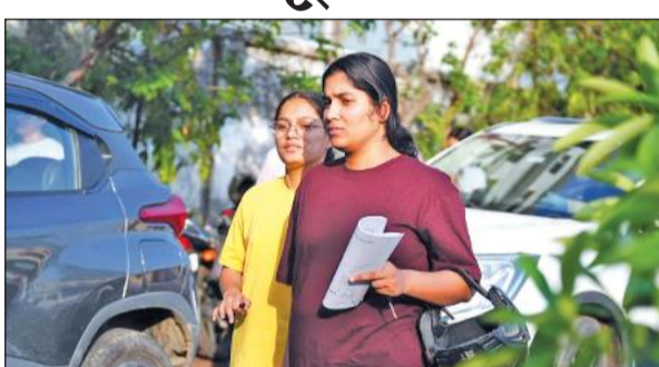
हल्लानी में नीट परीक्षा देकर लौटती छात्राएं।