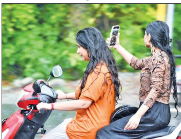
नैनीताल रोड पर भीगते हुए बारिश के दृश्य को फोन में कैद करती युवती।

हल्लानी में एक ही दिन में करीब 40 मिमी बारिश हुई है। रविवार को हल्लानी में पारा 30.6 डिग्री रहा जो सामान्य से छह डिग्री कम है। न्यूनतम तापमान 15 डिग्री दर्ज किया गया है। शहर में एक सप्ताह पहले पारा 40 डिग्री को पार कर