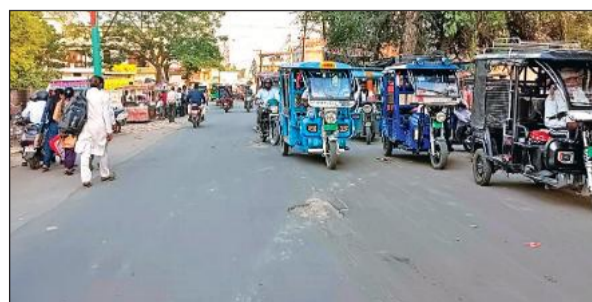
काशीपुर में संडे बाजार के दौरान सड़क पर खड़े ई-रिक्शे।