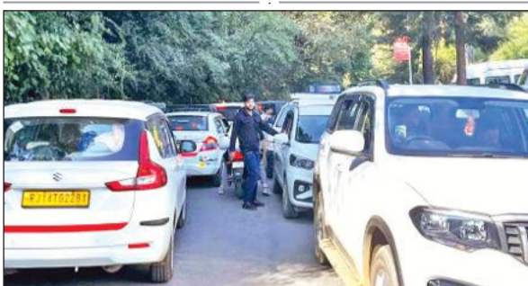
नैनीताल में रविवार को जाम में फंसे पर्यटकों के वाहन।

20 हजार से अधिक श्रद्धालु पहुंचे कैंची धाम में