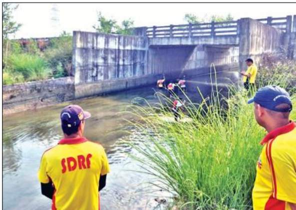
काशीपुर में नहर में शव की तलाश करती एसडीआरएफ की टीम। ● अमृत विचार

अमृत विचार: एक महिला द्वारा अपने प्रेमी के साथ मिलकर पति को शराब में जहर मिलाकर उसकी हत्या करने का सनसनीखेज मामला प्रकाश में आया है। हत्या के बाद आरोपी पत्नी ने प्रेमी के साथ मिलकर पति का शव नहर में फेंक दिया। पुलिस ने आरोपी पत्नी और उसके प्रेमी को गिरफ्तार कर लिया है। एसडीआरएफ की मदद से शव भी बरामद कर लिया गया है।