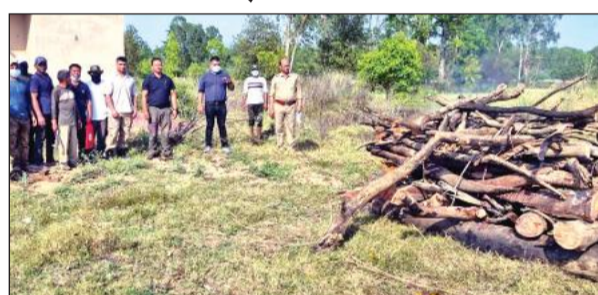
बाघ के शव को जलाकर नष्ट करते वन कर्मि।

अमृत विचार: कार्बेट टाइगर रिजर्व की ढेला रेंज स्थित रेस्क्यू सेंटर में एक वृद्ध नर बाघ की मौत हो गई। बाघ की उम्र लगभग 20 वर्ष आंकी गई है। वन अधिकारियों के अनुसार प्रथम दृष्टया उसकी मौत का कारण वृद्धावस्था माना जा रहा है।