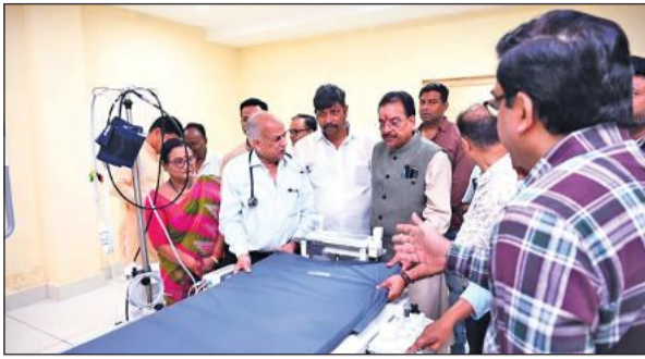
कैथलैब का निरीक्षण करते सांसद अजय भट्ट। ● अमृत विचार

कैथलैब में पहुंचे सांसद अजय भट्ट ने कार्यदाई संस्था मंडी परिषद को बचे हुए कामों को तेजी के साथ करने के निर्देश दिए। कहा कि इस कैथलैब के सुचारु हो जाने से कुमाऊं मंडल में स्वास्थ्य सुविधाएं बढ़ेंगी। निरीक्षण के दौरान उन्होंने निर्माण कार्यों की जानकारी ली। साथ ही मौके पर कई जगह दीवारों में सीलन देखने को मिली जिस पर उन्होंने नाराजगी व्यक्त की और मंडी परिषद के आधिकारियों को