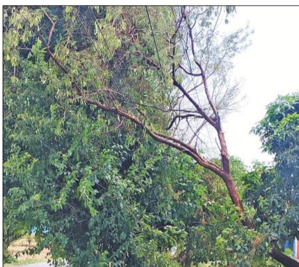
बिजली की लाइनों पर टूटकर गिरी पेड़ की टहनियां।