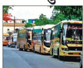
टीपी नगर चौराहे पर बाहरी राज्यों की बसों की लंबी कतार।

अमृत विचार : शहर में दो-दो बस अड्डे हैं, बावजूद इसके मध्य प्रदेश, आंध्र प्रदेश, नागालैंड, असम और बिहार समेत कई राज्यों के कारोबारियों ने यहां निजी बस अड्डा खोल दिया है। ये बस अड्डा बरेली रोड स्थित हौडा शोरूम तिराहे पर खुला है। ऑनलाइन बुकिंग के जरिये यहां से हर रोज बड़ी संख्या में पर्यटकों को कई प्रदेशों तक ले जाया जाता है। बड़ी बात यह है कि यह