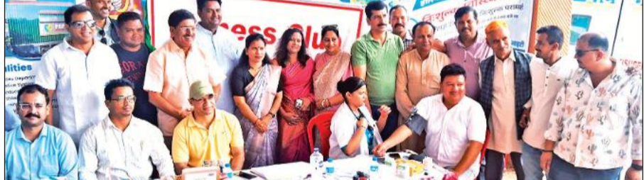
निशुल्क स्वास्थ्य शिविर का शुभारंभ करते मुख्य अतिथि।