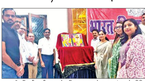
बाजपुर में भाविप की स्थानीय शाखा के दायित्व ग्रहण समारोह का शुभारंभ करते अतिथि।