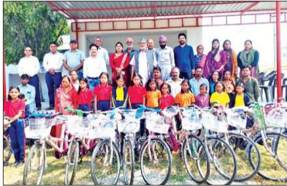
निशुल्क वितरित साइकिलों के साथ नए प्रवेशार्थी व विद्यालय प्रबंधन के सदस्य।

विद्यालय प्रबंधन समिति और विद्यालय प्रशासन के संयुक्त प्रयासों से इस वर्ष 26 छात्र-छात्राओं का प्रवेश सुनिश्चित किया गया। इस दौरान बच्चों का उनके अभिभावकों के साथ विद्यालय में स्वागत भी किया गया। विद्यालय प्रबंधन समिति ने संकल्प लिया है कि इस बार प्रत्येक बच्चे को