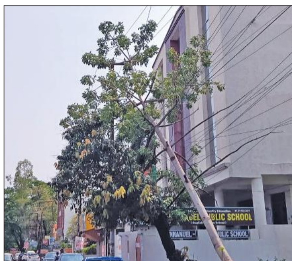
तेज आंधी-बारिश के कारण गिरी टहनियों से क्षतिग्रस्त हुई बिजली लाइन।