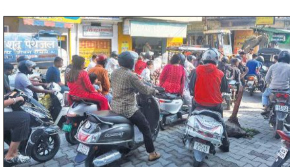
रामपुर रोड पर खुदाई के चलते सड़क पर लगा जाम।