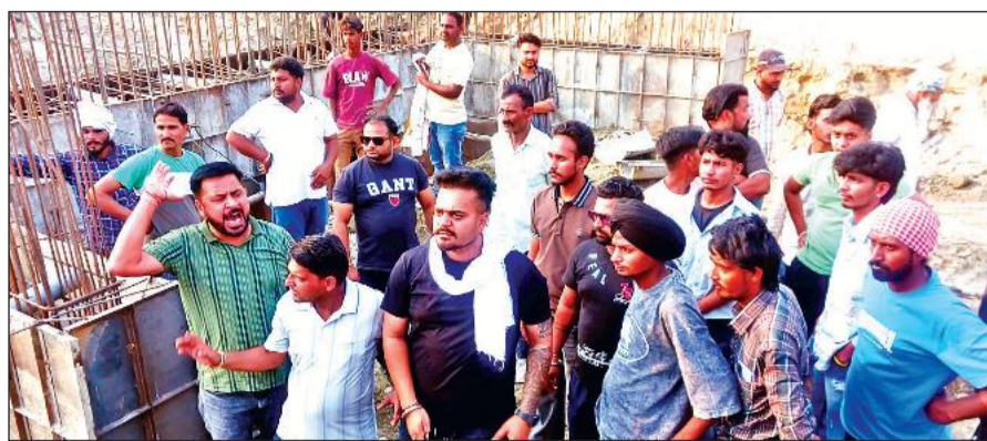
बाजपुर में बेरिया रोड स्थित लेवड़ा नदी पुल के निर्माण की धीमी गति पर विरोध जताते यूथ कांग्रेस कार्यकर्ता।

अमृत विचार: बेरिया रोड स्थित निर्माणाधीन लेवड़ा नदी पुल के धीमी गति से चल रहे कार्य और बारिश के कारण क्षतिग्रस्त हुए अस्थायी मार्ग की साइड दीवार की मरम्मत न होने से यूथ कांग्रेस और किसान कांग्रेस कार्यकर्ताओं में आक्रोश फैल गया। रविवार शाम करीब पांच बजे कार्यकर्ता मौके पर पहुंचे और विरोध-प्रदर्शन करते हुए जमकर हंगामा किया। इस दौरान उनकी निर्माण कंपनी के कर्मचारियों से तीखी नोकझोंक भी हुई। प्रदर्शनकारियों का आरोप था कि पुल निर्माण कार्य अत्यंत धीमी गति से चल रहा है, जिससे समय पर कार्य पूरा