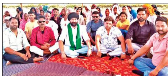
काशीपुर में किसान नेताओं के साथ धरना प्रदर्शन करते ग्रामीण। ● अमृत विचार

अमृत विचार: ग्राम जुड़का में ग्रामीणों का अनिश्चितकालीन धरना जारी है। ग्रामीणों ने छह मई को एसडीएम कार्यालय में महापंचायत करने का निर्णय लिया है।