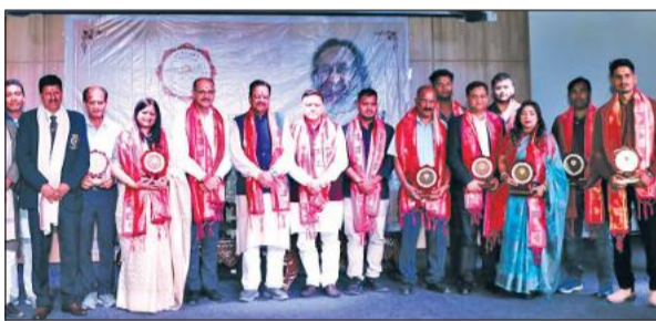
आर्ट ऑफ लिविंग कार्यक्रम में मौजूद लोग।