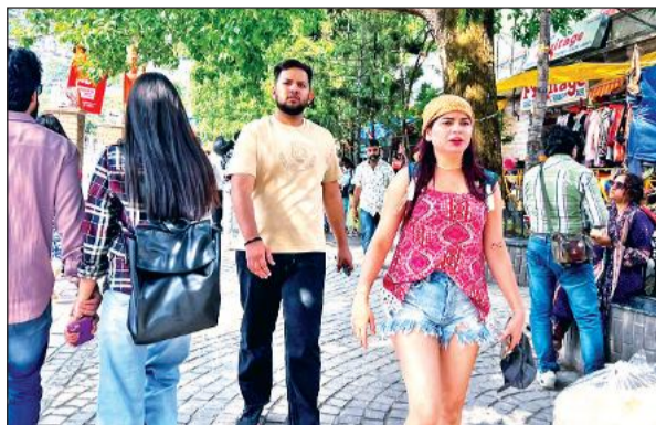
नैनीताल में पर्यटक स्थलों का दौरा करते पर्यटक।

वहीं, नैनीताल-भवाली मार्ग पर पर्यटकों की गाड़ियों का लंबा जाम लग गया। कई स्थानों पर वाहनो की रफ्तार थम गई, जिससे यात्रियों को खासी दिक्कतों का सामना करना पड़ा। ट्रैफिक