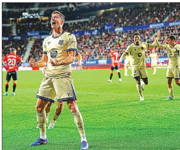
अपनी टीम का पहला गोल करने के बाद जर्न मनाते बार्सिलोना के रॉबर्ट लेवांडोव्स्की।

रॉबर्ट लेवांडोव्स्की और फेरान टोरेस के गोल की मदद से बार्सिलोना ने ओसासुना को 2-1 से हराकर स्पेनिश लीग फुटबॉल टूर्नामेंट ला लिंगा में फिर से चैंपियन बनने की तरफ मजबूत कदम बढ़ाए। बार्सिलोना ने इस तरह से दूसरे नंबर पर काबिज रियल मैड्रिड पर 14 अंकों की बढ़त बना ली है। इस सप्ताहांत के बाद प्रतियोगिता में केवल चार दौर के मैच खेले जाने बाकी हैं। बार्सिलोना को लगातार दूसरी बार ला लिंगा का खिताब जीतने से रोकने के लिए रियल मैड्रिड को अपने अगले मैच में एस्पेन्योल के खिलाफ जीत हासिल करनी होगी। मैड्रिड की जीत से खिताब की जंग