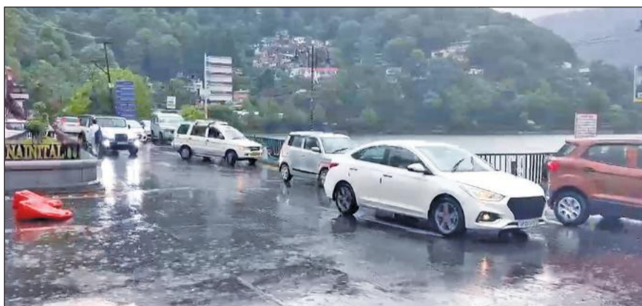
नैनीताल में रविवार को हुई झमाझम बारिश का दृश्य। • अमृत विचार

पश्चिमी विक्षोभ सक्रिय रहने का अनुमान है। ऐसे में अभी आंधी के साथ बारिश होने की संभावना है।