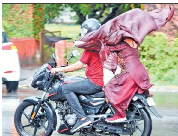
नैनीताल रोड पर बारिश से बचने की कोशिश करती बाइक पर सवार महिला।