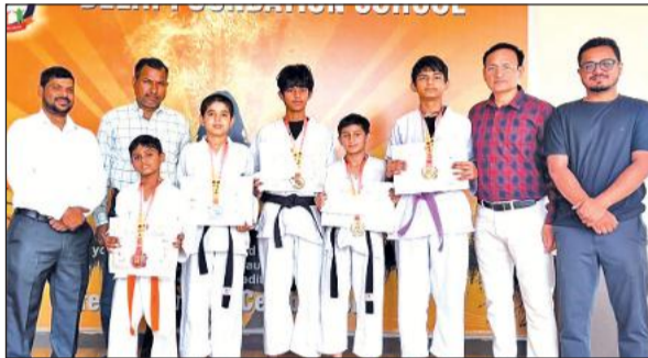
एशिया कराटे चैंपियनशिप में पदक जीतने वाले खिलाड़ी सम्मान प्राप्त करते हुए।