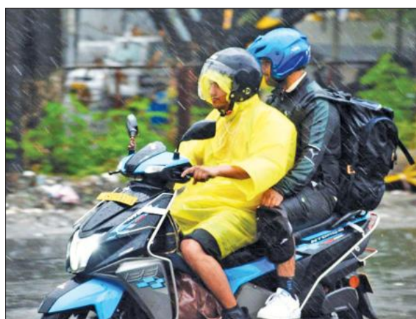
हल्लानी में रविवार को बारिश के बीच दोपहिया वाहन पर सफर करते युवा।