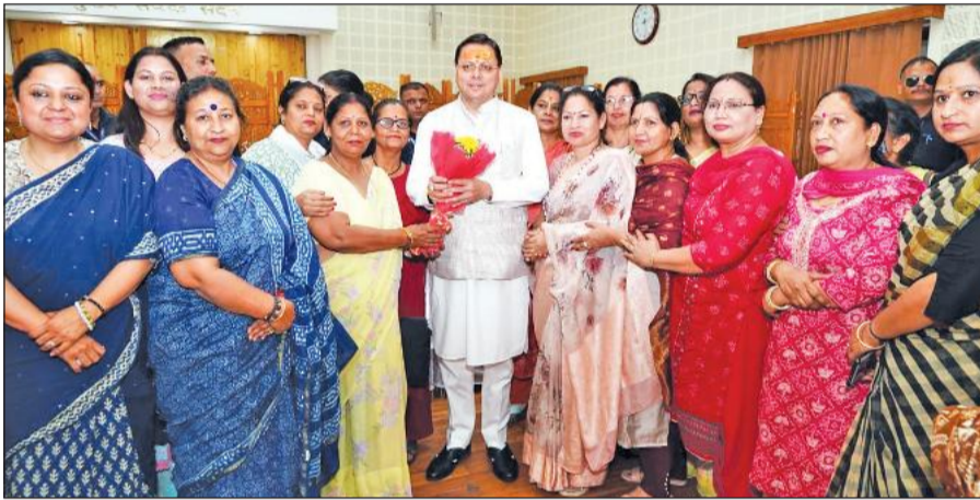
मुख्यमंत्री पुष्कर सिंह धामी ने मुख्यमंत्री आवास स्थित मुख्य सेवक सदन में प्रदेश के विभिन्न जनपदों से आए लोगों से मुलाकात की।

सीएम धामी रविवार को मुख्यमंत्री आवास स्थित मुख्य सेवक सदन में प्रदेश के विभिन्न जिलों से आए लोगों की समस्याओं को सुना। जनसुनवाई के दौरान बड़ी संख्या में लोगों ने सड़क, पेयजल, विद्युत, स्वास्थ्य, शिक्षा, भूमि संबंधी मामलों तथा अन्य जनहित से जुड़े विषयों पर अपनी समस्याएं मुख्यमंत्री के समक्ष रखीं। मुख्यमंत्री ने मुख्यमंत्री कार्यालय एवं संबंधित विभागों के अधिकारियों को निर्देश दिए कि जनसुनवाई में प्राप्त सभी शिकायतों एवं मांगों पर प्राथमिकता के आधार