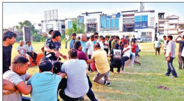
काशीपुर में युवोत्सव के दौरान रस्साकशी प्रतियोगिता में भाग लेते प्रतिभागी।