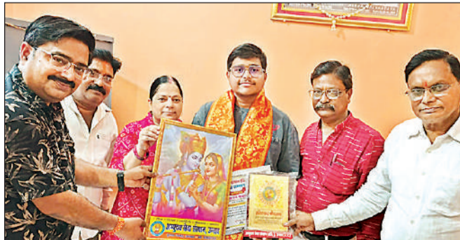
मेधावी छात्र को सम्मानित करते अभ्युदय सेवा संस्थान के पदाधिकारी।

अमृत विचार: शिक्षा के क्षेत्र में उत्कृष्ट प्रदर्शन करने वाली प्रतिभाओं को प्रोत्साहित करने के उद्देश्य से अभ्युदय सेवा संस्थान द्वारा मेधा सम्मान अभियान चलाया गया। इस अभियान के तहत संस्थान की टीम ने विभिन्न शिक्षा बोर्डों की हाईस्कूल एवं इंटरमीडिएट परीक्षाओं में शानदार अंक प्राप्त करने वाले