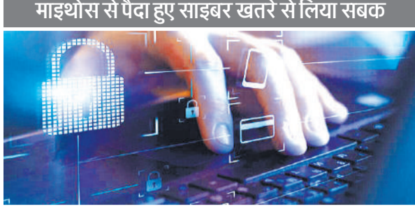
माइथोस से पैदा हुए साइबर खतरे से लिया सबक

प्रणालियों को बाधित करने के लिए किया जा सकता है।