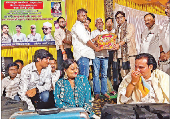
तिलोई में उर्स के दौरान प्रस्तुतियां देते कलाकार।