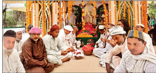
उर्स के दौरान उपस्थित अकीदतमंद।