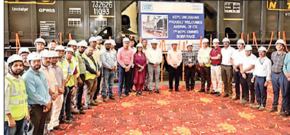
श्रमण के दौरान एनटीपीसी के क्षेत्रीय निदेशक के साथ मौजूद अन्य अधिकारी।