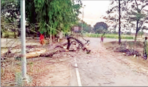
आंधी और बारिश के दौरान सड़क पर टूटकर गिरे पेड़।