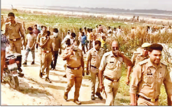
कब्र से युवक का शव निकाले जाने के दौरान मौजूद पुलिस बल व ग्रामीण।