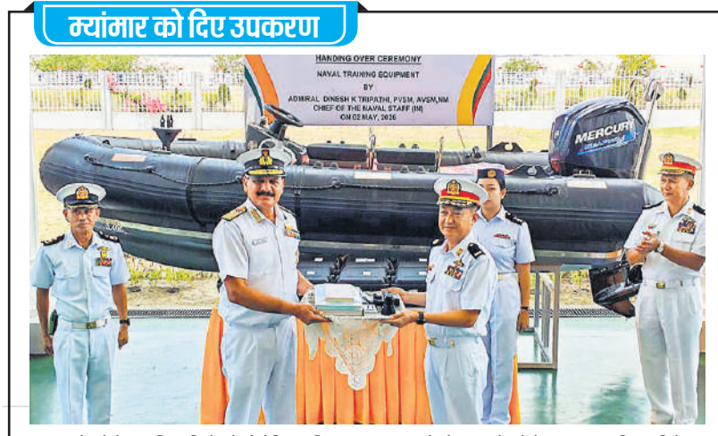
म्यांमार के नौसेना अधिकारियों को नौसैनिक प्रशिक्षण उपकरण सौंपते भारत के नौसेना प्रमुख एडमिरल दिनेश के त्रिपाठी। एडमिरल त्रिपाठी इन दिनों पड़ोसी देश म्यांमार के दौरे पर हैं।

की और उन्हें आरोपियों के खिलाफ कड़ी कार्रवाई किए जाने और त्वरित सुनवाई का आश्वासन दिया। पवार ने इस घटना को चौंकाने वाला और मानवता पर कलंक बताते हुए कहा कि सरकार पीड़ित परिवार के साथ मजबूती से खड़ी है और न्याय सुनिश्चित करेगी। उन्होंने मुख्यमंत्री देवेंद्र फडणवीस से भी इस मामले पर