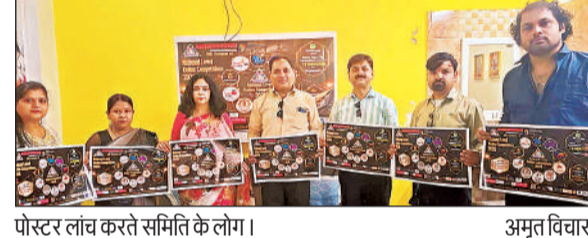
पोस्टर लांच करते समिति के लोग।

में राष्ट्रीय स्तर पर ऑनलाइन प्रतियोगिताओं के नवें सीजन का पोस्टर लॉन्च गौरी नगर स्थित अविनाश मिश्रा के आवास पर किया गया। पोस्टर लांच मुख्य अतिथि भाजपा नेत्री अनुराधा मिश्रा द्वारा हुआ। इस अवसर पर उन्होंने कहा कि प्रतियोगिताएं प्रतिभागियों के सम्यक बौद्धिक विकास में महत्वपूर्ण भूमिका निभाती हैं। कहा, ये ऑनलाइन प्रतियोगिताएं प्रधानमंत्री मोदी द्वारा शुरू किए गए डिजिटल