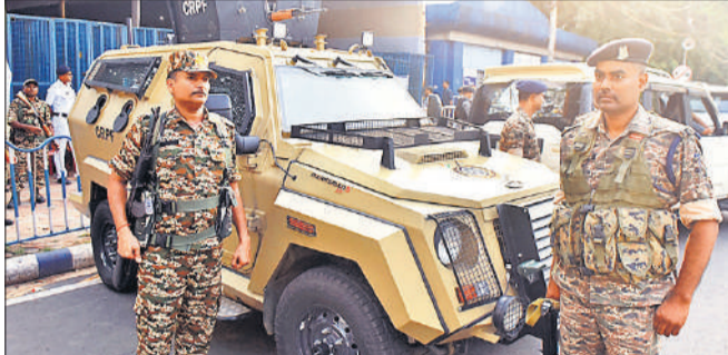
कोलकाता: खुदीराम बोस अनुशीलन केंद्र में बने स्ट्रांगरूम पर तैनात सुरक्षा बल।

देर शाम तक तैयारियों में जुटा रहा निर्वाचन आयोग, अंतिम समय तक की गई मतगणना पर्यवेक्षकों की तैनाती