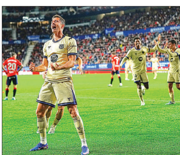
अपनी टीम का पहला गोल करने के बाद जगन मनाते बार्सिलोना रॉबर्ट लेवांडोव्स्की।

बार्सिलोना को लगातार दूसरी बार ला लिंगा का खिताब जीतने से रोकने के लिए रियल मैड्रिड को अपने अगले मैच में एस्पेनियोल के खिलाफ जीत हासिल करनी होगी। मैड्रिड की जीत से खिताब की जंग