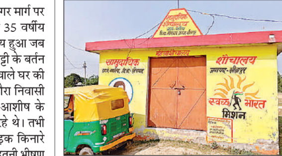
शौचालय में लगा ताला।