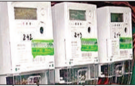
● सोलर पैनल स्मार्ट मीटर से आ रही दिक्कतों का भी उपभोक्ताओं ने दिया हवाला