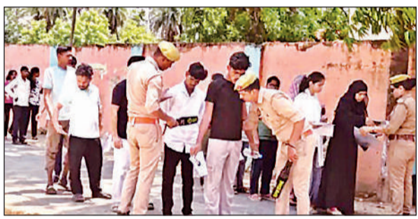
परीक्षा केंद्र परिसर में जांच करती पुलिस टीम।

नीट यूजी 2026 परीक्षा नगर स्थित आरआरडी इण्टर कॉलेज, राजकीय इण्टर कॉलेज सहित पांच केंद्रों पर आयोजित हुई। परीक्षा आरंभ होने से पहले परीक्षा केंद्रों पर तीन चक्रों में जांच प्रक्रिया पूरी की गई। अभ्यर्थियों को घड़ौ, कंगन, क्लेचर, ब्रेसलेट, जेवररात आदि ले जाने की अनुमति