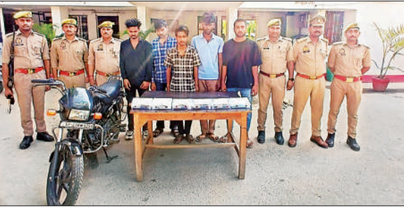
पुलिस की गिरफ्त में पांचो आरोपी।