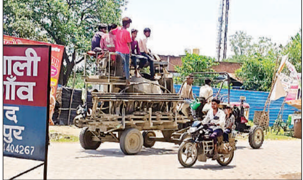
तालगांव कोतवाली के टीक सामने नियमों की अनदेखी करता वाहन चालक।