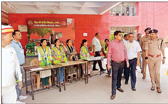
केंद्रीय विद्यालय के परीक्षा केंद्र का निरीक्षण कर निकलते डीएम व एसएसपी।

5 बजे तक आयोजित की गई, जबकि अभ्यर्थियों का प्रवेश दो घंटे पहले से ही शुरू कर दिया गया था। प्रवेश से पहले अभ्यर्थियों के आधार कार्ड का मिलान किया गया और सघन तलाशी के बाद ही उन्हें परीक्षा कक्ष में प्रवेश दिया गया। परीक्षा केंद्रों में अटल बिहारी इंटर कॉलेज, डीएसएन महाविद्यालय, राजकीय बालिका इंटर कॉलेज और पीएम श्री केंद्रीय विद्यालय दही चौकी शामिल रहे। सभी केंद्रों पर मानकों के अनुरूप व्यवस्थाएं सुनिश्चित की गई थीं। महिला अभ्यर्थियों की सुरक्षा के लिए महिला पुलिस बल की विशेष तैनाती की गई थी।