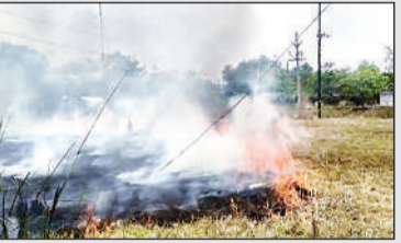
तहसील परिसर में जलती आग।