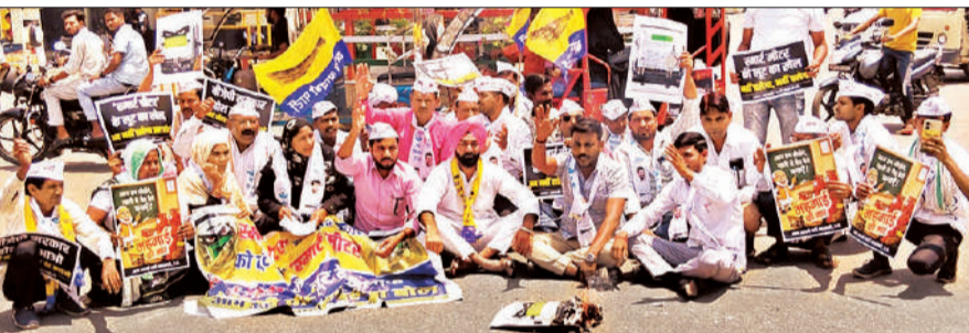
प्रदर्शन करते आप जिलाध्यक्ष व अन्य कार्यकर्ता।