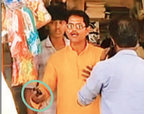
वायरल वीडियो का स्क्रीनशॉट।

शहर में कानून राज का यह आलम है कि सरेशम हथियार लहराए जा रहे हैं। वायरल वीडियो में बस्तेपुर के एक कॉस्मेटिक एवं स्टेशनरी के दुकान की है। दुकान के बगल में स्थित ब्यूटी पार्लर के बाहर स्थानीय दूध विक्रेता अक्सर खड़े रहते थे। आरोप है कि उनकी मौजूदगी और कथित अशोभनीय टिप्पणियों से पार्लर में आने वाली महिलाएं असहज महसूस करती थीं। इसी बात को लेकर दुकानदार