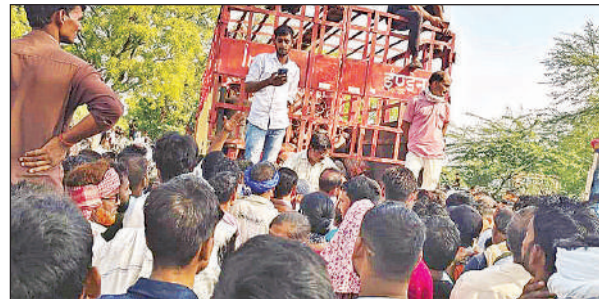
सिलेंडर लेने के लिए एकत्रित हुए उपभोक्ता।