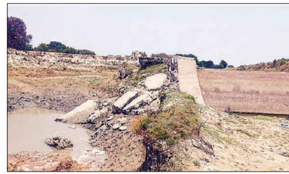
मालती नदी पर बना बंधा क्षतिग्रस्त।