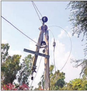
आंधी के कारण बीच से टूटा खंभा।

अमृत विचार : रविवार भोर में आधी आंधी के साथ हुई बारिश ने जनजीवन पर गहरा असर डाला। मार्गों पर पेड़ उखड़कर यातायात में बाधा बने तो जिले में बिजली आपूर्ति एक बार फिर छिन्न-भिन्न हो गई और सैकड़ों गांव अंधेरे में डूब गए। वहीं आंधी-बारिश ने किसानों को बेहाल करके रख दिया। आम के अलावा खेतों में खड़ी फसल को खासा नुकसान पहुंचा है। मौसम के इस बदलाव से शहरवासी खुश हो रहे हैं।