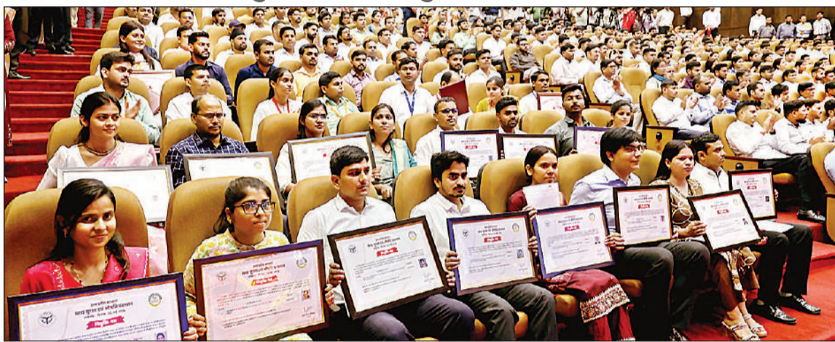
लखनऊ में आयोजित समारोह में मुख्यमंत्री योगी आदित्यनाथ के हाथों नियुक्ति पत्र पाने वाले अभ्यर्थी।