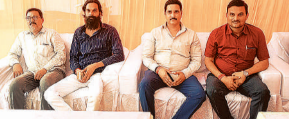
प्रेस वार्ता करते भाजपा नेता।