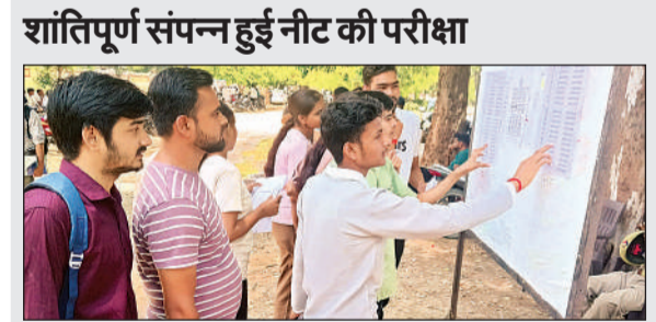
परीक्षा केंद्र पर अपना रोल नंबर देखते परीक्षार्थी।