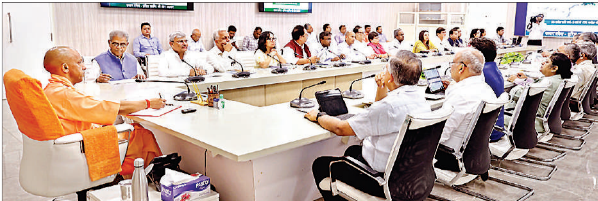
वृहद पौधरोपण अभियान-2026 की तैयारियों की समीक्षा करते मुख्यमंत्री योगी आदित्यनाथ।

मुख्यमंत्री ने रविवार को वृहद पौधरोपण अभियान-2026 की तैयारियों की समीक्षा करते हुए कि पौधरोपण को जनआंदोलन