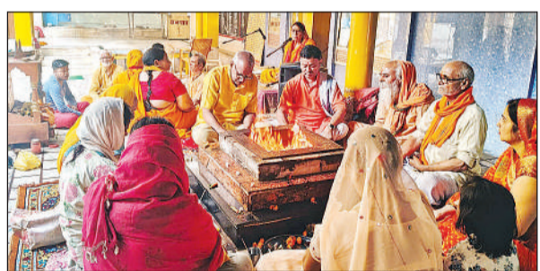
यज्ञ में आहुतियां डालते साधक।