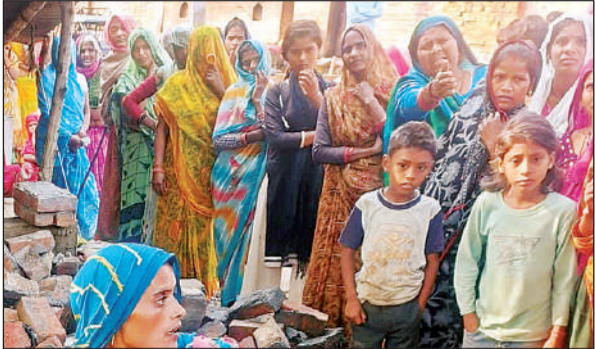
घटना के बाद रोते-बिलखते मृतक के परिजन।

तेज आंधी और बारिश के दौरान हुआ हादसा, रेस्क्यू कर मलबे से निकाला गया शव