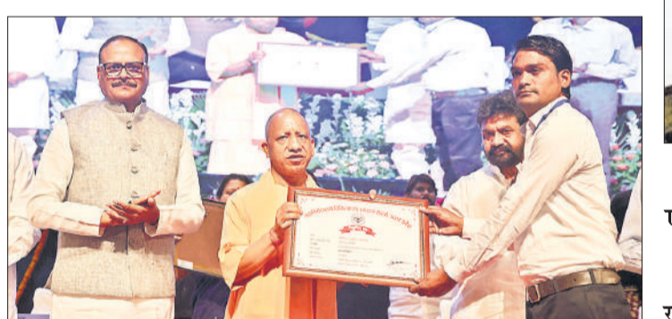
लखनऊ: लोक भवन सभागार में अभ्यर्थियों को मुख्यमंत्री योगी ने नियुक्ति पत्र प्रदान किए।

अमृत विचार: मुख्यमंत्री योगी आदित्यनाथ ने कहा कि उत्तर प्रदेश में पिछले नौ वर्षों में नौ लाख से अधिक नौजवानों को सरकारी नौकरी दी गई है। यह किसी भी राज्य में सर्वाधिक नियुक्तियों की प्रक्रिया को सफुल्ल एवं पारदर्शी तरीके से संपन्न करने का रिकॉर्ड है। उन्होंने घोषणा की कि इस साल डेढ़ लाख से अधिक सरकारी भर्तियों की प्रक्रिया संपन्न होनी है। वे रविवार को लोक भवन में आयोजित उप अधीनस्थ सेवा चयन आयोग द्वारा खाद्य सुरक्षा एवं औषधि प्रशासन विभाग के लिए नवचयनित 357 कनिष्ठ विश्लेषकों (औषधि) और चिकित्सा एवं स्वास्थ्य विभाग के नवचयनित 252 दंत स्वास्थ्य विज्ञानियों को नियुक्ति पत्र वितरण कार्यक्रम में बोल रहे थे। योगी ने कहा कि सिर्फ अधीनस्थ चयन आयोग इस वर्ष 32 हजार से अधिक नियुक्तियों की प्रक्रिया पूरी करेगा। शिक्षा चयन आयोग हजारों शिक्षकों की भर्ती करेगा, जबकि उप लोक सेवा आयोग को लगभग 15 हजार भर्तियां करनी हैं। प्रक्रिया में किसी प्रकार की संभ्रमरी पर आजीवन कारावास की सजा और उसकी पूरी संपत्ति को जब्त करने का सख्त कानून बनाया गया है। वर्तमान में कनिष्ठ विश्लेषकों (खाद्य) की संख्या अभी केवल 58 है। 417 पदों के लिए अधिचयन भेजा है, जल्द ही भर्ती प्रक्रिया संपन्न होगी। वर्तमान में 36 हजार खाद्य नमूने प्रतिवर्ष