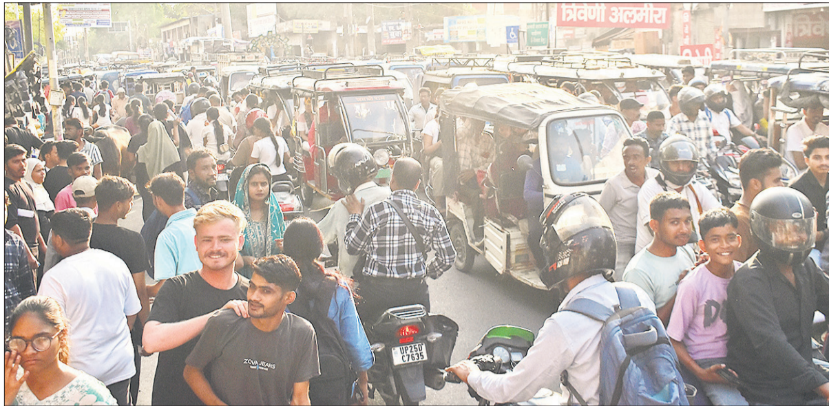
बरेली कॉलेज में नीट देने के बाद अभ्यर्थी बाहर आए तो चौराहे पर जाम लग गया। काफी देर तक वाहन फंसे रहे।

दोपहर करीब 12 बजे परीक्षा शुरू होने के समय और शाम करीब पांच बजे परीक्षा समाप्त होने के बाद सड़कों पर वाहनों का दबाव अचानक बढ़ गया। इस कारण सिकलापुर, बरेली कॉलेज गेट, कालीबाड़ी, जीआईसी और श्यामगंज समेत कई प्रमुख चौराहों पर जाम की स्थिति बन गई। कई