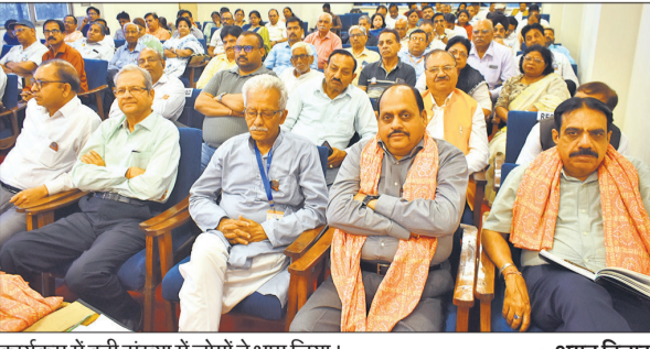
कार्यक्रम में बड़ी संख्या में लोगों ने भाग लिया।