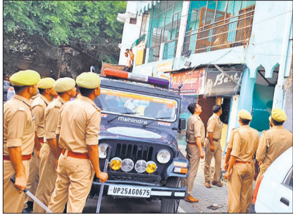
वीडियो वायरल होने के बाद सक्रिय हुई पुलिस।