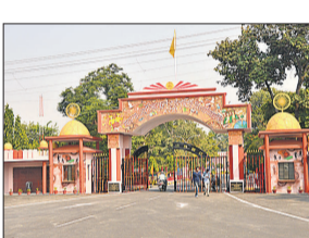
विश्वविद्यालय विभागीय स्तर पर तैयारी कर रहा है।

पारंपरिक पढ़ाई के ढांचे से आगे बढ़ते हुए एमजेपी रुहेलखंड विश्वविद्यालय अब ऐसा एकेडमिक मॉडल तैयार कर रहा है। जिसमें खेल को भी उतनी ही अहमियत दी जाएगी, जितनी पढ़ाई को। नई योजना के तहत छात्र-छात्राओं को स्पोर्ट्स कोर्स में डिग्री मिलने के साथ उनको नियमित खेल गतिविधियों में भाग लेने की सहूलियत मिलेगी। रुहेलखंड विश्वविद्यालय खेलों के क्षेत्र में अपना करियर बनाने वाले छात्रों के लिए बैचलर ऑफ फिजिकल एजुकेशन एंड स्पोर्ट्स (बीपीईएस) डिग्री कोर्स शुरू करने जा रहा है। इसके लिए