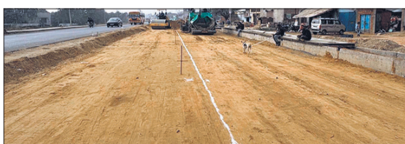
बरेली-सितारगंज हाईवे चौड़ीकरण को लेकर रिटोरी में चल रहा काम।

अमृत विचार : बरेली से उत्तराखंड की राह आसान करने के लिए 71 किलोमीटर लंबे बरेली-पीलीभीत-सितारगंज हाईवे का चौड़ीकरण किया जा रहा है। तीन साल बाद भी निर्माण कार्य अभी तक रफ्तार नहीं पकड़ सका है। 60 प्रतिशत काम ही पूरा हो सका है। ऐसे में एनएचएआई और कार्यालय संस्था के सामने आठ माह में 40 प्रतिशत निर्माण कार्य को पूरा