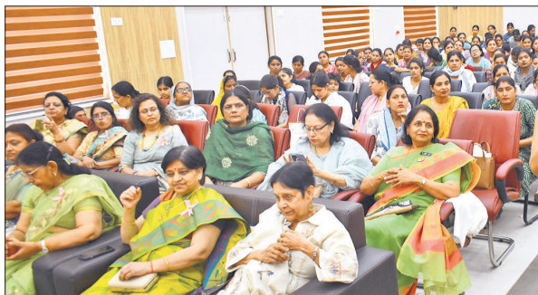
कार्यक्रम में महिलाओं ने बड़ी संख्या में भाग लिया।

अनियमितताएं और महिलाओं में एनीमिया प्रमुख रहे। महिलाओं ने इन सत्रों में विशेष रुचि दिखाई और स्वास्थ्य संबंधी प्रश्नों के उत्तर प्राप्त किए। कार्यक्रम के तहत स्वास्थ्य शिविर भी लगाया गया। जिसमें एलबीसी स्क्रीनिंग के माध्यम से 35 से 45 साल की महिलाओं की सर्वाइकल कैंसर की जांच की गई। साथ ही सीबीसी टेस्टिंग द्वारा एनीमिया एवं ब्लड शुगर की जांच भी कराई गई। शिविर में लगभग 80-90 महिलाओं के सीबीसी