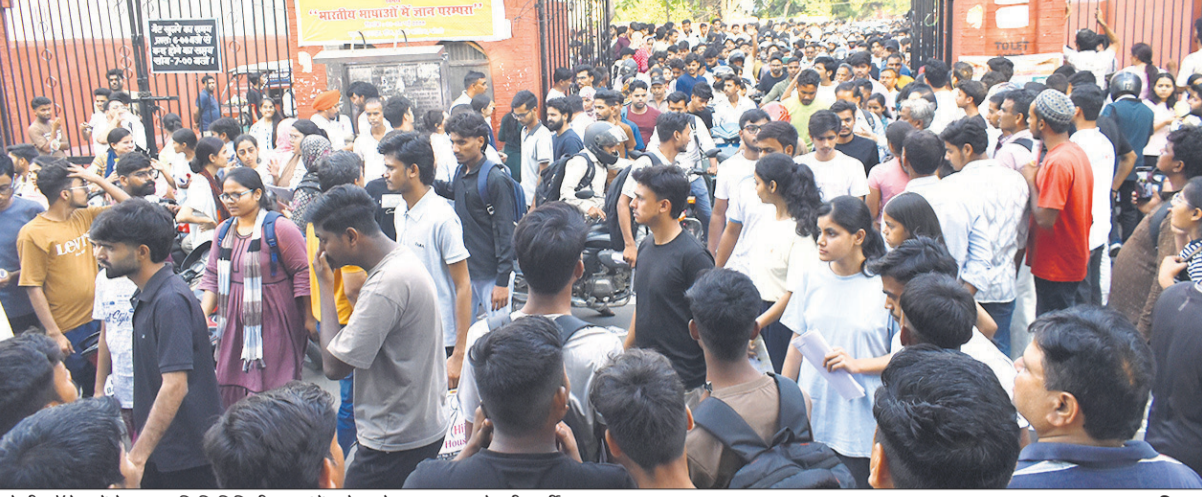
बरेली कॉलेज में नेशनल एलिजिबिलिटी कम एंटेंस टेस्ट देकर बाहर आते परीक्षार्थी।

अमृत विचार: जिले में नेशनल एलिजिबिलिटी कम एंटेंस टेस्ट (नीट) 2026 का आयोजन रविवार को कड़ी सुरक्षा के बीच 25 परीक्षा केंद्रों पर हुआ। कुल 11,532 परीक्षार्थी पंजीकृत थे, जिनमें से 11,253 ने परीक्षा दी, जबकि 279 अभ्यर्थी अनुपस्थित रहे। अभ्यर्थियों की 97.58 प्रतिशत उपस्थिति रही। परीक्षा का समय दोपहर 2:00 से शाम 5:00 बजे तक निर्धारित था, लेकिन कड़ी जांच प्रक्रिया के चलते परीक्षार्थियों का केंद्रों पर पहुंचना सुबह 11:30 बजे से ही शुरू हो गया था। प्रवेश से पहले अभ्यर्थियों को गहन तलाशी, मेटल डिटेक्टर से जांच और दस्तावेजों का सत्यापन किया गया। विष्णु इंटर कॉलेज, एफआर इस्लामिया इंटर कॉलेज, इस्लामिया गर्ल्स इंटर कॉलेज, एसवी इंटर कॉलेज, राजकीय बालिका इंटर कॉलेज, पीएमश्री राजकीय इंटर कॉलेज, साहू गोपीनाथ कन्या इंटर कॉलेज, तिलक इंटर कॉलेज, सीबीगंज इंटर कॉलेज, पीएमश्री केंद्रीय विद्यालय एनईआर, पीएमश्री केंद्रीय विद्यालय नं.1 जेआरसी, पीएमश्री केंद्रीय विद्यालय नं. 2 जेएलए, बरेली कॉलेज में ब्लॉक ए, बी, सी, डी,