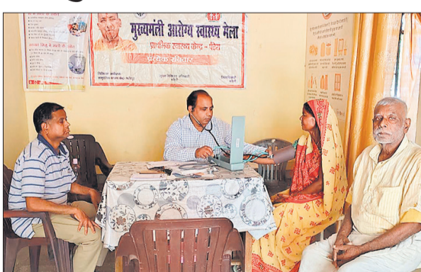
मरीजों की जांच करते डाक्टर।