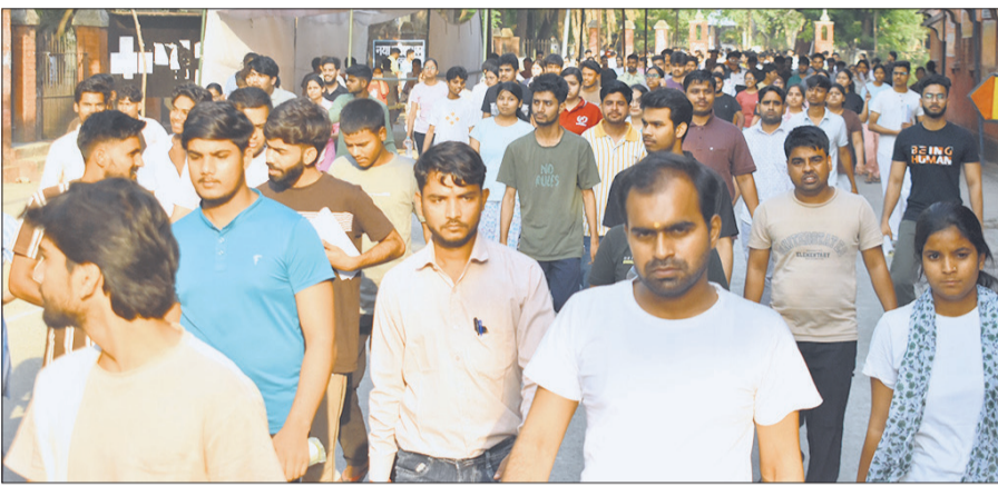
परीक्षा केंद्र के बाहर मौजूद परीक्षार्थी।