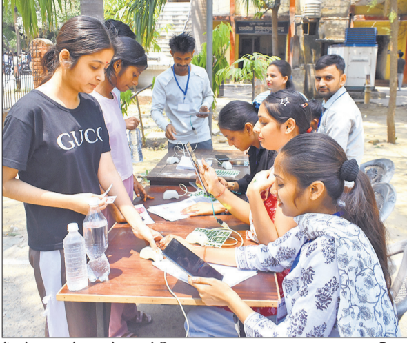
केंद्र के बाहर प्रवेश पत्र चेक करते शिक्षक।

ई सेंटर, बरेली इंटर कॉलेज, गुरु गोबिंद सिंह इंटर कॉलेज, दरबारी लाल शर्मा इंटर कॉलेज रिठौरा, मौलाना आजाद इंटर कॉलेज, पीसी आजाद इंटर कॉलेज बिहारी कला डेलापीर, कुंवर रंजीत सिंह इंटर कॉलेज, गुलाबराय इंटर कॉलेज, एमवी इंटर कॉलेज में परीक्षा हुई। पूरी बांह के कपड़े, ऊंची हील वाले जूते, घड़ियां, इलेक्ट्रॉनिक गैजेट्स आदि पूरी तरह प्रतिबंधित रहे। हर केंद्र पर पुलिस बल और मजिस्ट्रेट की तैनाती की गई थी। सीसीटीवी कैमरों की निगरानी में परीक्षा कराई गई।