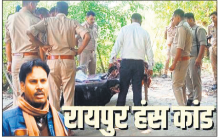
रायपुर हंस कांड