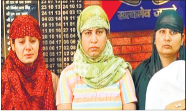
फर्जी एडीएम बनकर ठगी करने वाली बहनों के रोज नए कारनामे सामने आ रहे।