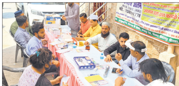
शिविर में मरीजों की जांच करते चिकित्सक।