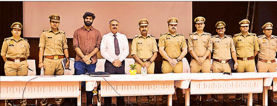
कार्यशाला में मौजूद पुलिस अधिकारी व अन्य पुलिसकर्मी।

अमृत विचार: साइबर अपराधों के तेजी से बदलते स्वरूप को देखते हुए पुलिस कमिश्नरेंट लखनऊ ने अधिकारियों और कर्मचारियों को तकनीकी रूप से सशक्त बनाने के लिए विशेष प्रशिक्षण शिविर का आयोजन किया गया। एक दिवसीय विशेष कार्यशाला का आयोजन सोमवार को विश्वेश्वरैया हॉल में किया गया। इसमें पुलिसकर्मियों और अधिकारियों को साइबर फ्रॉड, ब्लॉकचेन, क्रिप्टोकरेंसी एवं डार्क वेब के बारे में जानकारी दी गई। कार्यशाला में 117 पुलिसकर्मी व अधिकारी प्रशिक्षित किये गये। विश्वेश्वरैया हॉल में आयोजित विशेष कार्यशाला में 117 पुलिस