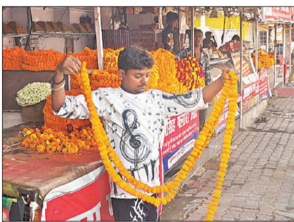
हनुमान सेतु मंदिर के बाहर फूल माला तैयार करता फूल विक्रेता।

और सफलता का आशीर्वाद मिलता है। महंत ने बताया यह दिन भक्ति, शक्ति और संकट मोचन का प्रतीक माना जाता है। हनुमान को राम के परम भक्त और अद्भुत शक्ति संपन्न देवता के रूप में पूजा जाता है। इस पावन दिन पूजा और भजन-कीर्तन करने से हनुमान की कृपा प्राप्त होती है। धार्मिक मान्यता है कि इस दिन हनुमान चालीसा और सुंदरकांड का पाठ करने से मानसिक शांति, स्वास्थ्य, शक्ति और जीवन की कठिनाइयों से मुक्ति मिलती है।