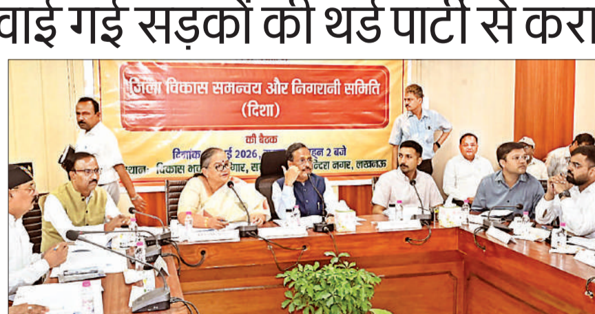
विकास भवन के लोहिया सभागार में दिशा की बैठक करते राज्यसभा सांसद दिनेश शर्मा।

जाए। आरटीई के तहत चयनित सभी बच्चों को प्रवेश दिलाए। नगर विकास विभाग के अंतर्गत अमृत 2.0 एवं अन्य योजनाओं की समीक्षा की गई। कई परियोजनाओं में 40 से 85 फीसद तक भौतिक प्रगति