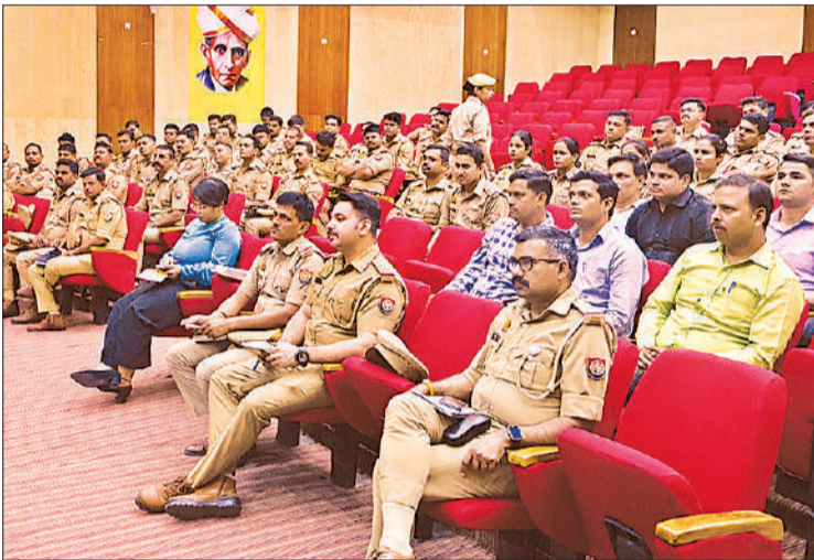
साइबर अपराधियों से बचाव के तरीके सीखते पुलिसकर्मी।