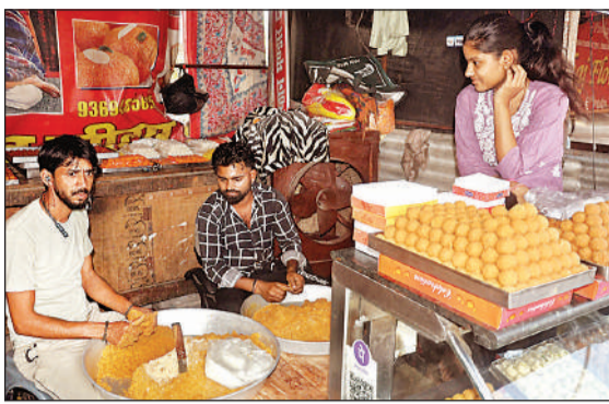
ज्येष्ठ के बड़े मंगलवार को हनुमानजी को भोग लगाने के लिए प्रसाद तैयार करते हलवाई और मूर्ति की साज सज्जा करते पुजारी।

हनुमान को भक्त शक्ति और संकट मोचन का प्रतीक मानते हैं। भक्त इस पावन दिन हनुमान चालीसा का पाठ, हनुमान मंत्र का जाप और पूजा विधि के अनुसार भगवान की आराधना करते हैं। हनुमान की पूजा अर्चना आरती और भंडारा करने से जीवन में सुख-शांति, स्वास्थ्य