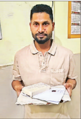
पकड़ा गया अफीम तस्करी का आरोपी।

आरोपी को रविवार की रात करीब 11:30 बजे पालीटेक्निक चौराहे से