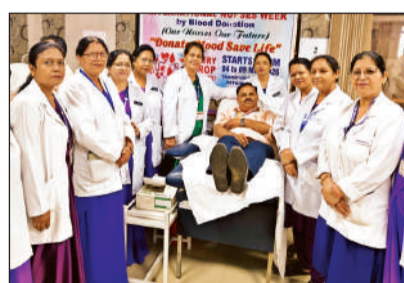
शिविर में मौजूद नर्सिंग स्टाफ