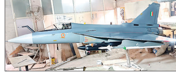
तेजस का मॉडल।