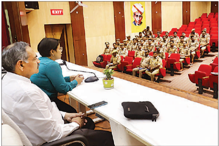
विश्वेश्वरैया हॉल में साइबर टगी, क्रिप्टो करेंसी व डार्क वेब पर आयोजित कार्यशाला में जानकारी देती प्रशिक्षक।