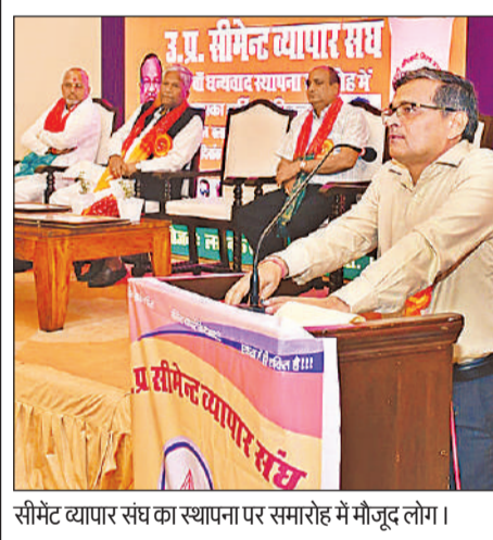
सिमेंट व्यापार संघ का स्थापना पर समारोह में मौजूद लोग।