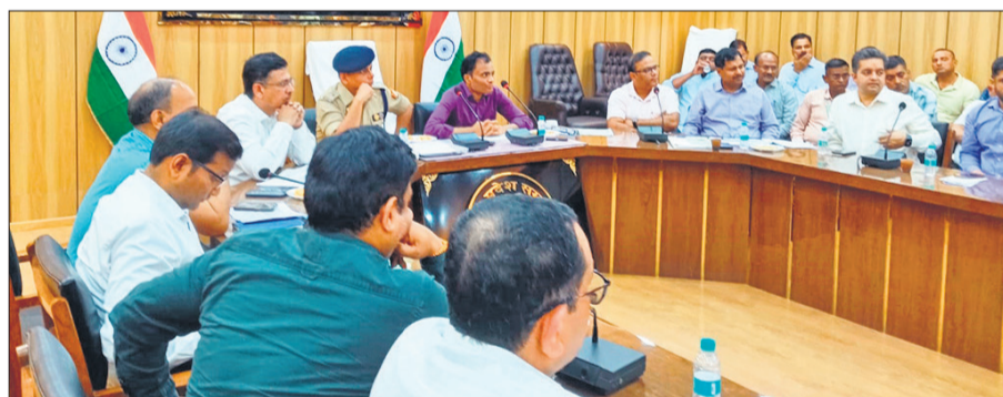
जिला विद्यालययान परिवहन सुरक्षा समिति की बैठक में कई विभागों के अधिकारी।