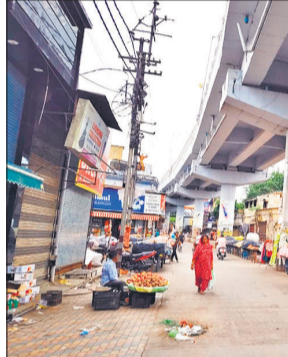
पुल से पानी टपकने के कारण लोगों को होती है परेशानी।

क्षेत्र के पुल के नीचे भी देखी जा रही है, जहां पाइपों के चोक