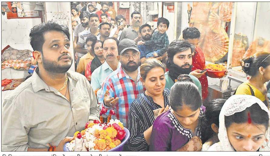
सिविल लाइन हनुमान मंदिर में आरती करते बड़ी संख्या में श्रद्धालु।