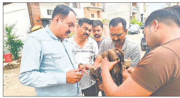
चील को पेड़ से उतारने के बाद देखते फायर कर्मचारी।