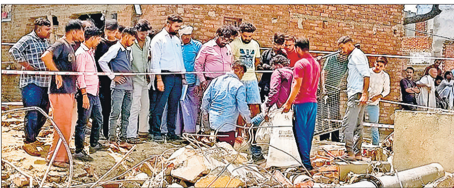
कट्टों में निर्माण समग्री के नमूने भरवाती लखनऊ से आई टीम।