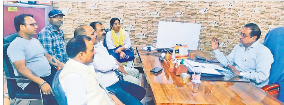
लेखाधिकारी को समस्याएं बताते उत्तर प्रदेशीय प्राथमिक शिक्षक संघ के सदस्य।