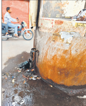
पाइप टूटने पर पुल से गिर रहा पानी।

समस्या के कारण असुविधा हो रही है। ऐसी ही स्थिति श्यामगंज घर से साफ-सुथरे निकलते हैं, लेकिन श्यामगंज पुल से नीचे को टपकता गंदा पानी कपड़ों को खराब कर देता है। यह समस्या कई स्थानीय दुकानदारों के लिए परेशानी का सबब बनी हुई है।