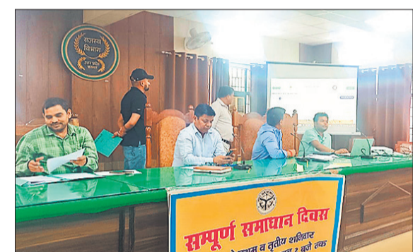
बरेली, अमृत विचार : जिलाधिकारी एवं प्रमुख जनगणना अधिकारी के निर्देश पर तहसील सदर के ग्रामीण क्षेत्रों में जनगणना को लेकर तैयारियां तेज कर दी गई हैं। राशन डीलरों को स्व-गणना (सेल्फ एन्स्यूरेशन) प्रक्रिया के लिए विशेष प्रशिक्षण दिया गया। प्रशिक्षण के दौरान बताया गया कि 7 से 21 मई तक स्व-गणना अभियान चलाया जाएगा। इसके लिए संबंधित क्षेत्रों में कैंप लगाकर अधिक से अधिक लोगों को स्व-गणना से जोड़ने का लक्ष्य निर्धारित किया गया है। प्रशासन ने साफ निर्देश दिए हैं कि अभियान की प्रगति की प्रतिदिन रिपोर्ट तैयार कर एआरओ और पूर्ण निरीक्षक को उपलब्ध कराई जाए, ताकि निगरानी और समीक्षा प्रभावी ढंग से की जा सके।