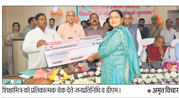
शिक्षामित्र को प्रतिकाम्य चेक देते जन्मप्रतिनिधि व डीएम।