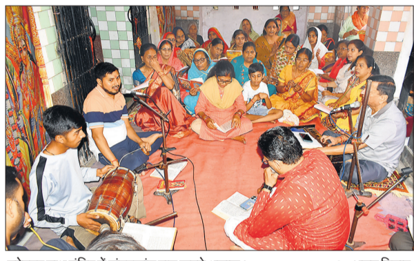
तपेश्वर नाथ मंदिर में सुंदरकांड पाठ करते श्रद्धालु।