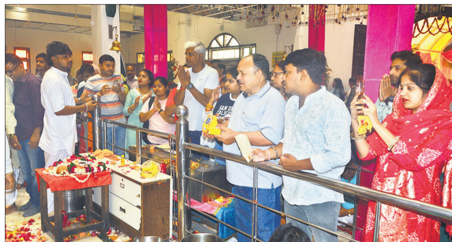
हार्टमैन कॉलेज के पास स्थित बड़ा बाग हनुमान मंदिर में पूजा करने को जुटे बड़ी संख्या में श्रद्धालु।