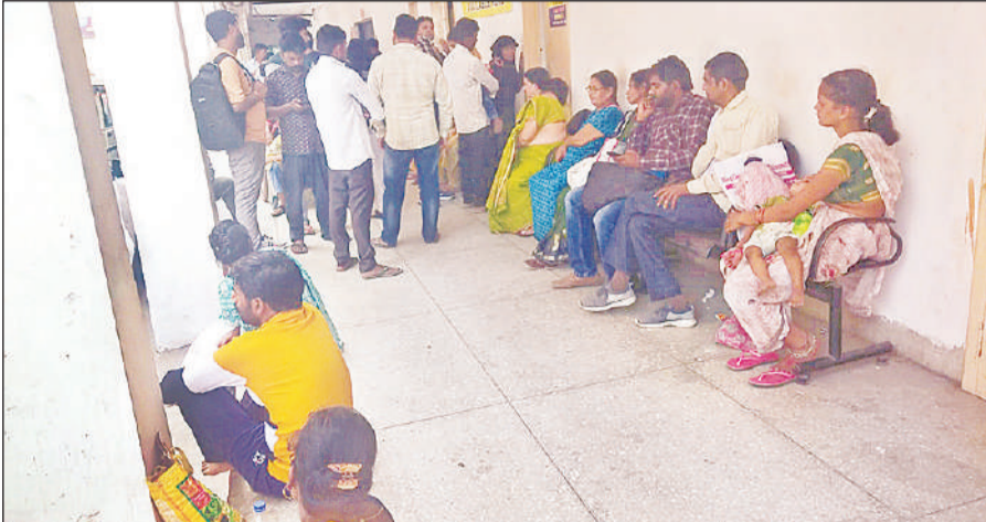
केजीएमयू के लिंब सेंटर में एक्स-रे कक्ष के बाहर बैठे मरीज व तीमारदार।