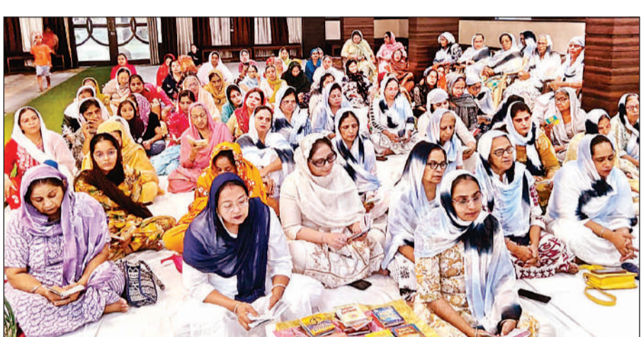
आलमबाग गुरुद्वारे में श्री सुखमनी साहिब का पाठ करती महिलाएं।

अवसर प्रदान किया जाएगा। बैठक में मुख्य विकास अधिकारी, मुख्य चिकित्साधिकारी, अपर जिलाधिकारी (वित्त एवं राजस्व) व जिला जनगणना अधिकारी, उप निदेशक जनगणना निदेशालय, जिला विकास अधिकारी, एनडीआरएफ, एसडीआरएफ, पुलिस विभाग, केंद्रीय सुरक्षा बल सहित समस्त विभागों के अधिकारी शामिल हुए।