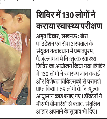
शिविर में 130 लोगों ने कराया स्वास्थ्य परीक्षण