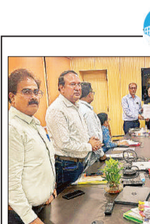
अपर मुख्य सचिव के साथ प्रतिनिधिमंडल।