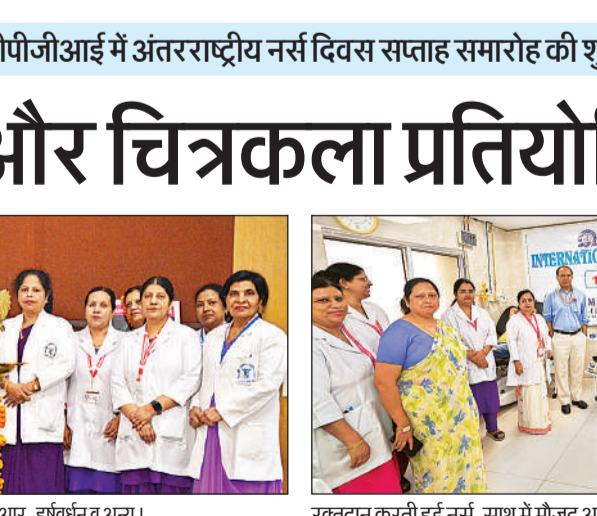
रक्तदान करती हुई नर्स, साथ में मौजूद अन्य स्टाफ।