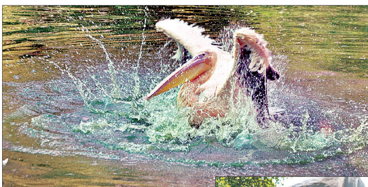
बुधवार को गर्मी बढ़ने पर गोमती नदी में नहाती बतख और गमछ ओढ़कर जाते बच्चे।