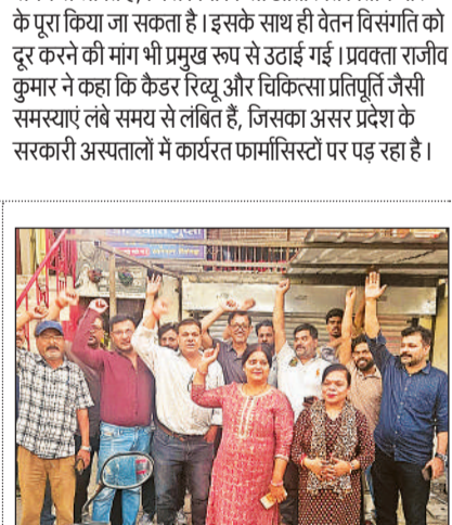
वाइन शॉप के विरोध में प्रदर्शन करते व्यापारी व अन्य।