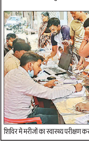
शिविर में मरीजों का स्वास्थ्य परीक्षण करते स्वास्थ्य कर्मी।