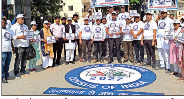
एनआईआर में जागरूकता अभियान चलाया।