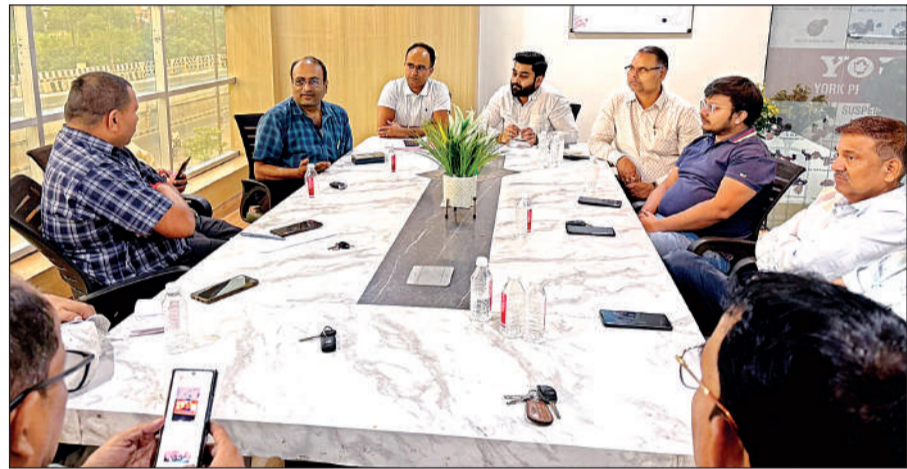
फीटा इस्पात नगर चैटर की बैठक करते सदस्य।