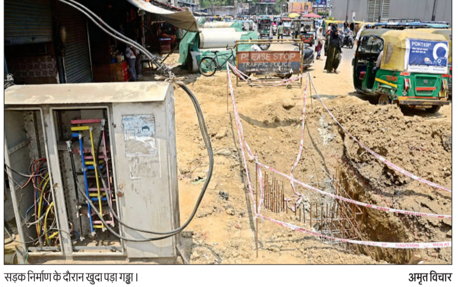
सड़क निर्माण के दौरान खुदा पड़ा गड़्डा।