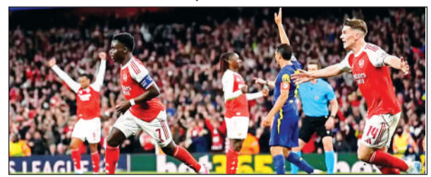
मैच जीतने के बाद जश्न मनाते आर्सेनल के खिलाड़ी।

बुकायो साका के पहले हॉफ के आखिर में किए गए गोल की मदद से आर्सेनल ने मंगलवार को एटलेटिको मैड्रिड को सेमीफाइनल के दूसरे चरण में 1-0 से हराकर 20 साल में पहली बार चैंपियंस लीग फुटबाल टूर्नामेंट के फाइनल में जगह बनाई। खेल के 45वें मिनट में लिण्डो ट्रोसाईट के शॉट को जान ओब्ल्याक ने बचा लिया, जिसके बाद साका ने रिबाउंड पर गोल दागकर आर्सेनल को सेमीफाइनल में कुल मिलाकर 2-1 की बढ़त दिला दी। सेमीफाइनल का पहला चरण 1-1 से बराबर रहा था। बढ़त हासिल करने के बाद आर्सेनल की रक्षापंक्ति ने उसे बरकरार रखने में अहम भूमिका निभाई। आर्सेनल ने अब