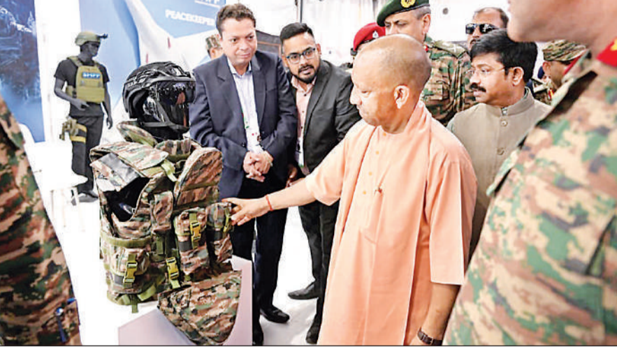
प्रदर्शनी के दौरान विकसित सैन्य उपकरणों का अवलोकन करते मुख्यमंत्री योगी आदित्यनाथ।

उपकरणों, सुरक्षा प्रणालियों और एआई आधारित समाधानों का व्यापक प्रदर्शन किया गया। मुख्यमंत्री ने बुलेटप्रूफ जैकेट, अत्याधुनिक हेलमेट, टैक्टिकल गियर और मल्टी-टेरेन ऑपरेशन के लिए विकसित सैन्य उपकरणों का बारीकी से निरीक्षण किया। उन्होंने विशेषज्ञों से तकनीकी खूबियों और सैन्य उपयोगिता की जानकारी ली। 'हेड-टू-बूट' सुरक्षा प्रणाली, अत्यधिक तापमान में उपयोगी सैन्य परिधान और माइंड्रूलर प्रोटेक्शन सिस्टम प्रदर्शनी के प्रमुख आकर्षण रहे।