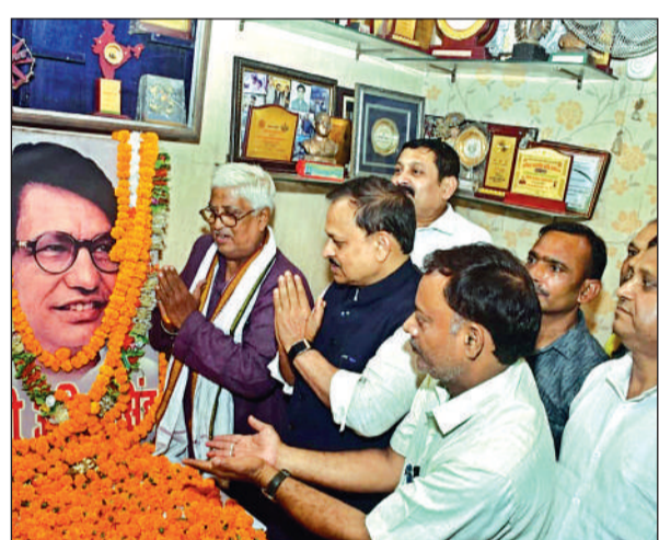
चौधरी अजीत सिंह को श्रद्धांजलि दी गई।