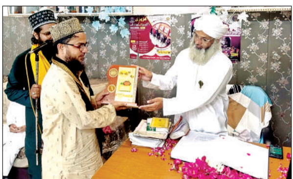
रजबी रोड पर खत्म बुखारी शरीफ का आयोजन किया गया।