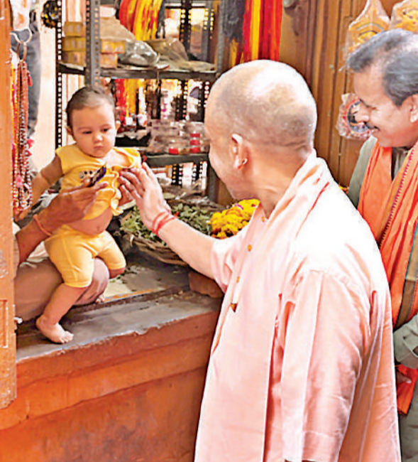
वाराणसी दौरे के दौरान एक बच्चे को दुलारते मुख्यमंत्री योगी।

बाबा विश्वनाथ और काल भैरव के मुख्यमंत्री योगी ने किए दर्शन: अमृत विचार, लखनऊ/वाराणसी: मुख्यमंत्री योगी आदित्यनाथ बुधवार को वाराणसी पहुंचे और श्री काशी विश्वनाथ धाम व काल भैरव मंदिर में विधि-विधान से पूजन-अर्चना किया। उन्होंने प्रदेश की सुख-समृद्धि और लोकमंगल की कामना की। सबसे पहले उन्होंने काल भैरव मंदिर में दर्शन कर शांति और सुरक्षा की प्रार्थना की। काशी विश्वनाथ धाम में पूजा-अर्चना के दौरान 'हर-हर महादेव' के जयकारे गूंज उठे। मुख्यमंत्री ने श्रद्धालुओं का अभिवादन किया और बच्चों को दुलारते हुए उनसे संवाद भी किया।