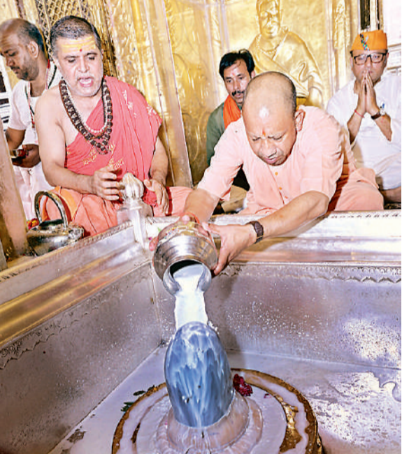
वाराणसी के श्रीकाशी विश्वनाथ धाम में पूजन-अर्चन करते मुख्यमंत्री योगी।

आयोजित कार्यक्रम में मुख्यमंत्री लोगों के बीच स्वयं पहुंचे और उनके प्रार्थना पत्रों का अवलोकन कर संबंधित अधिकारियों को आवश्यक निर्देश दिए। जनता दर्शन में बड़ी संख्या में ऐसे लोग भी पहुंचे, जिन्होंने गंभीर बीमारियों के इलाज के लिए आर्थिक सहायता की गुहार लगाई। मुख्यमंत्री ने उनसे आयुष्मान कार्ड के बारे में जानकारी ली और अधिकारियों को निर्देश दिया कि हर पात्र व्यक्ति को योजना से जोड़ा जाए। उन्होंने भरोसा दिलाया कि