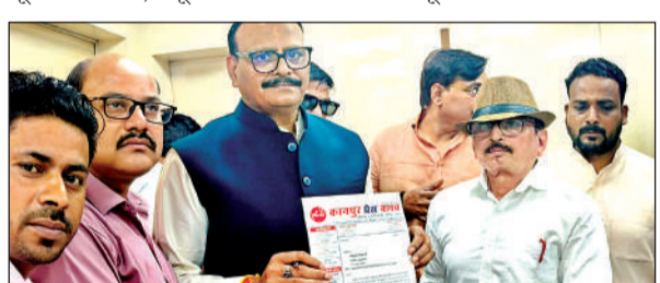
डिप्टी सीएम को ज्ञापन देते प्रेस क्लब के सदस्य।