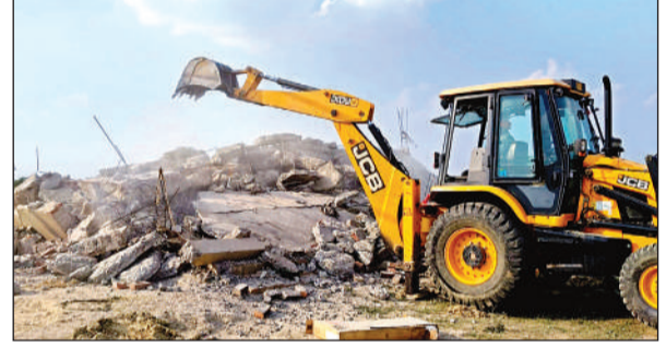
जेसीबी से मकान ध्वस्त किया गया।