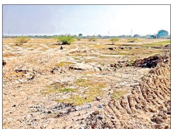
इसी जमीन पर बनेगा क्लस्टर।

अमृत विचार। रमईपुर में मेगा लेदर क्लस्टर की स्थापना के लिए कानपुर मेगा लेदर क्लस्टर डेवलपमेंट यूपी लिमिटेड ने शासन को प्रस्ताव भेज दिया है। साथ ही भूमि भी क्रय कर ली है। जल्द ही भूमि की प्रशासन से अदला- बदली की जाएगी और प्रोजेक्ट की फाइल मंजूरी के लिए केंद्रीय वाणिज्य मंत्रालय को भेज दी जाएगी। करीब साढ़े चार सौ करोड़ रुपये का अनुदान मिलेगा। इसमें केंद्र और राज्य सरकार दोनों की हिस्सेदारी होगी।