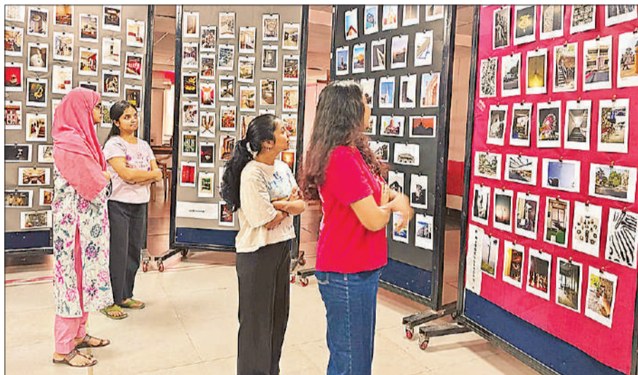
प्रदर्शनी में चित्र देखती युवतियां।