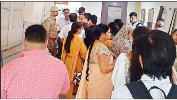
जनगणना ड्यूटी से नाम कटवाने के लिए कलेक्ट्रेट में खड़े कर्मचारी।