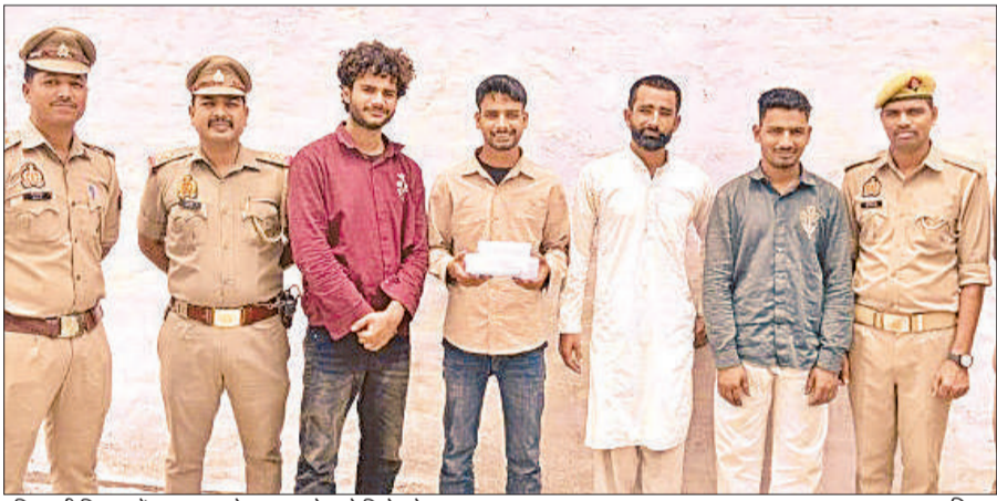
पुलिस की गिरफ्त में सहारनपुर के लूट करने वाले गिरोह के सदस्य।