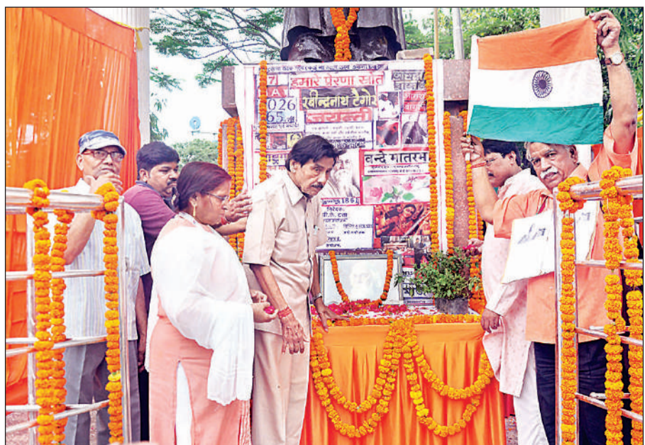
गुरुदेव रवीन्द्रनाथ टाकुर को पुष्पांजलि अर्पित करते लखनऊ बंगीय नागरिक समाज के लोग।