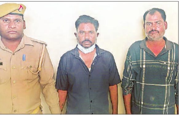
पुलिस की गिरफ्त में हत्या के आरोपी।

था। देर रात तक घर नहीं वापस आया। परिवजन ने उसकी तलाश शुरू की। पांच मई की सुबह