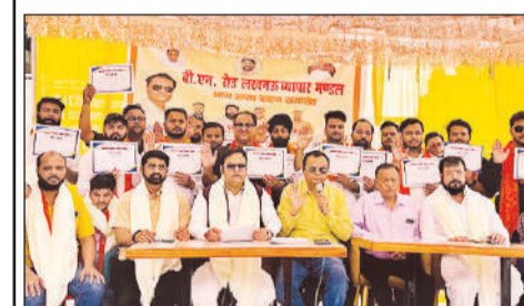
शायद ग्रहण समारोह में मौजूद नवनिर्वाचित इकाई व अन्य।