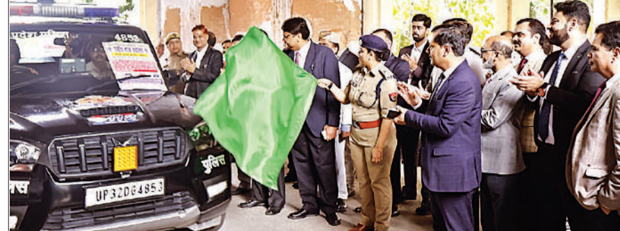
जागरूकता वाहन को हरी झंडी दिखाकर रवाना करते अधिकारी।