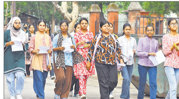
परीक्षा देकर आती छात्राएं।