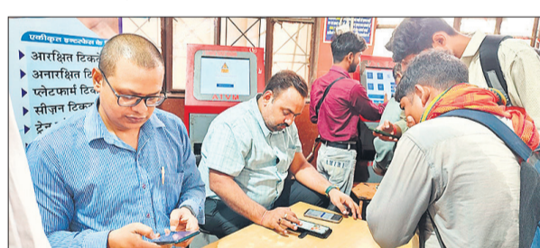
जंक्शन पर यात्रियों के मोबाइल में एप डाउनलोड करते रेलकर्मी।

अमृत विचार : सामान्य श्रेणी का टिकट लेने के लिए घंटों लाइन में लगने वाले यात्रियों को अब लाइन में नहीं लगना होगा। इसके लिए रेलवे प्रशासन ने गुरुवार को जंक्शन पर स्टॉल लगा कर तीन हजार यात्रियों के मोबाइल फोन में रेल वन एप डाउनलोड किया। इसके जरिए यात्री मोबाइल फोन में ही सामान्य टिकट बुक कर सकते हैं।