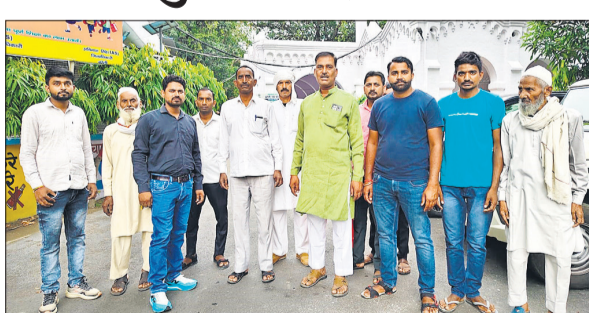
डीएम को ज्ञापन देने पहुंचे ग्रामीण।

अमृत विचार: भोजीपुरा के ग्राम परसुनगला में प्रस्तावित राइस मिल को लेकर ग्रामीणों में भारी आक्रोश देखने को मिल रहा है। ग्रामीणों ने जिलाधिकारी को प्रार्थना पत्र दिया कि ग्राम समाज के नाले को पाटकर सरकारी स्कूल, प्राइवेट स्कूल और शिव मंदिर के समीप राइस मिल का निर्माण कराया जा रहा है, जिससे गांव की व्यवस्था और बच्चों की शिक्षा पर असर पड़ सकता है। ग्रामीणों के अनुसार धौराटांडा निवासी कुछ लोगगांव के कब्रिस्तान के पास नाले को मिट्टी डालकर पाट रहे हैं और वहीं राइस मिल की बुनियाद खोदी जा रही है। ग्रामवासियों ने आबादी और स्कूल के पास राइस मिल निर्माण का विरोध किया तो वे लोग झगड़े पर आमादा हो गए। ग्रामीणों ने बताया