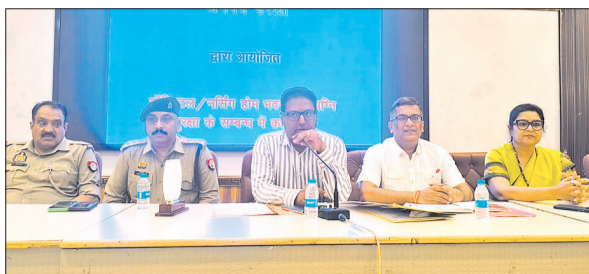
फायर सेफ्टी वर्कशॉप में डॉक्टर व अग्निशमन अधिकारी।