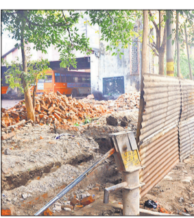
टूटी पड़ी रोडवेज वर्कशॉप की दीवार।