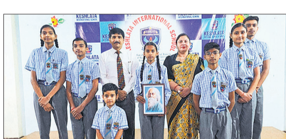
कार्यक्रम में मौजूद बच्चे व अध्यापक।