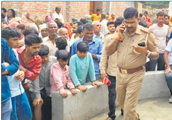
भुता क्षेत्र के अदीनापुर गांव में बच्चे के कुएं में गिरने की सूचना पर पहुंची पुलिस।