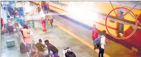
जीआरपी का दावा है कि फुटेज में मौलाना दोनों हाथ से बोगी का गेट पकड़े दिखे।