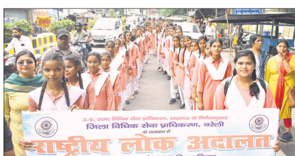
रैली में शामिल छात्राएं।