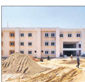
मुख्यमंत्री माॅडल कंपोजिट विद्यालय।

अमृत विचार: करीब 20 करोड़ रुपये की लागत से बन रहा मुख्यमंत्री माॅडल कंपोजिट विद्यालय 15 जून तक तैयार हो जाएगा। विद्यालय में प्री-नर्सरी से लेकर इंटरमीडिएट तक के छात्र-छात्राओं को आधुनिक सुविधाओं के बीच गुणवत्तापूर्ण शिक्षा उपलब्ध कराई जाएगी।